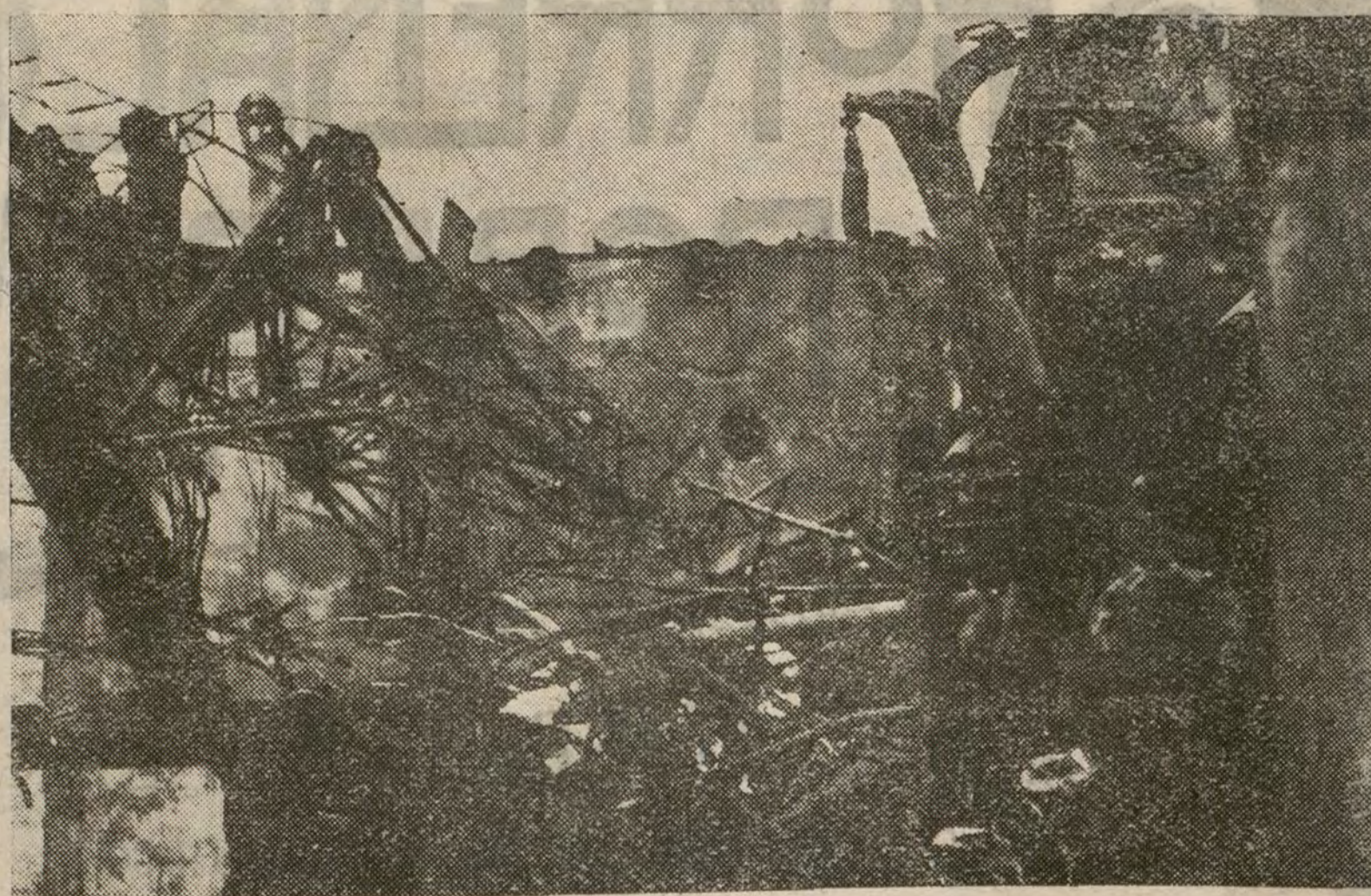
Estado en que quedó la bohardilla, al ser perforado el tejado de la casa número 31 de la calle de Claudio Coello, por efecto del tremendo golpe al caer el aeroplano, en cuyo suceso perecieron tres señoras y el observador del aeroplano.

El Arzobispo de Santiago, padre Zacarías Martínez, se ha agravado en su enfermedad.