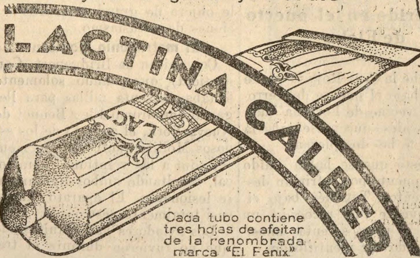
Cada tubo contiene tres hojas de afeitar de la renombrada marca «El Fénix»

extendida con dos dedos por la barba, el afeitado resulta comodo sencillo, suave y deja la piel tersa y libre de granos y escocidos