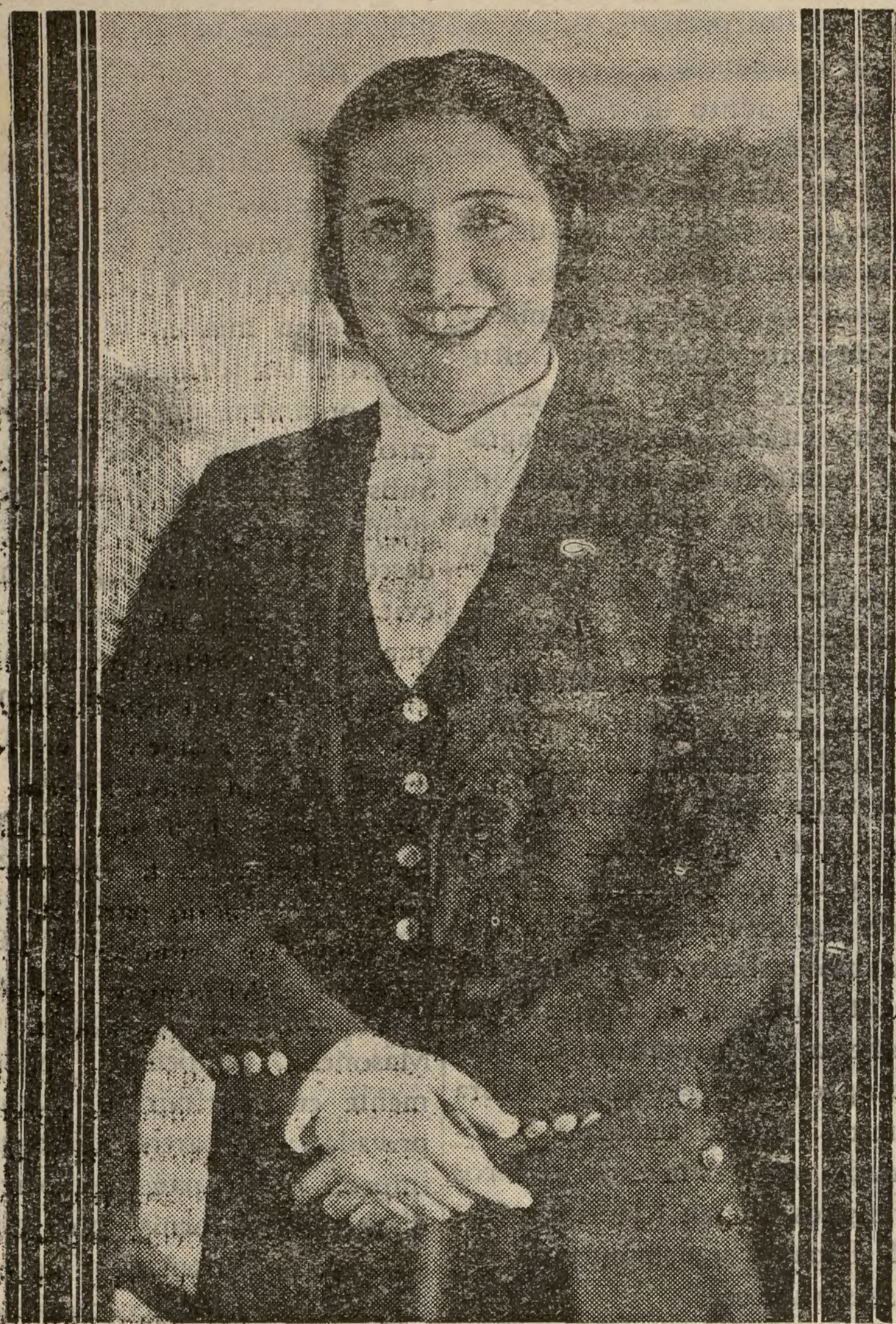
La ilustre actriz Carmen Díaz, que tan justos triunfos alcanza en Fontalba

COMICO Tarde y noche obtiene un éxito rotundo con "Cinco Lobitos". Mande reservar sus localidades. Teléfono 10.525.