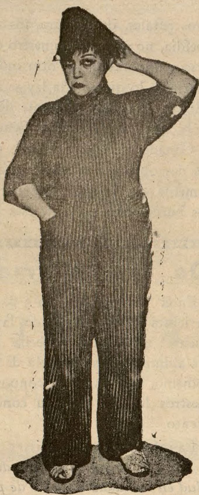
La eminente actriz Lupe Rivas Cacho, que debutó anoche con su compañía en el Astoria.