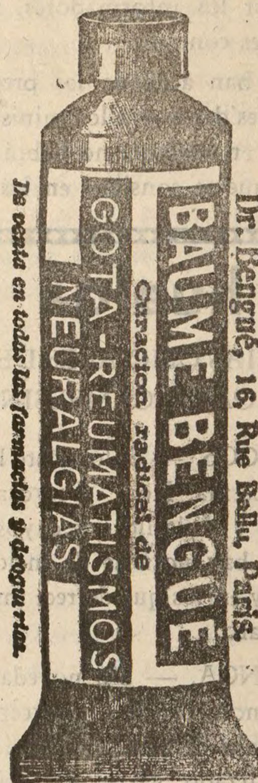
Dr. Bengue, 16, Rue Ballu, París.