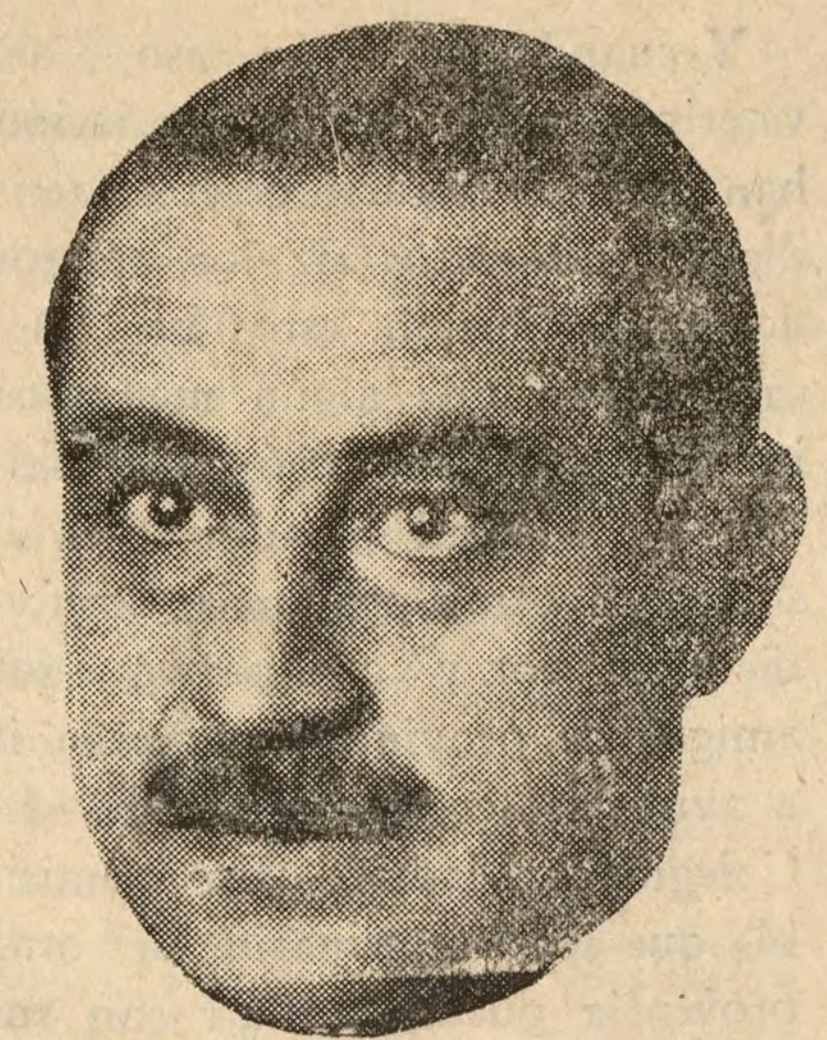
D. Miguel Maura, el jefe republicano conservador