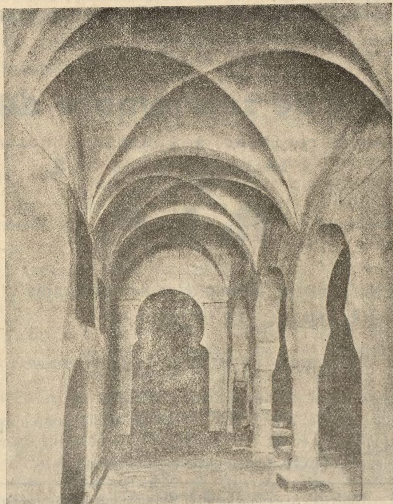
LOGROÑO.—San Millán de la Cogolla.