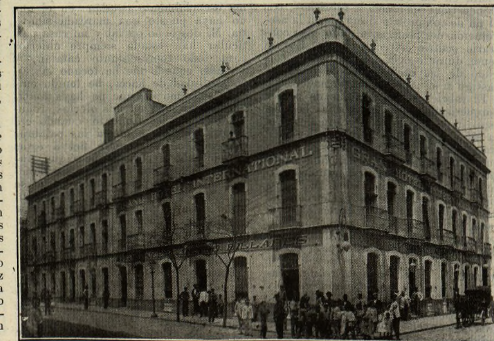
GRAN HOTEL INTERNACIONAL