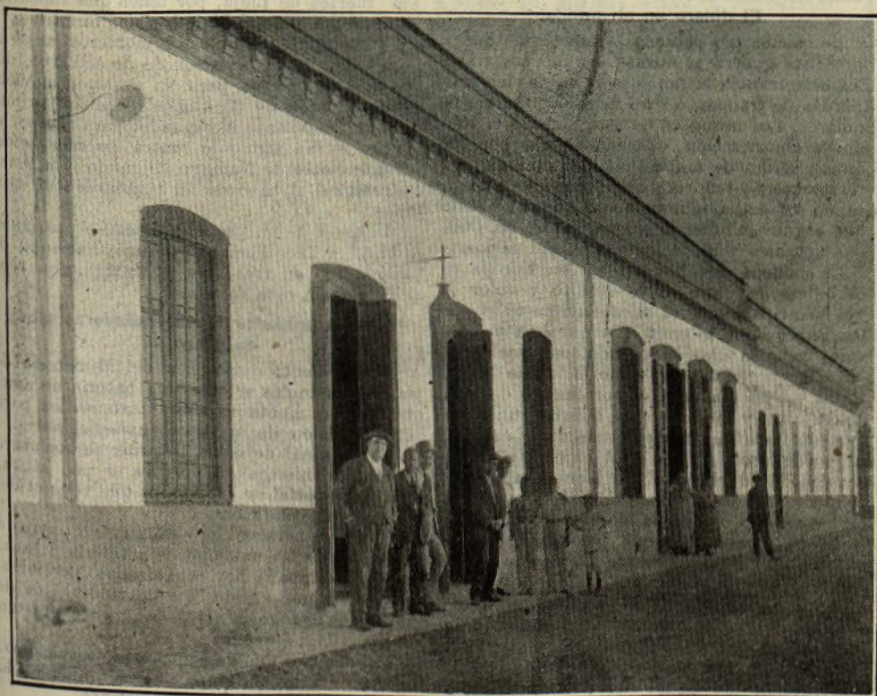
GRAN SALON DE LA CONCHA