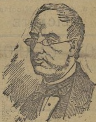
D. Juan Eugenio Hartzenbusch