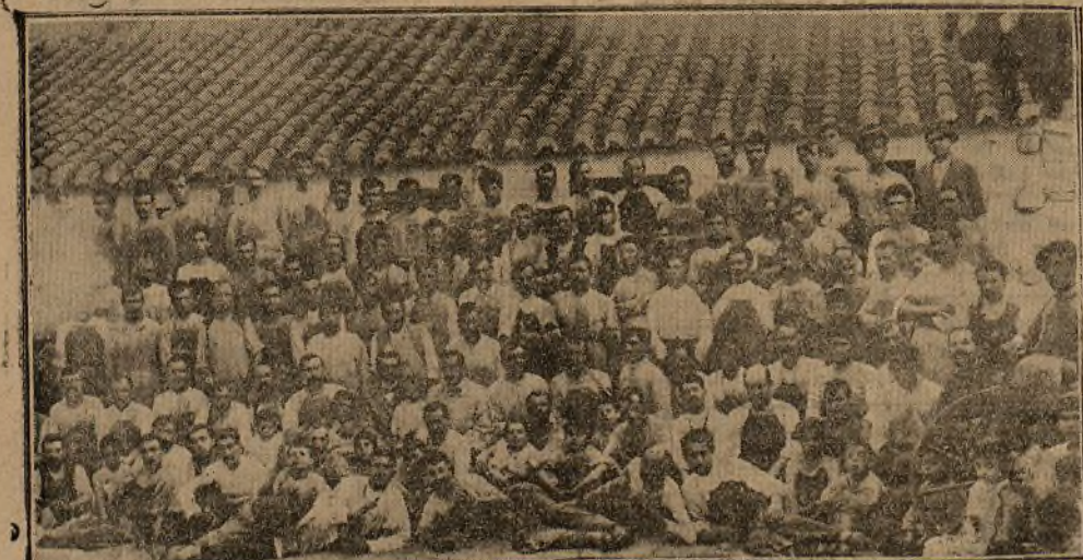
Personal de la Fábrica de calzado de Moral y Benedito.—Málaga.

La industria malagueña es importantísima, a pesar de la crisis actual, que a todos nos atañe; mas como quiera que sería una labor impropia el mencionarla toda, daré cuenta únicamente de aquella que tiene vida propia y próspera.