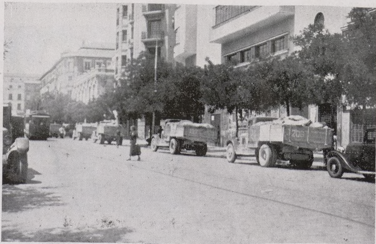
Diariamente llegan a la capital de la República, largas caravanas de camiones con víveres para Madrid y sus frentes de guerra.

El acto ha resultado brillante y esplendoroso como merecen los camaradas que están dando su vida en el frente por la causa.