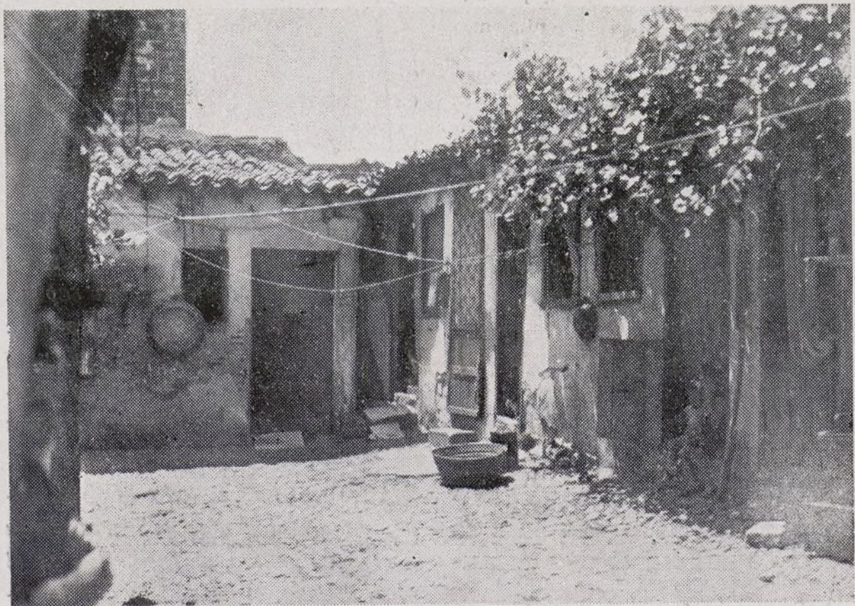
...más que casas, son cuevas de Las Hurdes, extintores de seres en vida.

A pesar de las muchas dificultades que nuestros camaradas tienen para poder asistir a las reuniones, fueron más de quinientos compañeros del Transporte los que aprobaron de una forma unánime la política de nuestro Comité Central y el apoyo al Gobierno del Frente Popular que, con paso firme y seguro, nos conduce a la victoria.