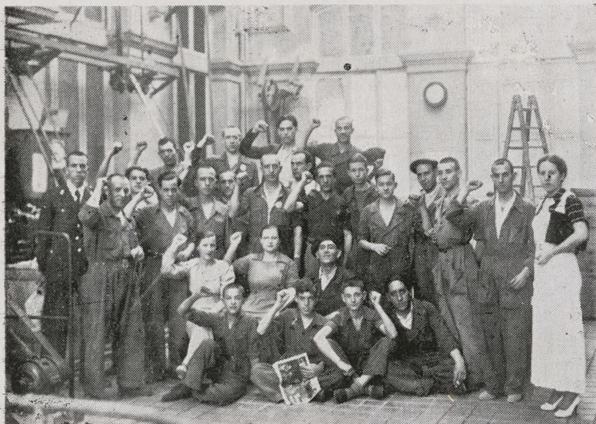
Algunos camaradas de la C. de E. de los talleres "Ericson", posan ante la cámara de nuestro fotógrafo.

incansablemente, habiendo un número considerable de mujeres que, al igual que sus compañeros de trabajo, realizan un esfuerzo no menor al de los hombres, ya que todos han comprendido que sin este sacrificio no sería posible cubrir las necesidades que la guerra plantea a todo antifascista honrado y consciente de su deber; ellos mismos nos dicen que al hacerlo así no hacen más que seguir el ejemplo de nuestros compañeros de las trincheras que, sin descanso alguno, defienden con las armas en la mano la misma causa. Con estas manifestaciones hechas por ellos al principio de nuestra información, nos demuestran cuál es el concepto que tienen de nuestra lucha.