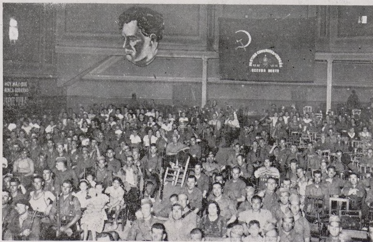
Un aspecto del salón durante el festival. (Fotos Luzalmar).

Sigue diciendo que ahora aman al Ejército porque está compuesto por hijos honrados del pueblo, y que si antes le odiaban era porque estaba lleno de señoritos traidores. Que en la retaguardia, un enemigo, disfrazado con la careta antifascista, hace traición; pero que el Partido Comunista, (Termina en la página 4)