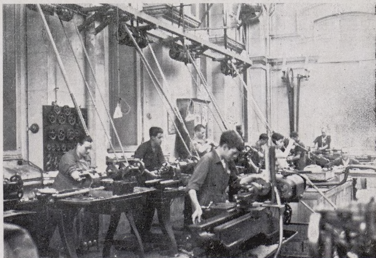
Una de las secciones mecánicas en plena actividad.

Entonces, les preguntamos también, cómo ven ellos la situación política actual y fundamentalmente en el terreno de la unidad.