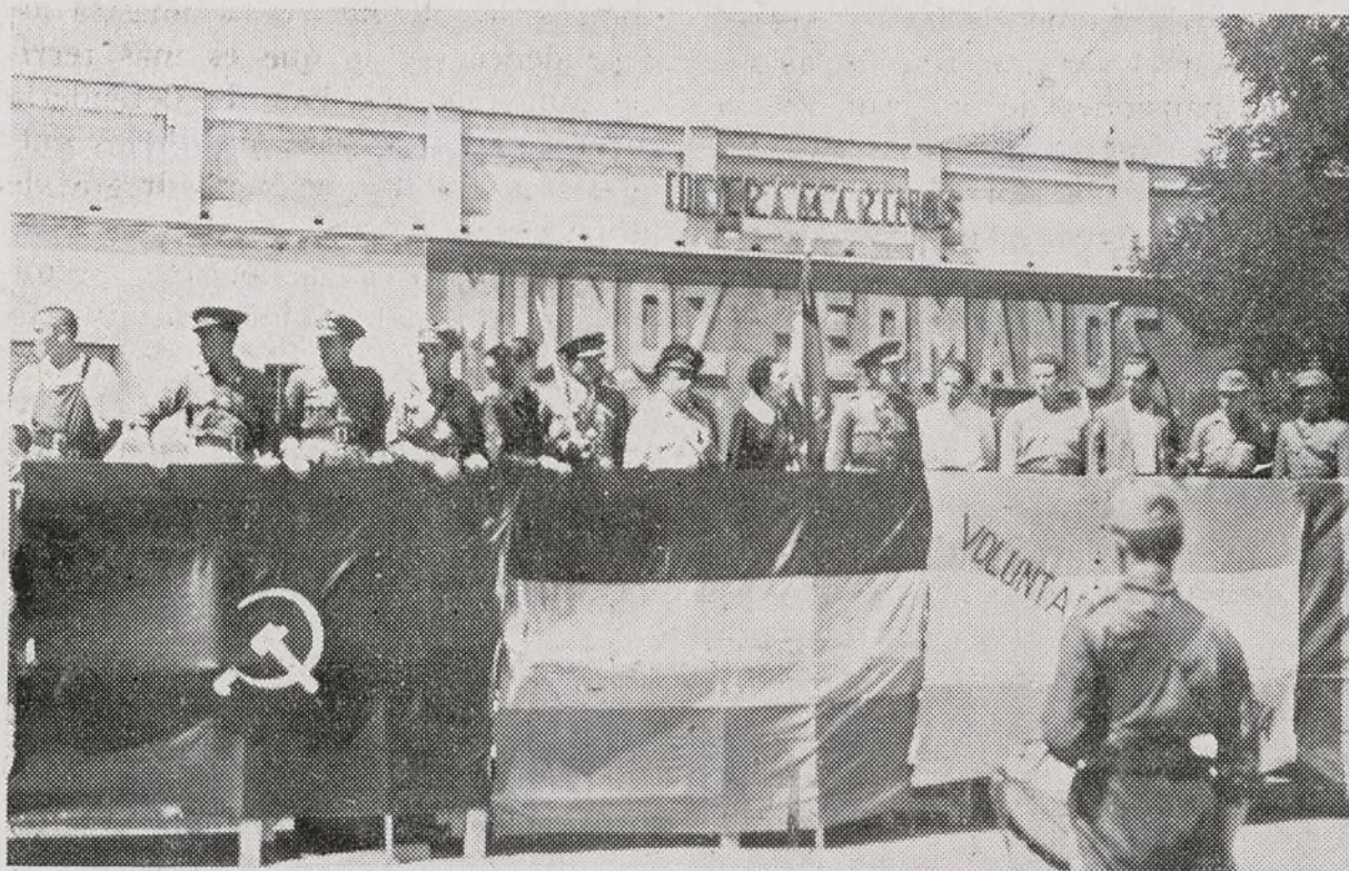
La tribuna, en el acto de la entrega de la bandera al Batallón 142 de la 36 Brigada.

El Comité Provincial del Partido Comunista ha regalado una bandera al 142 Batallón de la 36 Brigada. A esta donación han contribuido el Sector Oeste del referido Partido y el Comité Provincial de las Mujeres Antifascistas, las cuales han confeccionado la bandera susodicha.