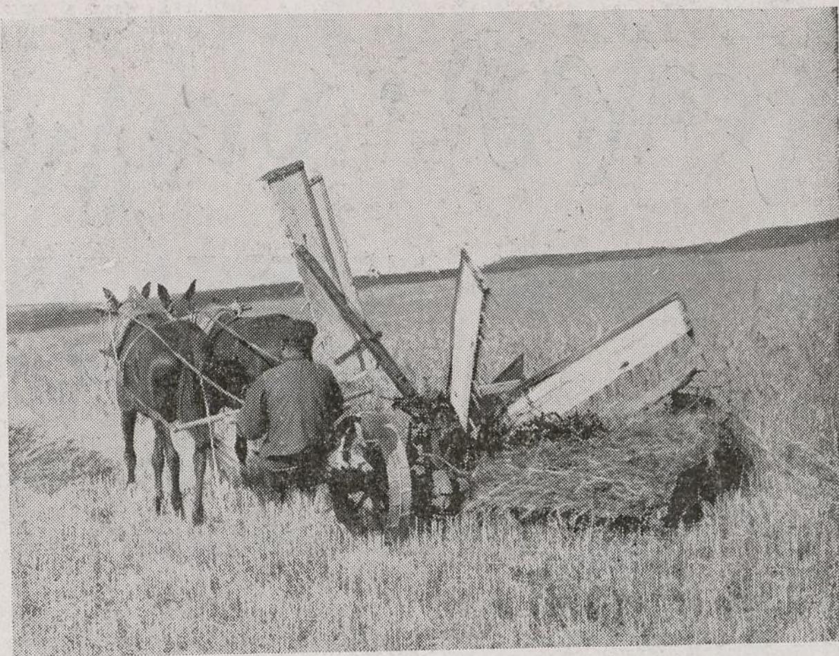
El campesino labora por la victoria contra el fascismo.

dados los procedimientos de defensa antiguas.