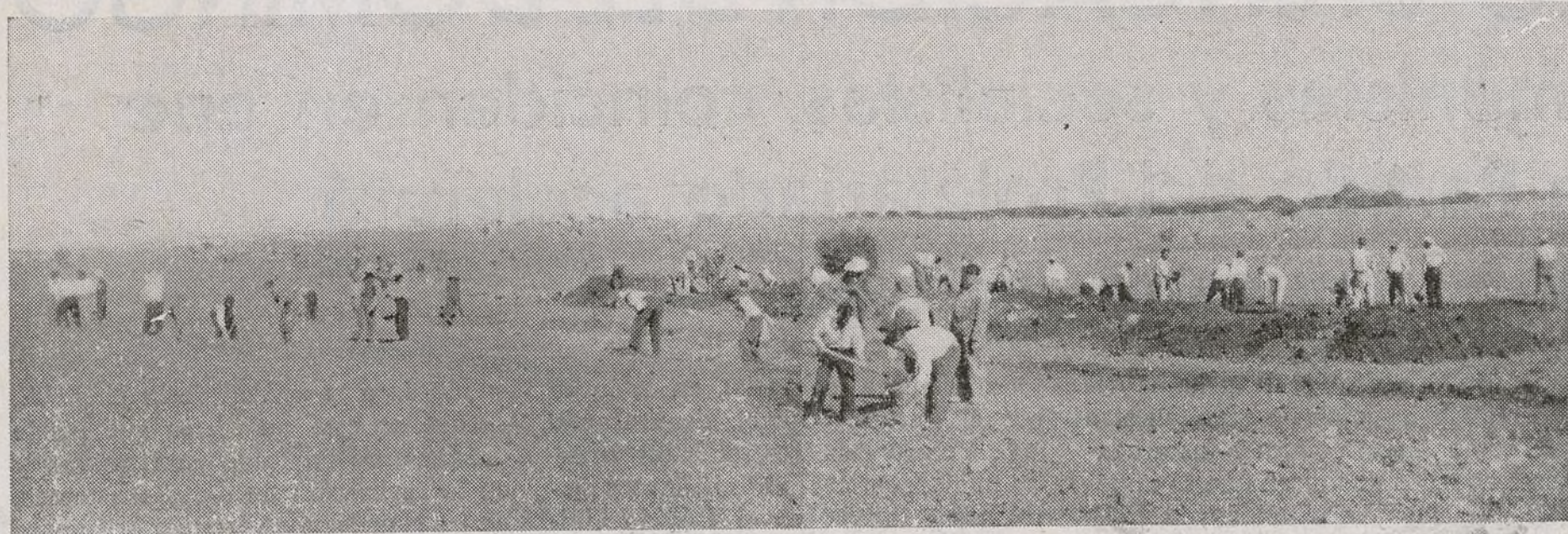
El Batallón Auxiliar de Fortificaciones, lo ha constituido la Policía con los elementos que "fueron" enemigos de la causa del pueblo.

blos atraviesan en sus luchas por la emancipación.