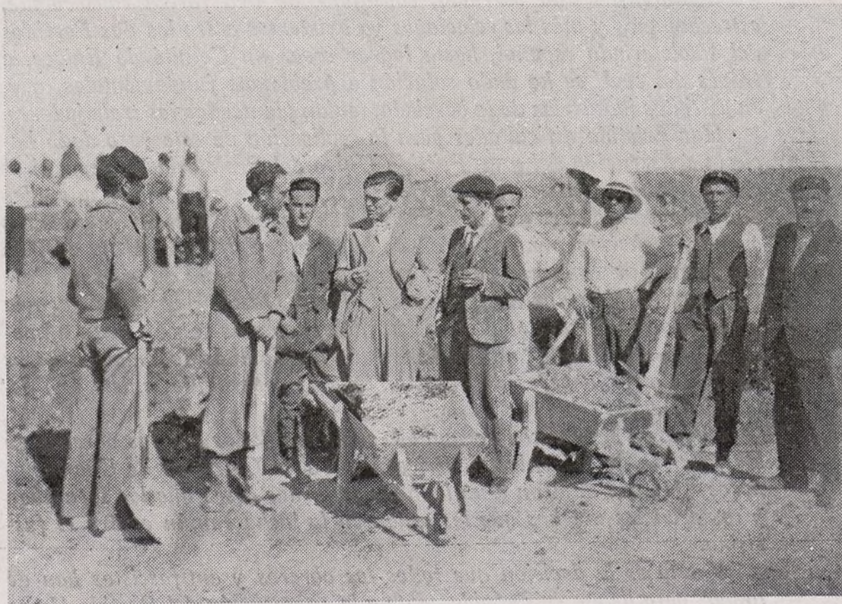
Nuestro compañero "Utica", rodeado de un grupo del B. A. F.