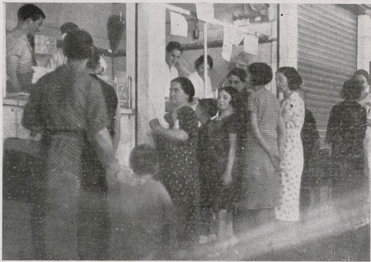
Las compañeras, de mercado en mercado, llenan la cesta de lo que pueden.

—¡Qué transportes ni qué... rábanos! Hay demasiados coches en donde no deben estar, para que se hable de esa forma con razón. Lo necesario es que de una vez acabemos de comprender que en los coches no debe mandar nadie más que el Gobierno.