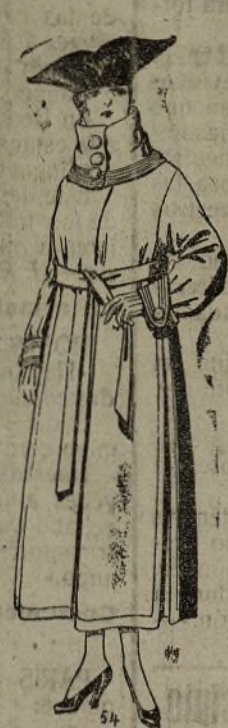
Abrigos de paño, colores azul, beige y café. De ptas. 65 a 85.