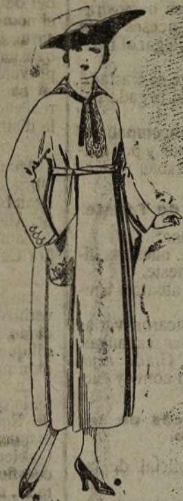
Vestidos de gabardina, estambre, etcétera, en color azul, bordado. De ptas. 35 a 60. Los mismos en punto de lana elijers, bordado. De ptas. 95 a 112.