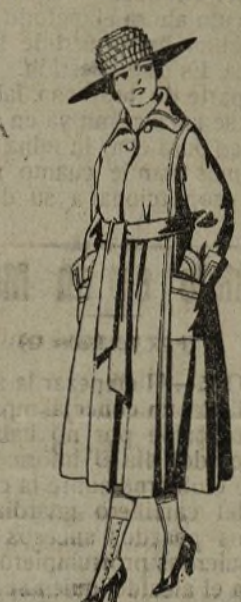
Abrigos de gamuzas, lanteola, etcétera, color, para juveniles de doce a quince años. De ptas. 40 a 48.

Peletería, Camisería, Géneros de punto, Corbatería, Guantería, Sombrerería, Zapatería, Paraguas, Bastones y Artículos de Viaje.