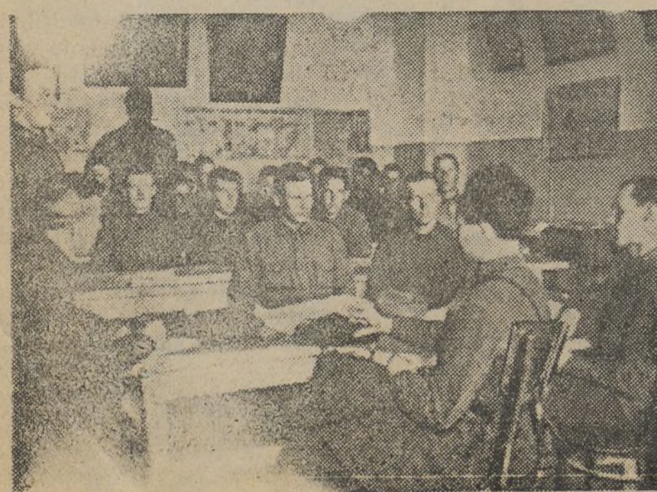
El Ejército Rojo estudia, se disciplina...

Es así cómo estaremos en condiciones de responder a las tareas que la guerra exige de nosotros.