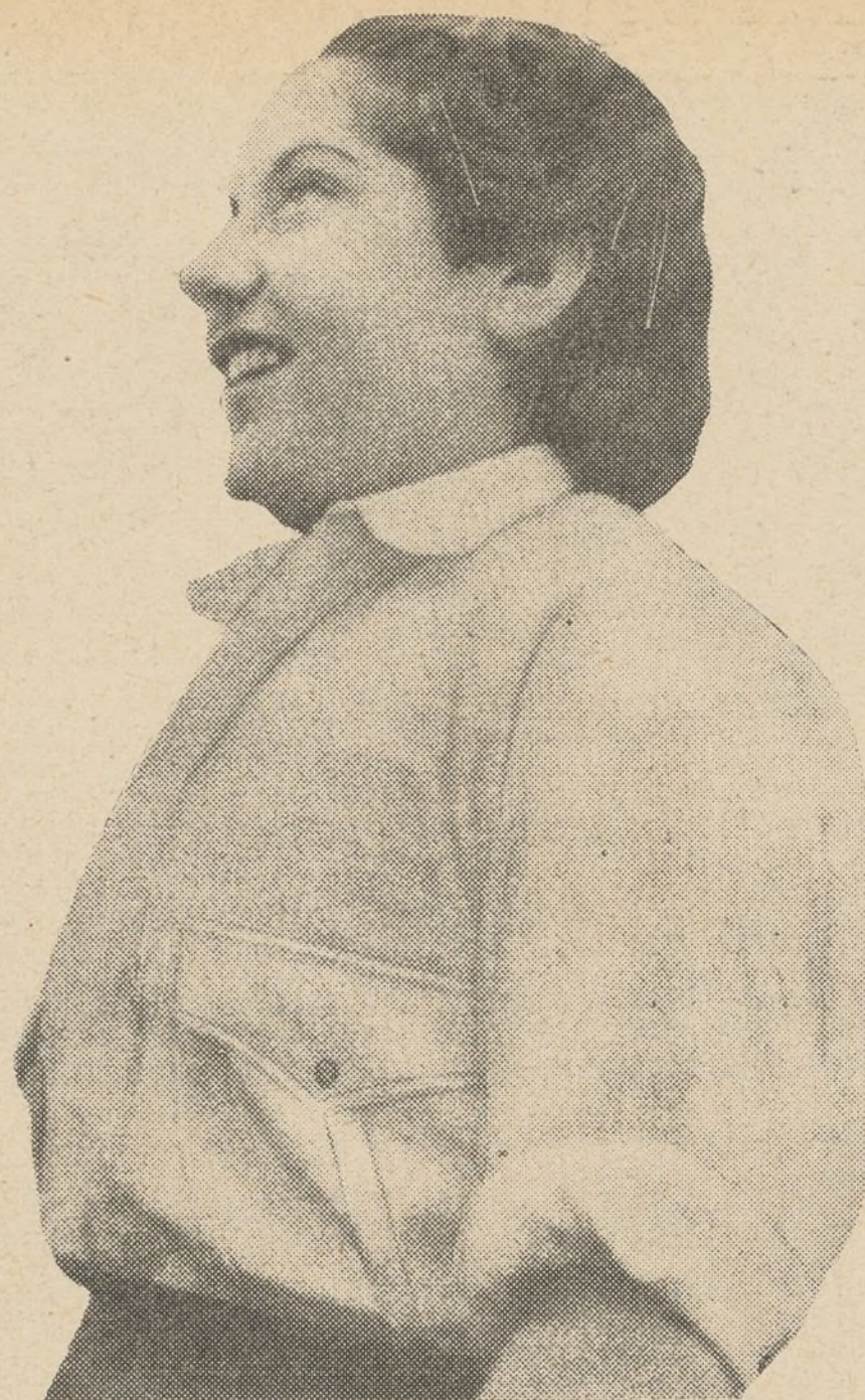
¡Queremos una juventud sana, fuerte, feliz!