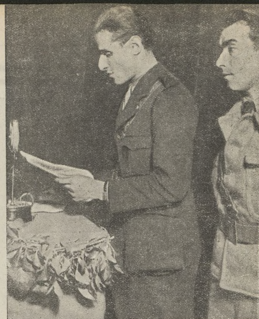
Un representante de las Brigadas Internacionales promete al Congreso luchar en nuestro gran Ejército Popular por la independencia de nuestra nación, y trabajar porque los países a que pertenecen los jóvenes de esas Brigadas sigan nuestro ejemplo de unidad

Juventudes antifascistas, y no puede ser el porque nosotros queremos plantear únicamente los problemas que interesan a la juventud. La Conferencia Nacional de Valencia dijo que quería la unidad de toda la juventud, de la J. S. U., Juventudes Libertarias, jóvenes republicanos, jóvenes sin partido, incluso jóvenes católicos. Interesa sentar — afirma — que nosotros no queremos la unión con las antiguas juventudes católicas. Pero hay una