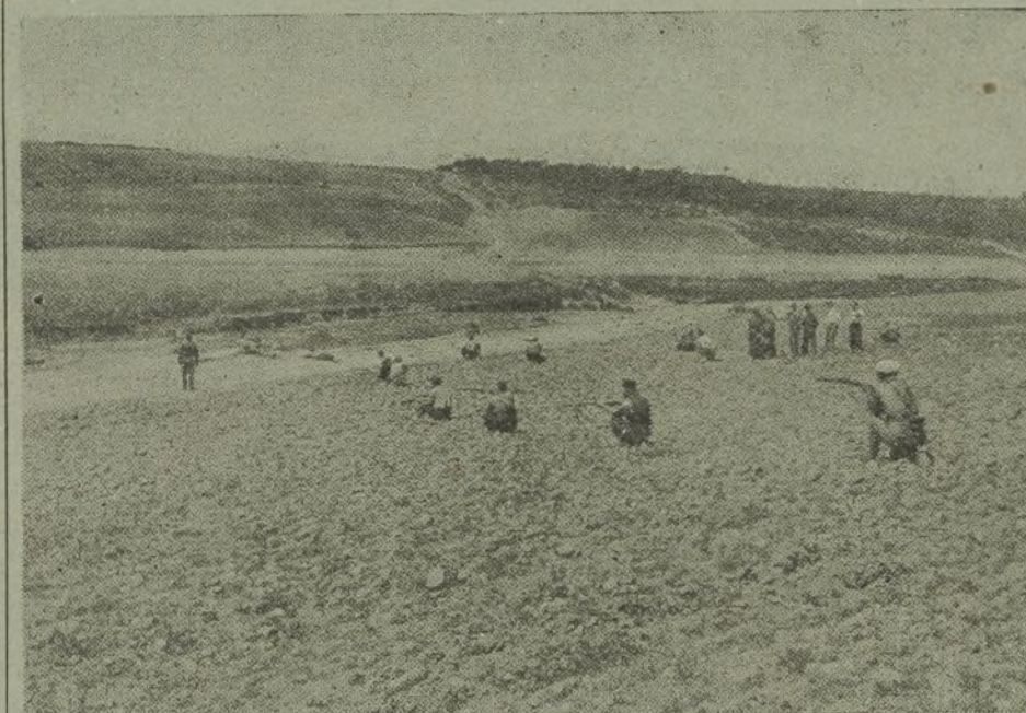
LOS ALUMNOS DE LA ESCUELA HACEN PRACTICAS

Mediodía, comida. A continuación, a pasar un rato en la sala de recreo. A escribir hasta las tres y media, que llama la corneta para las clases de cultura general. Esta clase, como en las restantes, lo que más destaca en ellas es la sencillez. Con gran acierto, los forjadores de esta Academia del pueblo han desechado el lujo y se han preocupado únicamente de que los cuadros de profesores sean competentes. Estos hombres, con cuartillas, lápices y voluntad, día a día, van puliendo a los soldados de la libertad y desterrando la ignorancia y la incultura, incubadoras de miseria.