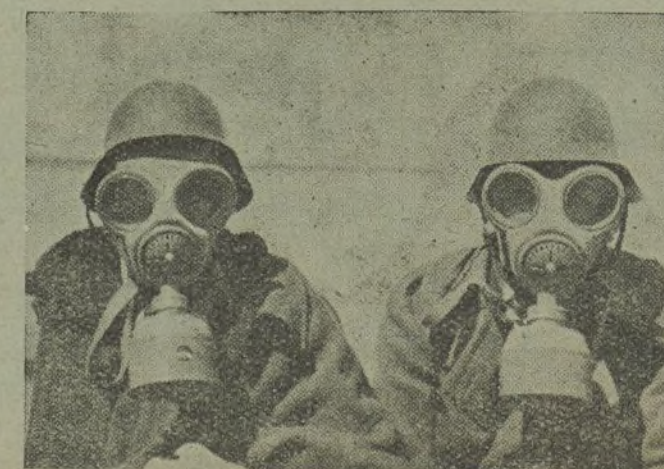
MODELO DE CARETA ANTIGAS, ULTIMO SISTEMA