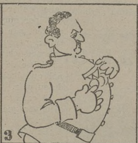
Franco, la beligerancia pide con gran petulancia.