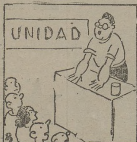
En Valencia un hecho es ya las bases de la unidad.