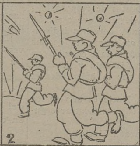
Y China, con gran paciencia, defiende su independencia.