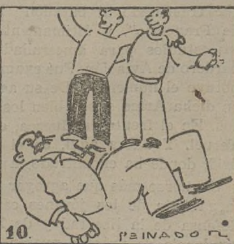
Sin duda, aquí la unidad al fascismo apañará.