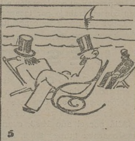
Los de la no intervención veranean con sanfascón.