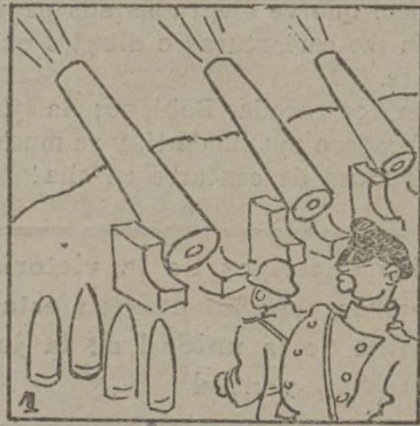
En el Japón, el fascismo continúa casi lo mismo.