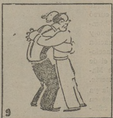
También los de la U. G. T. se unen con la C. N. T.