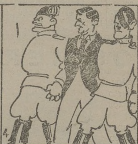
El trío de la "bencina". Su gracia al mundo ilumina.