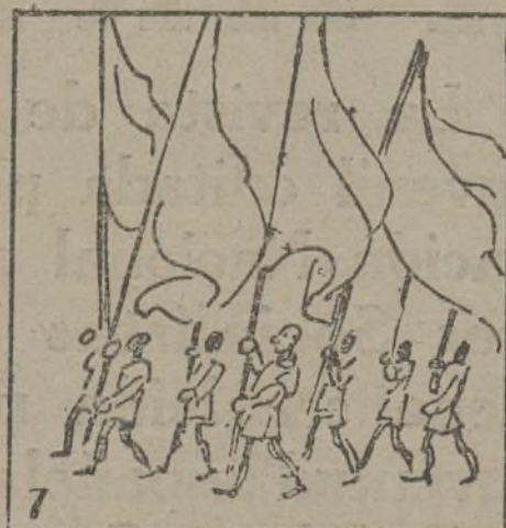
Hay una concentración, de "Alerta", demostración.