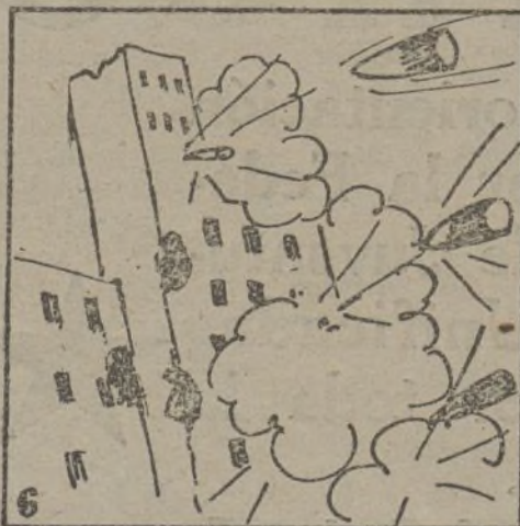
Y aquí los de la invasión obusean sin razón.