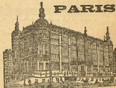
GRANDES ALMACENES DEL