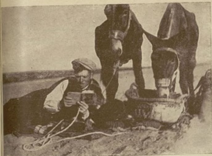
HOJA DEL CAMPE- SINO