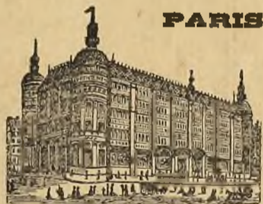
GRANDES ALMACENES DEL