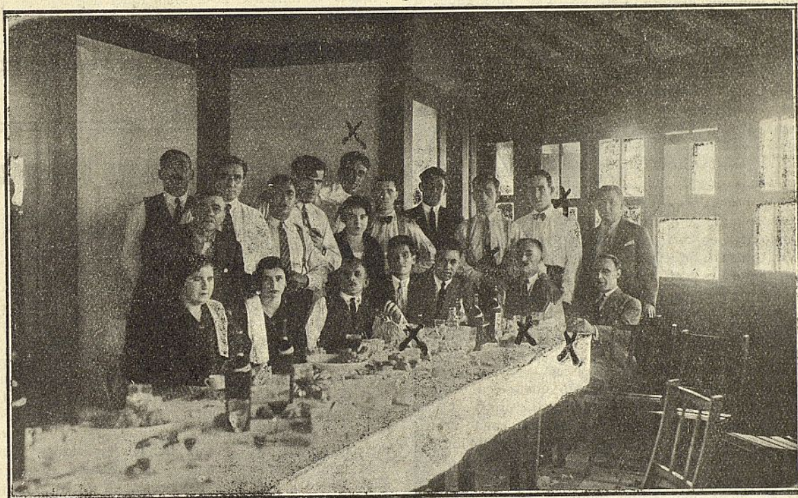
Grupo de camaradas asistentes al banquete celebrado por la Asociación de Dependientes en el Chacolí de Archanda el día 9 de agosto, para festejar el XVI aniversario de su fundación.

Finalmente, todos se felicitaron de la primera gestión que nuestros vocales se proponen realizar en