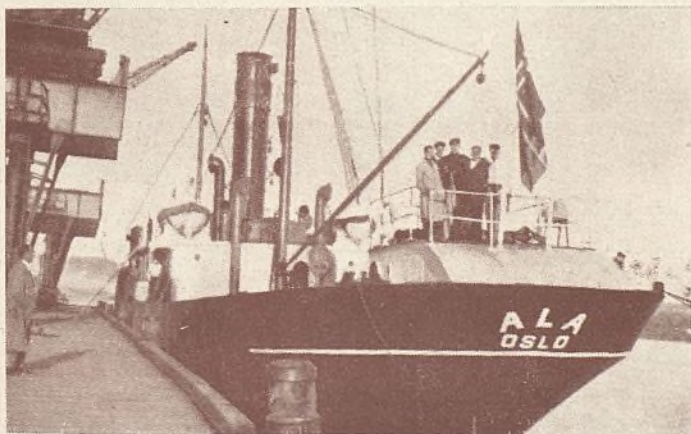
El vapor noruego «Ala» que transportó a las colonias de Laredo a Burdeos

Pero, ¿qué hacer de aquellos pequeños, que ajenos a la conjura de los hombres, se habían separado del hogar paterno para recibir las caricias del sol y del mar en las Colonias infantiles? ¿Qué angustia la de aquella madres, dirigidas a nosotros no sabemos por quien, las cuales nos pedían que trajéramos a su lado a los pequeños. ¿Traerlos?... ¿Cómo?... Santander, Asturias, Vizcaya nos parecían a nosotros estar lejos en aquellos momentos como Londres o Nueva York. Pero, había que intentarlo. En Ginebra existían organismos interna-