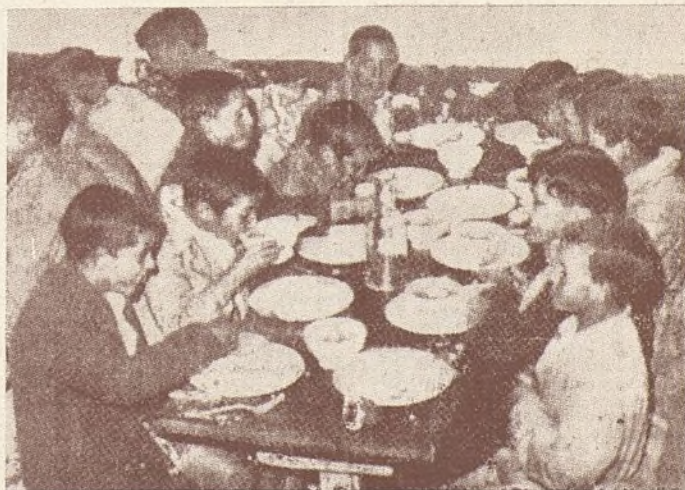
La comida a bordo

Por el Ministerio, organizaciones sindicales y Sociedades de "Amigos de la Escuela"