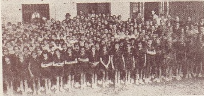
Reproducción de una foto publicada por «France», de Burdeos, a la llegada de nuestros niños a dicho punto

res de cinq cents enfants espagnols arrivent à Bordeaux