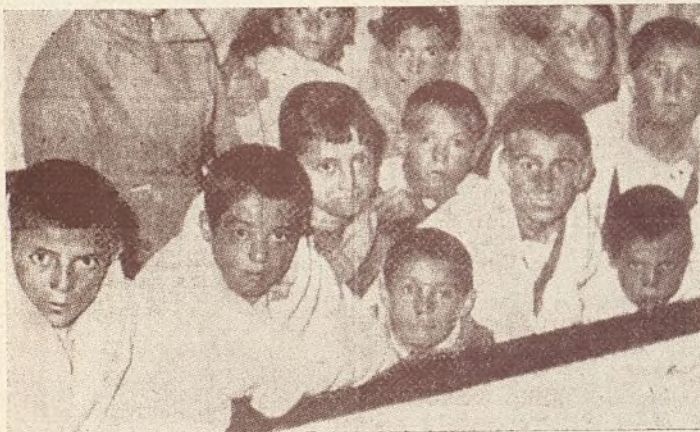
Los pequeños durante la travesía

conocimiento de todos los organismos oficiales: Instrucción Pública, Estado, Gobernación, Municipio, Cruz Roja, y en todos encontramos buena acogida, estímulo; pero el maldito dinero tan necesario, no llegaba. A pesar de todo, empezamos nuestra campaña por radio, prensa y manifiestos a todas las madres del mundo. Nos dirigimos a las Embajadas y a los organismos pro infancia. Unido a ello, la juventud de "Amigos" pidió por las calles madrileñas para tal fin y en nuestras oficinas se abrió una suscripción. Con los primeros ingresos y la ayuda del Comité Ferroviario, dimos la primera alegría a las madres. Una colonia de Levante llegó a Madrid por nuestro conducto, y también, aquel día nos vino un radio de Ginebra; se nos pedían datos relacionados con el número de niños y sitio en que se encontraban; y la palabra esperada: "AYUDAREMOS". Unión Internacional de Socorro a los niños.