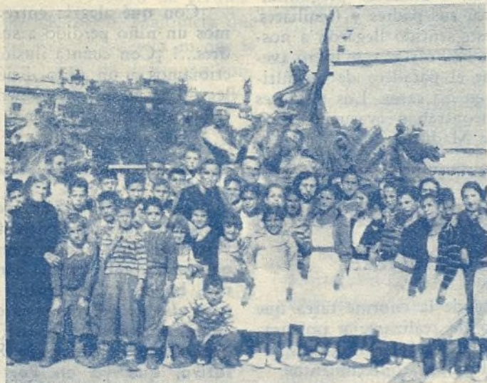
En la Feria de Burdeos

lo hiciese de día; la noche les da miedo; así lo prometo. Dadas las mismas disposiciones abandono Cóbreces, no sin antes dirigirme a visitar la fábrica de quesos y mantecas de los padres Trapenses, de los que sólo queda el maestro, enseñando a los del pueblo la fabricación de productos tan acreditados.