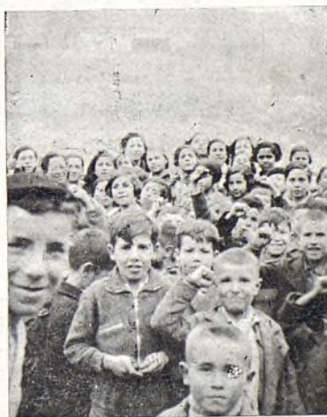
Niños en Prát de Molló (Francia).

Y ya saben los organismos oficiales que para la causa del niño siempre estamos dispuestos a acudir a donde hubiere lugar.