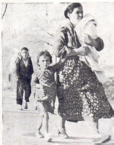
Las madres no esperan la evacuación oficial.

sus hijos tiene, a más de la razón sentimental, una disculpa harto justificada si nos paramos a analizar a fondo la cuestión. ¿Qué actos se han