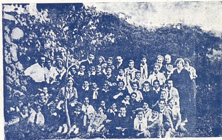
De Rusia nos llega esta fotografía de la colonia establecida en Artk (Crimea), en la carta que se nos adjunta se nos dice que los niños son colmados de atenciones y que están contentos, y otras muchas cosas. Pero como esperamos una información completa de los niños allí trasladados, nos decidimos a esperarla, y en el próximo número daremos toda clase de noticias que de allí nos lleguen.

punto III de la Tabla de los Derechos del Niño, éste ha de consistir en la medalla titulada "MADRE" y la que llevará inscrito el punto a que hemos hecho referencia; y vosotros debéis ayudarnos en este propósito, o sea, agradecerles que supieron, sacrificando amores, para ellos solo comprendidos, apartar al hijo del dolor de este año; dolor que esperamos sirva de experiencia a todos los amantes de la paz del mundo para que no pueda repetirse jamás.