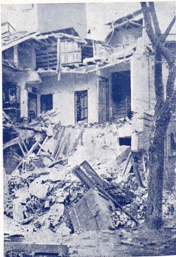
Un Centro de cultura.

Además de esta relación, quedan en el término de Carabanchel otros varios, así como también más de 500 escuelas-unitarias en viviendas particulares.