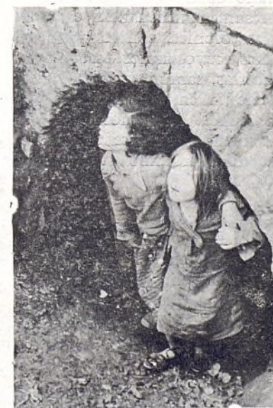
Cómo viven nuestro niños en Madrid al paso de los aviones.

Huída rápida. En la esquina sujetamos a un peque.