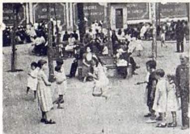
Madrid zona de guerra.

Pese a todos los esfuerzos realizados por los organismos oficiales y particulares, en Madrid