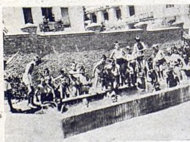
El baño en García Quejido.

1.º Barrio que fué centro de la aristocracia; en él viven hoy familias de todas clases sociales; pero parece contagiarse la gente con su pasado y los niños acusan más que nadie su influencia; aquí no hay pedreas; estos niños no están contaminados por el ambiente de guerra; juegos de infancia, trun-