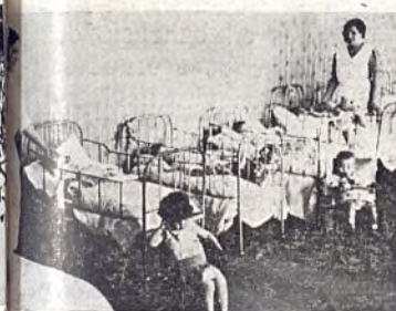
Dormitorio de la Casa-cuna.

padre que se aleja, otra corre al lado de la cunita de su hijo.