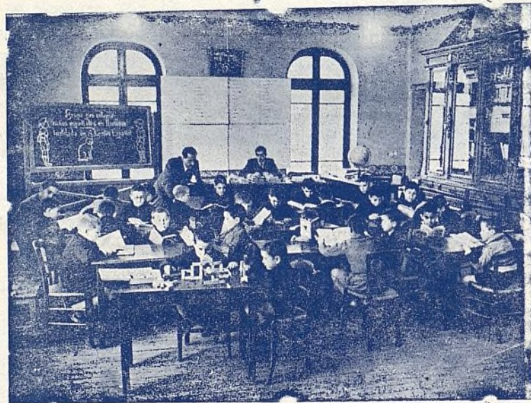
PERPIGNAN.—La sala de estudios para los niños españoles.

Son presidentes de honor León Blum, Herriot, Paul Boncour, etc. Presidentes efectivos,