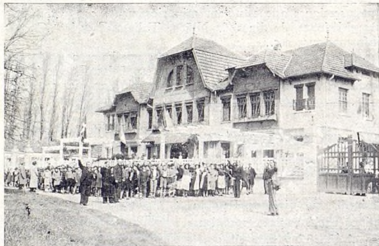
Nuestros niños en la Estación I. de Olerón (Francia), a su paso para Bélgica

servación en todo, dando cuenta diaria de su gestión al maestro director.