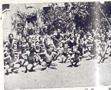
Preparando los futuros atletas.

—No. (Contesta secamente) conocido. Unos llantos de protesta ante la curiosidad del doctor que lo mira y lo remira. Una