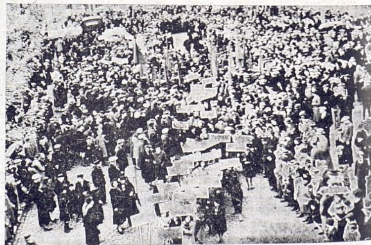
Recibimiento hecho a nuestros niños en Gante (Bélgica)

En el pueblo de Mouscrou, primero de Flandes Occidental, se les dispensó a los niños un emocionado recibimiento. Cen-