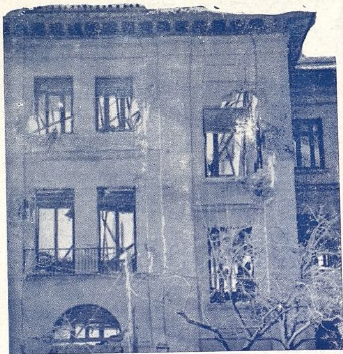
El Grupo Escolar "Pérez Galdós".