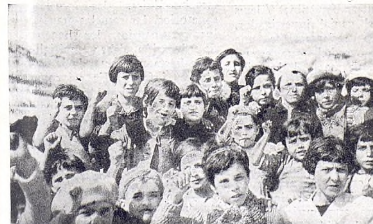
Los niños españoles en la Colonia Emile Vanderverde - Oostdunkerke

Todo padre debe suscribirse a nuestra Revista por bien de sus hijos.