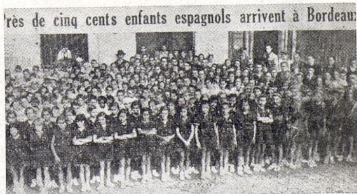
Los primeros niños españoles que pisaron Francia debido a la Unión Internacional y bajo la vigilancia de los Amigos de la Escuela.