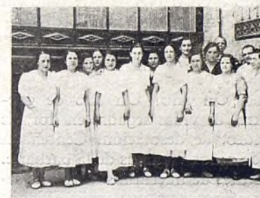
Al servicio de la infancia.

otro momento, el más doloroso. El que nosotros y otros organismos hemos tratado de evitarles con la evacuación: éste es la llegada de la aviación de los rebeldes.