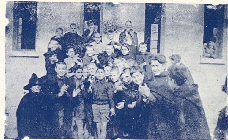
Los niños olvidan en Port Vendres la tragedia pasada.

mia las buenas obras. Un obrero que recogió un niño, fué agraciado por la suerte con el