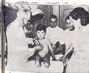
El nuevo pensionista.

4.º Una barriada madrileña la que los niños fueron siempre díscolos y traviesos. Hoy cada pequeño quiere ser un personaje