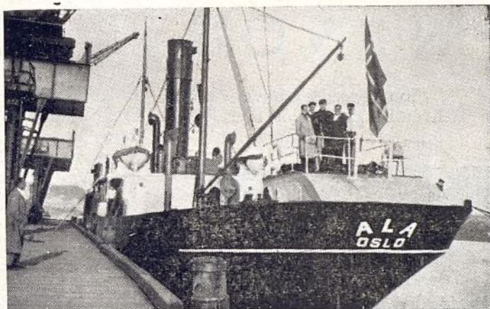
El primer barco que se puso al servicio de la evacuación de niños españoles debido a gestiones de los Amigos de la Escuela.

sus hijos tiene, a más de la razón sentimental, una disculpa harto justificada si nos paramos a analizar a fondo la cuestión. ¿Qué actos se han