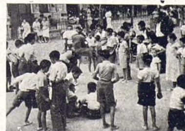
Estos niños no son los que describimos, pues la placa se rompió.

En este sentido hubiéramos podido dar una amplia información gráfica; más nos duele tocar este aspecto. Los niños debieran ser sacados todos de Madrid; ni el cariño de las madres tiene derecho a someterlos a momentos tan an-