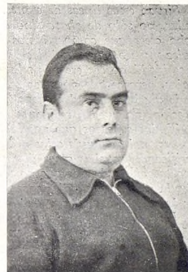
Villora, secretario general de la Federación de Sindicatos Unicos de la Enseñanza (C. N. T.)

locales de Cultura, vivero de la más vieja política aldeana. Estudiamos una fórmula de reforma tendente a que estos organismos recojan quienes sientan los problemas de la Escuela y no a elementos carentes de tal condición que van a ese organismo por el automatismo de la designación establecida en la ley. Entre los primeros deben estar los "Amigos de la Escuela."