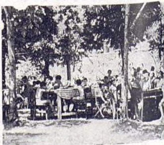
Al aire libre se come mejor.

3.º Casa-cuna. Limpieza, silencio, unas cunitas donde la infancia reposa ajena a cuanto rodea.