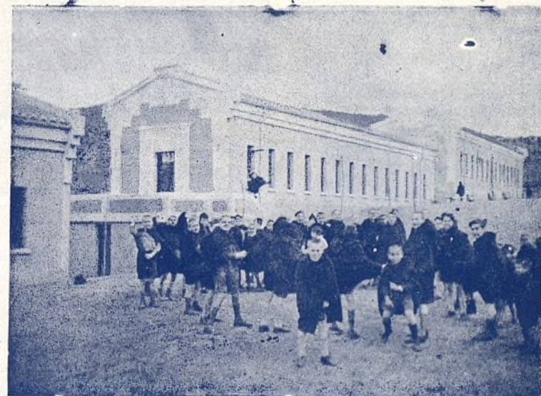
Niños españoles en el campo de Mauresque a Port Vendres.