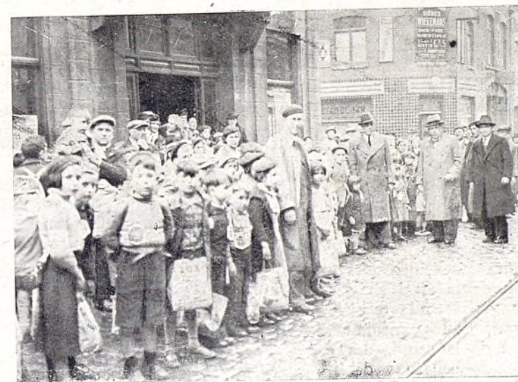
Llegada a Mouscron (Bélgica)

ca tarea larga, no queremos dejar de satisfacer la natural curiosidad de nuestros compatrio-