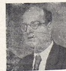
Rica, del Grupo "Tomás Meabe"

La labor realizada por nuestra Agrupación fué organizar una expedición de alumnos de nuestro Grupo, compuesta de 105 niños, de ambos sexos, que salió el 5 de octubre para Tarragona, quedando instalada en el Sanatorio "La Rabassasa",