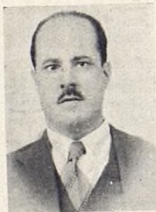
Ballesteros, del Grupo "Menéndez Pelayo"

La anormalidad de las circunstancias apenas si nos permitió actuar. No obstante, cuando nuestro Grupo, como tantos otros, corrió el trágico temporal de noviembre, procuramos no abandonarlo y podemos decir que, gracias al esfuerzo de la directiva, con el concurso de algunos Maestros y consocios, pudo salvarse una buena parte del material y otros elementos de la escuela.