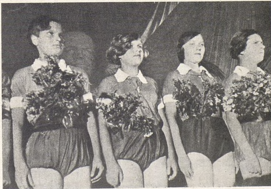
La juventud en marcha.

Del Comité Nacional de la Asociación de Amigos de la URSS