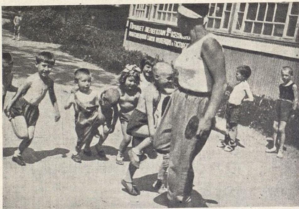
Grupo de niños tomando baños de sol.

Entre todas las realidades que la Unión Soviética presenta, en su construcción de una nueva vida, ante los ojos asombrados del mundo, forzoso es destacar una que—por su fondo de humanidad y por la clara concepción que encierra—refleja la tan justa como hermosa orientación que siguen aquellos pueblos: “la exaltación de la infancia”.