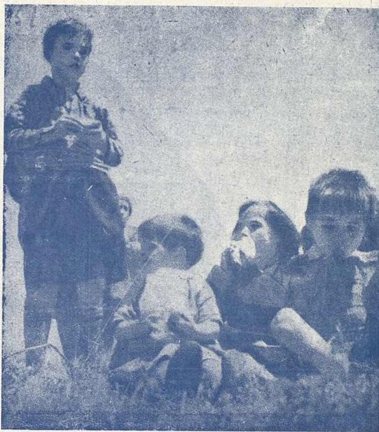
La comida en pleno camino.

A la tarea, pues. Hay que proceder con toda rapidez. Nosotros no disponemos de recursos materiales para emprender una labor como esa, que más de una vez solicitó nuestra voluntad convertirá en un verdadero caudal los ponemos a disposición de las autoridades y de cuantas entidades quieran secundarnos. La finalidad que se persigue requiere los mayores esfuerzos por parte de todos.