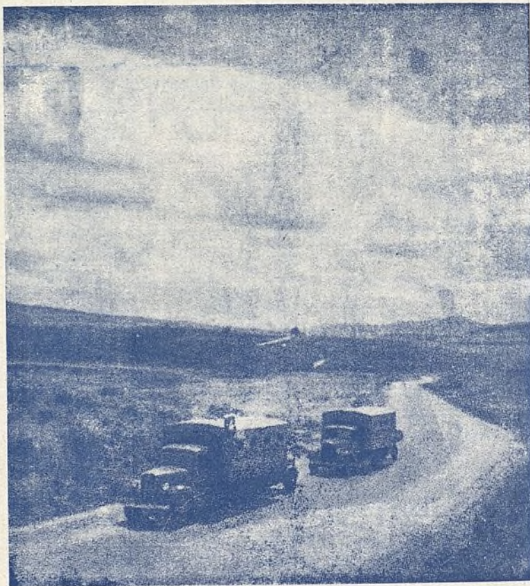
Una colonia en plena carretera.

Es cierto que las escuelas, venciendo las enormes dificultades que suponen las circuns-