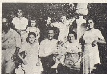
Algunos vecinos de Penáguila que niños madrileños cariñosamente tienen bajo su protección a varios atendidos.