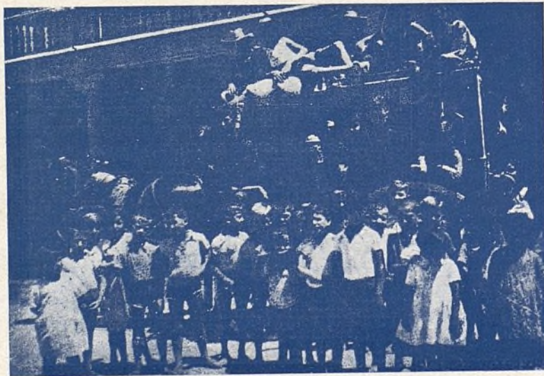
Una colonia al llegar a su destino.

En nosotros es esta una añeja preocupación. Ayudamos en cuanto nos fué posible a que