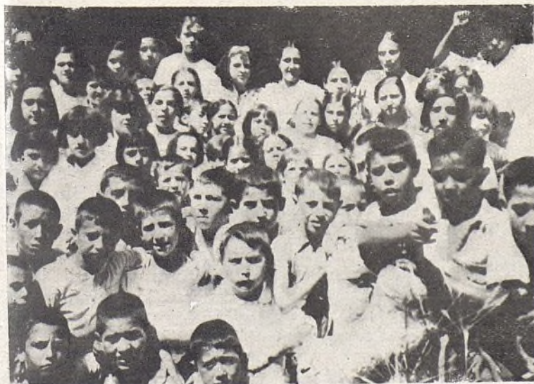
Aquí están mezclados los del pueblo y los forasteros, completamente alegres y satisfechos.