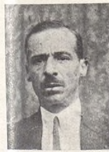
Peral, del Grupo "Tirso Molina"

A esa pregunta tengo que manifestar que la Agrupación "Tirso Molina" procuró y organizó con ayuda de Instrucción pública la salida de niños de su Grupo para la zona de Levante, siendo varias las expediciones con un total de 500 alumnos.