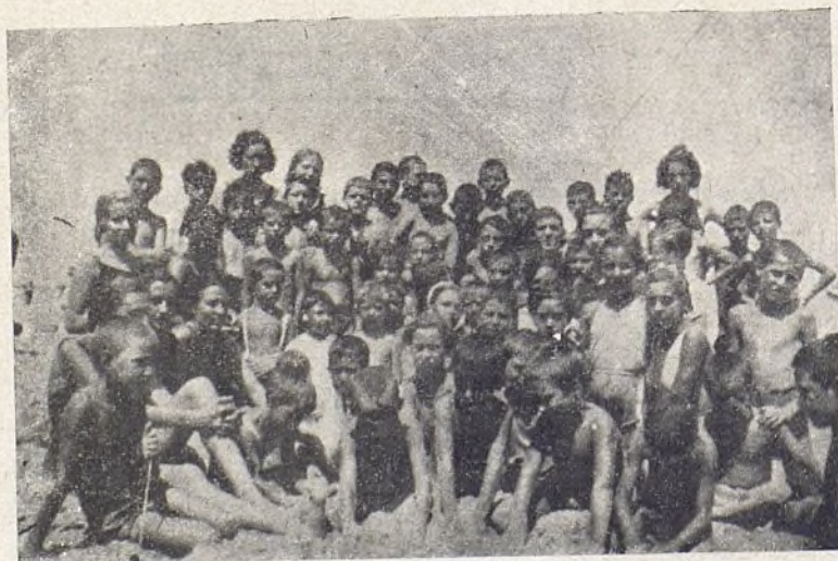
Los niños en la playa