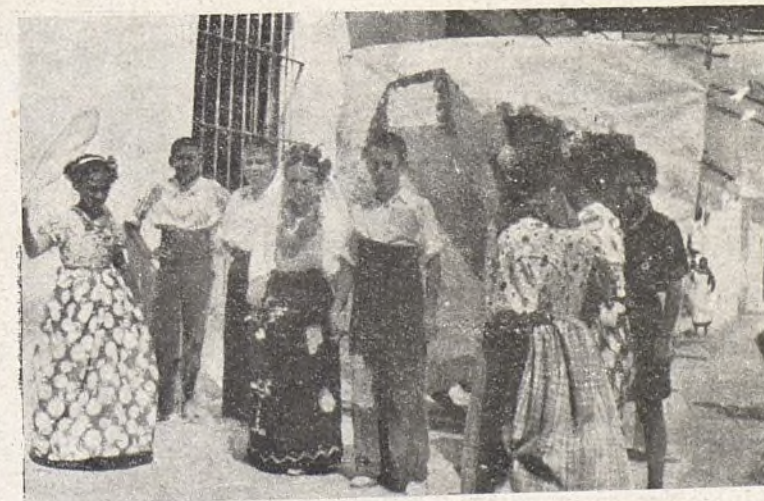
Los niños interpretando "Mujer brava"