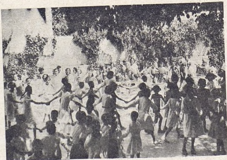
Los niños del Grupo de General Oráa, 49 en el recreo.