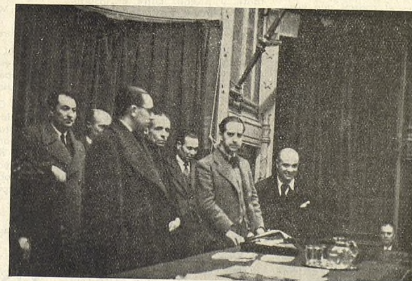
El artista premiado

El boceto premiado lo reproducimos en nuestra portada y cuya primera serie de medallas será rápidamente confeccionada. Las mujeres que supieron desprenderse de sus hijos en la zona de guerra, las que salieron con ellos, y las que les abrieron sus brazos en la retaguardia, acogiéndolos en sus hogares, soliciten de los "Amigos de la Escuela" la concesión de esta medalla a que son acreedoras, y recibirán a domicilio las instrucciones necesarias. Dichas solicitudes indicarán por escrito el lugar donde se encuentran los pequeños y el domicilio actual de la solicitante.