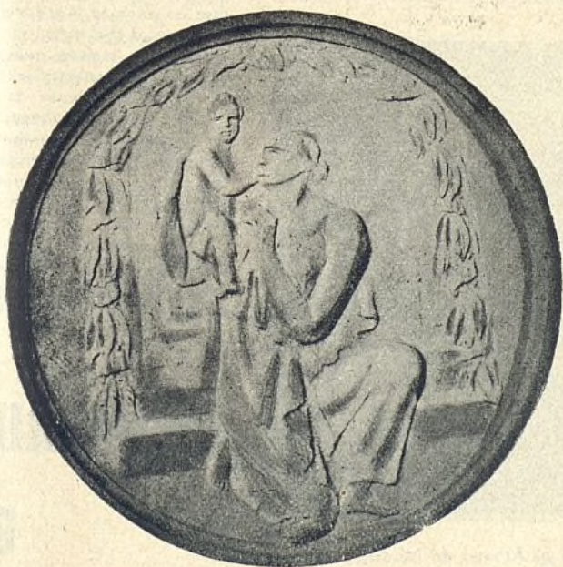
Medalla que obtuvo el voto del pueblo

ven, compuesto precisamente para comentar musicalmente el pasaje kantiano y expresar en el inefable lenguaje de la armonía misma la concordancia de la música de las esferas celestes con los latidos de amor del corazón humano si así se procede en la escuela (y esto no es más que un ejemplo entre mil) la educación del sentimiento puede poner las mejores cualidades del niño al servicio de la fraternidad humana. ¡Camaradas, Amigos de la Escuela, no olvidéis el artículo V de la Declaración de los Derechos del Niño! Son los derechos del niño y son nuestros deberes de hombres.