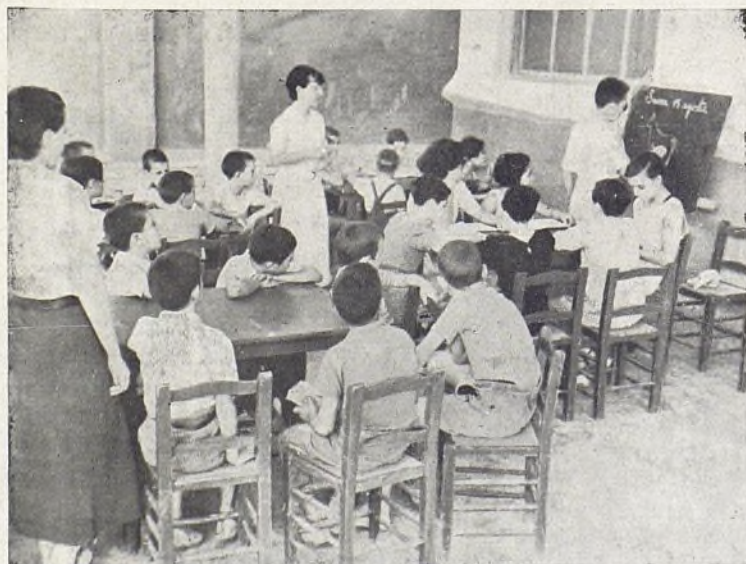
Una Sección de Dibujo.

de en el que se levanta el edificio de aspecto, un poco árabe. En la parte baja del mismo están la cocina, comedor, cuarto de duchas, las clases y la biblioteca. En la parte superior