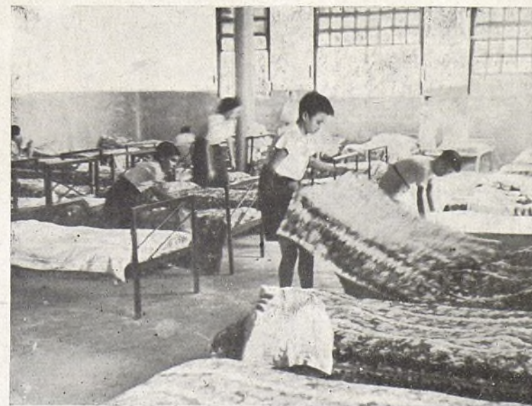
Los niños haciendo sus camas.

ños de la Residencia se duchan diariamente, con jabón y la enfermería sólo se usa para alguno que otro costipado, ya que todos los niños están sanos y robustos.