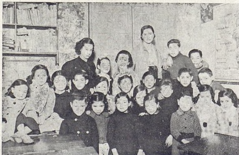
Los niños agrupados al lado de su profesora.

Otro saludo al benemérito Peral, gran amigo de los niños, otro a su colaboradora en afanes de enseñanza, y cuando ganábamos el centro de la población, trastocado por fuerza de las circunstancias en base de distribución de energías en busca