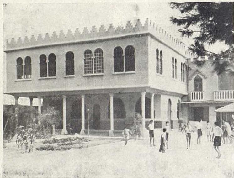
Niños en el recreo.

SITUACION Y EDIFICIO. —La Residencia está situada en la carretera de Valencia un poco distante de las últimas casas del pueblo. La entrada da acceso a un patio gran-