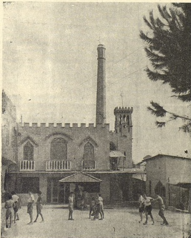
Un bello rincón de la Residencia Infantil de Sueca