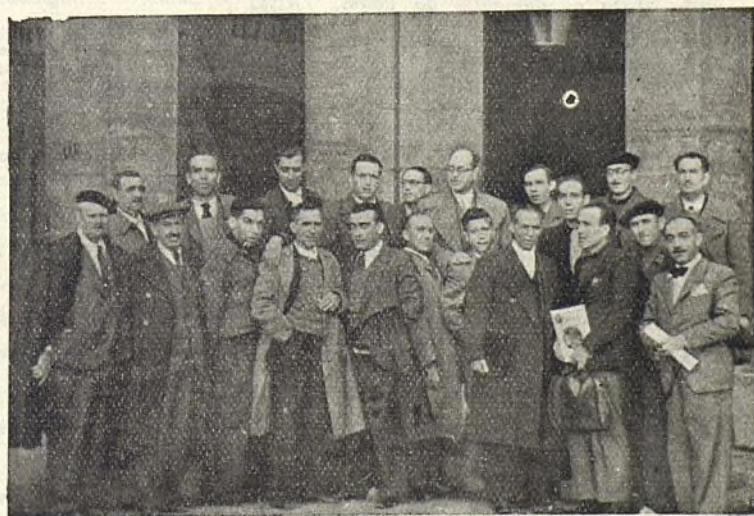
El Comité de Federación y representantes de varios Grupos, con la Redacción de AMIGOS DE LA ESCUELA