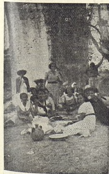
Un alto en la excursión.

—En la clase de dibujo se hace semanalmente la ficha de trabajo a realizar en cada uno de los distintos Talleres y cada responsable lle-