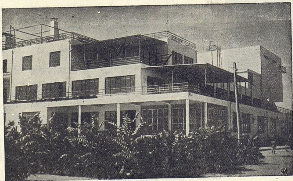
Casa de reposo - Jardines de la infancia