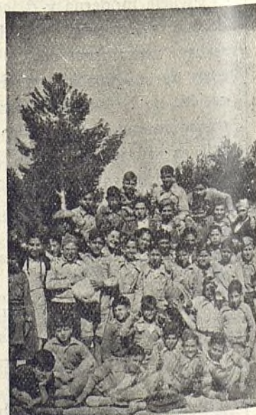
Los futuros artistas.

—El responsable general vigila y controla la marcha de cada sección con arreglo a las normas trazadas. Además hay una junta directiva de taller, compuesta por cinco alumnos, teniendo como asesores a las Direcciones de la Colonia y del Ta-