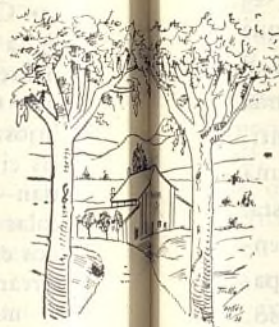
Vista general de los talleres.

Pero la labor de rendimiento más eficaz en los momentos que vivimos la han realizado los talleres de Alfarería y Alpargatería. Por el primero, se ha surtido de vajilla y objetos de adorno a toda la colonia y han quedado en los almacenes para necesidades futuras y aun para atender a otras Colonias unas dos mil piezas cocidas y vidriadas con una ornamentación en color azul, popular, que a más de reflejar el arte infantil indicará siempre la procedencia. Por el segundo, se han calzado de fuertes y bien acabadas alpargatas a todos los niños y personal encargado de los mismos y siempre hoy en el almacén respectivo una cantidad suficiente para que constantemente puedan renovarse las inutilizadas por el uso. Mas la Dirección de esta Residencia, no envaneciéndose por esta obra, aspiró a una meta elevada: calzar a los demás niños de otras Colonias. Y han enviado docenas y docenas de alpargatas a las colonias de Oliva, Cuatretonda y El Palomar, hoy por hoy, y ha puesto a disposición de la Delegación regional de la Infancia Evacuada MIL pares para que