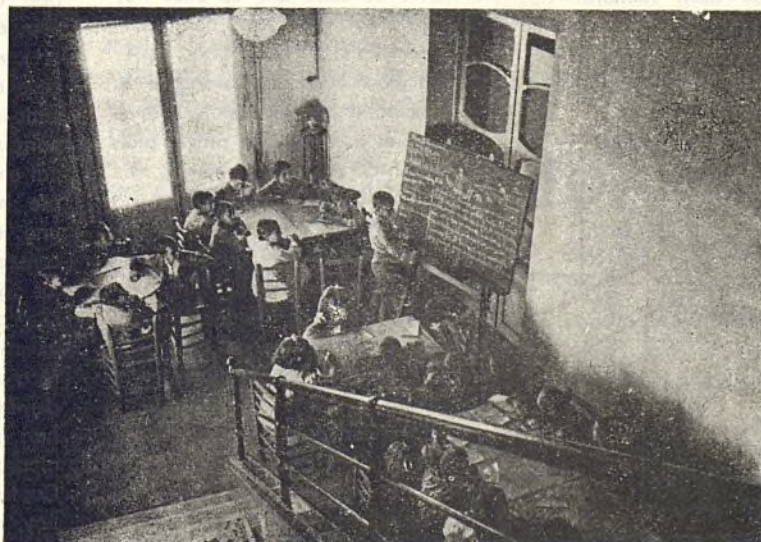
Una clase en la colonia Marenostrum.

dos recordamos. Niños y Maestros tienen para la capital de España y sus habitantes frases de cariño y elogio, y nosotros partimos de este simpático pueblo agradecidos y con la esperanza de que pronto una nueva sociedad de “Amigos” ingresen en nuestra Federación por bien de sus escuelas.