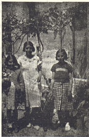
Niños madrileños en régimen familiar