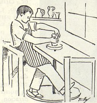
Taller de alfarería.