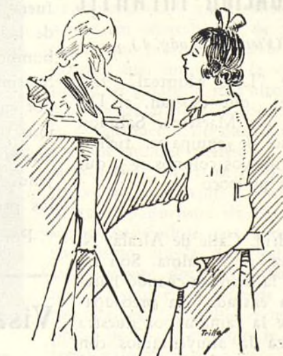
Taller de modelaje.