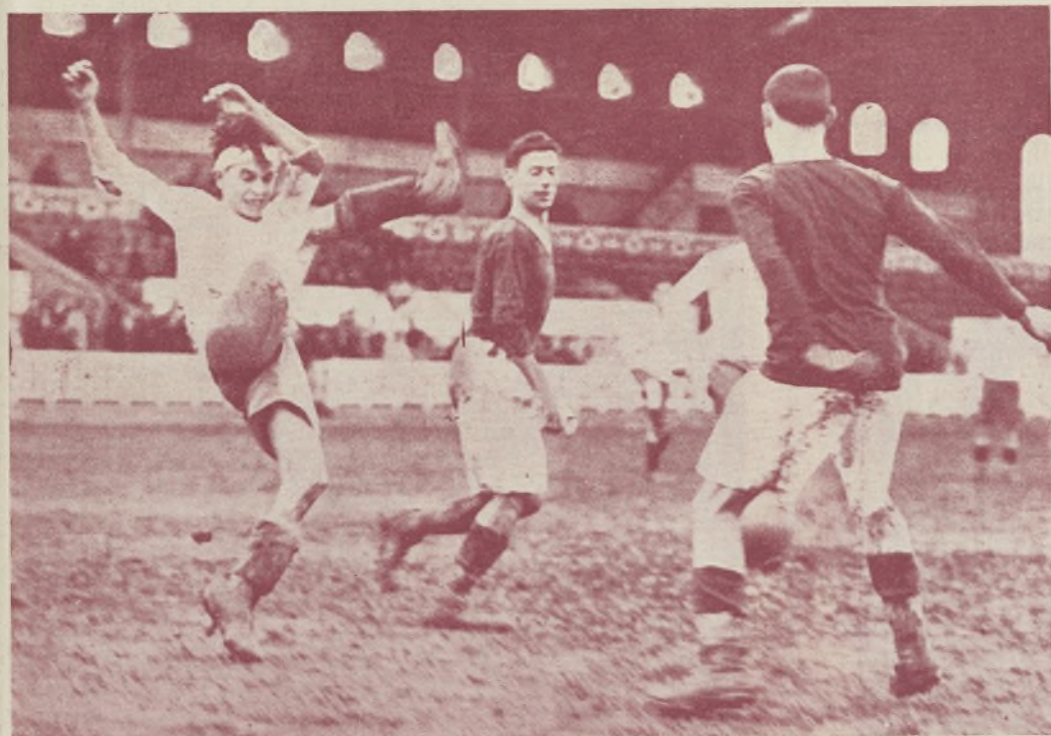
Del partido de ayer en Mestalla entre el reserva del Valencia y el Europa de Misana, que ganó el primero por 9 a 2.

Le sustituye, alternando la práctica en los rings con las funciones de ménager , el boxeador Jim Terry.