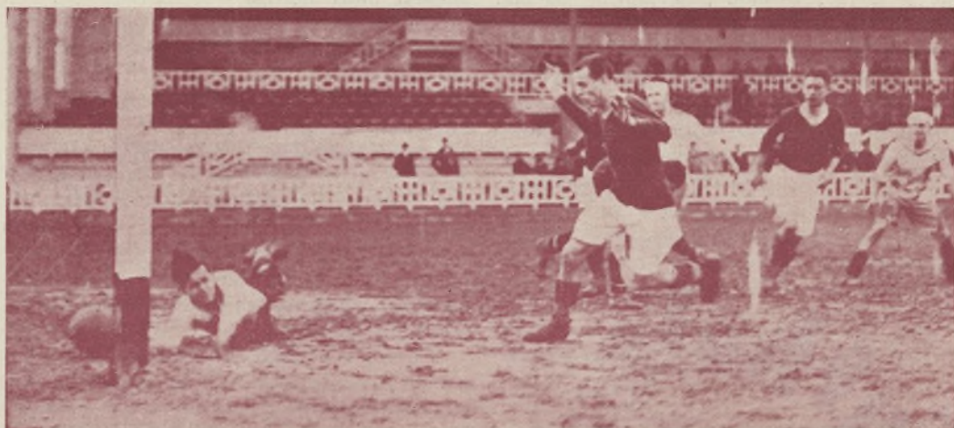
Una fase del partido jugado ayer en Mestalla entre el Reserva del Valencia y el Europa de Masanasa, que perdió por 9 a 2.

La Línea.—Ha empezado el campeonato local. Levante 5, La Línea, 1.