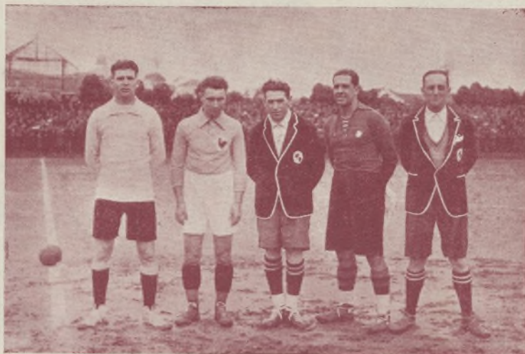
Colina árbitro internacional. Antes del partido Francia-Portugal.