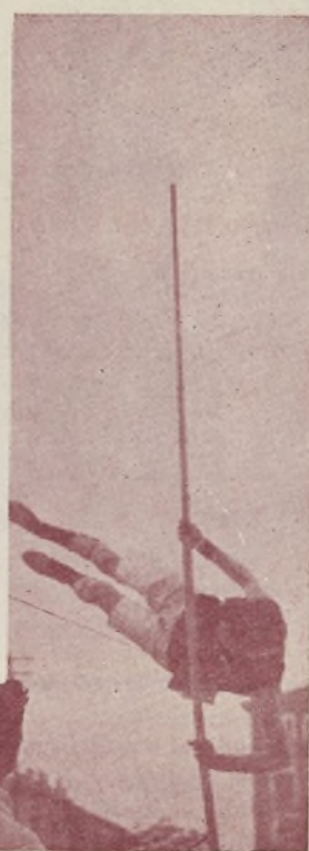
Colina cuando fué campeón de saltos de pértiga de Castilla.