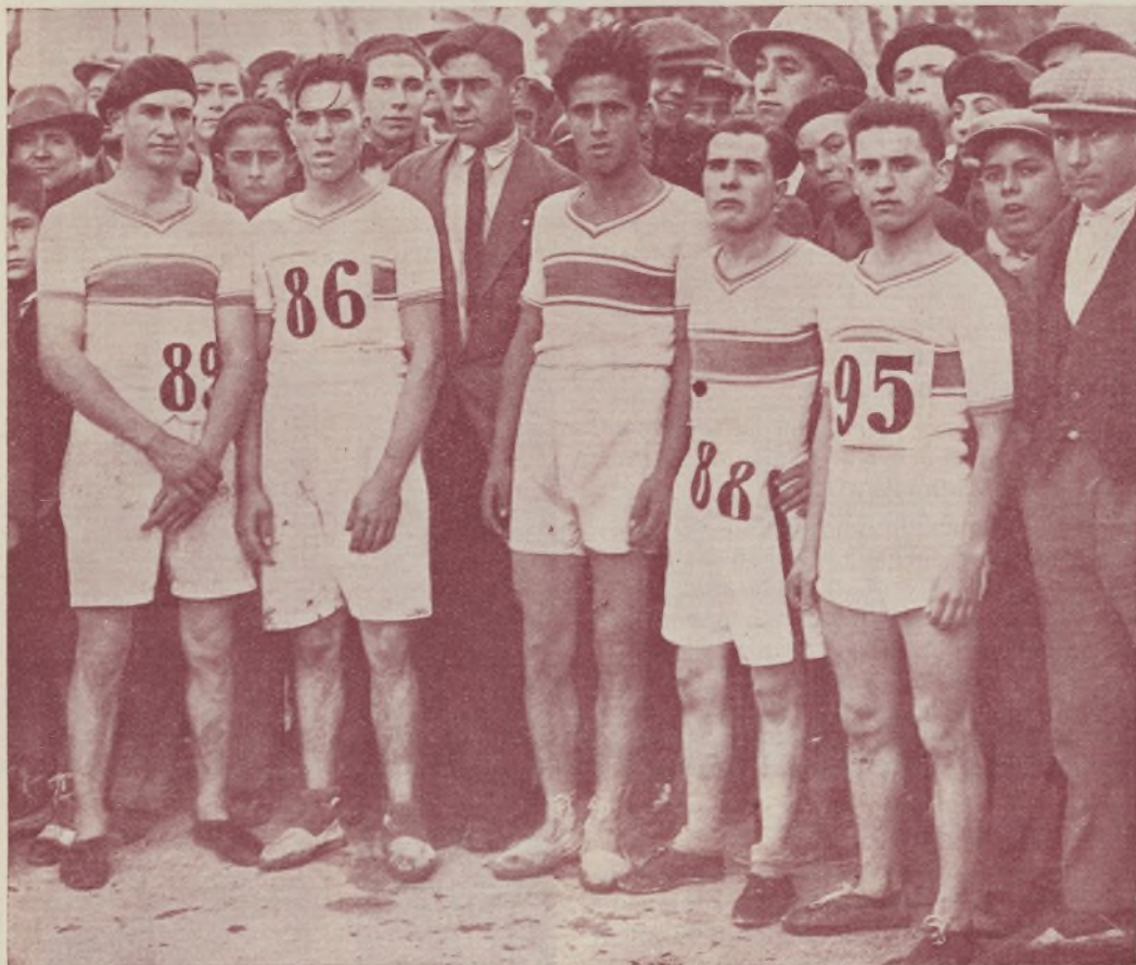
Un grupo de corredores que se clasificó ayer en el VI Campeonato Regional de Cross Country.