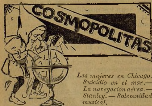
Las mujeres en Chicago. Suicidio en el mar.— La navegación aérea.— Stanley. — Solemnidad musical.

En el Heraldo de Nueva York —que hoy pasa por el periódico de más copiosa información del mundo—hallamos la