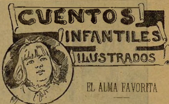
EL ALMA FAVORITA

Conchita tenía unos lindos dientecillos, blancos, como piñones mondados, finos como el filo de un escarpelo, y el cierre de aquel estuche eran dos labios colorados, frescos, que al desplegarse por la risa abultaban unos mofletes como manzanas teñidas de púrpura, sazonadas, que así como la fruta tienta á morder en ella por goloso deseo, así las mejillas de Conchita se mostraban pidiendo besos. Era una miniatura de gracia aquella cara de una cómica seriedad infantil, iluminada por unos ojos