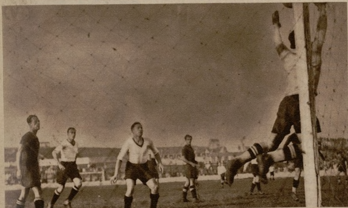
DEL PARTIDO RACING DE SANTANDER-BARCELONA.—Una de las muchas buenas jugadas del guardameta catalán, que impidieron que los santanderinos lograran, por lo menos, el empate