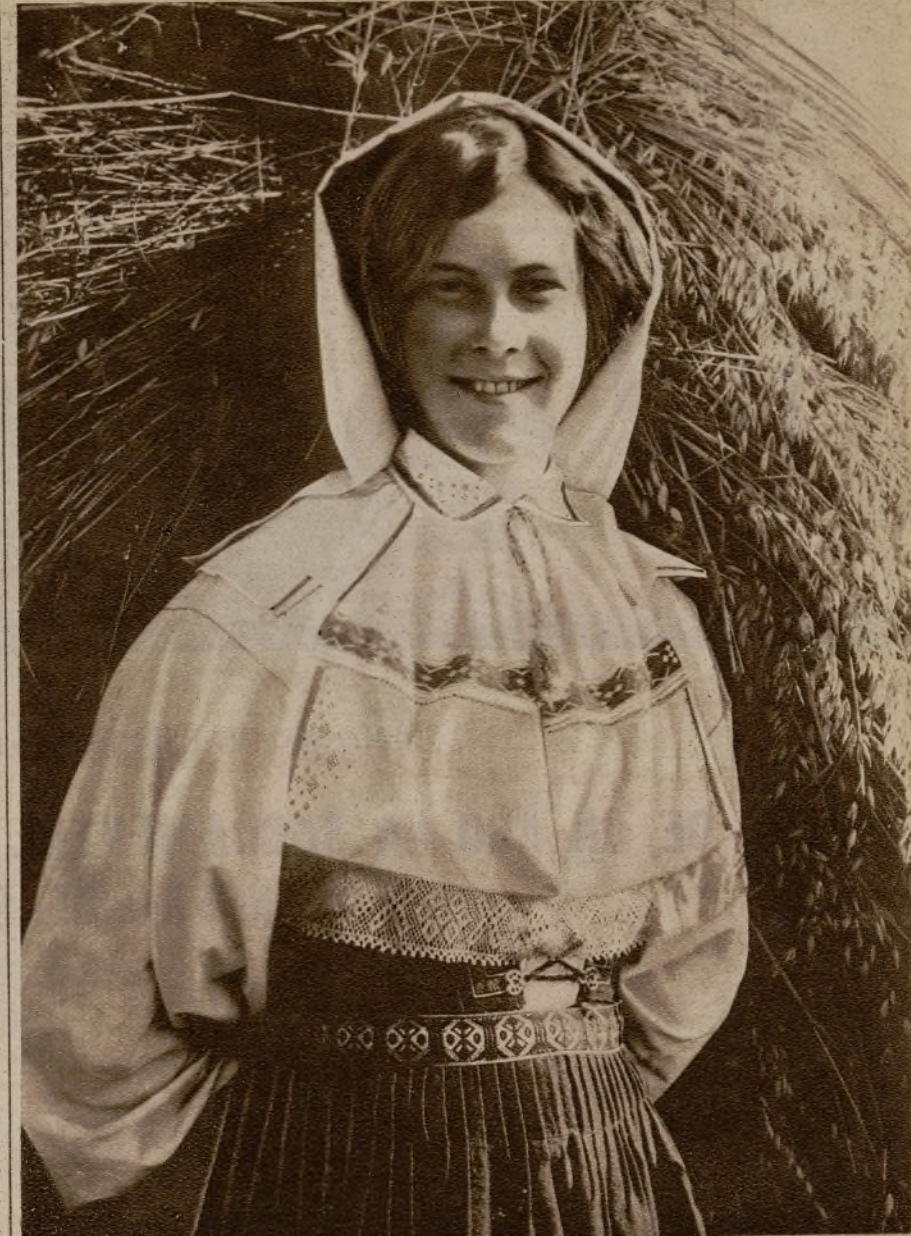
Este es el vestido popular de las mujeres de Suecia