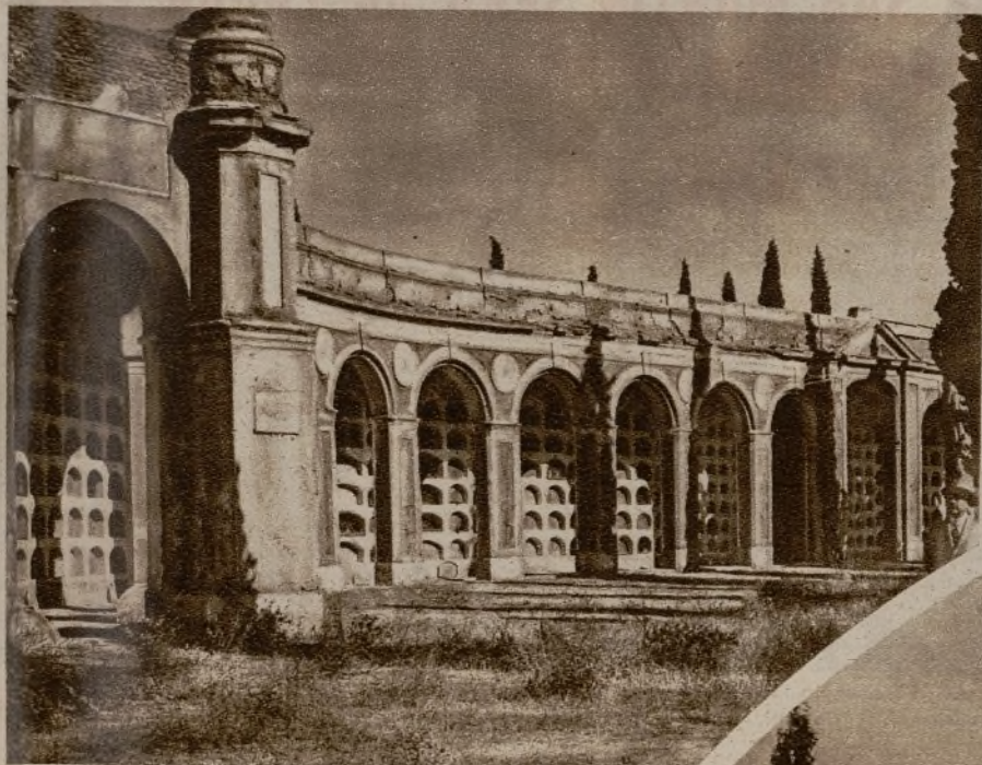
Las galerías de nichos, tal y como se hallan en la actualidad...

En el centro del patio se construirá, en forma de arcos cruzados, la fuente de las Cuatro Estaciones. Cuatro niños, representando el Verano, el Otoño, la Primavera y el Invierno, sostienen