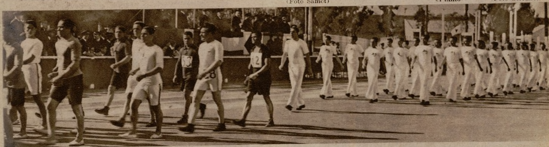
CONCURSO DE ATLETISMO EN CARTAGENA.—Los atletas, pertenecientes a las dotaciones de los barcos de guerra, arsenal y base de submarinos, desfilando ante las autoridades navales