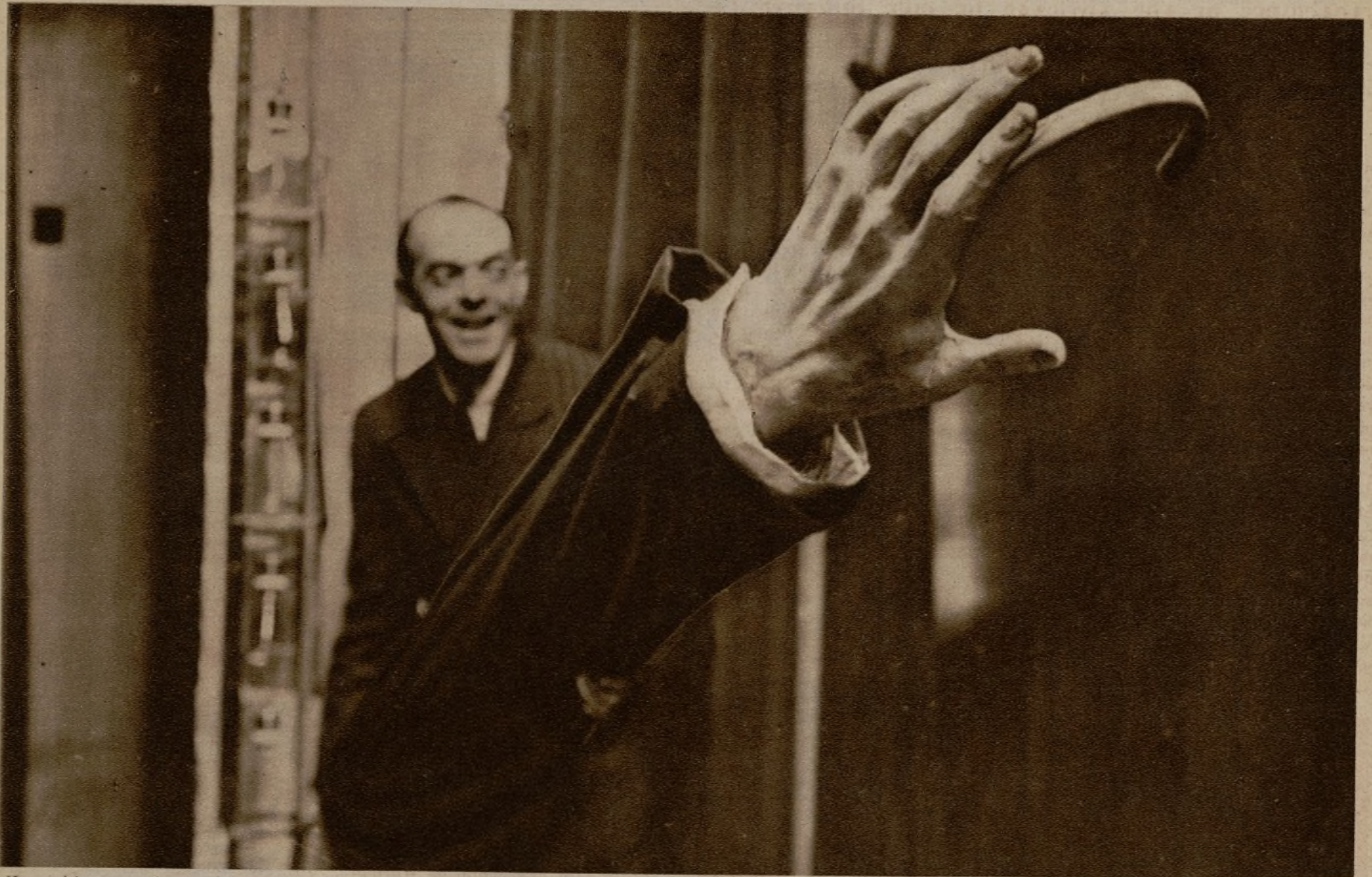
He aquí la mano ejecutora de la sentencia, provista de un gancho, que se aferra al infortunado espontáneo y tira de él hasta apartarle de la vista del público. Como puede verse, el funcionario encargado de manejar el aparato siente un placer malsano en la ejecución del infeliz.

Un café-concert parisién de los bulevares ha tenido una idea acertadísima. En el mundo hay muchas cosas organizadas, pero otras están pidiendo