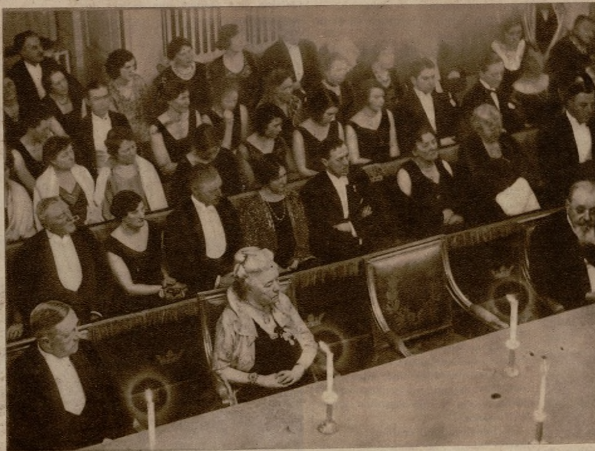
La célebre escritora Selma Lagerlof en su sitio de la Academia Sueca, durante una reunión de la misma

—Tenían antiguamente mucho carácter; unos y otras se celebraban de idéntica manera. Fuese después de la ceremonia nupcial o después de dejar al muerto en tierra, los amigos de la familia permanecían reunidos durante tres días y tres noches, sin cesar casi un momento de comer y beber. Pero hoy cualquier aldeano de medianos recursos económicos posee su cochecito "Ford", y