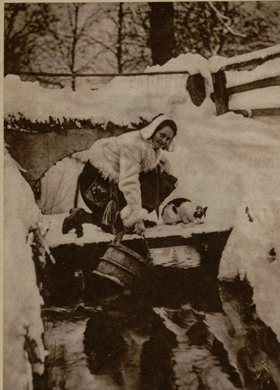
Una escena de la vida de las campesinas durante el largo invierno de Suecia

ya comprenderá usted que la locura de la velocidad es incompatible con la conservación de las viejas tradiciones.