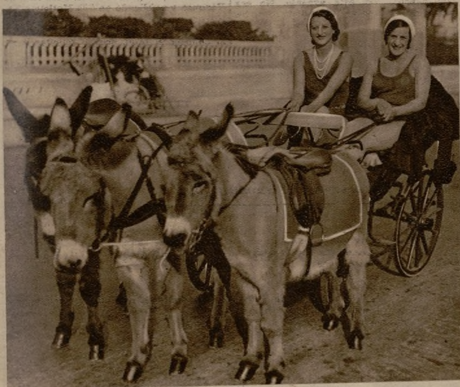
Tres horriquillos serios y orgullosos porque transportan a estas graciosas bañistas que en pleno invierno sienten calor bajo el sol de Niza

En el pasado año de 1930, había en París 231.000 perros que habían satisfecho su cédula canina. De ellos, solamente cinco enfermaron de hidro- fobia; pero se portaron los animalitos tan noblemente, que no mordieron a ningún ser humano.