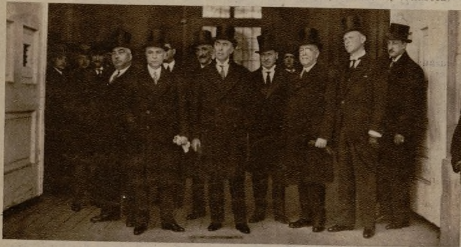
Grupo de algunos de los nuevos gobernadores, a la puerta de Palacio, donde fueron recibidos por el Rey