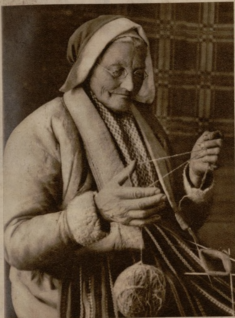
Una vieja aldeana de Suecia

LAS DAMAS DE LA DIPLOMACIA EXTRANJERA ACREDITADA EN MADRID, CUENTAN A LOS LECTORES DE "AHORA", COMO VIVEN SUS COMPATRIOTAS