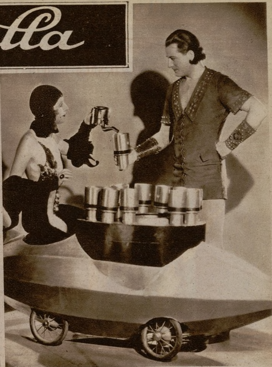
Kay Johnson y Reginald Denny, en una escena imaginada por el director Cecil B. de Mille... Hay poncheras "zeppelín" rodantes, vasos de "tapas" de cilindros y cántaros de estaciones de gasolina

Gary Cooper, acompañado de su amigo Eugene Pallette, está pasando una larga temporada en un rancho de Montana. Lew Ayres se reunirá próximamente con su madre, en San Diego, y el matrimonio Lilyan Tashman