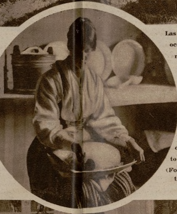
Las industrias lecheras ocupan a un buen número de mujeres en Suecia. He aquí a una campesina trabajando la mantequilla, según los procedimientos tradicionalmente empleados con singular acierto por el pueblo sueco