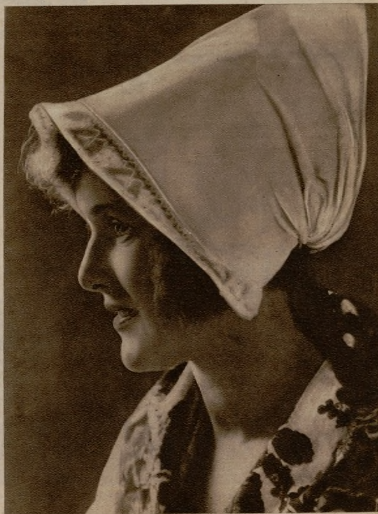
Una muchachita de Leksand, Dalarne

Al amor de la lumbre. Estufas y tradiciones. El clima y el "Hemslöjd".—Feminismo y trabajo manual.—La mujer sueca en la literatura.—Selma Lagerlof, el Premio Nobel y el idealismo