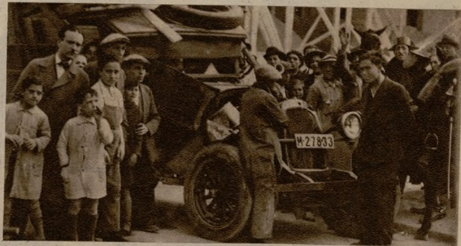
Estado en que quedaron las dos camionetas que chocaron en la calle de Fernández Villaverde