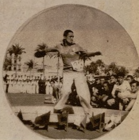
Un marino, en la prueba de lanzamiento del disco