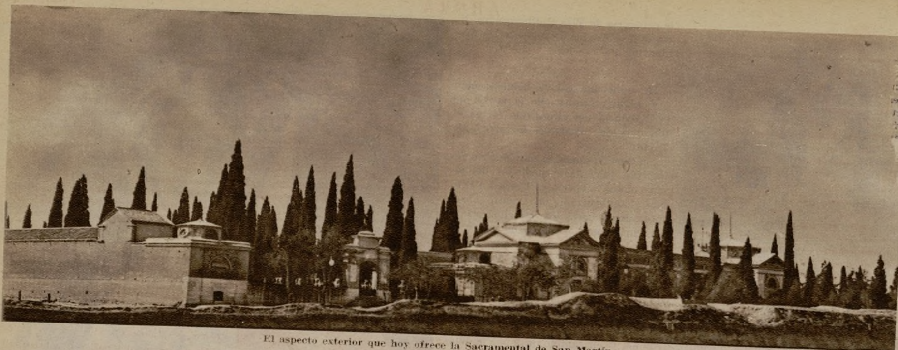
El aspecto exterior que hoy ofrece la Sacramental de San Martín...