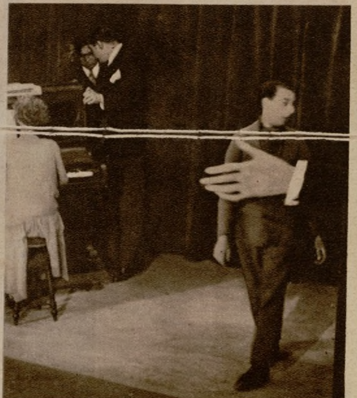
Un tenor en ciernes que ha fracasado. El hombre no lo acaba de creer y mira asombrado el gancho, que no sabe apreciar los matices de su voz.