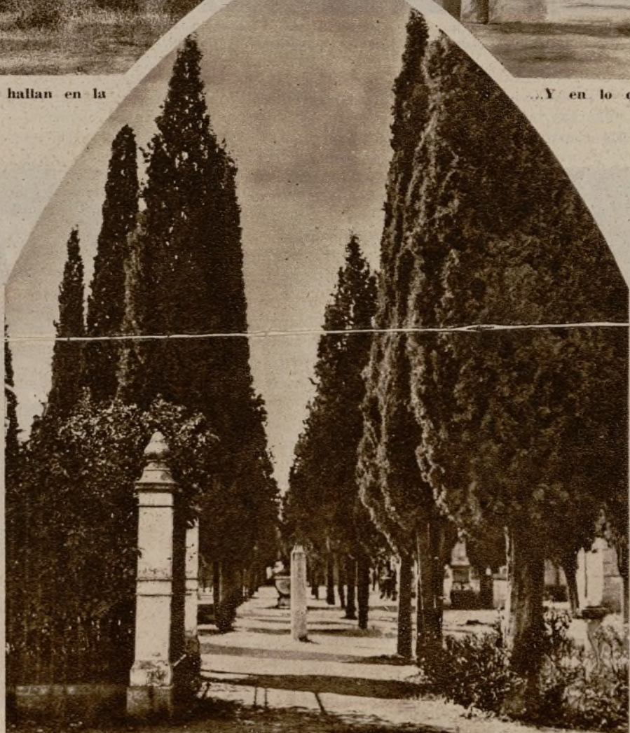
Una de las avenidas de cipreses, que se respetará, convirtiéndola en un paseo romántico

La galería de la izquierda está orientada al Sur, y desde ella se dominarán las vistas de Madrid, Moncloa y las distintas torres, que con su silueta dan esa nota tan peculiar de nuestra Villa, tan única a la caída de la tarde, cuando las sombras recortadas y desiguales dibujan sobre el brillante amarillo del