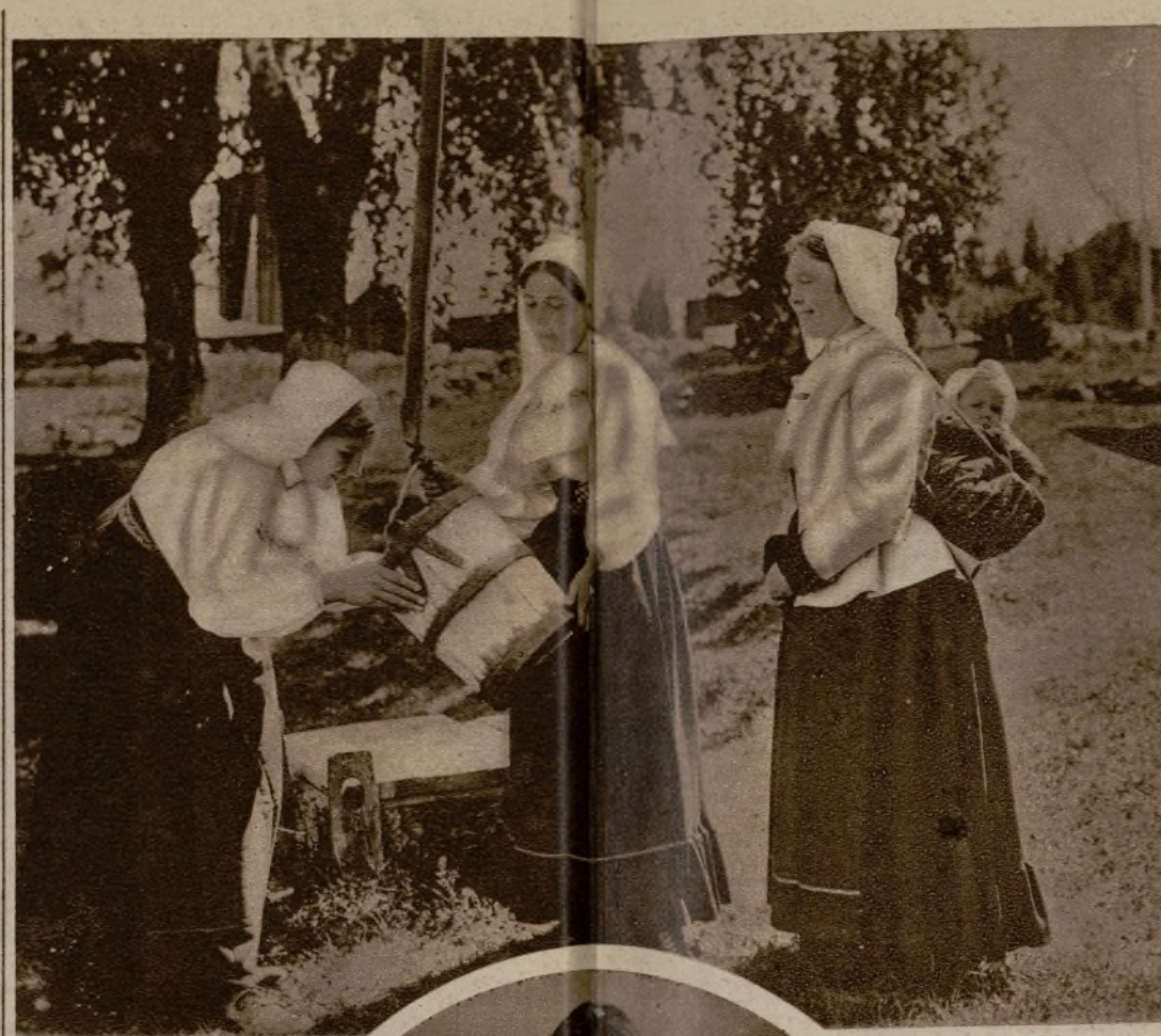
Mujeres de Orra, Dalecarlia, con el traje y el tocado tradicionales de las mujeres aldeanas. Véase la extraña y pintoresca forma que tienen las campesinas suecas de llevar a sus chicos para que no les impidan realizar las faenas agrícolas

—Según; una de las innovaciones más importantes que se han aportado en ella consiste en imprimir mucho del carácter y la belleza de los tejidos hechos a mano (que antes eran los únicos a los cuales se concedía valor artístico) a los de fabricación mecánica. Y un síntoma muy significativo de esta nueva tendencia es que los "Nordiska Kompaniet", que son los "Grandes almacenes" de Estocolmo, han elegido una artista de