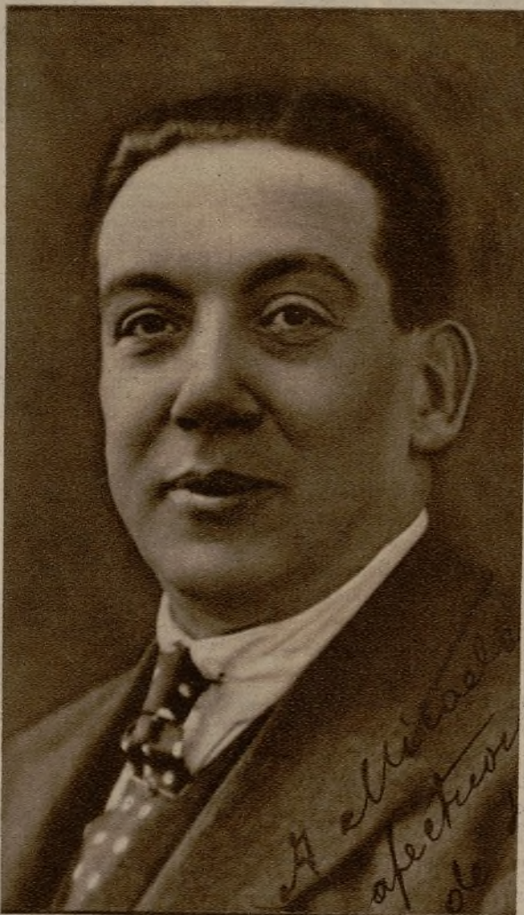
El primer actor y director Francisco Fuentes, que ha debutado con gran éxito en el teatro Español con "El caudal de los hijos"