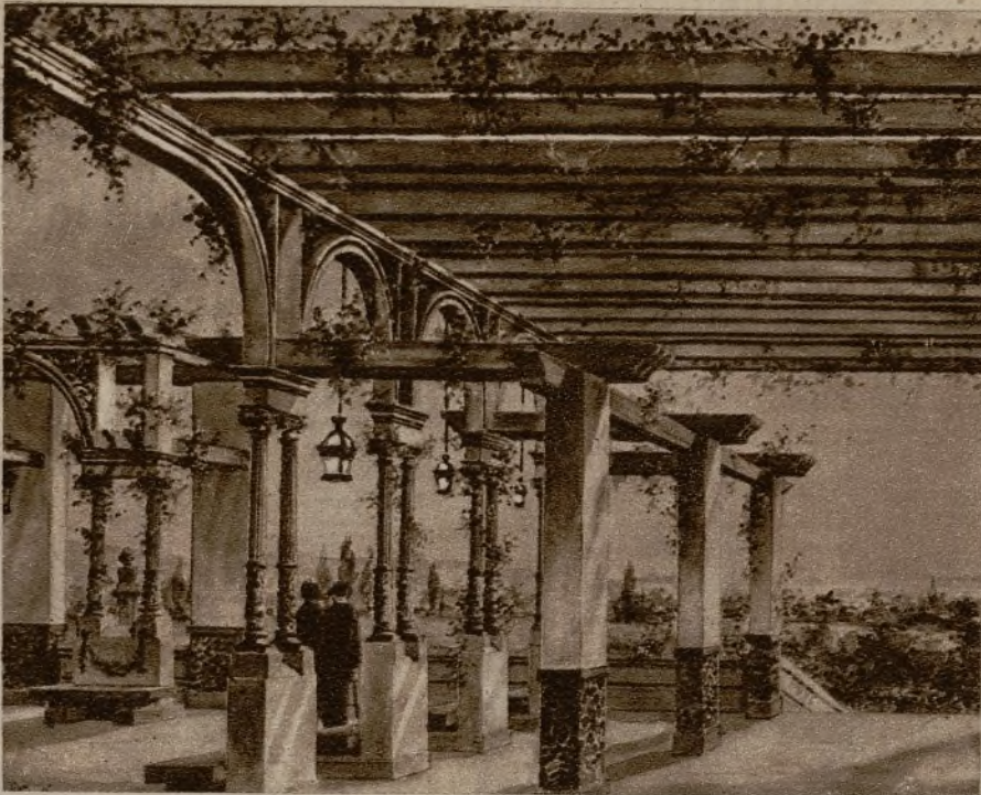
Un aspecto de la pérgola que se levantará en el centro de lo que era campo de enterramiento

Poniente las cúpulas, torres, chimeneas y tejados y cuantos detalles, insignificantes durante el día, se agigantan y poetizan en las horas vespertinas.