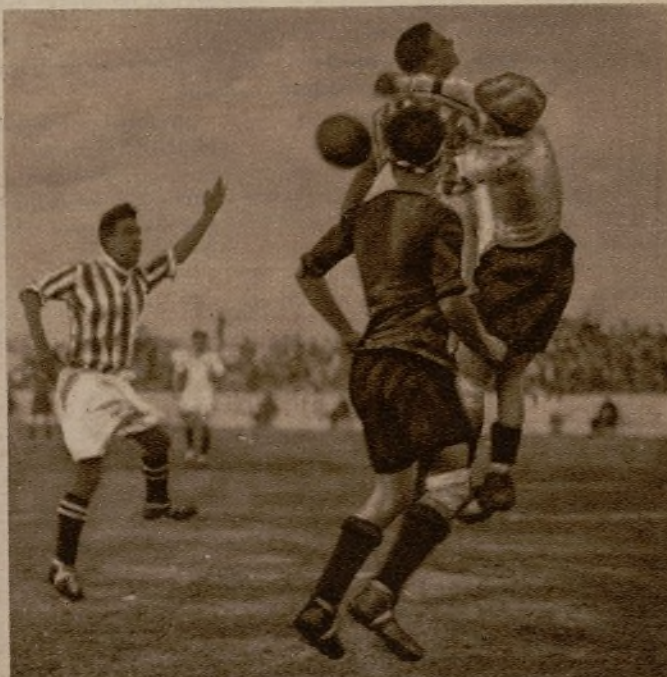
REAL BETIS-REAL MURCIA.—El portero murciano evita un remate, pero... envía el balón a otro "bético", que marcará el tanto