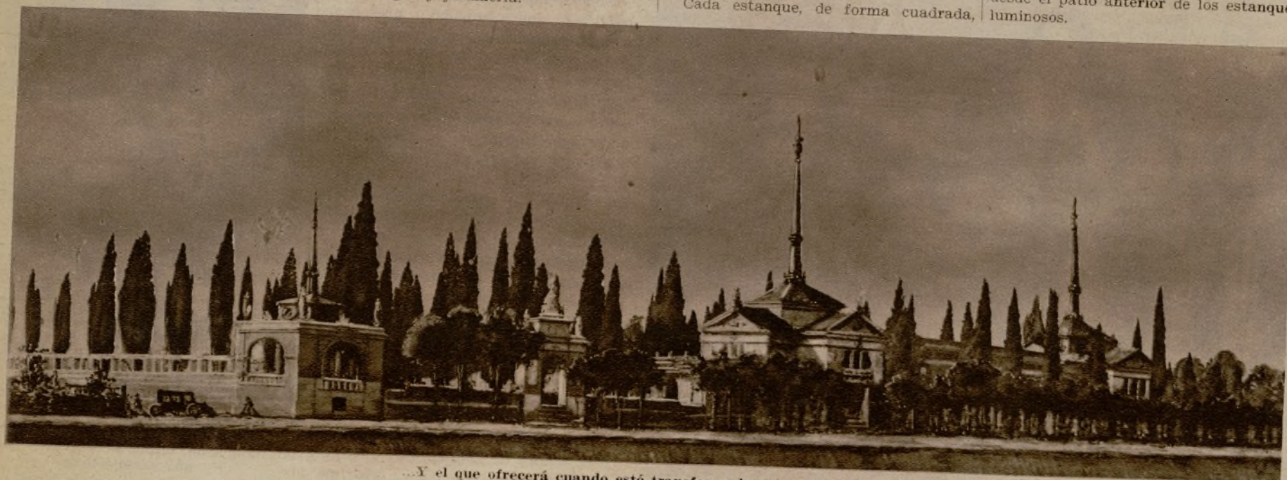
...Y el que ofrecerá cuando esté transformado en paseo público

En el eje principal y casi en el centro del terreno se halla una gran plaza, rodeada de galería, que afecta en planta la forma elíptica. Estas galerías abiertas en los extremos de sus ejes, terminan en cuatro pabellones, con una puerta central y dos hornacinas o nichos para colocación de estatuas. Dos pirámides sirven como decoración al ingreso desde el patio anterior de los estanques luminosos.