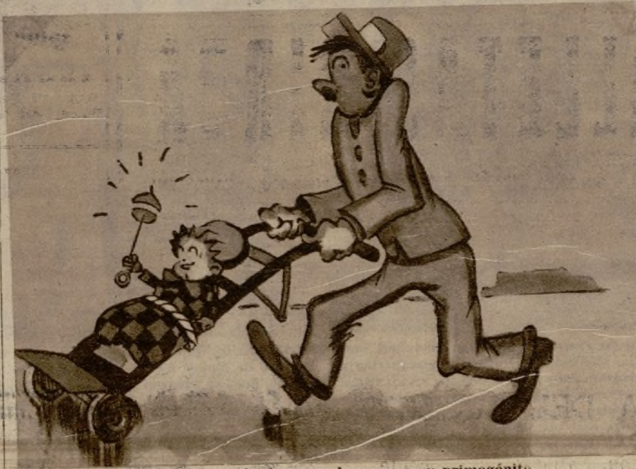
El mozo de equipajes saca de paseo a su primogénito

Pero el animal que mejor está de- fendido contra los ataques de los de- más es la raya eléctrica; con sus sa- cudidas hace huir aún a los octópo- dos más voraces.