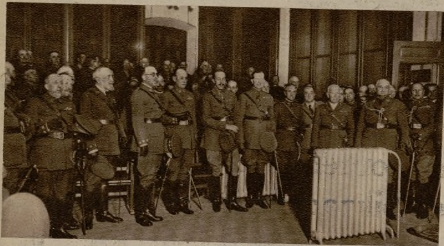
Su Majestad el Rey y el Infante don Fernando, en el acto de la clausura del curso de coroneles, celebrado en el Museo de Ingenieros