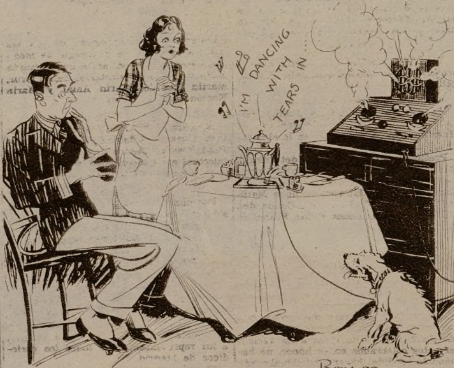
La señora distraída que confundió los enchufes de la "radio" y de la cafetera eléctrica