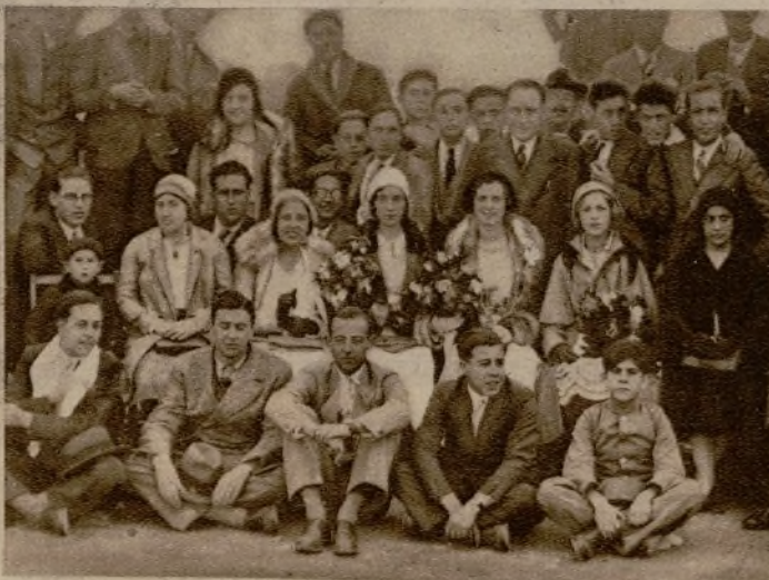
CADIZ.—Las señoritas madrinas de los equipos de fútbol de las Federaciones católicas de Sevilla y Cádiz, que contendieron en el campo del "Español"