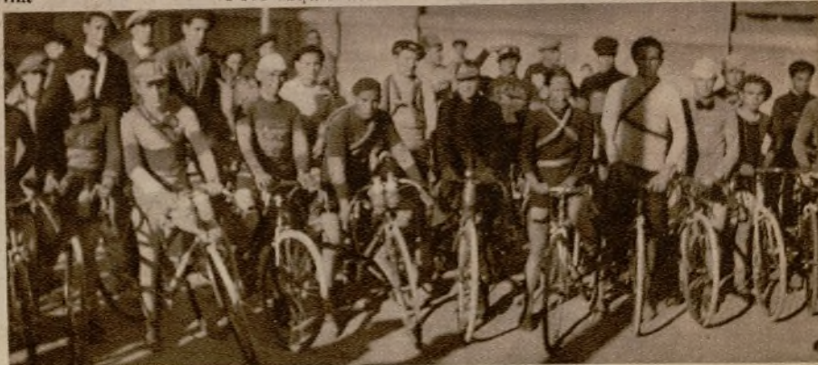
CARRERA CICLISTA EN VALENCIA.—Los participantes en la prueba de fondo, disputada el domingo sobre un accidentado circuito