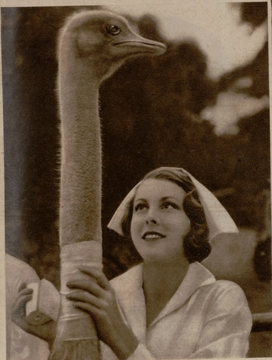
Uno de los avestruces amaestrados del estudio tiene anginas, y la graciosa actriz Frances Dee se ha brindado, como enfermera, para curarle