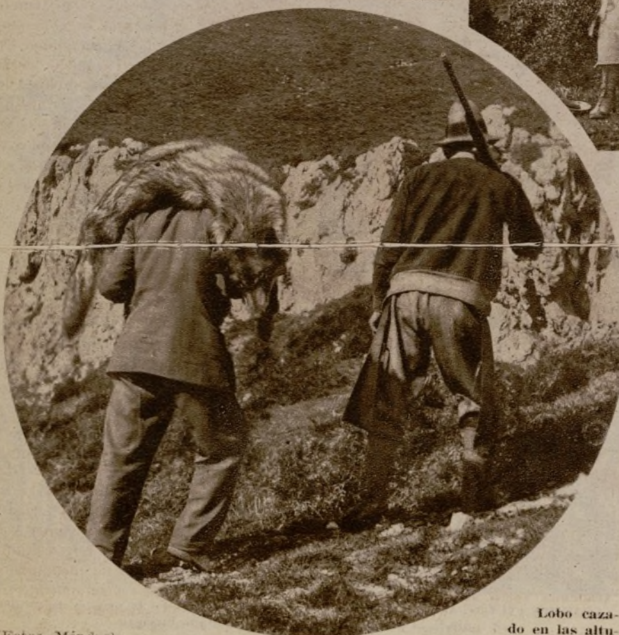
Lobo cazado en las alturas de Proaño