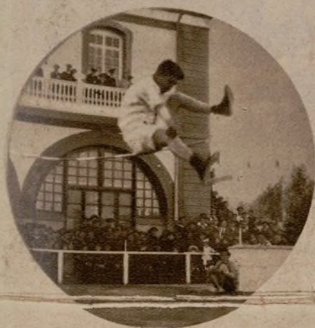
Uno de los concurrentes a la prueba de salto de altura