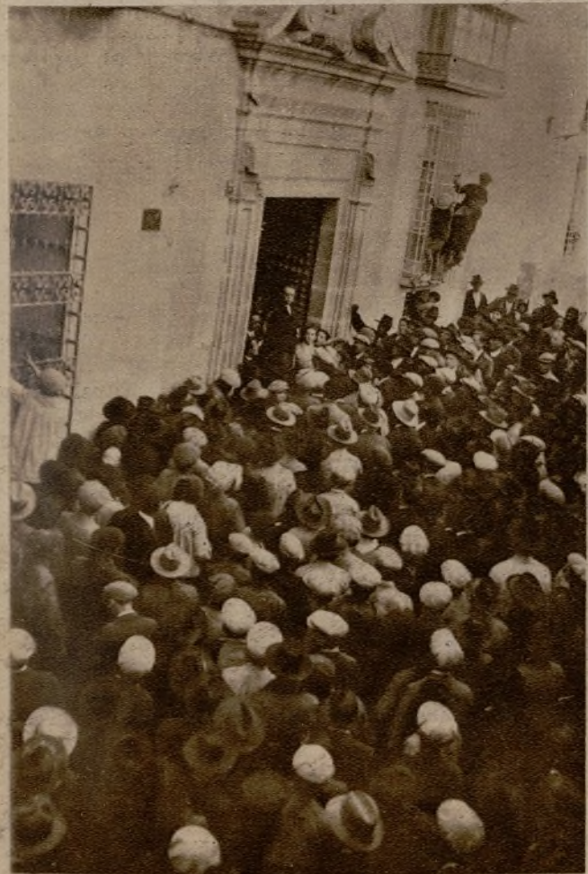
LORCA.—Manifestación de obreros y agricultores que se ha dirigido a las autoridades locales para pedirles pan y trabajo