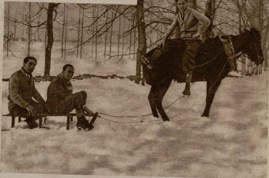
Las montañas de Reinosa, por cuyas carreteras corren los "autos" durante el verano, en invierno se convierten en un paisaje nórdico, para andar por el cual es necesario recurrir al trineo

¡Trineos en España! El concepto de la España cálida y perfumada con jazmín, que priva en el extranjero, tal vez sufra un poco con esta información. Pero a nosotros debe satisfacer que nuestro país ofrezca esta maravillosa variedad de climas y de paisajes, que nos permite, sin salir de él, hacernos una idea de lo que es el resto del mundo.