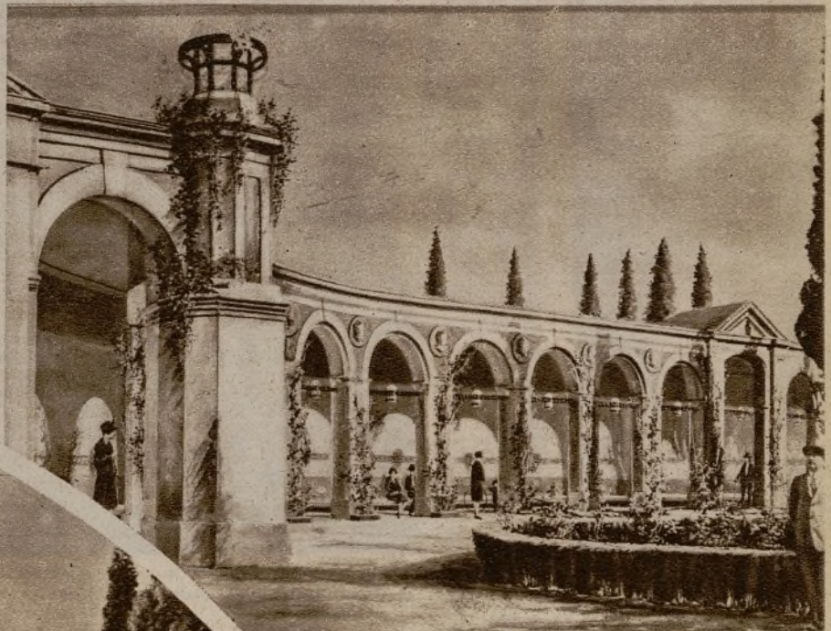
Y en lo que quedarán convertidas con sólo unas pequeñas modificaciones

do de jardín y paseos, se erigirán el monumento a la "Lectura", con sus bancos y biblioteca popular de obras científicas infantiles, donde el niño pueda instruirse en los descansos del juego, y otro a la "Poesía", con alusión a las obras de los mejores poetas.