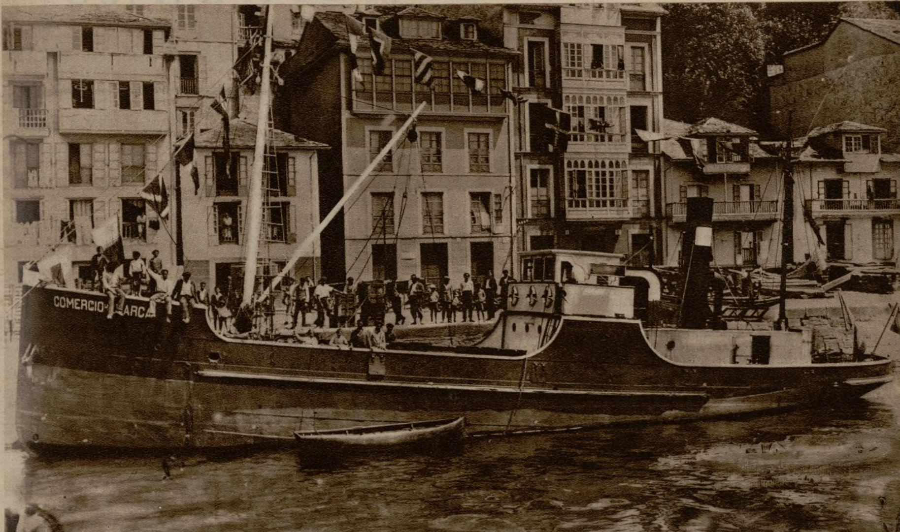
LUARCA (Asturias).—El vapor "Comercio-Luarca", naufragado a la altura del cabo Peñas, a consecuencia de un golpe de mar que le hizo dar una vuelta de campana. De sus siete tripulantes, sólo pudo ser salvado el patrón; de los otros seis no han vuelto a tenerse noticias, por lo que se teme que hayan perecido en el naufragio