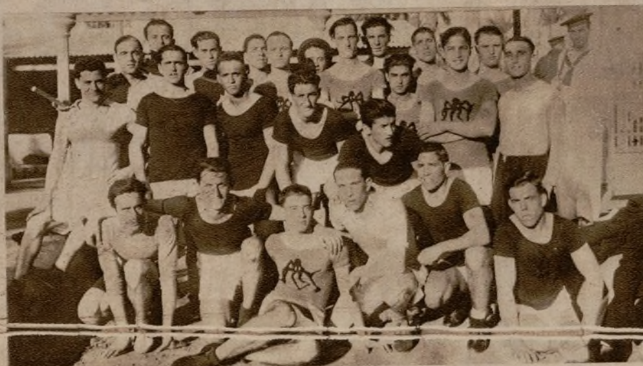
Los ganadores en las pruebas de atletismo reservadas a los individuos de tropa de la Marina