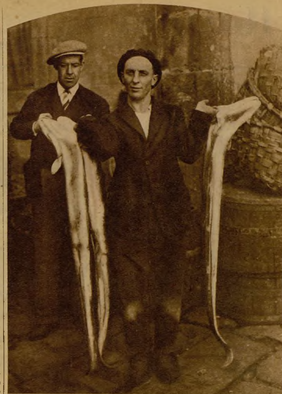
Congrios, no muy peligrosos de pescar, en la costa gallega

¿Qué cerca está el buquel? ¿Cómo se sienten los latidos de sus máquinas! ¿De qué modo se agiganta a cada instante aquella sombra, donde, como los ojos de un monstruo, brillan las luces de situación! ¡Afortu-