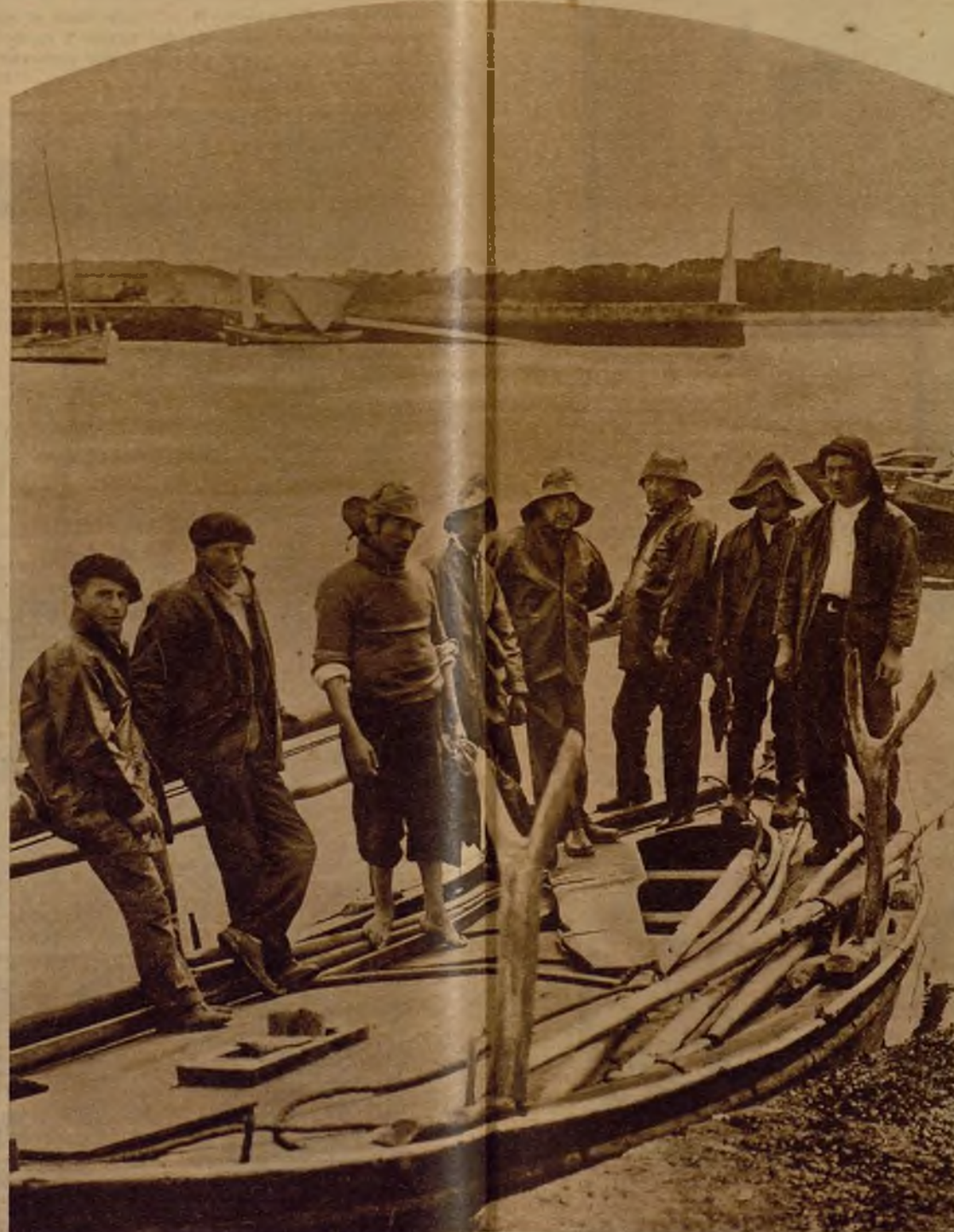
La llegada de los pescadores al puerto

las olas llega el intermitente jadear de los pescadores: