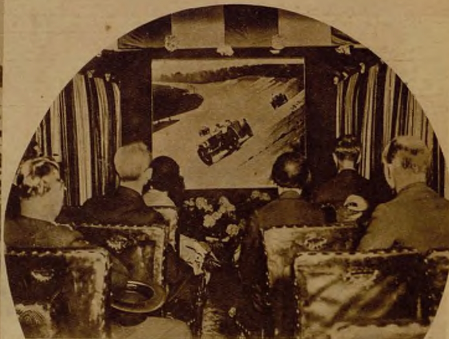
Los ferrocarriles de la línea Londres-Scarborough han introducido un nuevo elemento de "confort" para el viajero. Uno de los coches está habilitado para cine sonoro, y constantemente se proyectan bellas películas. En los ratos de aburrimiento los pasajeros ocupan—sin sobreprecio alguno—su butaca en el coche-cine, y al mismo tiempo que devoran kilómetros gozan de la última superproducción.