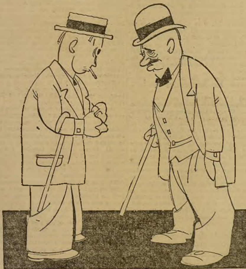
PLANTE DE PRESOS, por K-HITO

SEVILLA, 6 (4,30 t.).—El juez especial, señor Abarrategui, se constituyó esta mañana en la Auditoría de guerra, actuando en el sumario por los sucesos ocurridos en la calle del Relator. Recibió sobre dicho sumario varias declaraciones, y, terminadas éstas, estuvo en la cárcel, donde se celebró una diligencia de reconocimiento de los detenidos por algunos testigos de los sucesos.