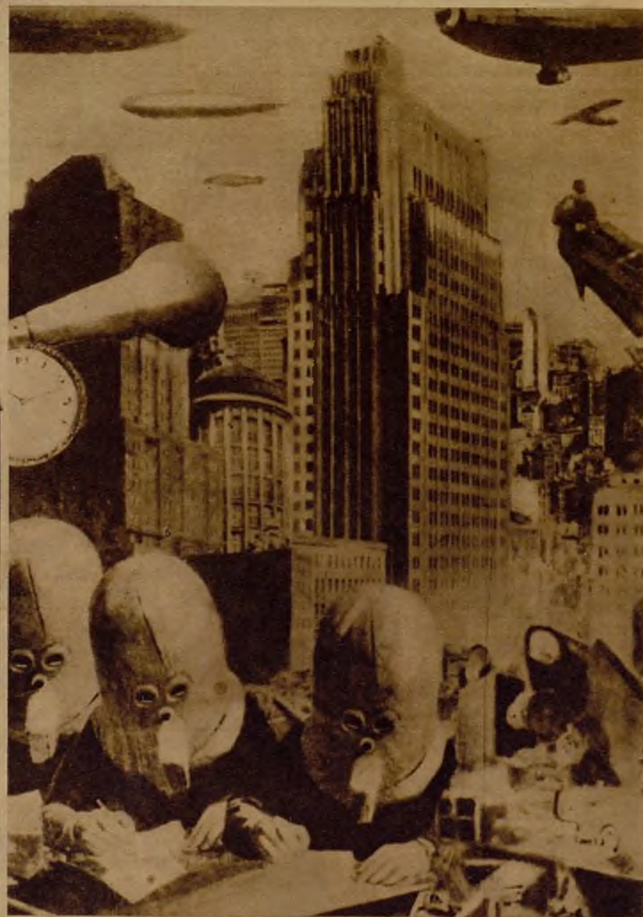
El pintor ruso Wassilietf Borotinsky ha expuesto en un cuadro su visión sobre la Inglaterra del porvenir: grandes rascacielos, miles de aeroplanos y dirigibles para los diversos servicios, la electricidad aplicada a todas las necesidades... Estos hombres deformes que se ven en la foto son, según Borotinsky, los ingenieros, que desde las grandes centrales repartirán equitativamente la energía eléctrica, la luz y el calor.