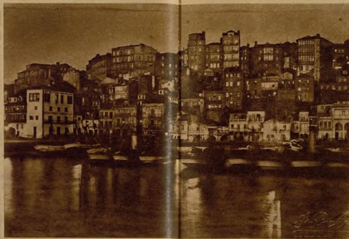
Fantástico aspecto que presenta la ribera del Bóveda, en Vigo, a la llegada de las barcas de pesca. Al fondo, las luces de la ciudad, que prestan un misterioso encanto a la bella perspectiva