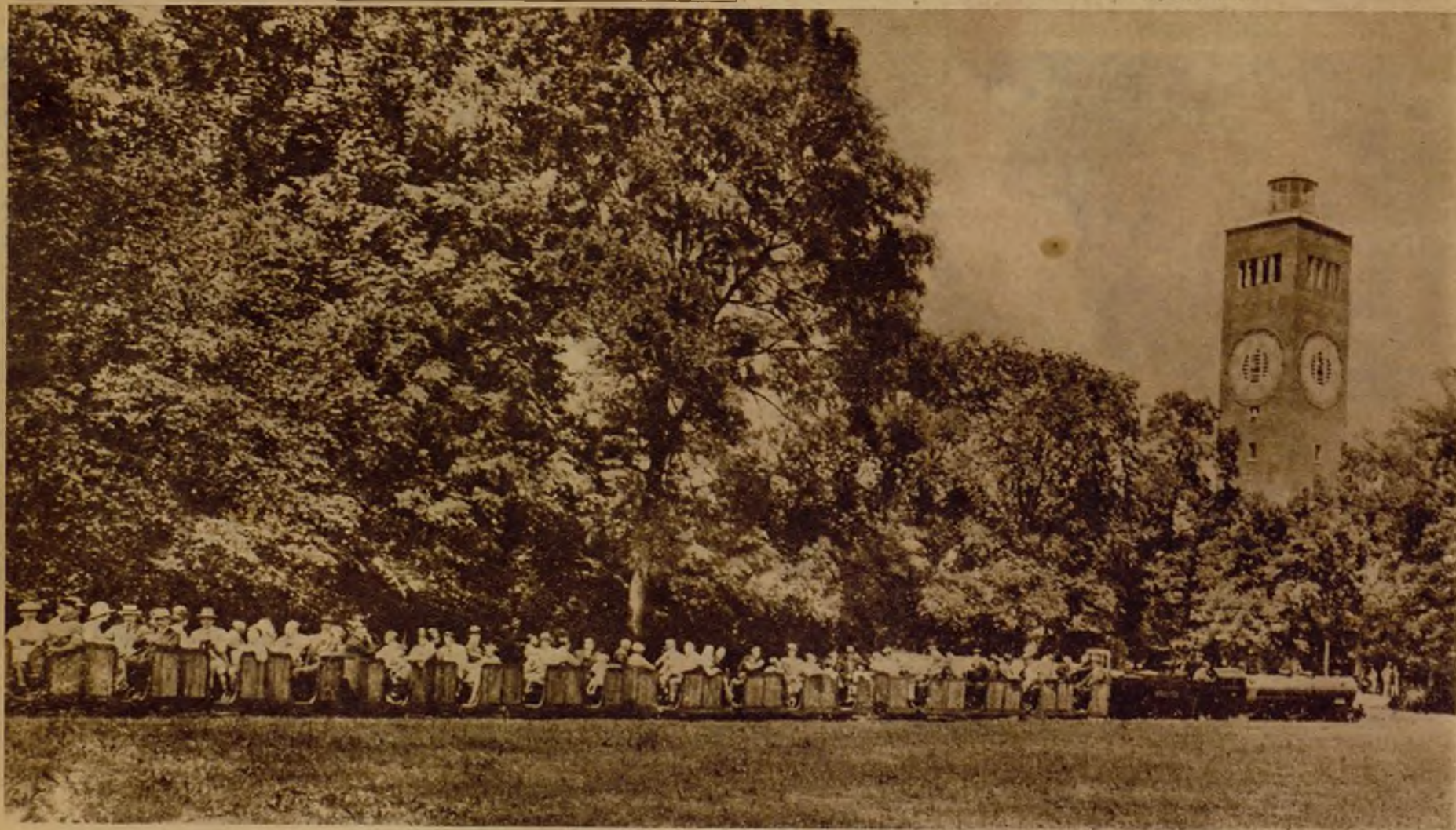
Véase una prueba evidente de la aceptación entusiasta que tiene el público por estos trenes de juguete