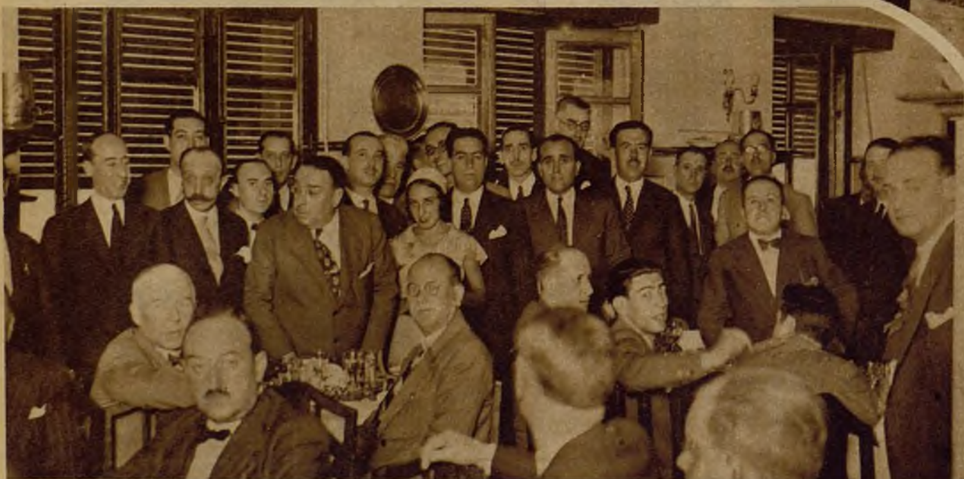
Los delegados de provincias del partido Derecha Liberal Republicana, que toma la denominación de Partido Republicano Progresista, reunidos en un banquete para celebrar la terminación de su Asamblea