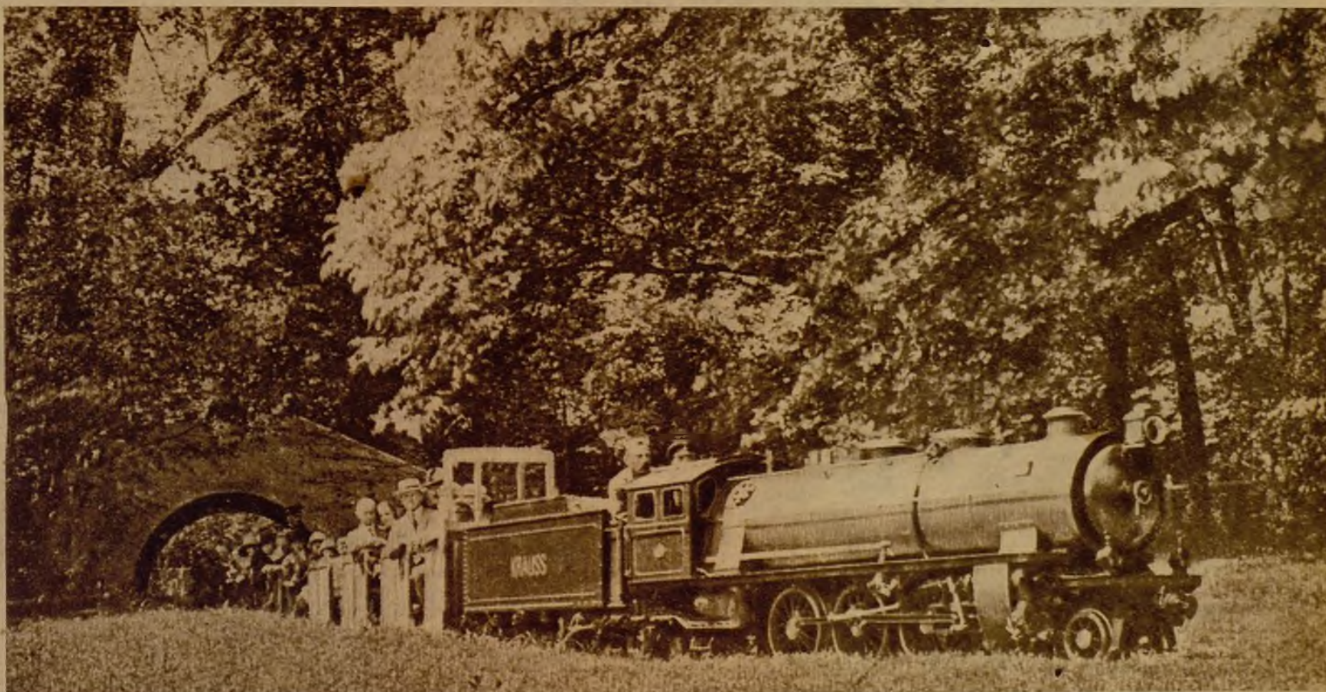
He aqu  uno de estos ferrocarriles peque itos, que se desliza r pidamente bajo un puente a trav s de los jardines (Fotos Ben tez Casaux)

La estaci n de origen se emplazar  con car cter provisional junto al lago grande, en la margen del embareadero, ya que su emplazamiento definitivo se har  posteriormente al pie del dique del