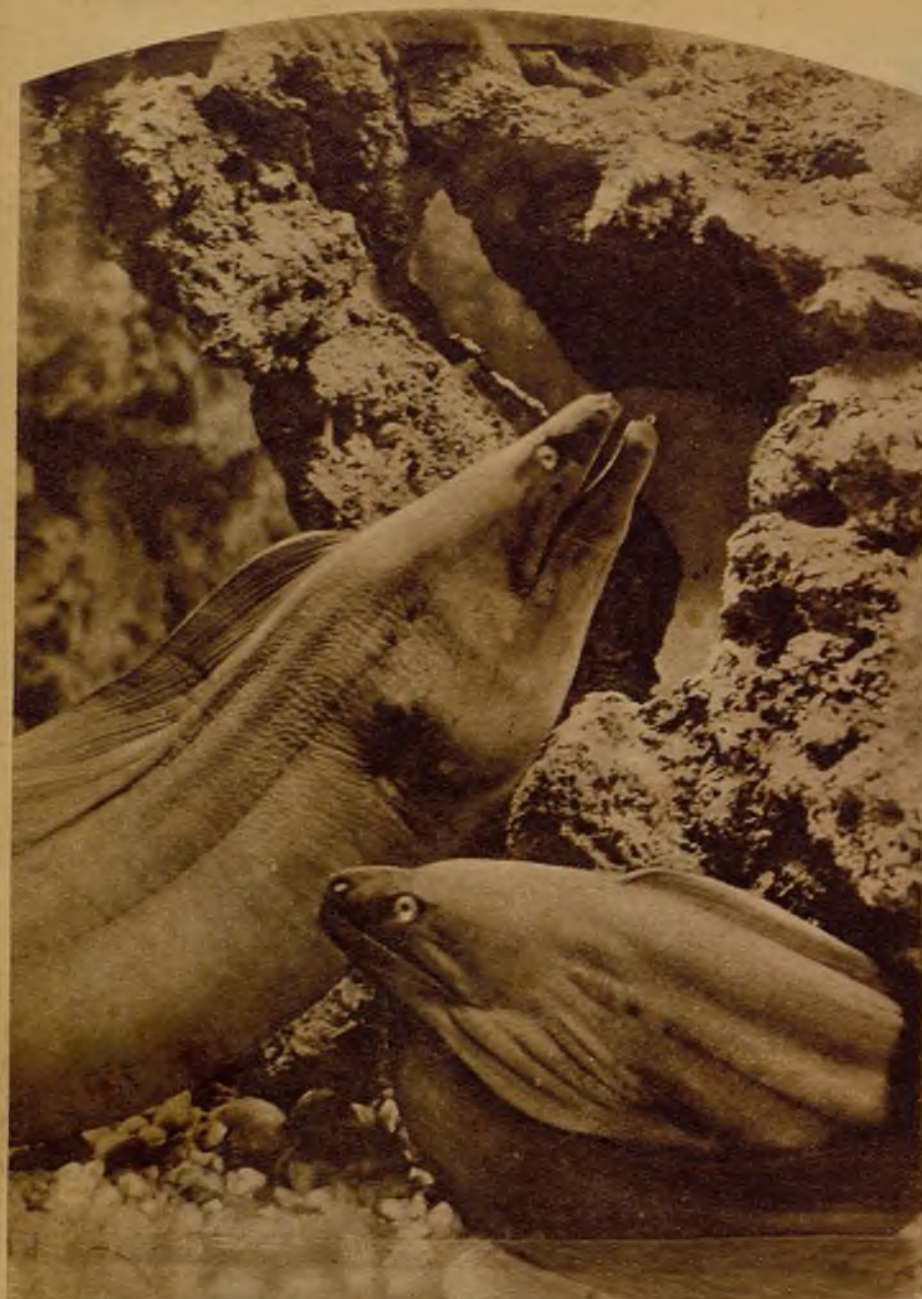
Congrios gigantes, tan feroces como tiburones

La noche ha llegado ya y estamos, en pleno océano, en la famosa soledad infinita. ¿Ustedes han hecho algún viaje por mar? Pues no se den demasiada importancia. Yo conozco esos viajes, y hay que reírse. Hay que reírse de lo de cielo y agua. Calafacción, ventiladores, luz eléctrica, escotes, ropas de fiesta, música, bebidas, juego, baile... Agua y cielo en torno, sí, señor. Pero usted se asoma a la borda y como si se asomase a la terraza de un hotel de playa. El cielo brilla arriba, y si no quiere brillar, allá él. El agua queda abajo, a una distancia que ni se nota. Sopla el viento, y a usted como si le trajesen la noticia los periódicos. Usted está en los salones. Usted, si se pasea por la cubierta, gracias a la mampara de lona que la Compañía ha tendido para protegerle, ni siquiera ofrece a la joven que le acompaña el espectáculo de sus pelos revueltos.