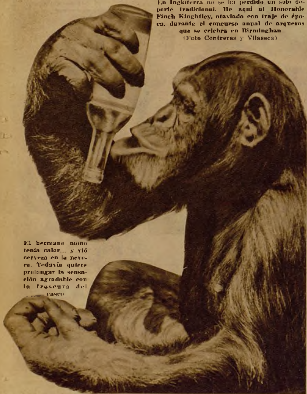
El hermano mono tenía calor... y vió cerveza en la nevera. Todavía quiere prolongar la sensación agradable con la frescura del casco.