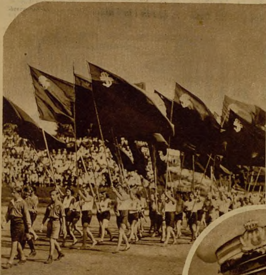
Imponente manifestación socialista celebrada en el estadio de Neukölln (Berlín) con motivo del aniversario de la declaración de la Gran Guerra, para pedir la reconciliación con Francia.