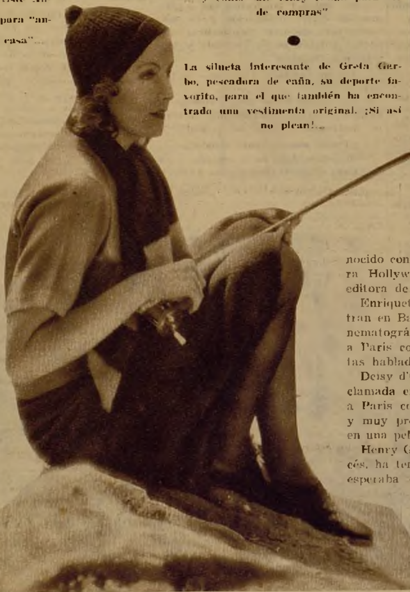
La silueta interesante de Greta Garbo, pescadora de caña, su deporte favorito, para el que también ha encontrado una vestimenta original. ¿Si así no plean!...