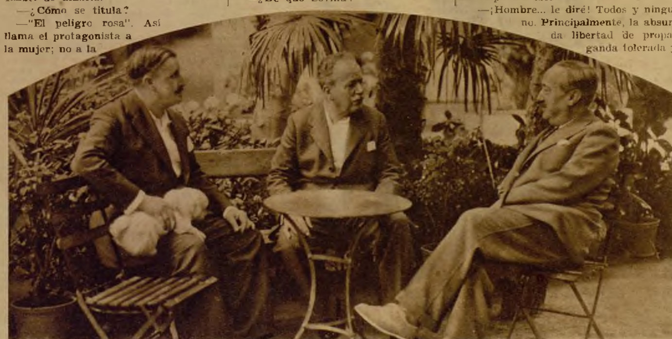
—Como no sabemos estar ociosos, no hemos perdido el tiempo.