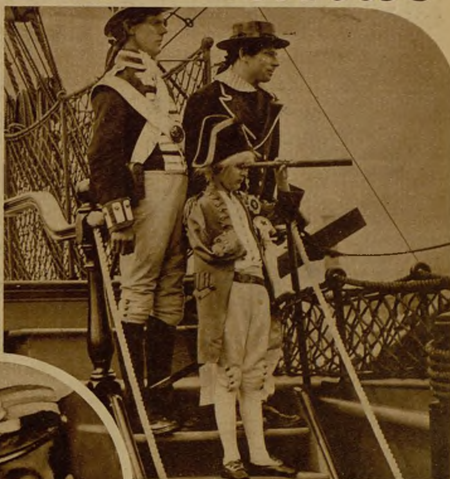
Durante la Gran Semana Naval inglesa en Portsmouth se reconstituyen escenas y personajes históricos. Esta joveneta de rubias gudejas representó, a bordo del "Victoria", al almirante Nelson.