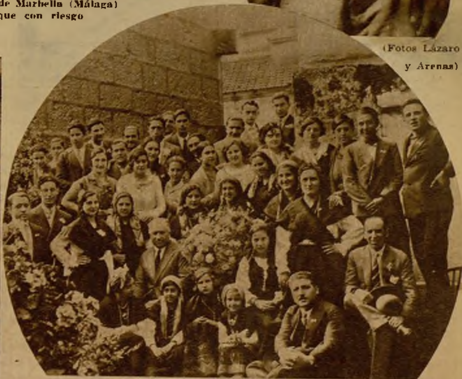
Grupo de distinguidas señoras, ataviadas con el traje típico gallego, que tomaron parte en el festival de la Bandera Regional celebrado en Cangas (Pontevedra)