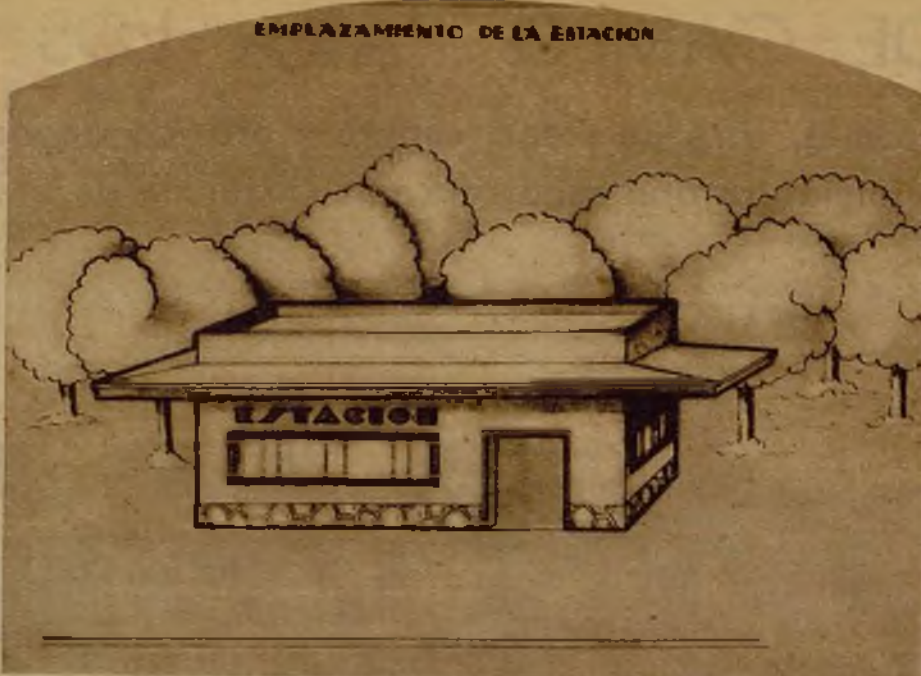
Modelo de estación para el tren en miniatura. El punto de salida del pequeño ferrocarril sería el lago grande