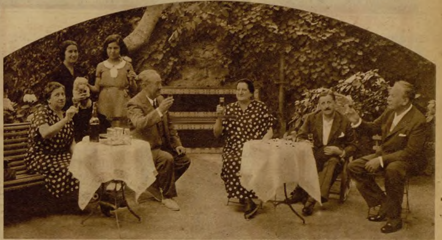
¡Una caña, por la República!

—"El peligro rosa". Así llama el protagonista a la mujer; no a la