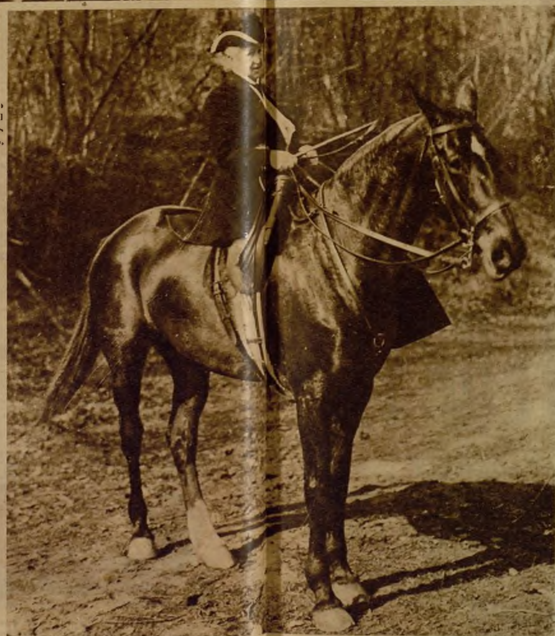
La duquesa de Uzès, presidenta de la Unión de Mujeres de Francia, que, a pesar de sus ochenta y dos años, emplea su vida de una manera activa entre la defensa del voto de la mujer y las cacerías. (Cada y mitad