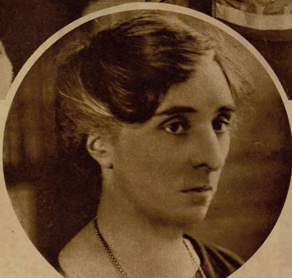
La abogada Marie Verone, el espíritu doctrinario del feminismo francés

La animadora de esta obra ha creado en sus oficinas un verdadero consultorio práctico, donde las mujeres de cualquier clase encuentran ayuda y consejos en todo momento. Allí se les busca trabajo, se escucha sus recriminaciones, se les orienta en todas las dificultades y se organizan campañas popula-