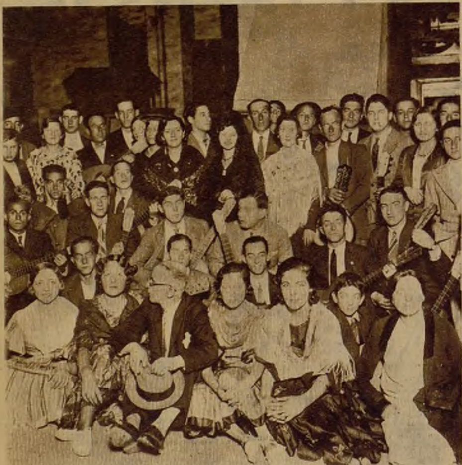
En el teatro Arriaga, de Bilbao, un grupo de obreros sin trabajo, con la cooperación de aplaudidos aficionados, ha celebrado un festival en beneficio propio y de los compañeros que se encuentran en igual situación