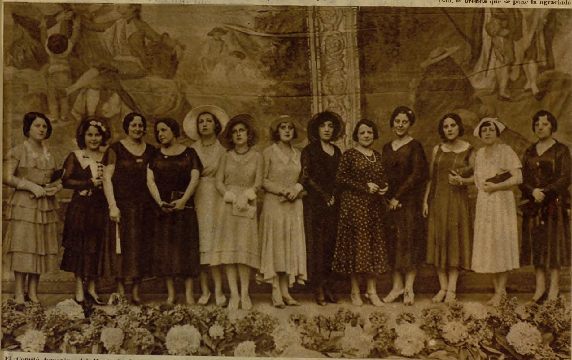
El Comité femenino del Montepío de Actores, organizador de la magnífica verbena celebrada anoche en el Retiro que tendrá su prosecución en la de hoy, con el sensacional aliciente de la proclamación de "Señorita República 1931". Las bellísimas artistas no se limitan a organizar. Actúan todas ellas en la fiesta, para solaz del público y nutrición de las cajas del Montepío.