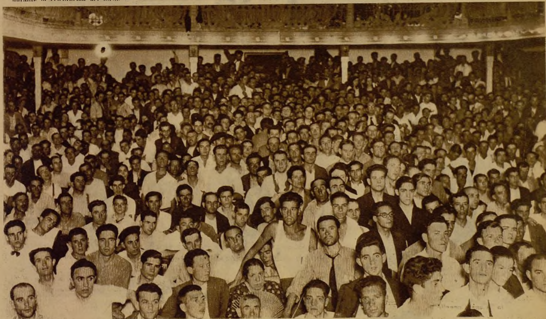
Concurrentes al mitin celebrado por el partido comunista en el teatro de Maravillas, a cuya terminación se promovió un tiroteo con la fuerza pública. En la refriega resultó un herido grave.