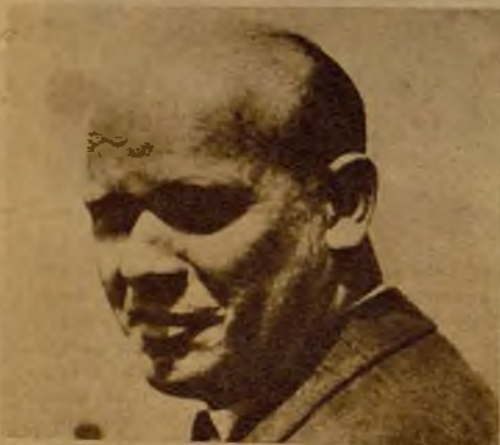
Ernst Thälmann, jefe de los comunistas alemanes