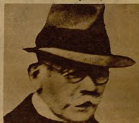
El doctor Hugenberg, jefe de los nacionalistas