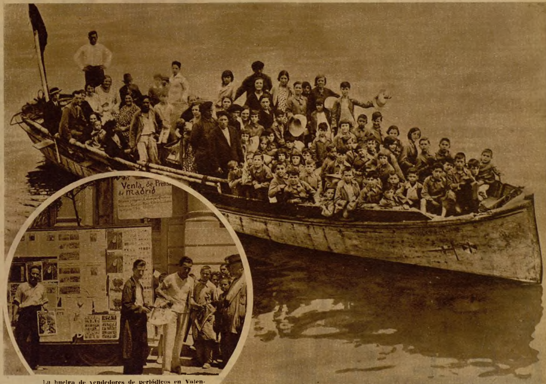
La huelga de vendedores de periódicos en Valencia y su "hoycott" a la Prensa forastera, especialmente a la de Madrid, han hecho que los correspondientes administrativos se encarguen directamente de la venta