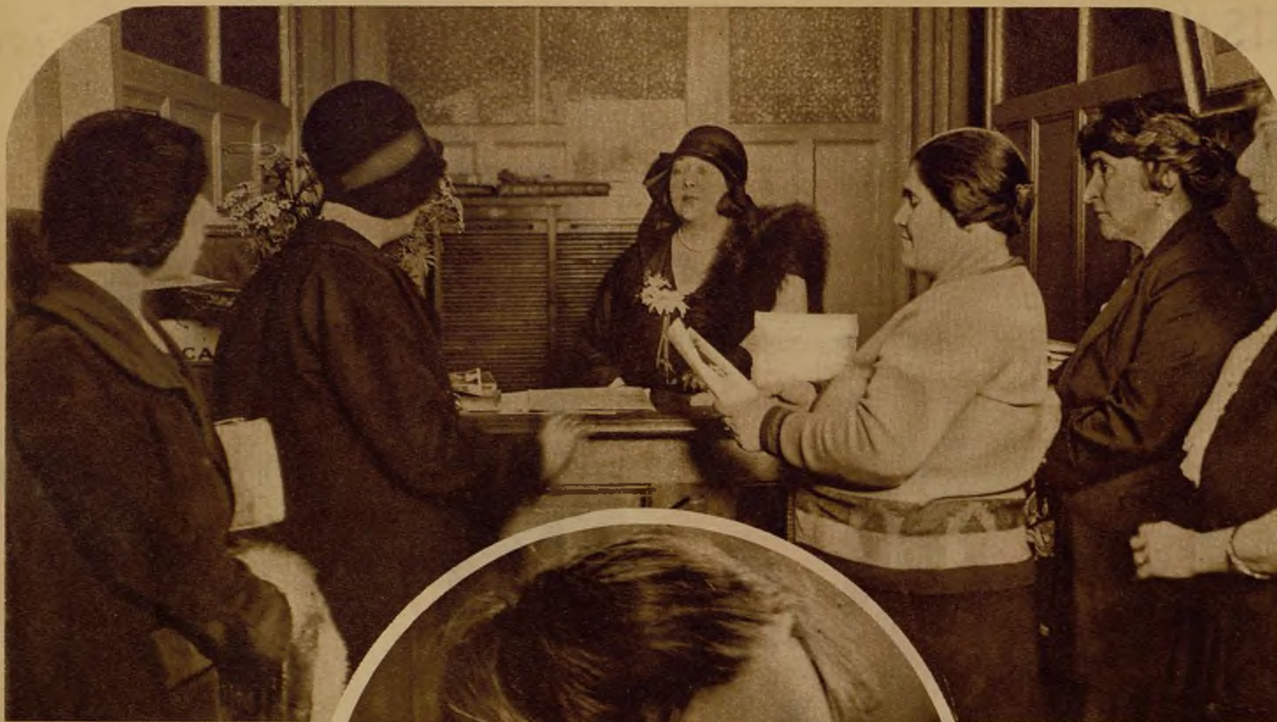
Consultorio de la ofi-