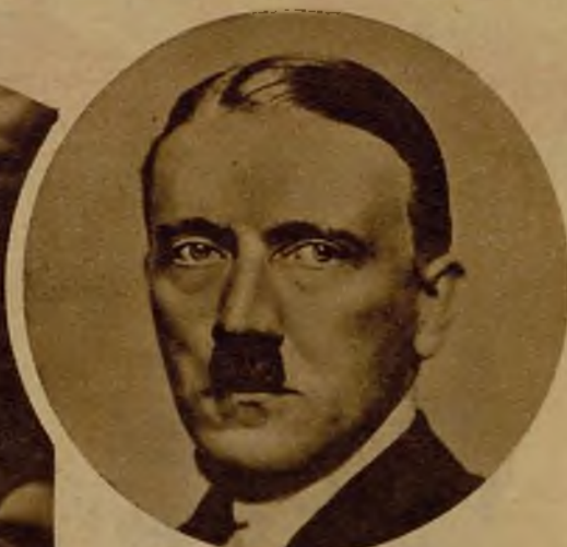
Hitler, jefe del partido nacional socialista alemán, partidario también de la disolución del Parlamento