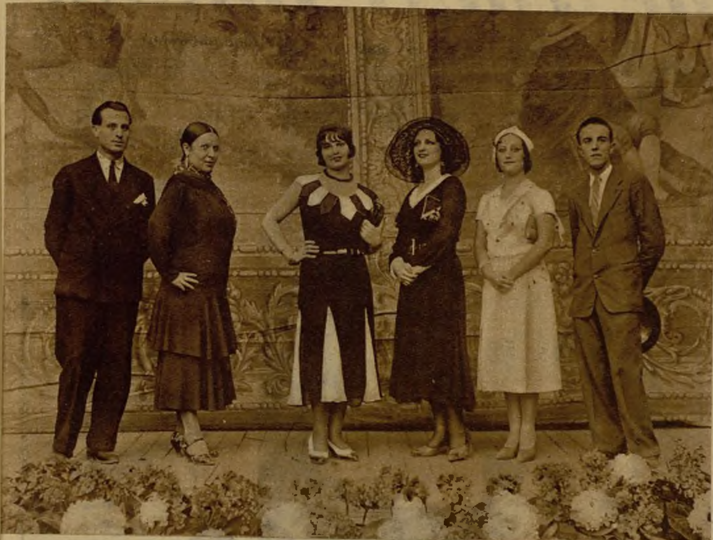
El Montepío de Actores celebró anoche su primer día de verbena en el Retiro, en la que el éxito se ha hecho ya tradicional. El público ha correspondido brillantemente al gentil requerimiento de las bellas artistas que tomaron parte en la velada, algunas de las cuales, con dos "ellos", aparecen en la foto.