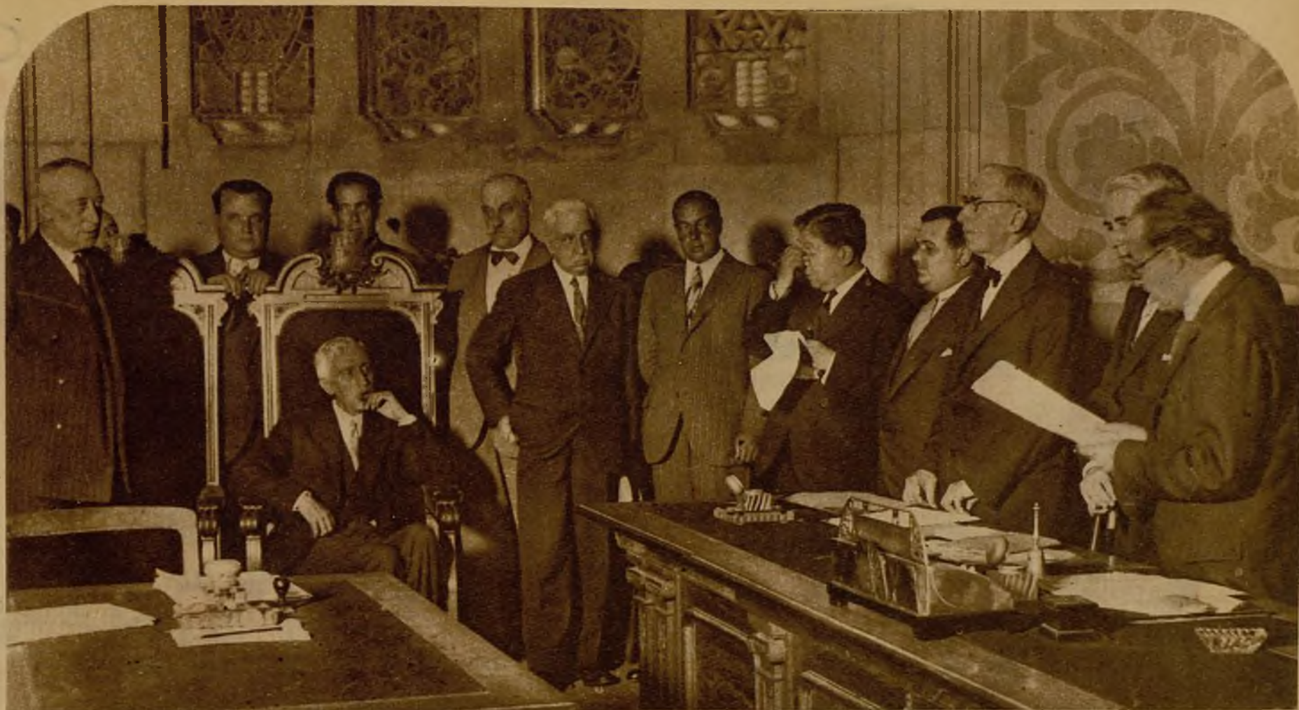
En el Palacio de Justicia, de Barcelona, se ha celebrado el escrutinio de la votación del Estatuto catalán. De 792.000 votos de que consta el Censo, cerca de 600.000 se manifestaron en favor del proyecto. El señor Mucá escuchando la lectura de los datos de la votación