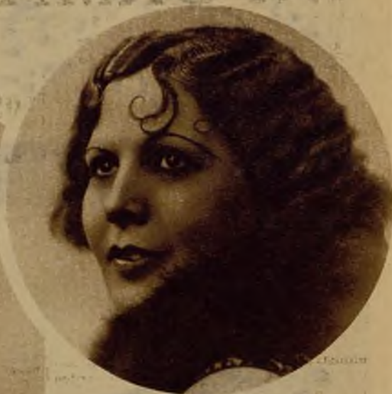
La notable artista "Salomé", maestra de bailarinas españolas, a quien se ha tributado un cariñoso homenaje de simpatía