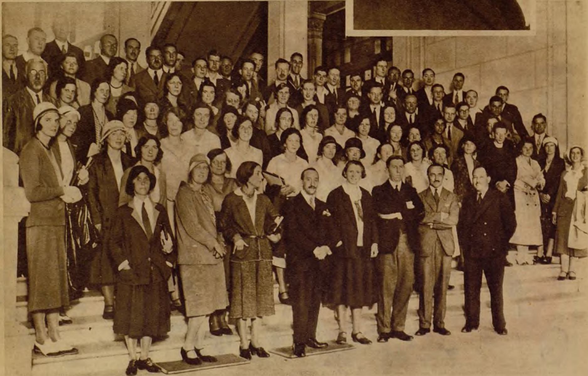
En Santander se celebra actualmente un curso de lengua castellana, al que asisten alumnos de diversas Universidades de Inglaterra, en el crecido número de que da idea la foto. La enseñanza está a cargo de profesores ingleses y españoles.