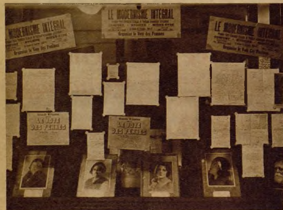
Los escaparates de una oficina feminista en París. Como se ve, no sólo es una excitación al voto por medio de proclamas. También se confía en la influencia de los retratos de las dirigentes.

¡Mesdames! ¡Adhèrent aujourd'hui même! Como se ve en este afiche de propaganda, las feministas reclaman la acción inmediata. ¡Ni un día, ni una hora más de espera!