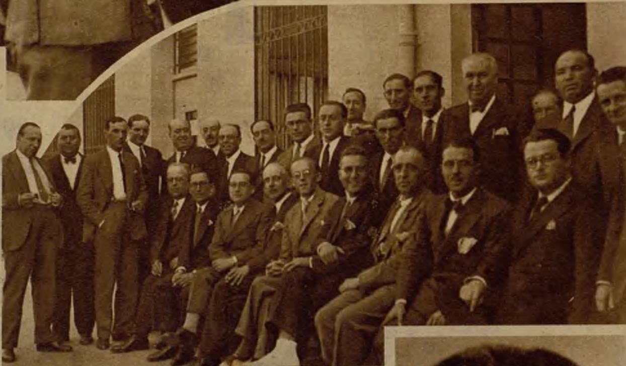
Grupo de delegados que han asistido a la Asamblea de empleados de Juntas de Obras de Puertos, que se ha celebrado en la Casa del Pueblo.