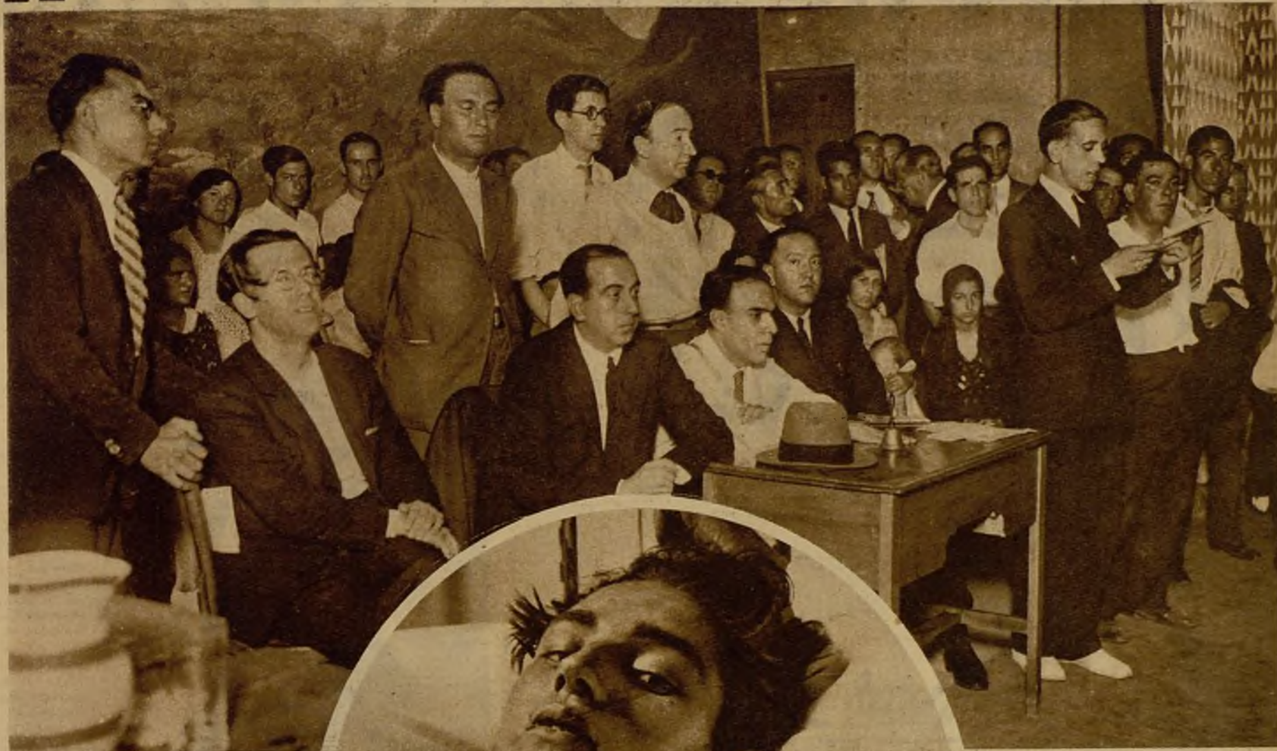
Elementos directivos del partido comunista, con los oradores que tomaron parte en el mitin del teatro Maravillas, durante la celebración del mismo.