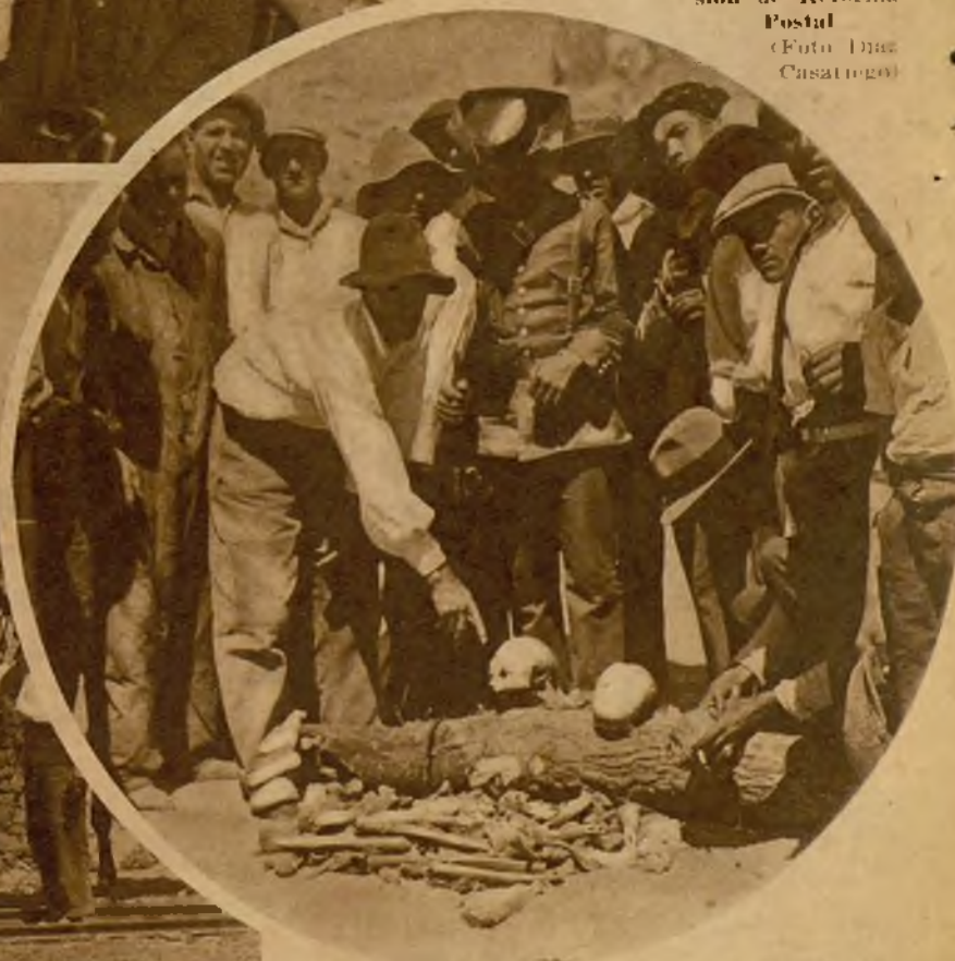
He aquí al obrero que descubrió los tres esqueletos explicando el hecho a la Guardia civil.