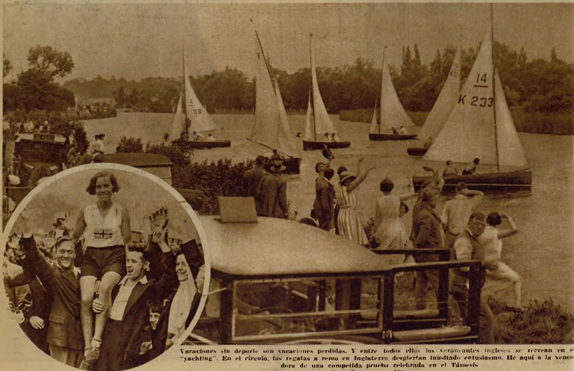
Vacaciones sin deporte son vacaciones perdidas. Y entre todos ellos los veraneantes ingleses se recrean en el "yachting". En el círculo, las regatas a remo en Inglaterra despiertan inusitado entusiasmo. He aquí a la vencedora de una competitiva prueba celebrada en el Támesis