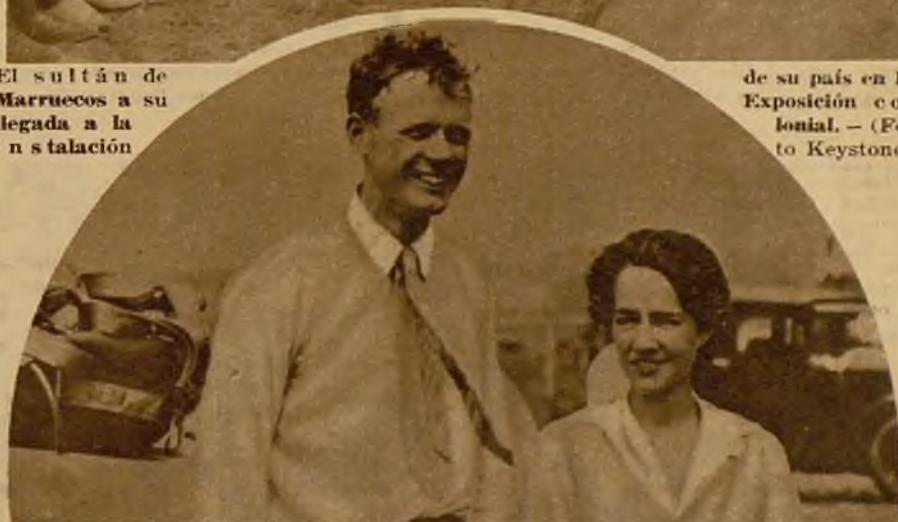
El famoso Charles Lindbergh, con su esposa, al aterrizar en Alaska, primera etapa de su "raid" de turismo al Japón