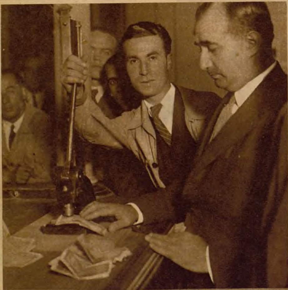
En el Banco de España ha empezado ayer la operación del estampillado de billetes que avala su circulación en el nuevo régimen político.