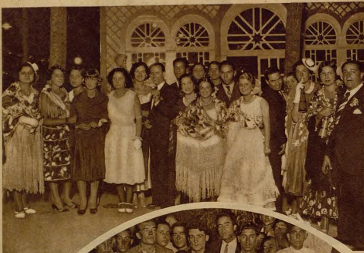
Grupo de bellas concurrentes a la verbena del Sporting Club, en La Coruña