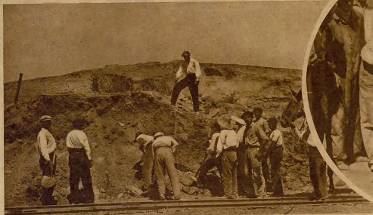
Este es el lugar de la Ciudad Universitaria en el que uno de los obreros que realizan obras de excavación halló tres esqueletos humanos, sobre cuyo descubrimiento practican investigaciones el Juzgado y la Policía.