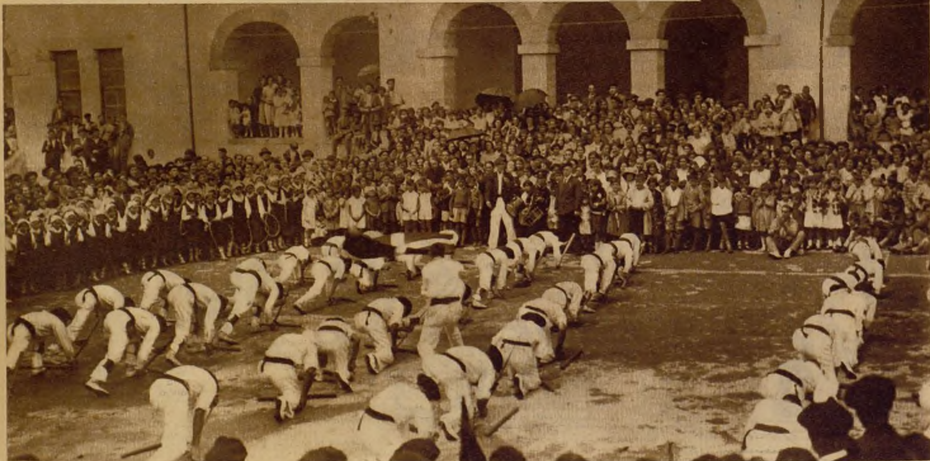
Pintoresco aspecto que ofrecía la plaza de Piencia (Vizcaya) durante la actuación de los "espatadantzaris" en el festejo con que se celebró la inauguración del "batzoki"