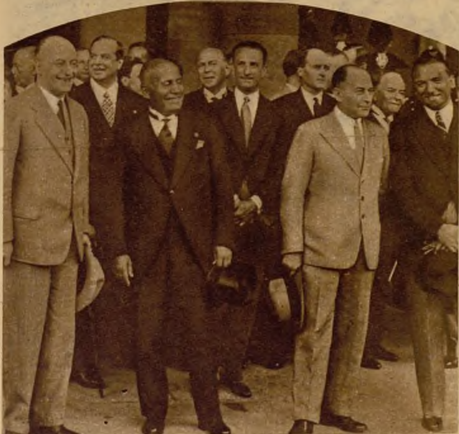
El señor Mussolini, acompañado del embajador de Alemania von Schubert, recibiendo a los señores Brüning y Curtius, a la llegada de éstos a Roma