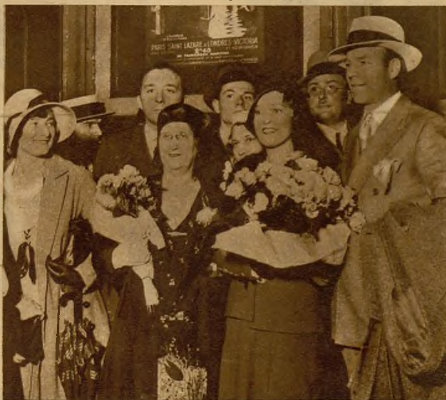
La bellísima estrella del cinema Jeannette Mac Donald ha llegado a París y ha declarado, con la más bella de sus sonrisas, que el único objeto de su viaje a Europa es deshacer cierta leyenda en la que se hacía intervenir a una princesa europea