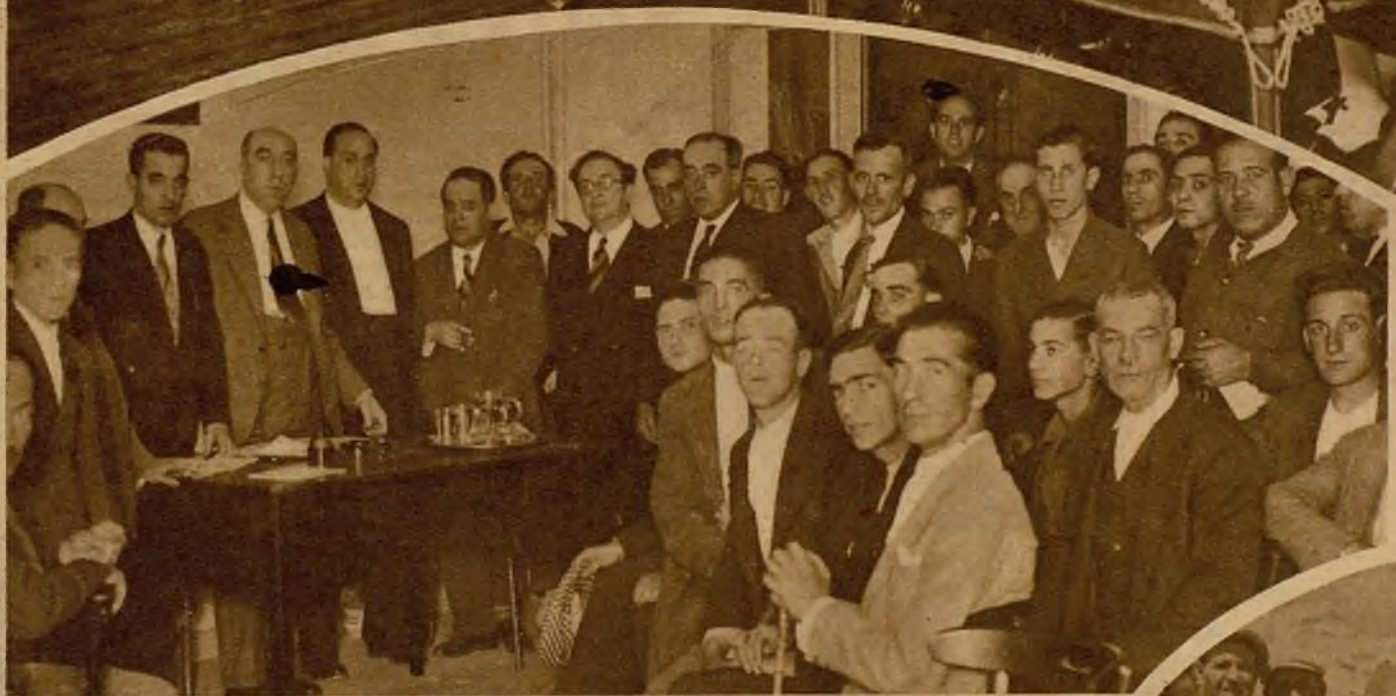
Grupo de concurrentes a la sesión inaugural de la Asamblea del partido federal, que se celebra actualmente.