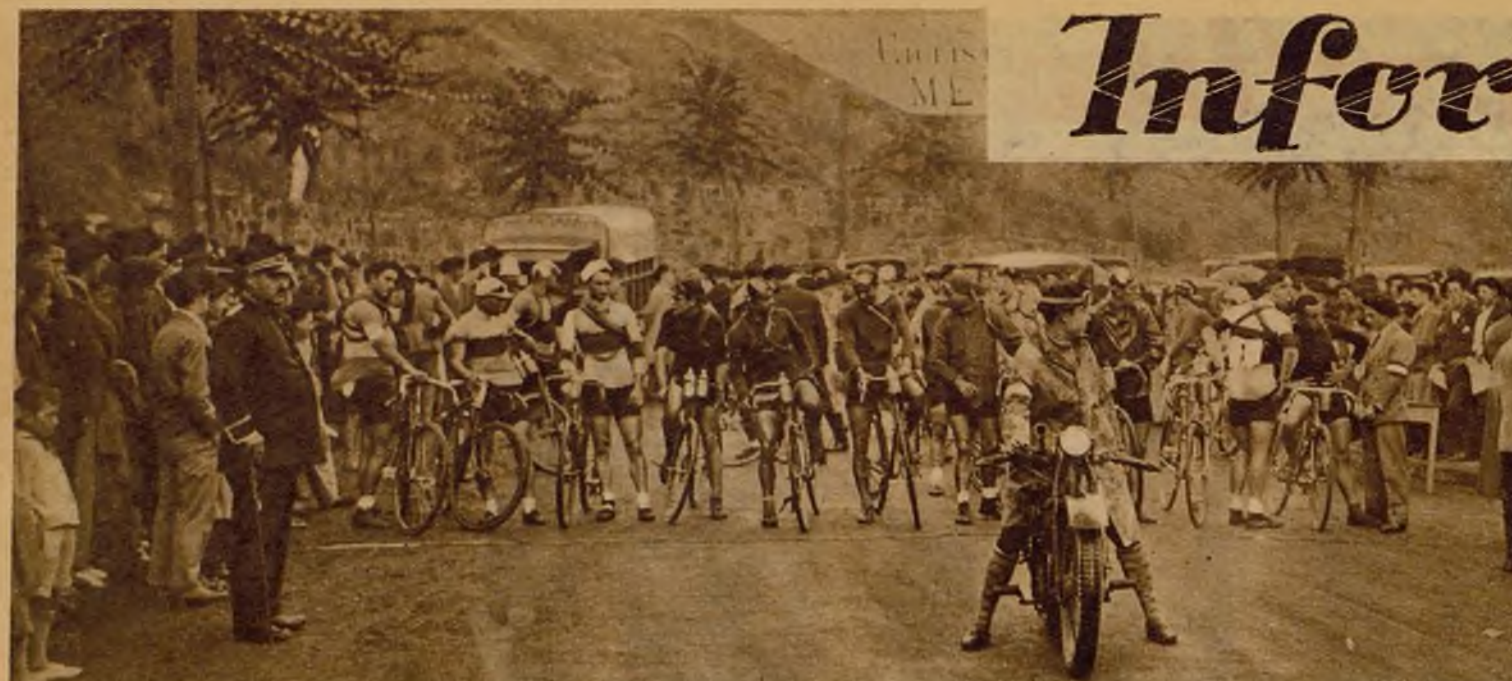
El Gran Premio ciclista de Vizcaya ha constituido una interesantísima prueba nacional. He aquí a los participantes preparados para iniciar la carrera.