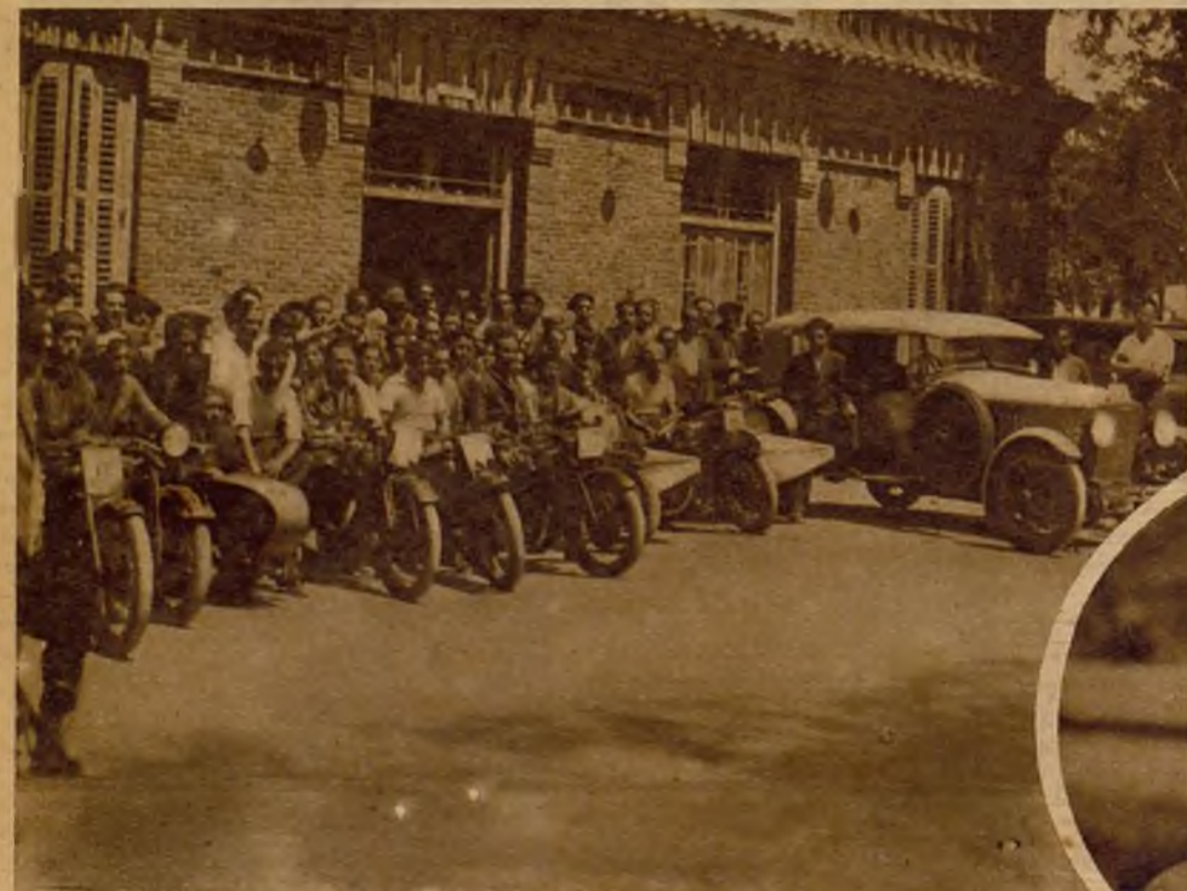
Los concursantes que se clasifican en la prueba de regularidad alineados después de la llegada ante el chalet del Club organizador, en la Cuesta de las Perdices.