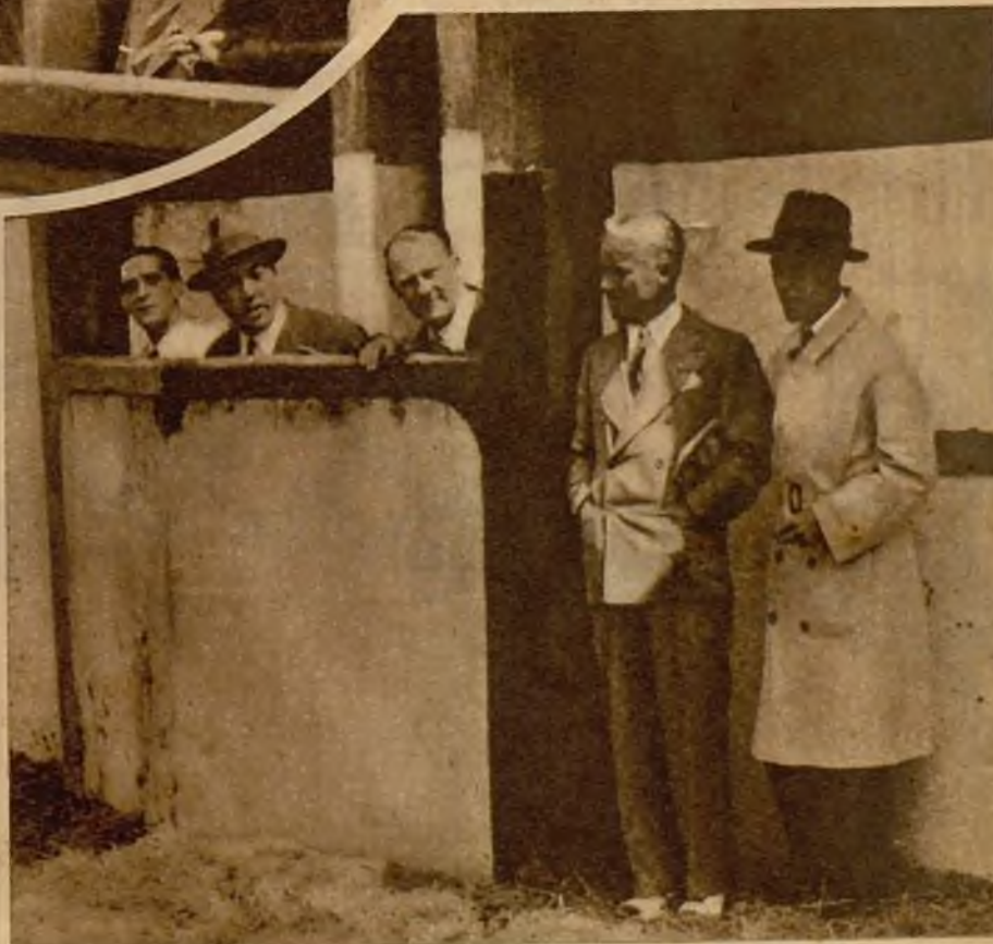
Junto al burladero, Chaplin presencia el sorteo y se admira de todo. Es para él una película completamente nueva