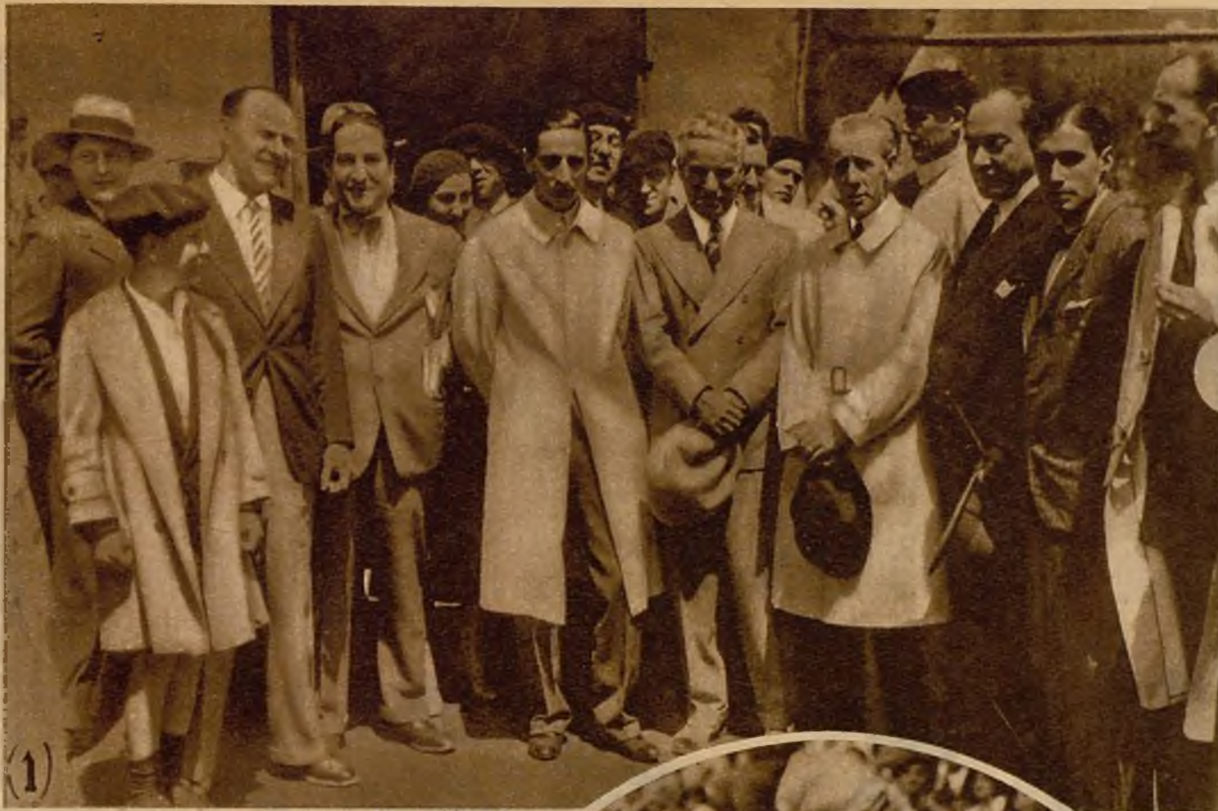
(1) Charlot se ha puesto muy contento. Ha venido a la plaza para aplaudir a los toreros y el público le aplaude a él. Y quiere decir ¡ole!, pero le sale un ¡hurra!