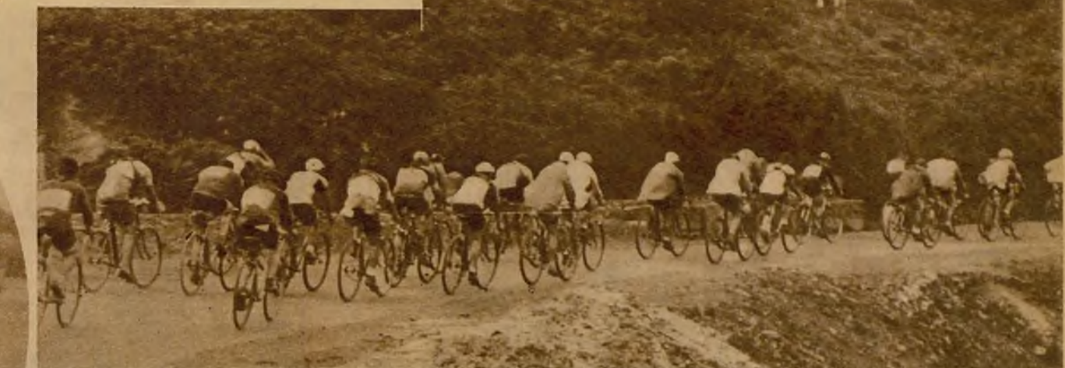
Todavía no se han producido connexiones en el pelotón de corredores, que rueda compacto y optimista por la Cuesta del Diablo.