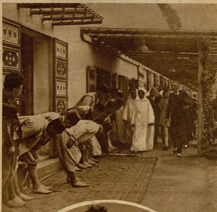
El sultán de Marruecos a su llegada a la estación