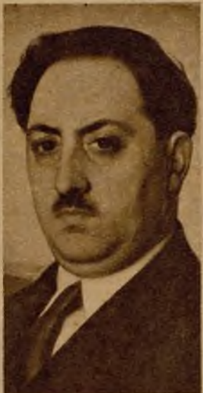
Alfonso Hernández Catá

En la nave magnífica de este libro—alarde prócer de suntuosidad editorial—se han embarcado los pasajeros más diversos y autónomos. Ninguna conexión existe entre unos y otros viajeros. La vida de cada uno es independiente de las vidas de los otros, sin un solo punto de tangencia durante la travesía. Toda la gente de a bordo compone, no obstante, una misma grey. Lo dice el nombre del navío. Hemos aquí a merced del oleaje—de fuera y de dentro—, en un barco abarrotado de urates. Dicho queda que en este manicomio rige inflexiblemente el sistema celular. Para cada loco, una cabina; para cada vida, una narración aparte.