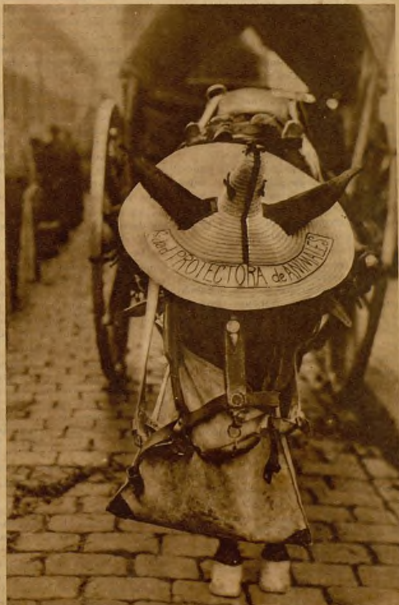
El sufrido caballo, trabajador a pleno sol, no sufre ya la ineluctable de los rayos ardientes. Si fuera capaz de exteriorizarse no podría menos de expresar su agradecimiento: "Esto de la Sociedad Protectora de Animales está bien..."