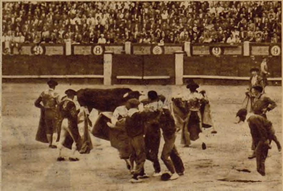
La cogida de "Maravillas" no tuvo consecuencias, y el muchacho, que se negó a ingresar en la enfermería, continuó la lidia hasta el final