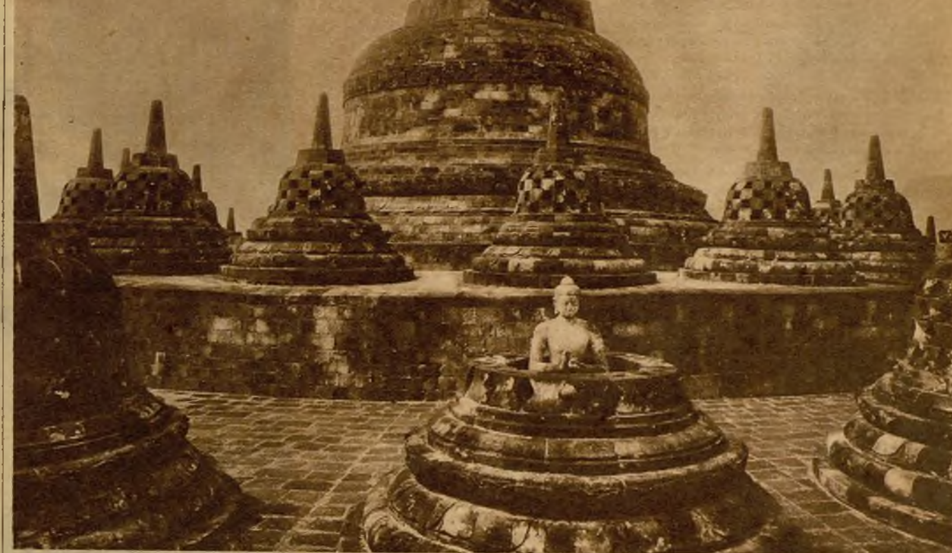
Una de las cuatrocientas estatuas de Buda que adornan el monumental templo Borobudur de Java

siquiera por el accidente del amor. Sus mujeres son esbeltas y flexibles, y sonríen siempre con una sonrisa graciosa enseñando los dientes. En realidad, no tienen muchos motivos para sonreír, porque todos los grandes trabajos—la reparación de caminos, el acarreo de materiales de construcción, el ir al mercado...— todos, las son encomendados a ellas. Sin embargo, con una sonrisa sempiterna se unen al hombre que las agrada, y con esta misma sonrisa se separan de él el día en que deciden no vivir juntos, ya porque se han cansado el uno del otro. La pasión es cosa desconocida para los javaneses. Un crimen pasional les dejaría tan perplejos como si el cielo se hubiera derrumbado sobre sus cabezas.