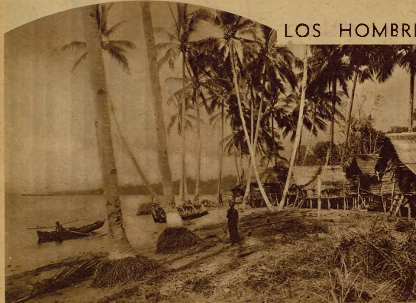
Este poblado de las Indias holandesas, con sus casas de caña rodeadas de palmeras, parece una bella decoración escénica.

La comida era espléndida. Primeros sardinas, salchichas, "mixed-pickles", aceitunas, y, por fin, un plato de arroz con ilustraciones, varias clases de carne, cangrejos, aves, huevos... Dos camareros y un criado más para atender al ventilador que acompañaba la conversación con su zumbido. De postre, mangos y papais. Con el café, bizcochos para la "señora" y cigarrillos que ende ágilmente uno de los criados color de tabaco en los labios de los caballeros. Hace mucho calor y es preciso evitar los menores movimientos que suponen un trabajo penosísimo.