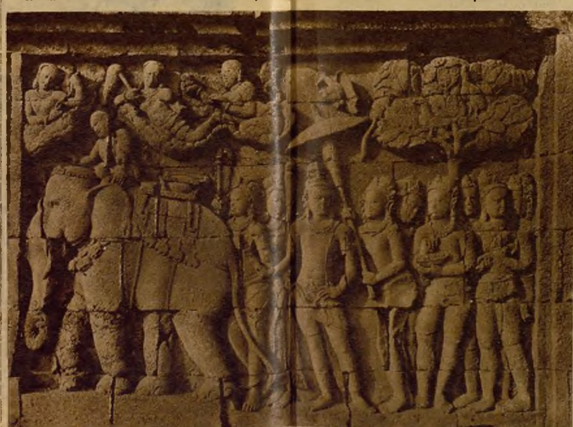
Uno de los mil quinientos valiosísimos relieves que existen en el famoso templo Borobudur