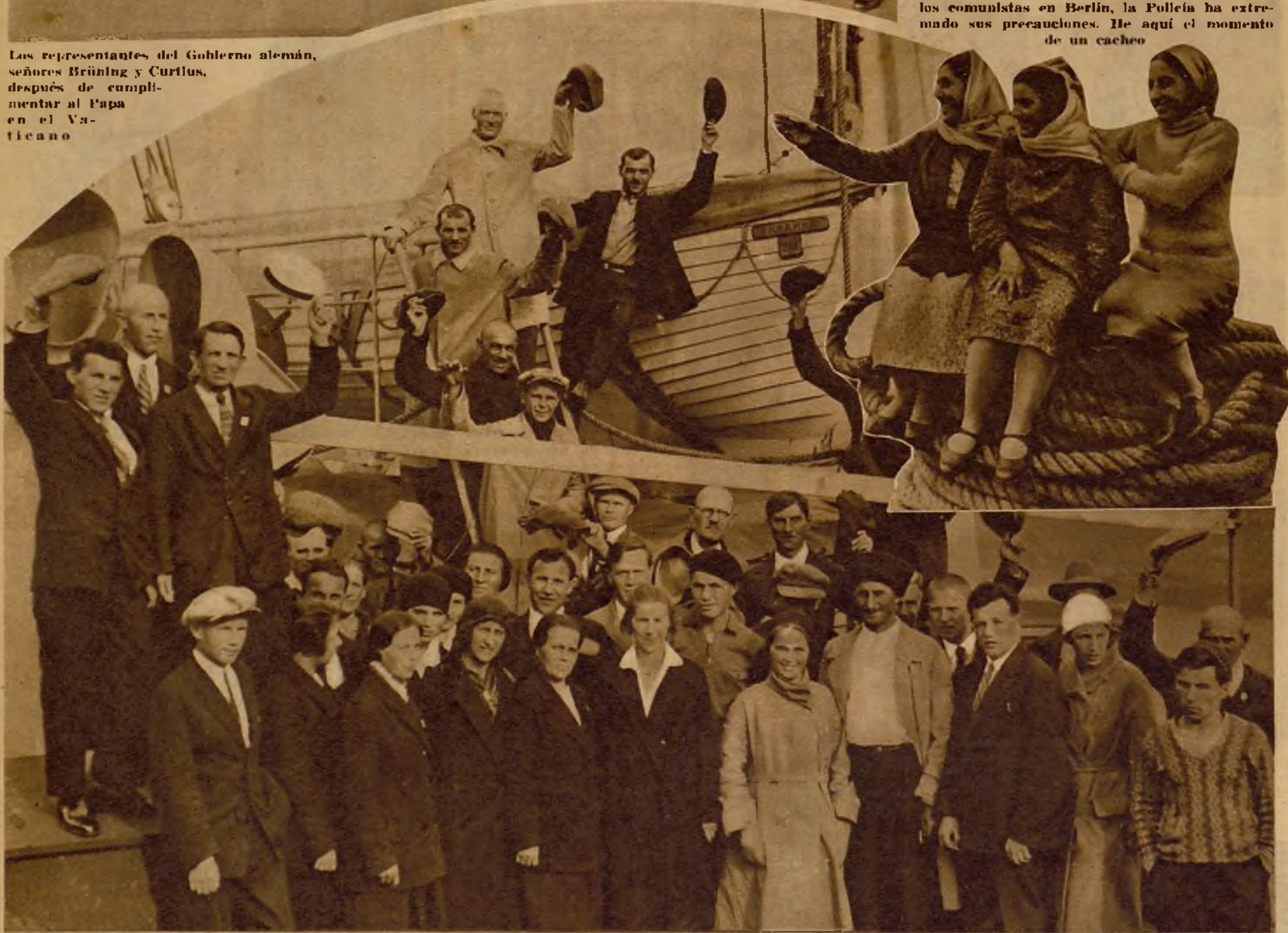
El Gobierno de los Soviets, para premiar los méritos de los obreros que más eficazmente han contribuido con su laboriosidad al cumplimiento del plan quinquenal, ha enviado a 350, a bordo del "Ukraine", a recorrer los estados europeos. Actualmente se encuentran en Londres, donde visitan los grandes centros de manufacturas y estudian métodos de trabajo. En silueta, tres obreras rusas seleccionadas, a bordo del "Ukraine"