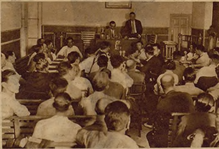
Sesión inaugural del Congreso de empleados y obreros del Monopolio de Petróleos, que se celebra actualmente, con asistencia de delegaciones de toda España