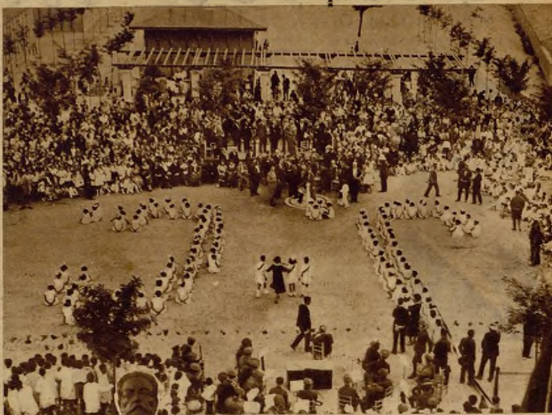
Los niños de las escuelas públicas durante sus vistosos ejercicios