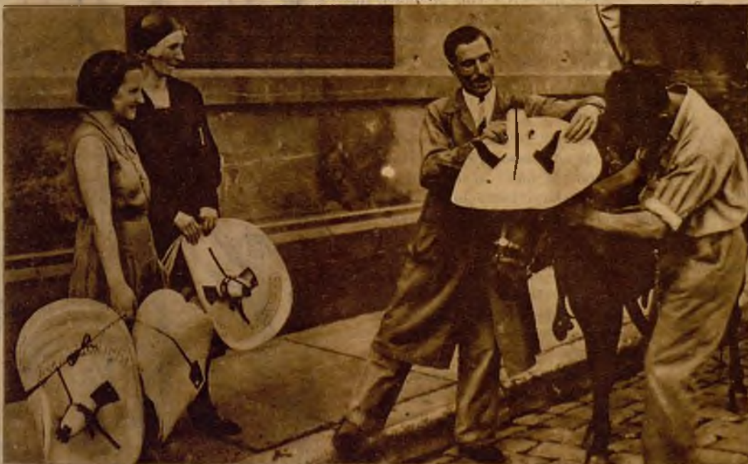
La Sociedad Protectora de Animales de Barcelona ha donado gran número de sombreros de palma para los caballos que hacen el transporte de verduras en los mercados. Las mismas señoras de la Directiva reparten los "quitasoles" a los caballerías