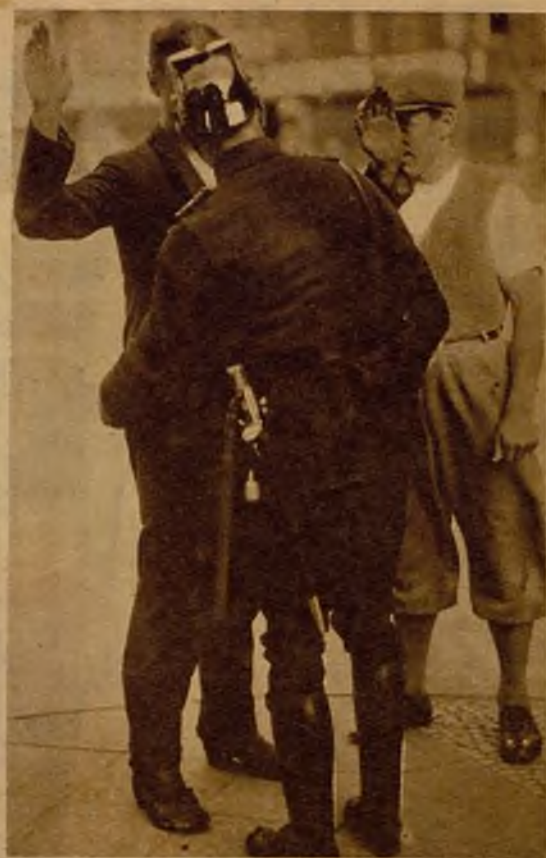
Con motivo de los disturbios promovidos por los comunistas en Berlín, la Policía ha extremado sus precauciones. He aquí el momento de un cacheo