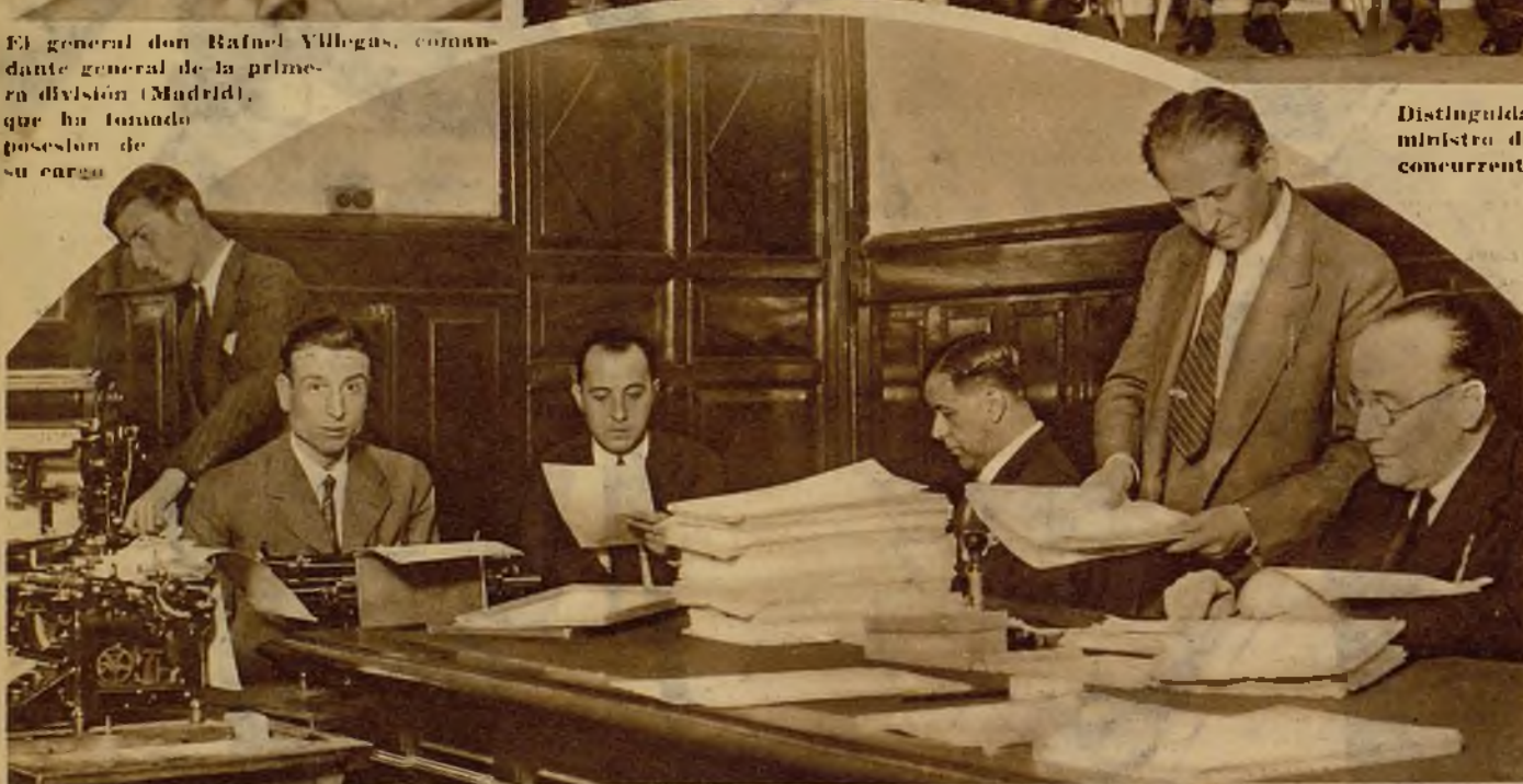
Los funcionarios que forman la oficina auxiliar de la Comisión Investigadora de los sucesos de Sevilla, que funciona en el Congreso, ordenando los datos que han servido de base a los parlamentarios para la emisión del dictamen