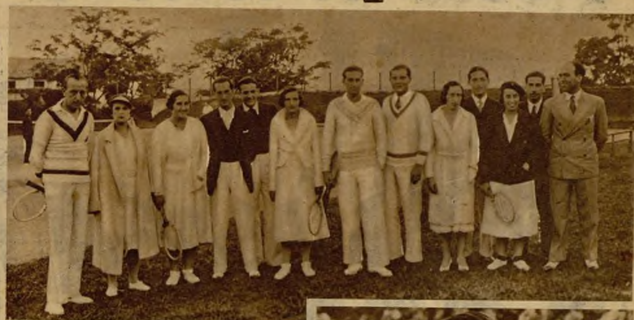
La distinguida tenista santanderina señora de Pons, ganadora del campeonato femenino individual