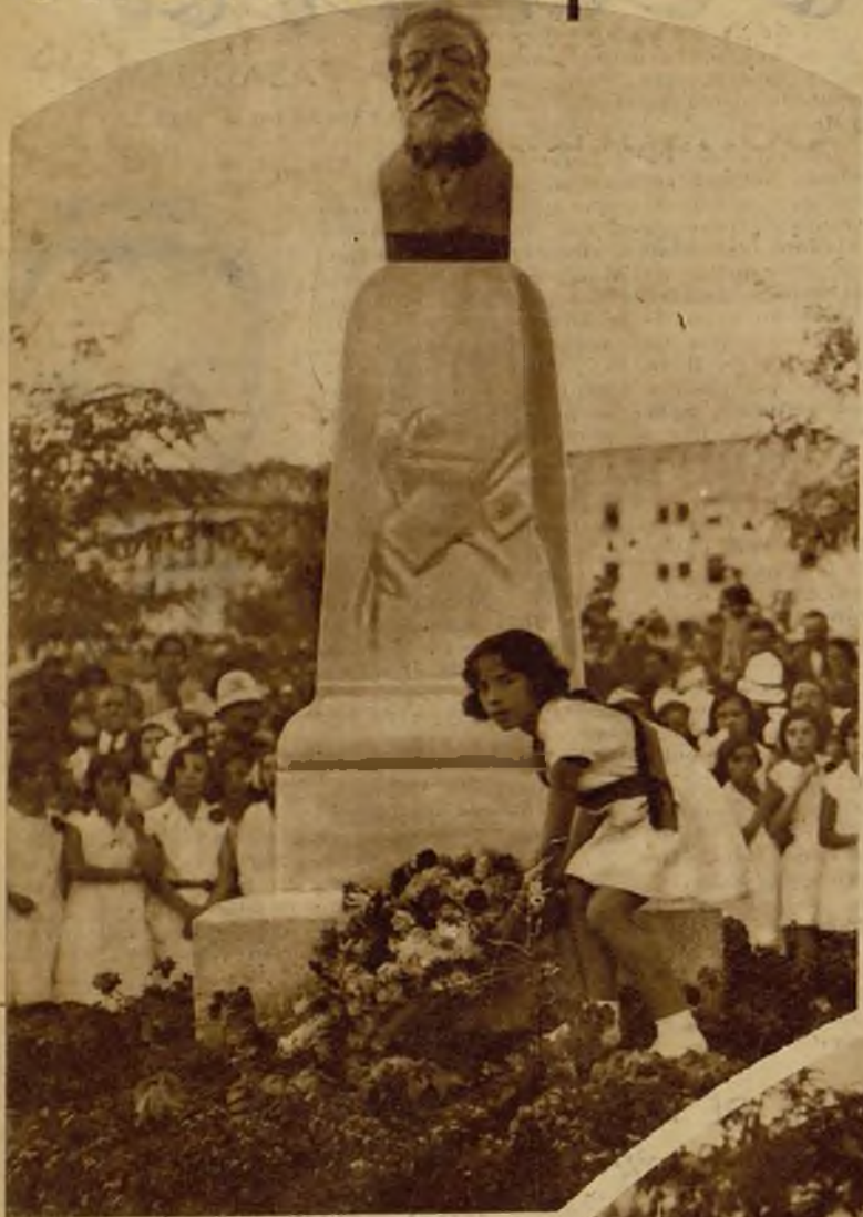
El busto erigido al ilustre filósofo en los jardines de su nombre. Al pie del pedestal, una niña de las escuelas públicas, en nombre de sus compañeras, tributa a la memoria de Costa la ofrenda de un ramo de flores

Las niñas de las escuelas del distrito de la Latina durante el homenaje rendido ayer a Joaquín Costa, en los jardines de su nombre, con motivo del descubrimiento del busto del inmortal pensador aragonés