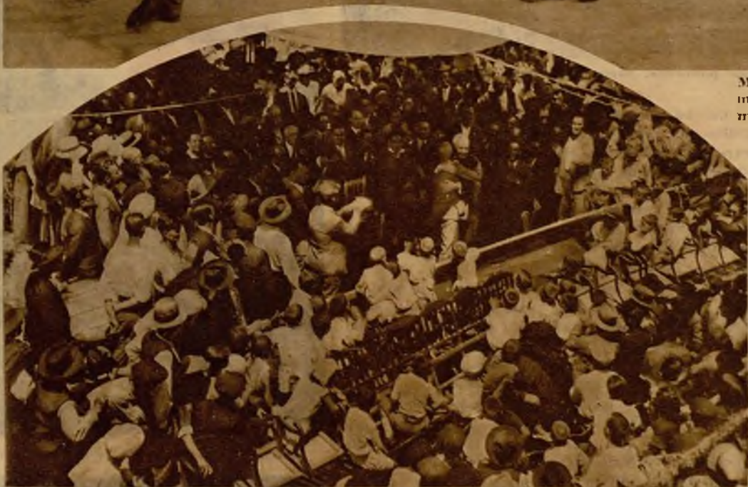
El abrazo fraternal de los alcaldes de Valencia y Denia, en esta última ciudad, en uno de los actos de propaganda del Estatuto valenciano. Al final de éstos se celebró una Asamblea en la que se acordó pedir a las Cortes la anexión de Denia a Valencia