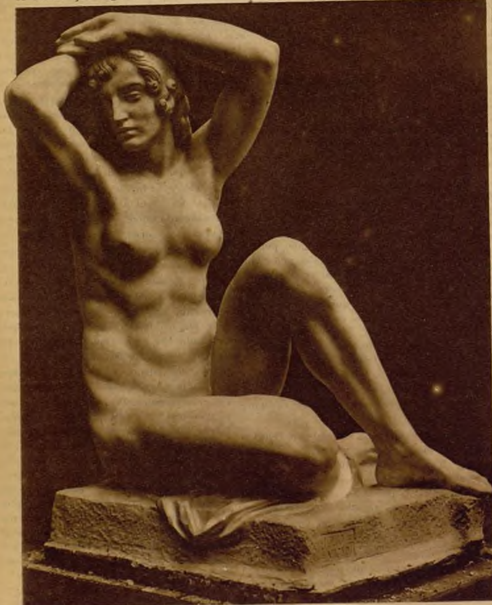
"Amanecer", escultura de Julio Vicent premiada con primera medalla en la Exposición Nacional

contacto de las manos del escultor. Vestidas, sus ropas caen suavemente, plegadas en líneas verticales. Sus miembros se apoyan en algo, buscando el equilibrio. Jamás darán sensación de fatiga. Tienen una extraña emoción de reposo absoluto.