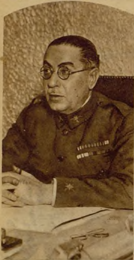
El general don Rafael Villegas, comandante general de la primera división (Madrid), que ha tomado posesión de su cargo