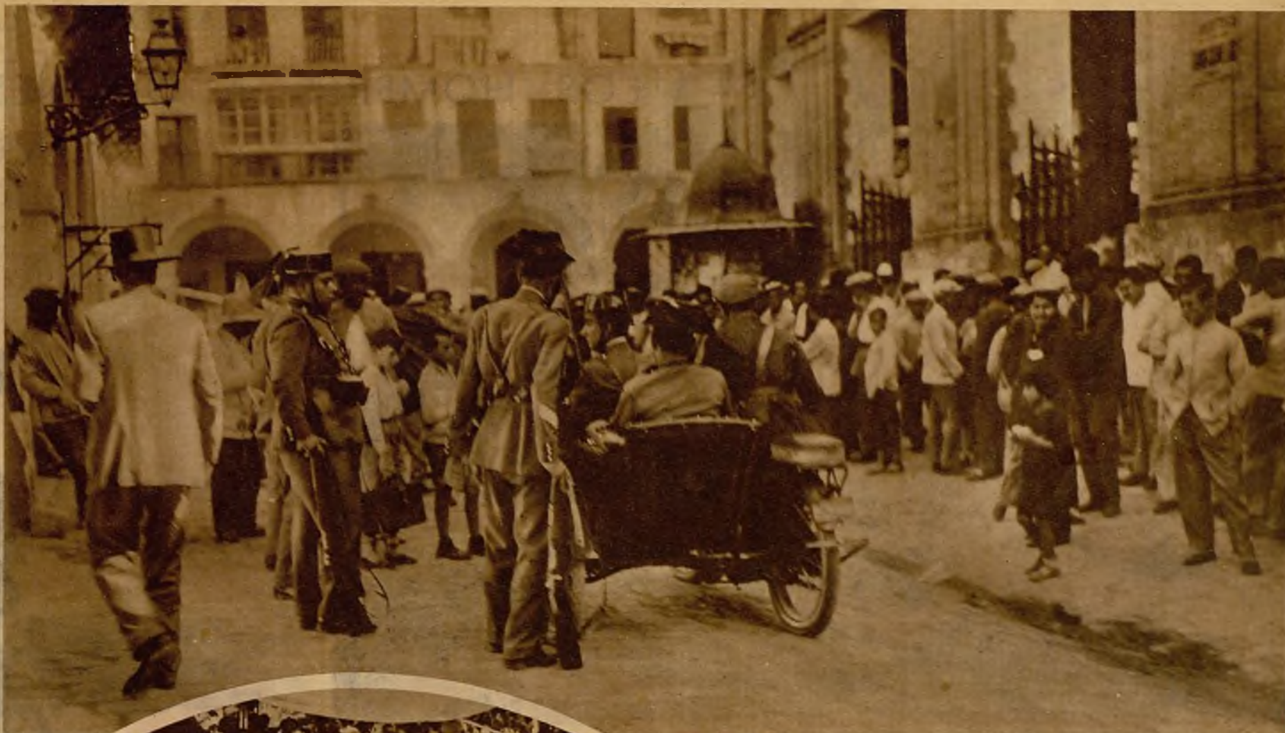
Merced a las previsiones de la autoridad, parece abortada totalmente el movimiento revolucionario que se pretendía plantear en Córdoba. La foto muestra a la Guardia civil disolviendo pacíficamente a un grupo de huelguistas en la plaza de Sáenz Peña