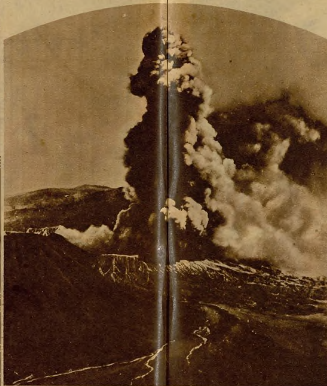
En las Indias holandesas los volcanes aparecen constantemente en medio de tapices de flores.