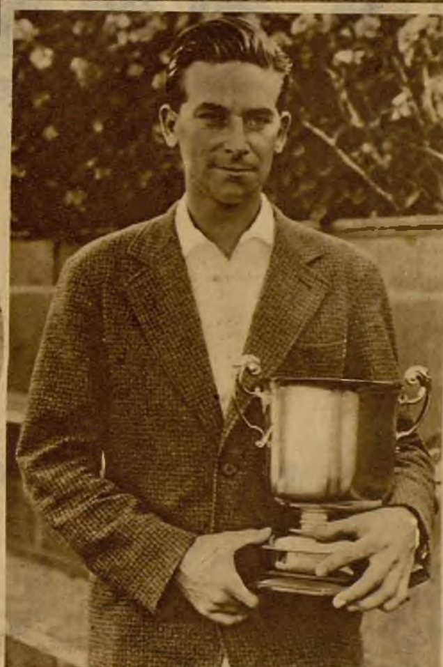
El notable jugador de "tennis" francés Lesueur, vencedor en el campeonato individual masculino en el concurso celebrado en Santander