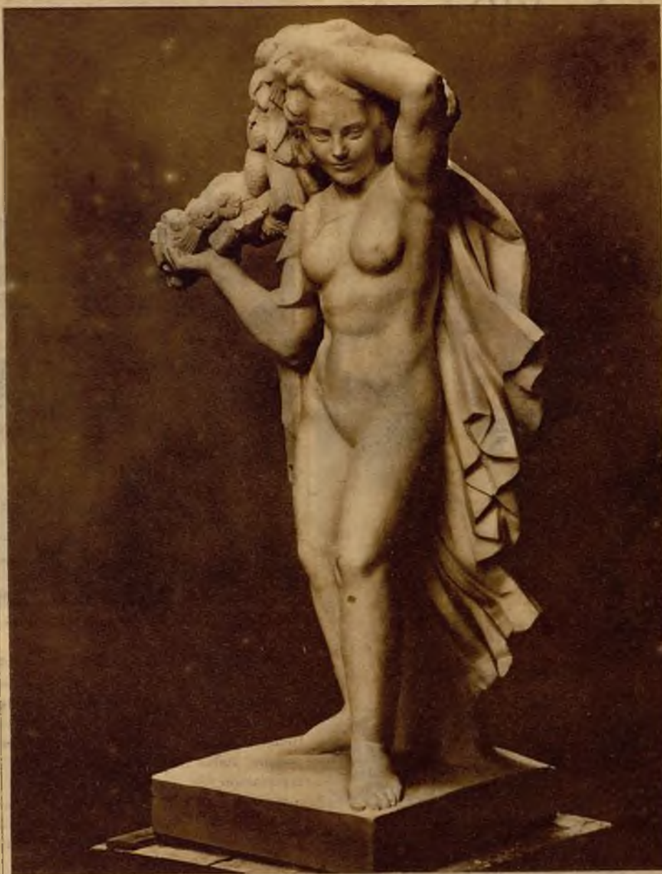
Boceto de la estatua premiada con 15.000 pesetas en el concurso nacional de Escultura organizado por el ministerio de Instrucción Pública y Bellas Artes, obra del notable escultor valenciano Julio Vicent

"Amanecer" iniciaba esa ruta. La estatua premiada en el Concurso Nacional, última obra de Vicent, es ya la confirmación de aquel anhelo. No ha perdido la dulce serenidad de las estatuas griegas. No ha olvidado la exuberancia carnal de las formas divinizadas. Pero es una mujer del día. El patrón clásico ha encarnado en una mujer de hoy. Más magra, más recia, menos blanda, evoca la estructura vigorosa de las muchachas que fortalecen sus músculos con el deporte y cuidan su salud al aire libre. Es también más dinámica. El clasicismo fué ante todo serenidad y quietud. La escultura actual puede ser serenidad y movimiento. Por eso entonces predominaba la forma exterior. Y ahora la forma se quiere ponderar con el volumen. Aquellas bellezas parecían ajenas a los agentes atmosféricos. Desnudas sobre los pedestales, en pleno goce de la Naturaleza, no se estremecían al