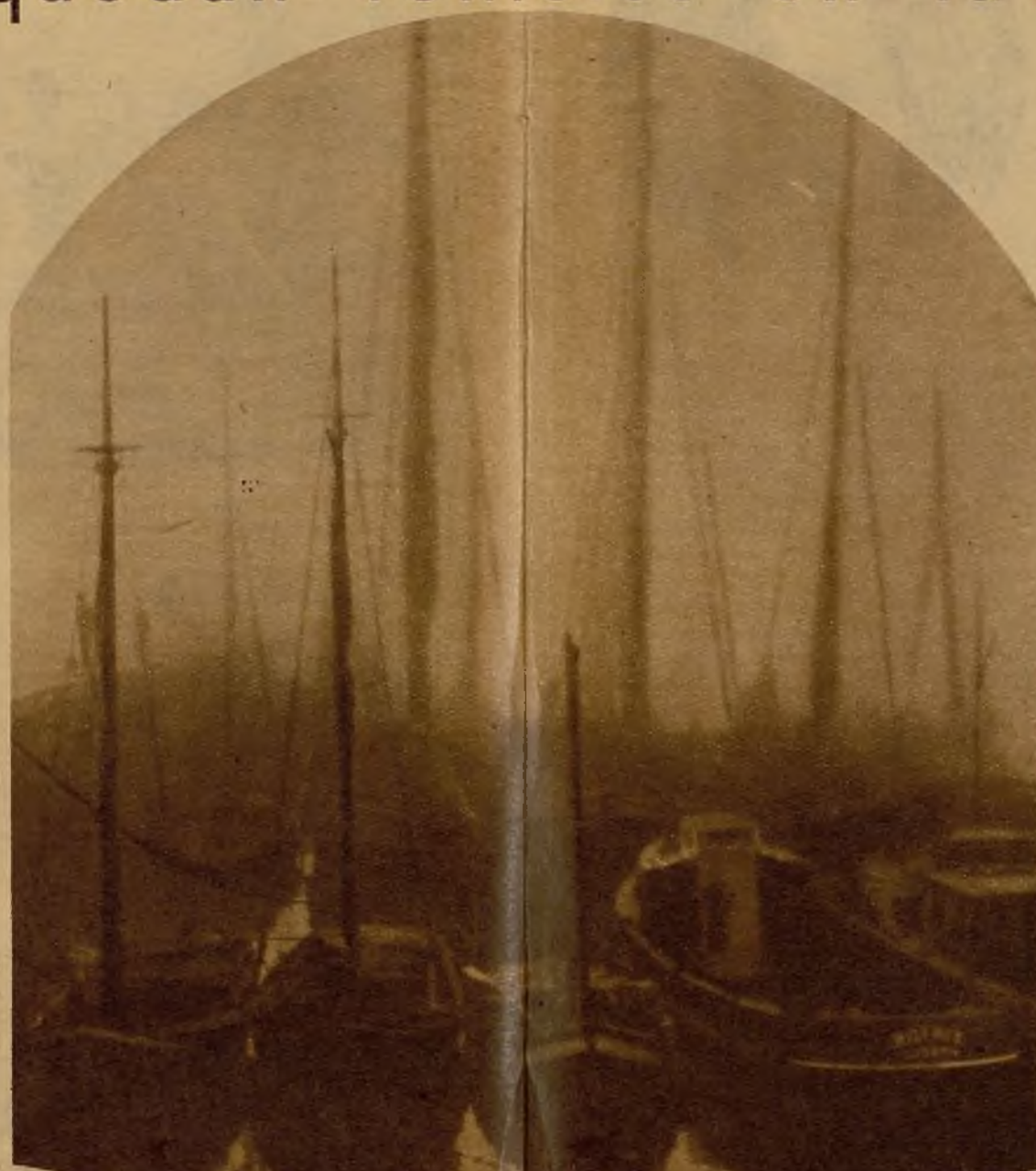
Las barcas "varinas" envueltas por la niebla

Ovar es una población de gran importancia, y porque en ese punto de la costa se establecieron desde tiempos inmemoriales los fenicios, se llaman hoy "varinos", corrupción de "ovarinos". La población, si fuera depurada de los inevitables edificios modernos, del más absurdo mal gusto, sería, hoy aún, la reproducción exacta de la vieja aldea fenicia. Casas de madera, algunas sobre pilotes de madera, como en las ciudades leucistas, edificadas en largas teorías al borde de la playa inmensa, una abigarrada decoración primitiva de pinturas en rojo vivo, y, sobre todo, azul violeta y amarillo, decoración que se reproduce en las barcas, de airoas líneas curvas, como rajadas de sandía rezumantes, dan al pueblo carácter magnífico y superan todo estudio arqueológico, to-