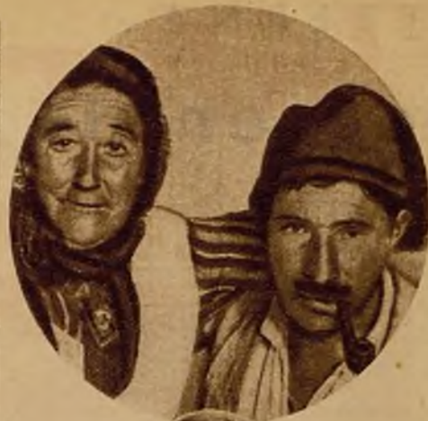
Un alegre matrimonio de Ovar

Gente lista, llena de argucia y sentido práctico, los "varinos" han reconocido, sin embargo, desde los primeros días, que no bastaba su labor piscatoria para el abastecimiento, no sólo de la enorme ciudad de Lisboa, sino también de todo el interior del país. Los pesqueros a vapor, grandes buques modernos, aparecían como rivales invencibles y los "varinos" han decidido, no darles combate, pero aprovecharse de la propia fuerza de sus enemigos. Y al mismo tiempo en que algunos pocos hombres sentaban plaza en las campañas de los grandes pesqueros, los demás, hombres, mujeres, chiquillos, en hormiguero gigante, se aprestaban a vaciarles los flancos cargados de pescado reluciente, llevándolo a los más lejanos