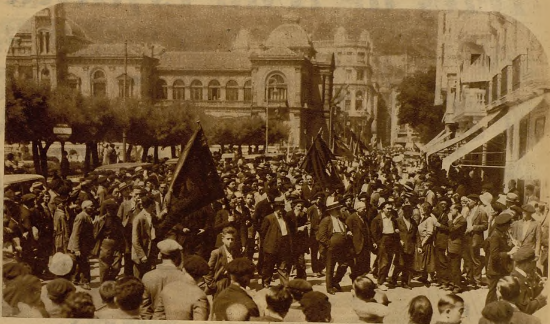
El pueblo patentizó entusiastamente su adhesión a la República formando la nutrida procesión cívica que recorrió las calles de la capital guipuzcoana, en conmemoración del Pacto, en el que quedaron afirmados los principios fundamentales del nuevo régimen