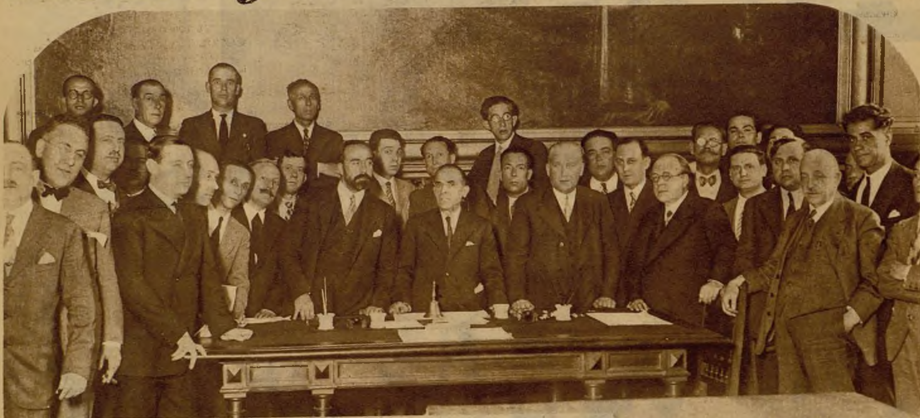
Los ministros y diputados socialistas reunidos en el Congreso para tratar de su actuación en los interesantes debates que se plantearán en breve en la Cámara