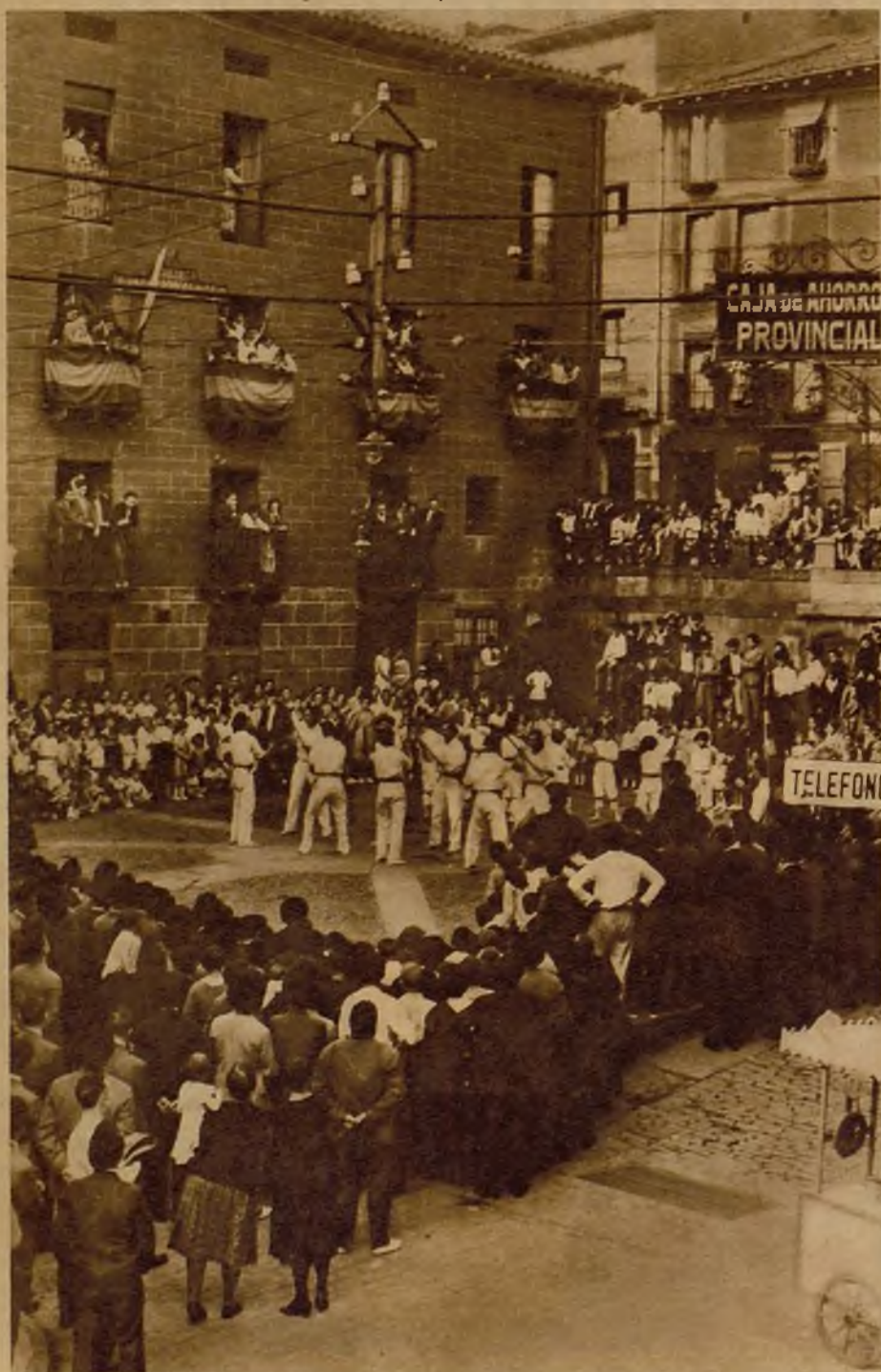
Pintoresco aspecto que presentaba la plaza de Elbar durante los bailes típicos ejecutados por los espatadantzaris con motivo de las fiestas patronales