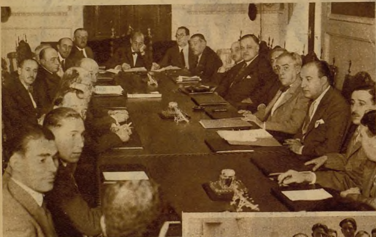
Los delegados que actúan en la Conferencia minera, reunidos en el Ministerio de Trabajo, con el personal especializado del departamento