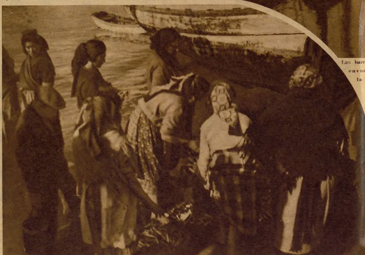
Repartiendo el pescado en la playa. Las mujeres recogen para sí el sobrante de la venta

da prolongada investigación histórica y étnica. ¿Estamos en la costa portuguesa o en Fenicia, esa Fenicia que dicen muerta?