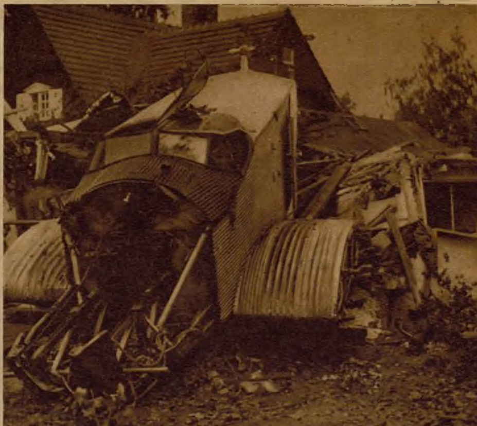
Cuando el avión que aparece en la foto realizaba vuelos de entrenamiento para realizar la vuelta a Alemania, entró en barrena e irrumpió en el interior de una granja, donde a más de las enormes averías que se le observan, causó destrozos de consideración en la finca.