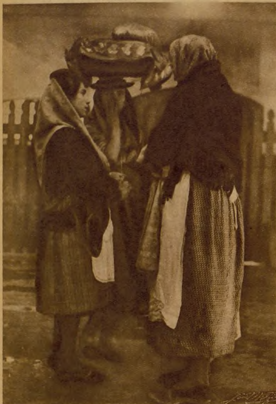
Ejemplares tipos de "varinas" recogidos por el objetivo del fotógrafo en el mercado de la pesca

En busca de una raza muerta... ¿Viven aún los fenicios?