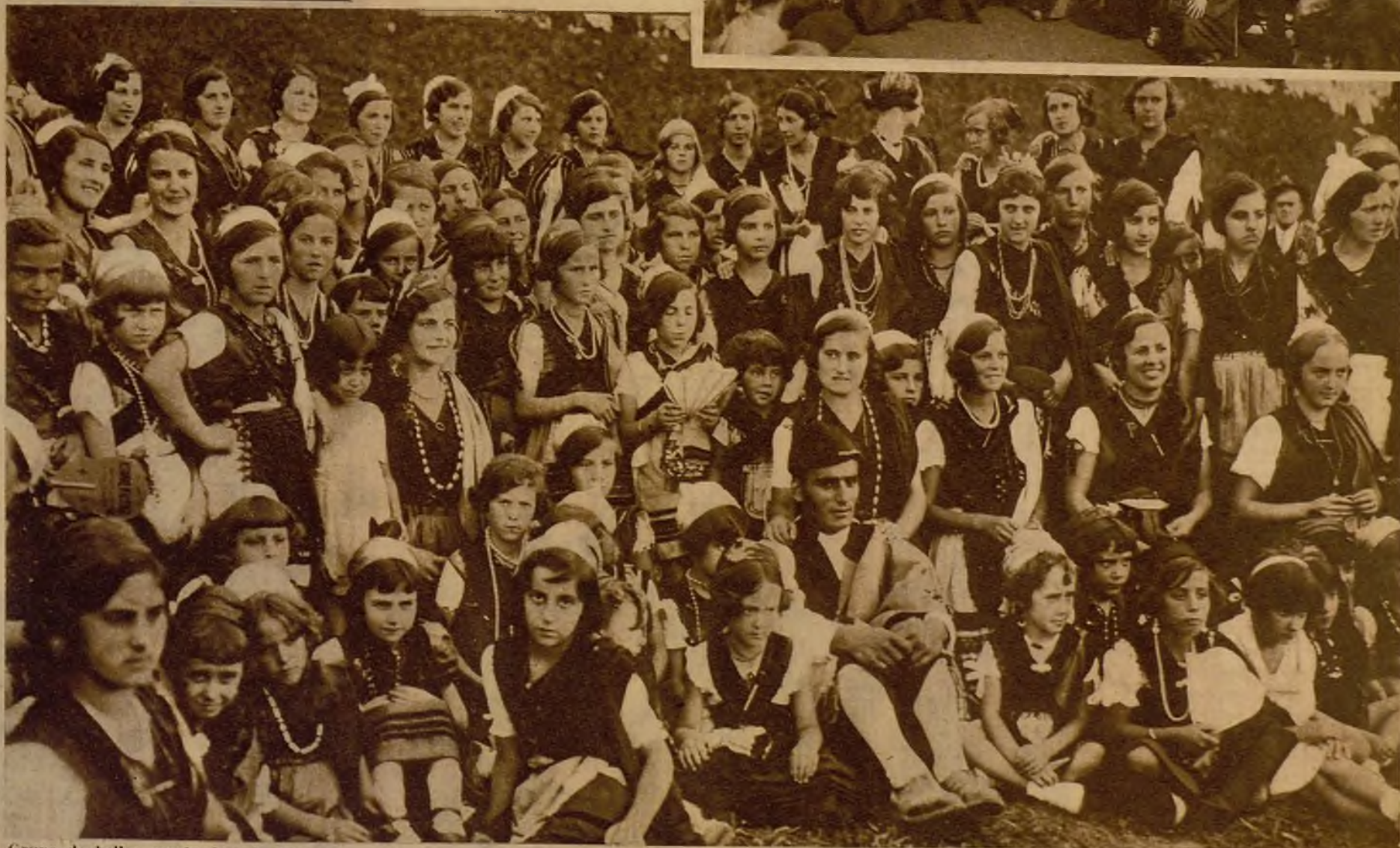
Grupo de bellas muchachas de Llanes (Oviedo) ataviadas con el traje típico regional, que tomaron parte en unas sugestivas fiestas, con motivo de los actos en honor del Patrón, San Roque