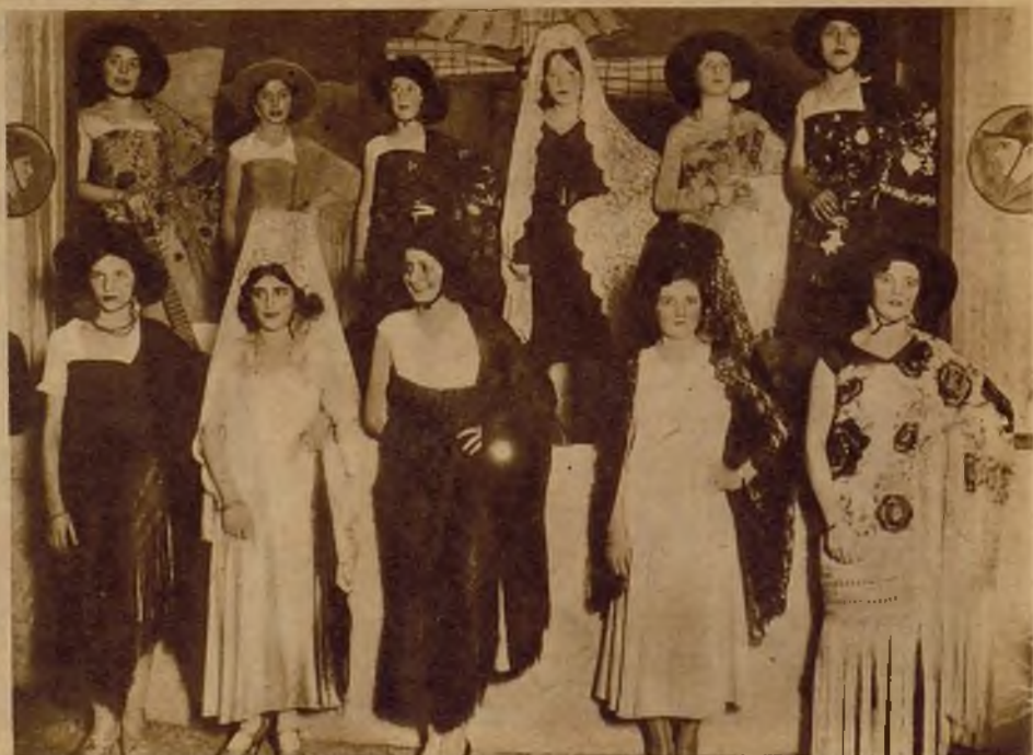
Bellas señoritas concurrentes al concurso de atavío femenino andaluz, celebrado lucidamente en Córdoba con motivo de las fiestas en honor de la Virgen de los Fueros