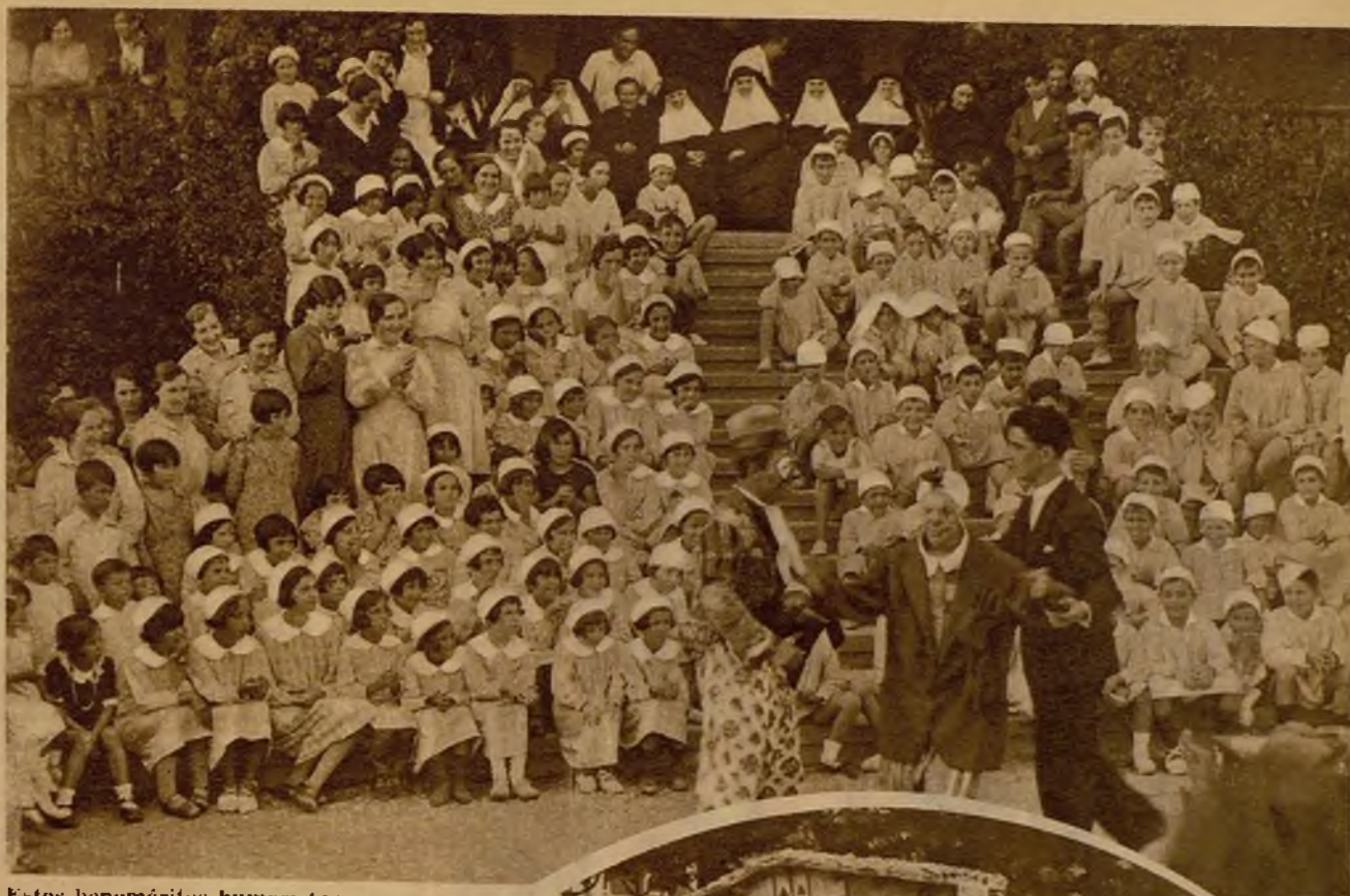
Estos beneméritos humoristas actúan gratuitamente ante los regorijados chicos que forman la colonia escolar de Pedernales, que veranean en Bilbao