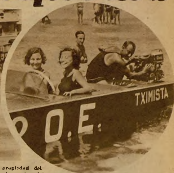
"Tximista", canoa propiedad del señor Batlló, momentos antes de empezar la prueba