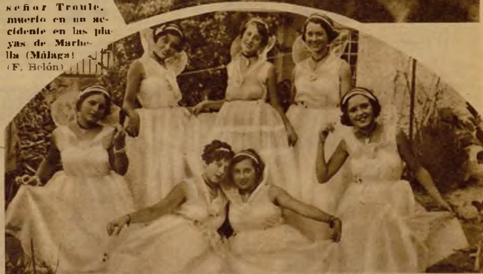
Este grupo de angelicales señoritas cartageneras tomó parte en un cotillón que se celebró con motivo de las fiestas verbeneras en la playa de Los Nietos