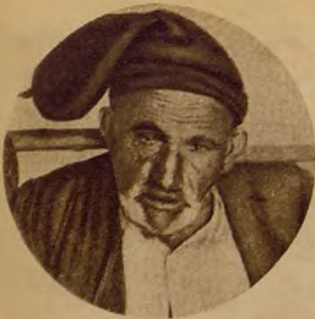
Viejo mendigo "varino"