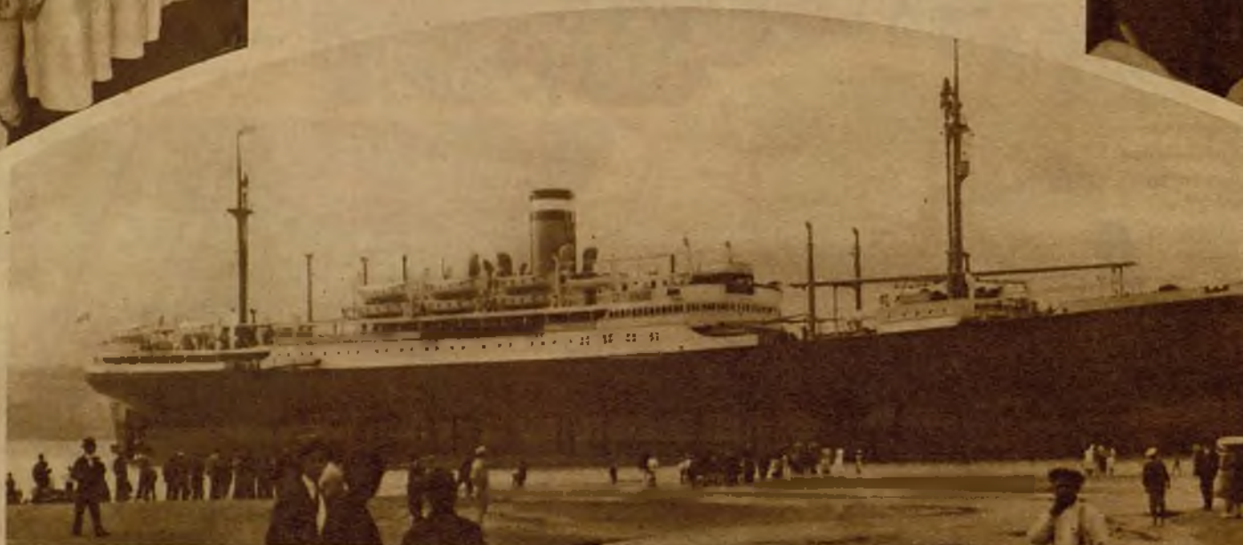
El vapor portugués "General San Martín", que ha embarrancado entre los puertos de Algés y Dafunde, y cuyos pasajeros aún no han podido ser desembarcados.