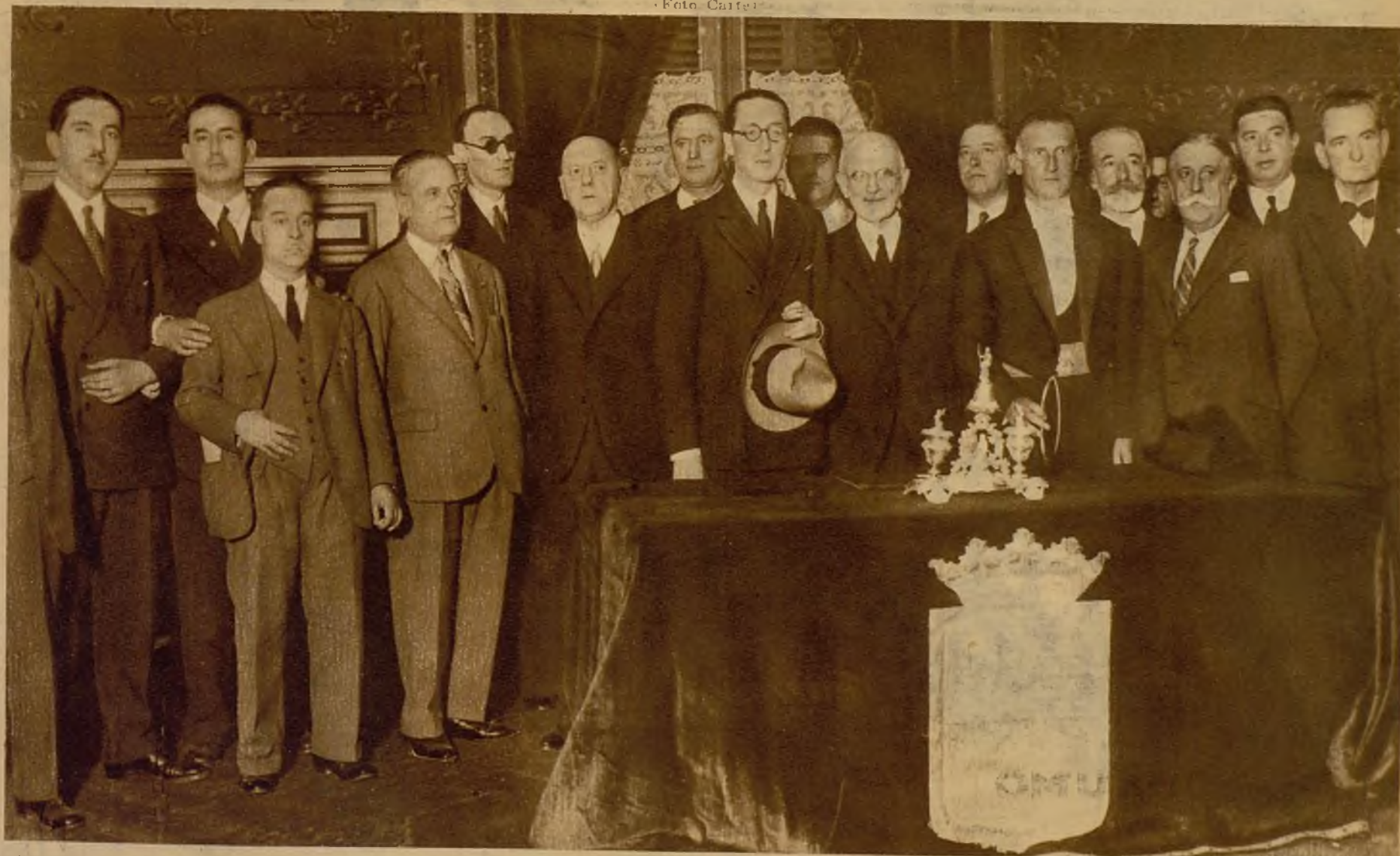
En la Diputación Provincial se celebró una solemne recepción, en la que figuraron, a más de las autoridades civiles y militares y nutridos núcleos de los partidos políticos, representaciones de las fuerzas vivas y de numerosas entidades