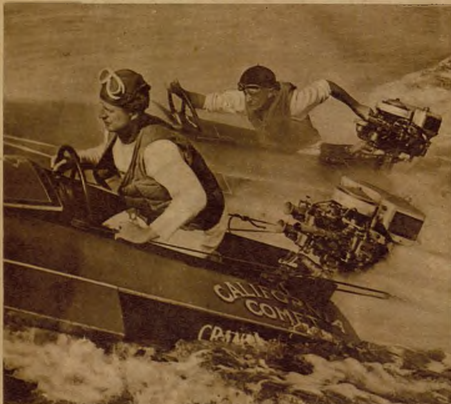
Una desesperada competición entre los conductores de dos canoas a motor, en una interesantísima prueba celebrada recientemente en Alemania. A poca distancia de la meta, un metro ganado a tiempo afirma la victoria.