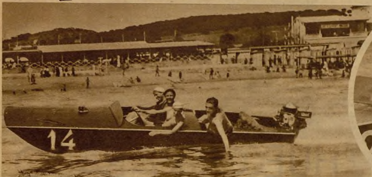
Un rápido y bien medido viraje en las regatas de canoas automóviles celebradas en Barcelona