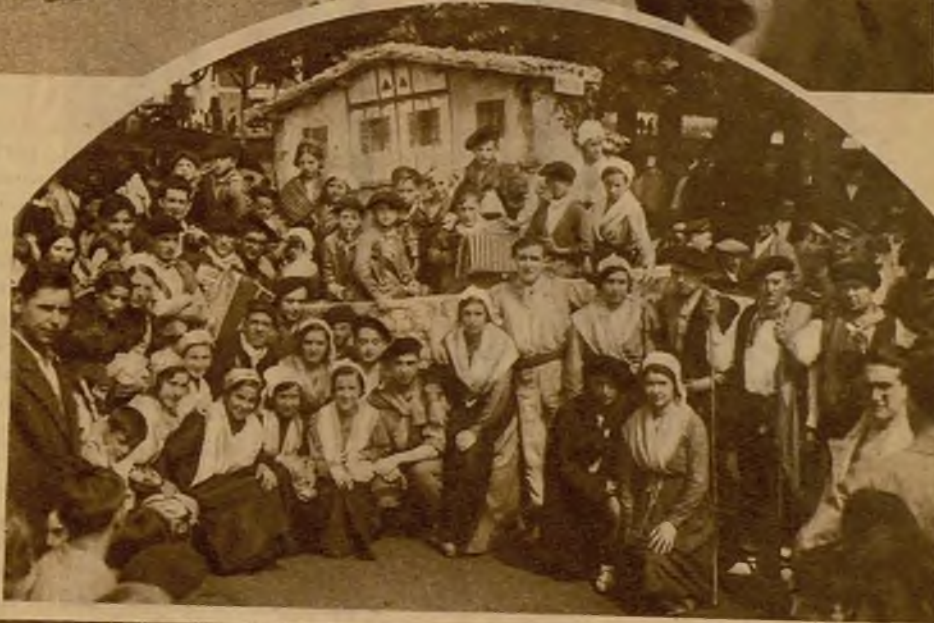
En Irún se han celebrado unas lindas fiestas vascas. He aquí a la "Gurdiya Irintzi Ko Bileru", que actuó lucidamente en las mismas