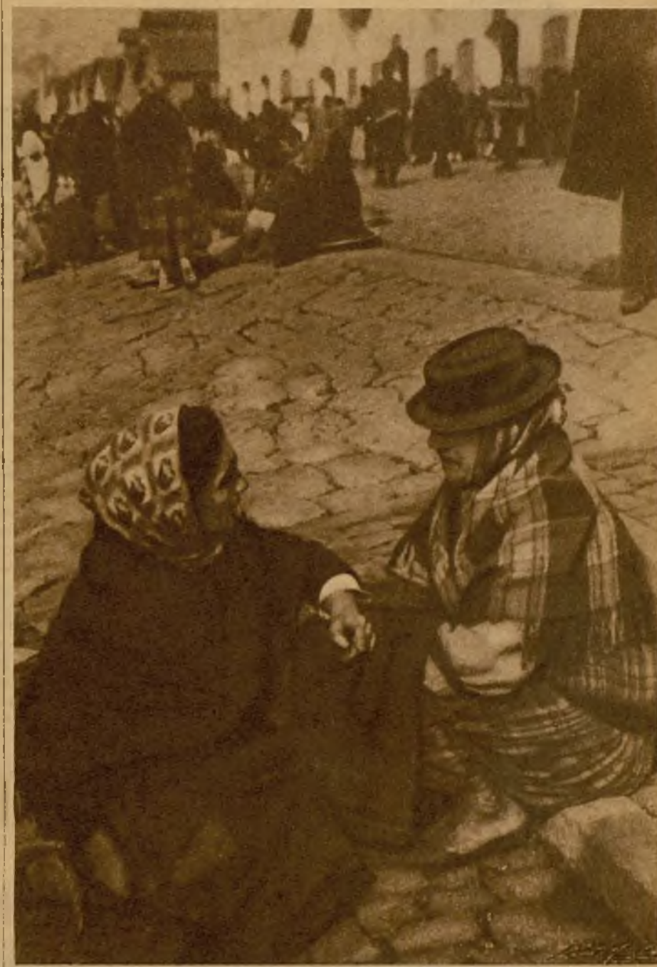
Das típicas siluetas de "varinas" que componen un cuadro de magnífico sabor primitivo

A pesar del tipismo de Ovar y, de otros pequeños pueblos costeros del norte, no es allí donde más detalles interesantes se ofrecen a la observación del curioso de nuevas cosas viejas. En esos pueblos no hay más lugar a observar, sino los documentos humanos, las muchachas erguidas, juncas, de una esbeltez de palmera y de oleaje, ese oleaje perturbador que ondula en sus caderas anchas y armónicas como curvas de ánfora oriental; las mujeres trigueñas, casi oliváceas; las viejas, caducas y arrugaditas a los cuarenta y cinco años, embozadas como brujas en sus mantos típicos: una falda negra puesta sobre su cabeza y el sombrerito pequeño cubriendo los cabellos lacios, embadurnados de aceites del pescado y recogidos en apretado moño sobre el cogote amarillento de hestezuela de trabajo, a cuyos hijos y nietos la trage-