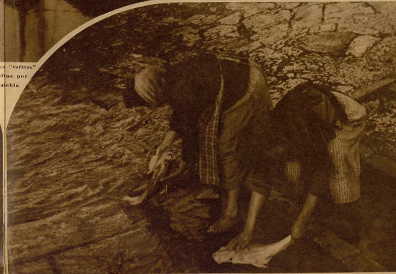
Las "varinas" lavan el pescado para condimentarlo

Son pueblos, sin embargo, de gran miseria si pensamos en los trabajos horribles que pasan los pescadores "varinos" para lograr la subsistencia de sus familias. Sólo muy de tarde en tarde ven hombres en el pueblo, luchan continuamente, con un encuno heroico, sobre las olas del Atlántico bravo. Sus furros, su bravura violenta, hay que domarlos a fuerza de heroicos abnegación, y sólo así es posible arrancarle el pescado, pitanza de los chiquillos desnudos que corretean por la arena de la playa, aguardando los ocho años para irse también al mar: pitanza de la madre triste, que las olas tradicionales han hecho viuda y vieja; manutención de la compañera valiente, que recorre al alba diez o quince kilómetros, hasta Aveiro o Espinho, para vender el pescado y convertirlo en pan, en hilo para las redes, en filigranas de plata, en cirlos plin-