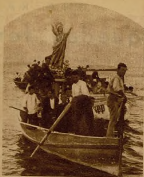
La procesión marítima de la Virgen de Agosto. Patrona de Los Alcázares (Murcia), recorriendo la bahía de la Mar Menor