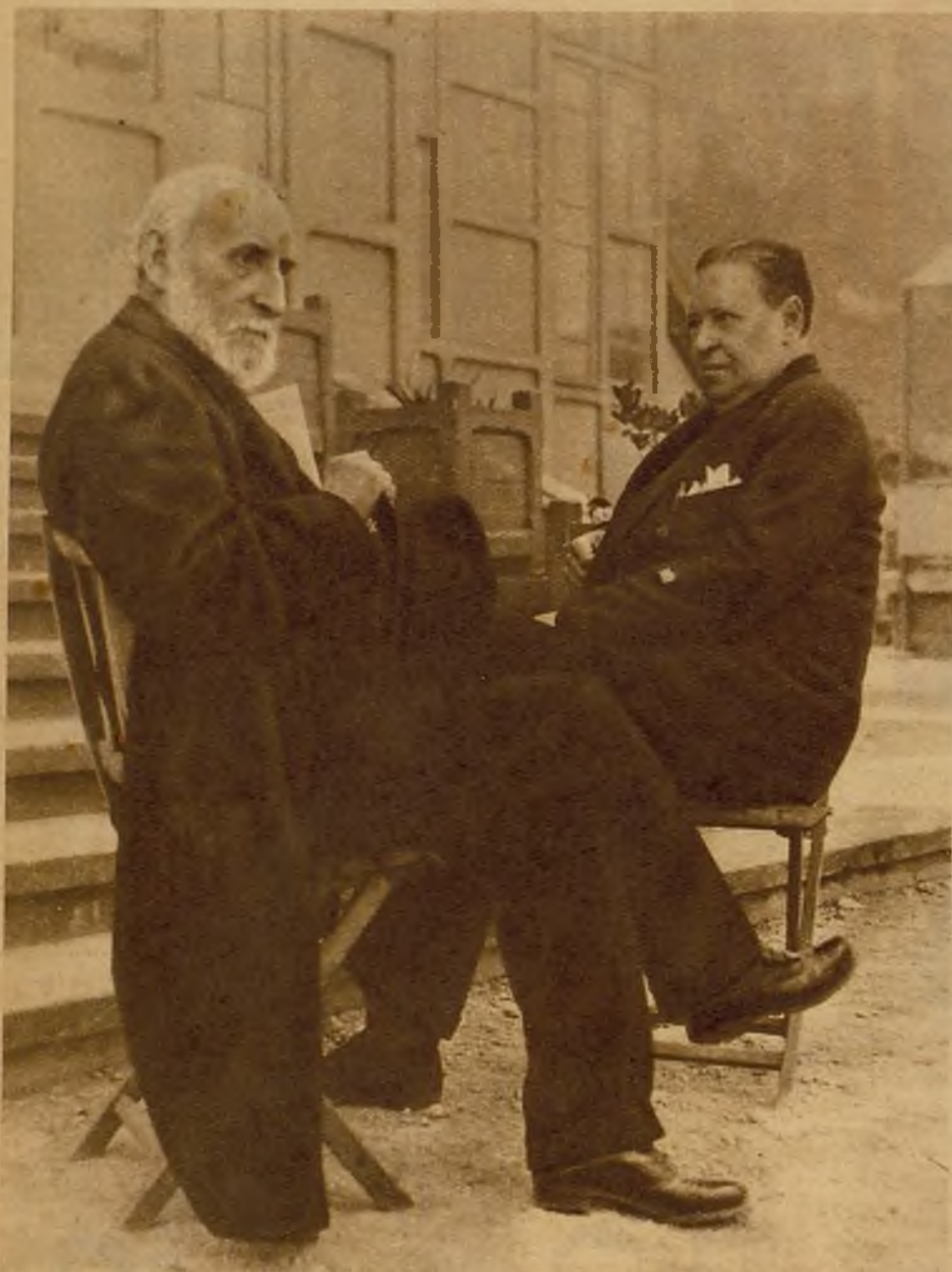
Don Santiago Ramón y Cajal veranea en Avilés. Holo aquí en la terraza del Club Náutico de Salinas, acompañado del presidente del mismo