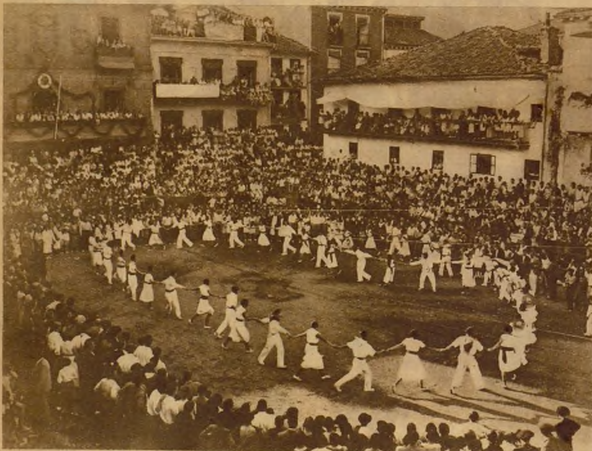
Bello aspecto de la plaza de Deva durante la celebración del "Arrescu" en la fiesta típica celebrada a beneficio del Hospital