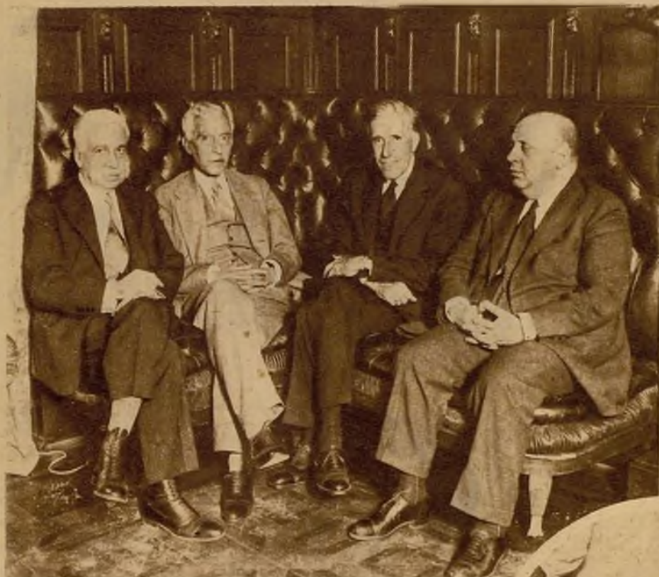
He aquí cuatro distinguidísimas personalidades de la política nacional reunidas en una de las secciones del Congreso de los Diputados. Los señores Mucía, Prieto, Besteiro y Hurtado han celebrado una detenida conferencia, en la que trataron, de modo comprensivo, cordial y patriótico, de los asuntos que abarca el Estatuto catalán en su relación con la futura Constitución del país.