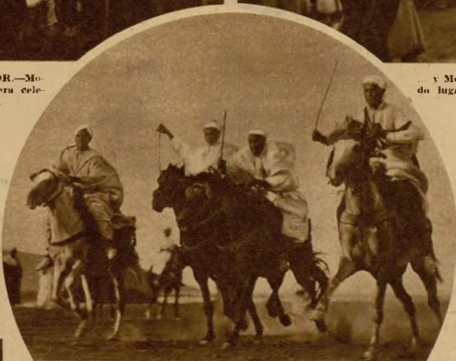
El pelotón de participantes en la carrera de caballos de Nador. ¡Qué notable diferencia con él los pelotones de pura sangre montados por "jockeys" en los hipódromos! Sin embargo, ¡qué bello y pintoresco primitivismo el de estas carreras de moros!