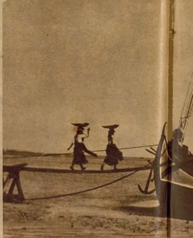
Descargando una falúa pesquera. Siluetas gráficas de ritmo de tres maris

Esta restricción en las bodas, que siempre deben ser de "varino" y "varina", se lleva con una rigidez magnífica. La belleza de las vírgenes fenicias tiene que ser ofrecida a hombres de su