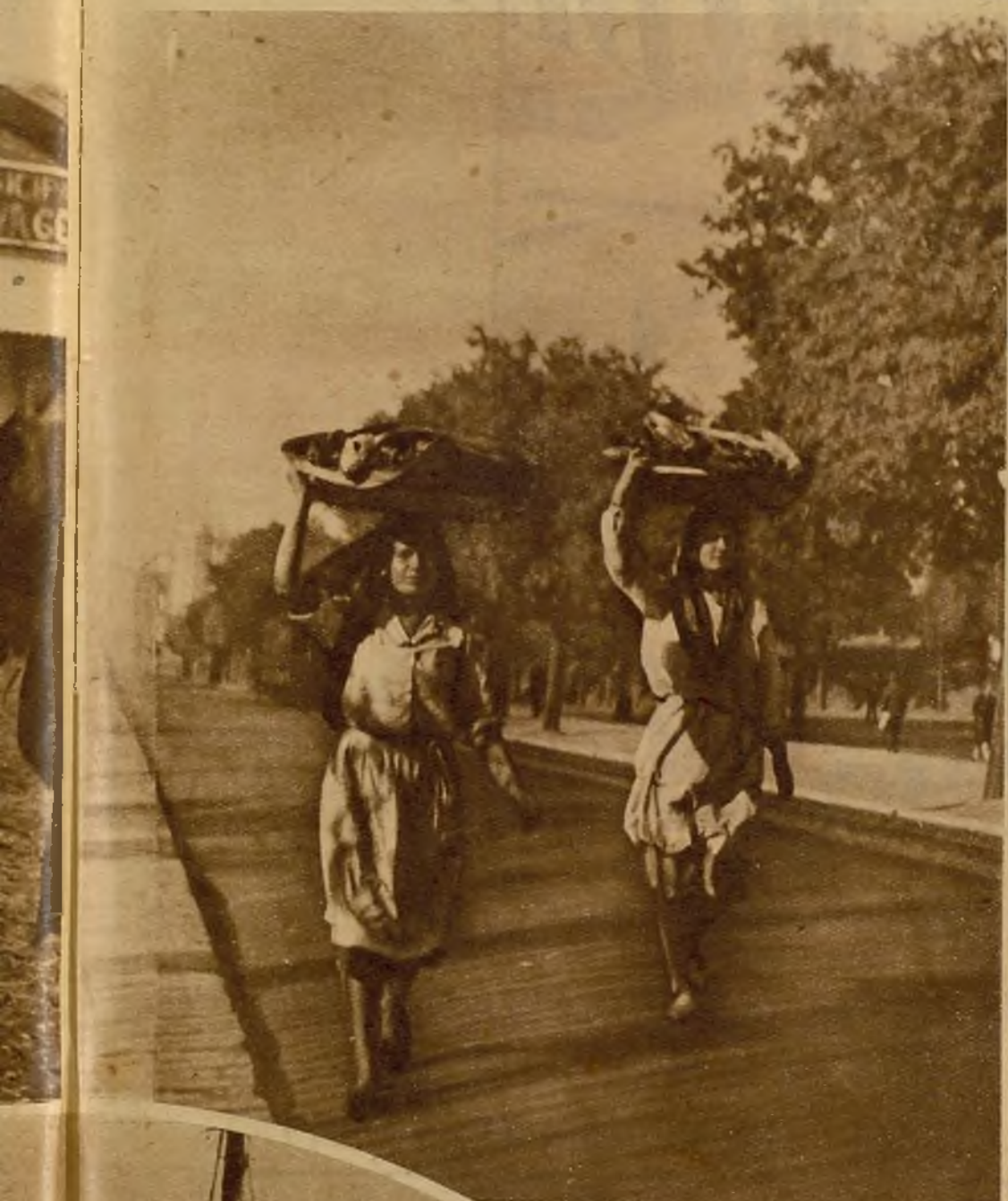
Dois "varinas" en su cotidiana peregrinación por la ciudad