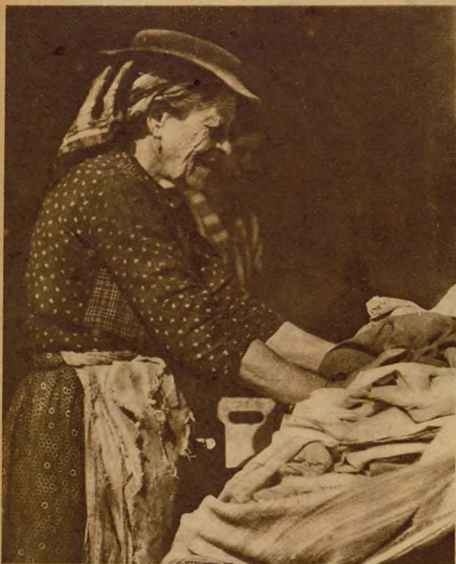
Un tipo clásico de "varina" vieja