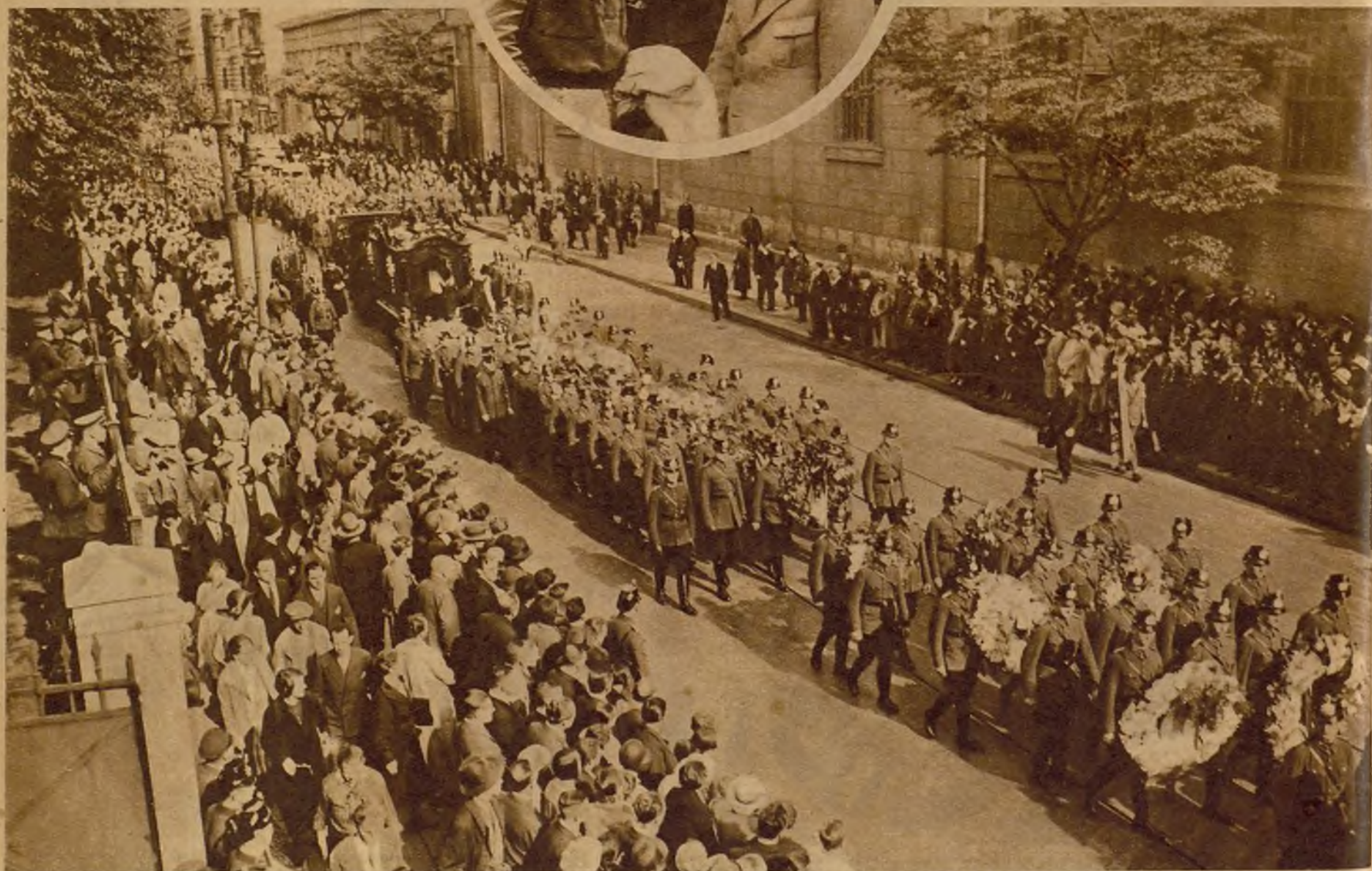
Impponente cortejo que acompañó al cementerio de Berlín a los cadáveres de los aviadores muertos durante el "raid" de la vuelta aérea a Alemania.