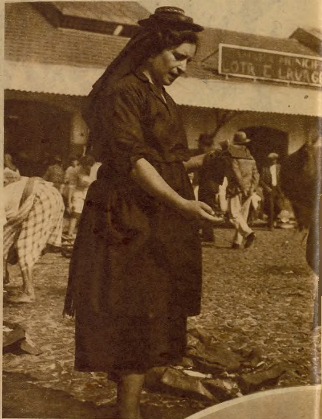
"Varina" vendiendo pescado a la puerta del mercado

Si hay muerte en el hogar "varino", entonces la desesperación animal toca la raya de lo sublime. Mujer e hijos del difunto gritan y lloran noches seguidas, arrastrándose por los suelos, sin comer, sin peinar, invocando todas las potencias del cielo y de los inferios, magi-