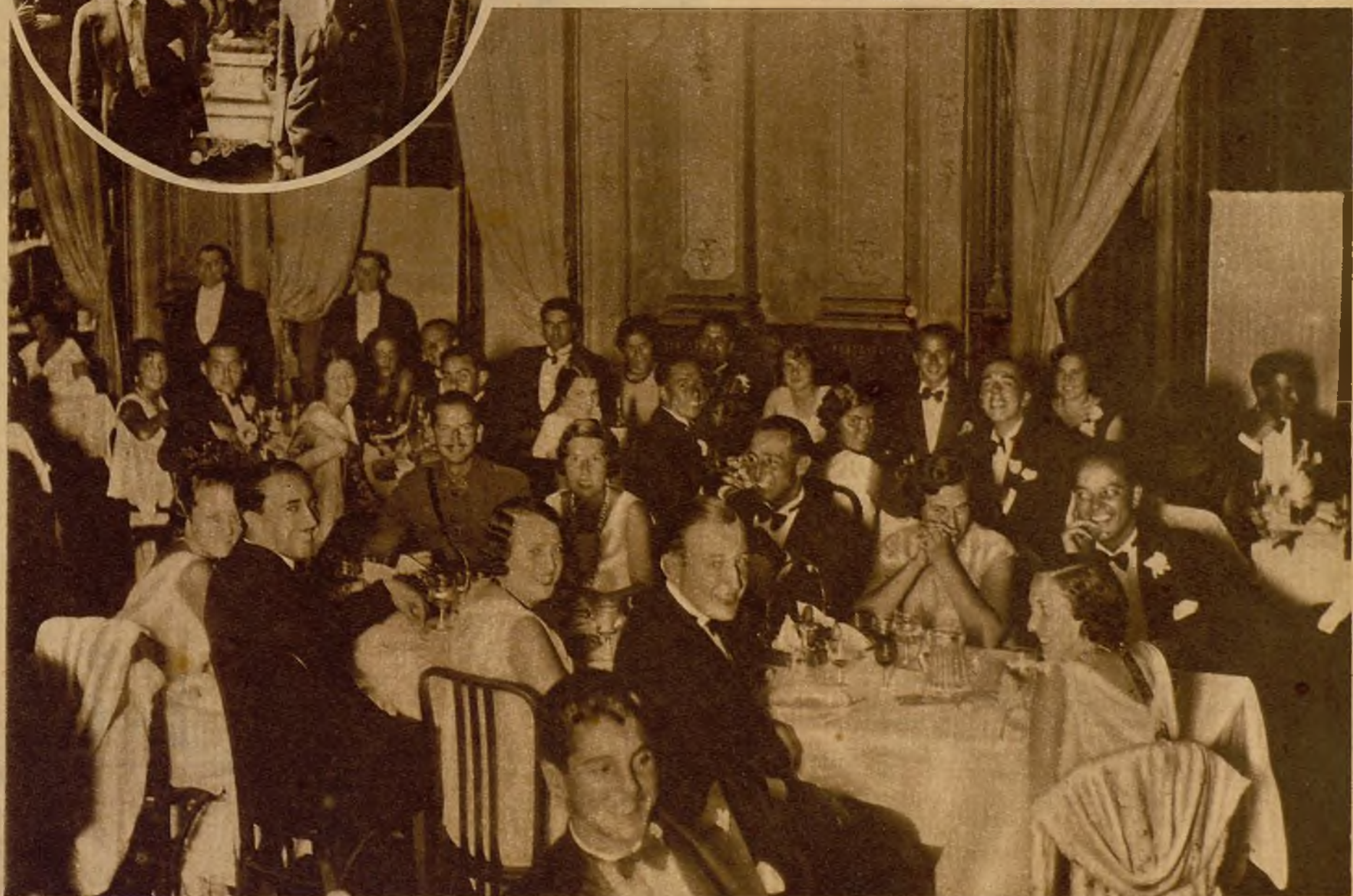
Concurrido aspecto que ofrece el comedor del Club Náutico de Vigo durante la cena con que los socios festejaron el éxito de las últimas regatas. En círculo, la procesión de San Agapito, celebrada con gran lucimiento en Barcia de Mesa (Pontevedra)