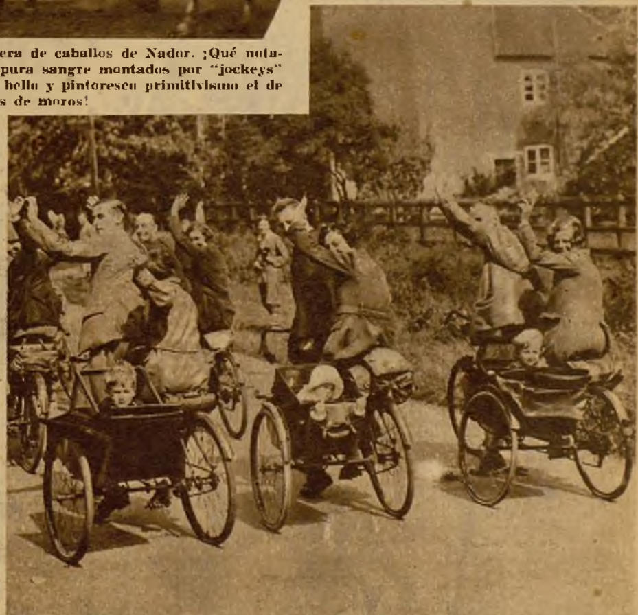
Todo puede armonizarse con un poco de buena voluntad. El amor al deporte y el amor a la familia. Se puede ir en bicicleta y llevar a la señora en la grupa y al niño en un "sidecar". Los Ingleses han organizado la primera carrera de ciclistas casados y "papás".