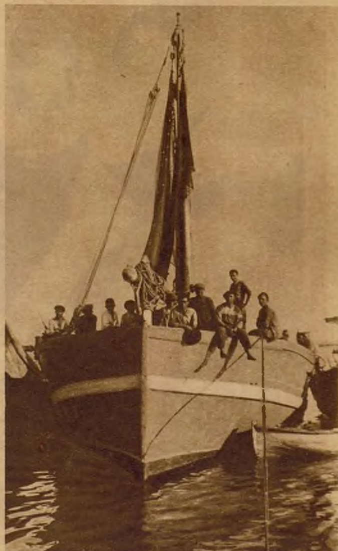
Una de las barcas apresadas en aguas de Tarragona por el crucero "Bonifaz" por dedicarse su tripulación a la pesca del bacalao a menor distancia de la costa que la establecida