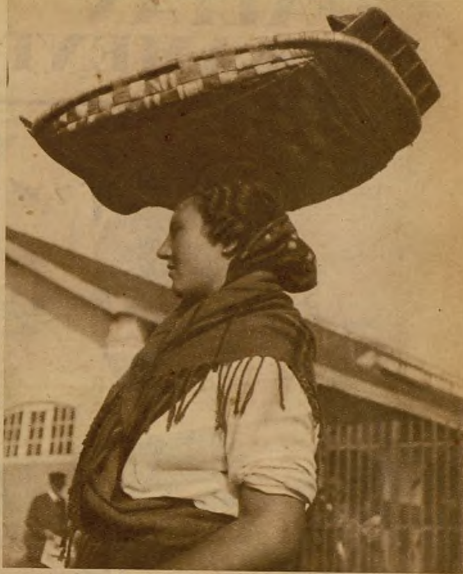
Una garbosa "varina" con su canasta

sus almas y que, si se desbordan, serán arrolladoras.