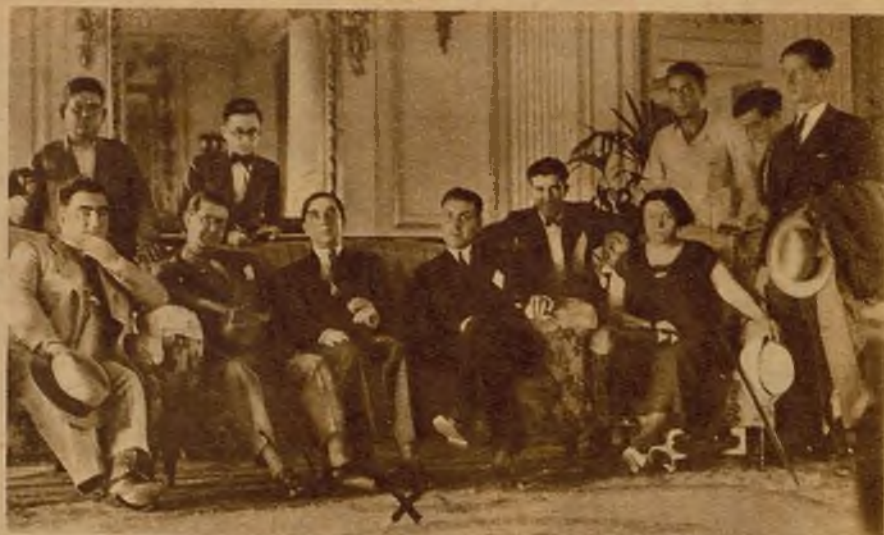
El gran poeta almeriense Francisco Villalpessa, cuyos versos magníficamente sonoros, le colocaron merecidamente a la cabeza de nuestros vates, ha pasado doce años en América. Ansioso de descanso para sus luchas, ha regresado a su ciudad natal, donde se le ha tributado un cariñosísimo recibimiento. En la foto aparece acompañado de su hija y de las autoridades de Almería que acudieron a cumplimentarle