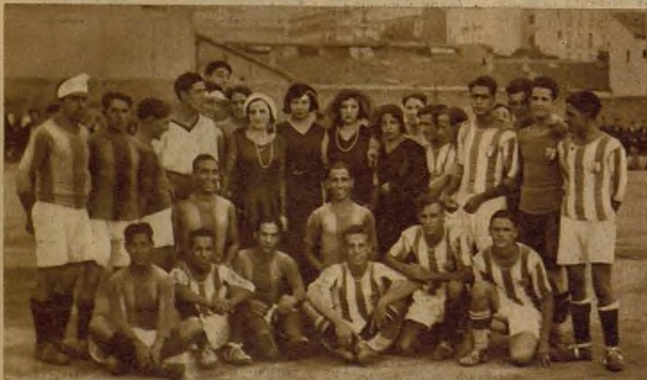
Los equipos Favón F. C. y Latina, de Madrid, que han celebrado un encuentro a beneficio de los pobres del distrito de la Latina. Asistió al partido "Miss República", que aparece, con otras bellas señoritas, en unión de los jugadores