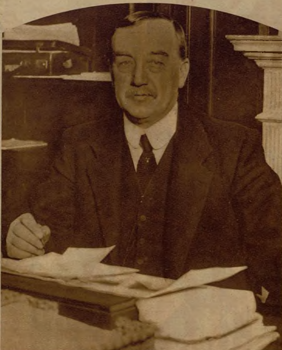
La gravedad de la situación político-económica de Inglaterra no puede ocultarse ya con eufemismos. El Gobierno Mac Donald patentiza con su dimisión la imposibilidad de hacer frente al peligrosísimo momento de la vida nacional inglesa. La alta política británica analiza, sin embargo, serenamente sus soluciones. Una de las que se ofrecen como probables es la formación de un Gabinete presidido por Henderson, ministro de Negocios Extranjeros en el Gobierno dimisionario