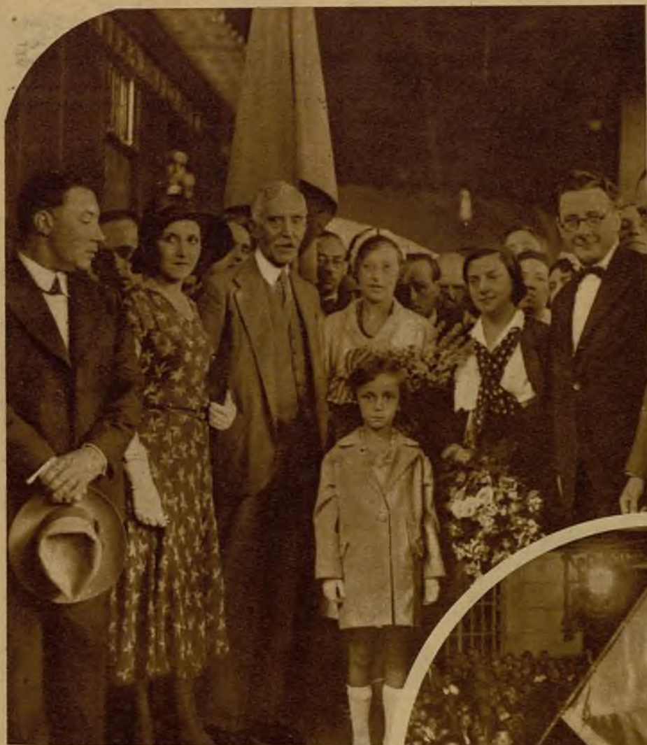
El ilustre presidente de la Generalidad catalana con sus hijas, las señoritas de Alcalá Zamora y el ministro de Economía, momentos antes de salir el señor Maciá para Barcelona