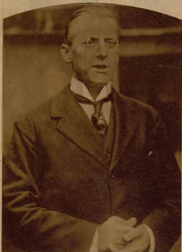
Sir Chamberlain, el destacado político conservador, a quien se cita como uno de los principales componentes del Gobierno que ha de formarse para sustituir al dimisionario, y que en su caso estaría probablemente presidido por Mr. Baldwin