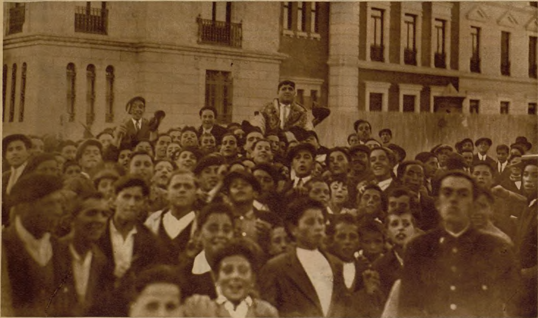
También este torero modesto saboreó los momentos de triunfo y gloria. También él, como las grandes figuras, fué sacado en hombros de los entusiastas en una tarde inolvidable. Arriba, uno de los últimos retratos del infeliz novillero

A los cuarenta minutos de ingresar en la enfermería dejó de existir el desgraciado torero.