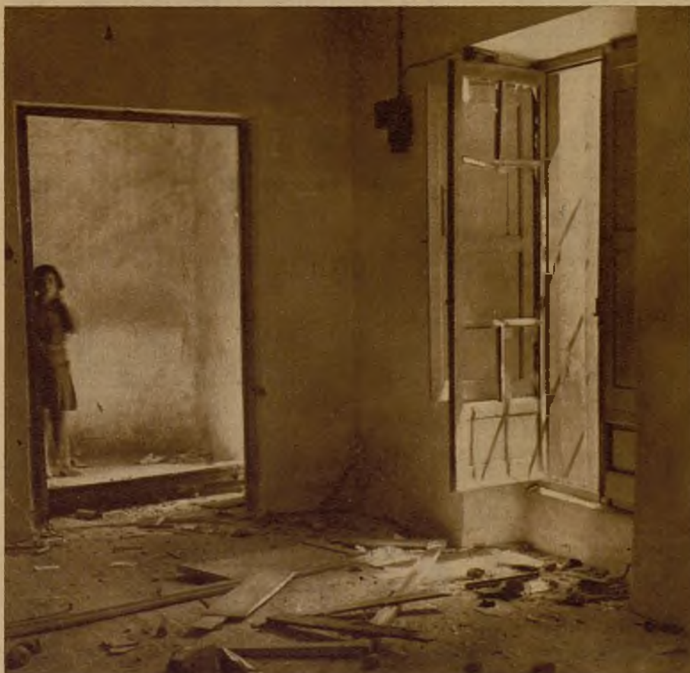
Una habitación del Circulo Radical de Ciempozuelos. En la fotografía puede apreciarse la magnitud del destrozo que causaron los grupos asaltantes