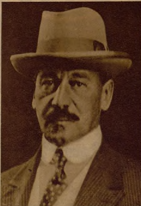
El líder liberal Herbert Samuel, que figura intensamente en los pronósticos que se formulan acerca de la formación del nuevo Gabinete, acaso de carácter nacional, sin significación especial de partidos