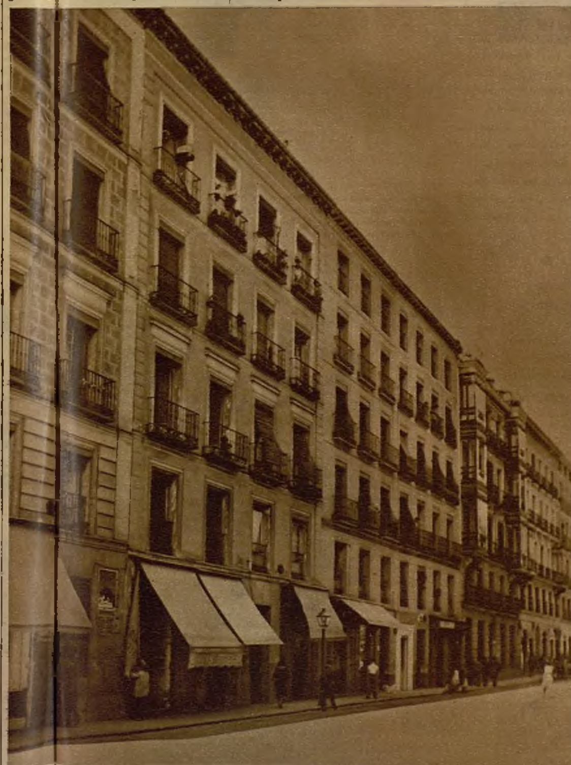
En un piso de estas primeras casas de la calle de Arrieta, don Manuel García esperó con inquietud el día 15 de diciembre el momento de salir a la calle con el triunfo de la República

Al cerrar la puerta "dejó de existir" don Alejandro Lerroux. Y nació don Ma-