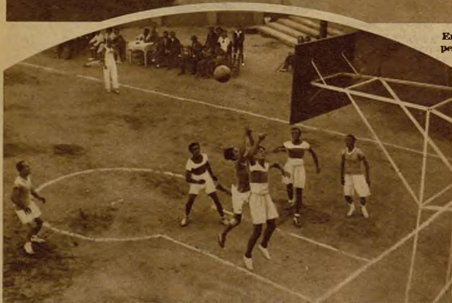
Una interesante jugada del partido de baloncesto celebrada en Madrid para la competición "Copa Bernabeu"