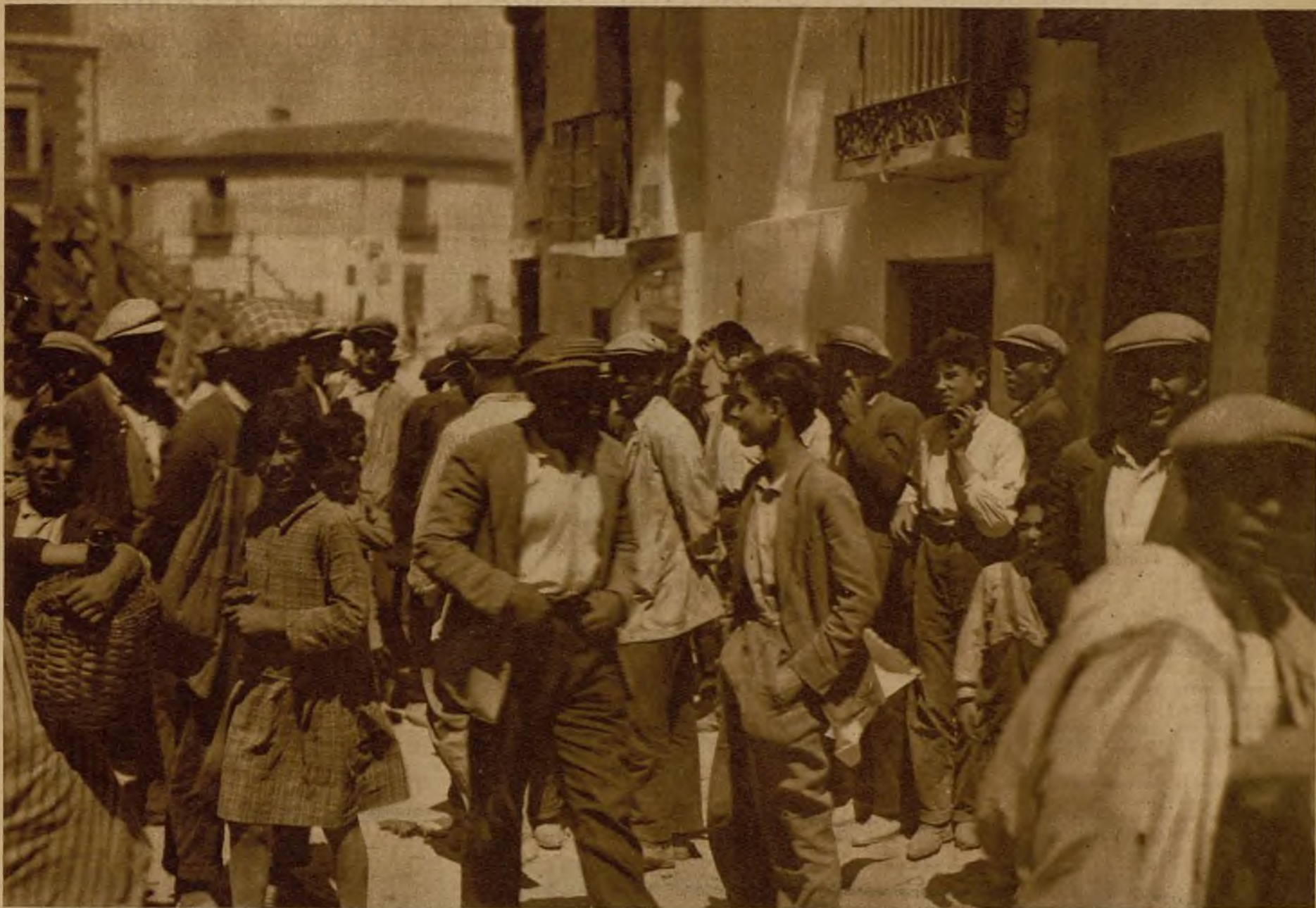
En el vecino pueblo de Ciempozuelos se ha planteado un grave conflicto de orden público, que se originó por el asalto al Circulo Radical, según se dice por afiliados al partido socialista. Los amotinados, tras de quemar los muebles del citado casino, asaltaron una panadería, a cuya puerta aparecen en la foto, y un almacén de comestibles