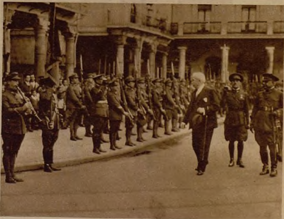
El ministro de Estado pasando revista a las tropas de la guarnición de Valladolid, que le rindieron honores durante su visita del domingo a la ciudad castellana