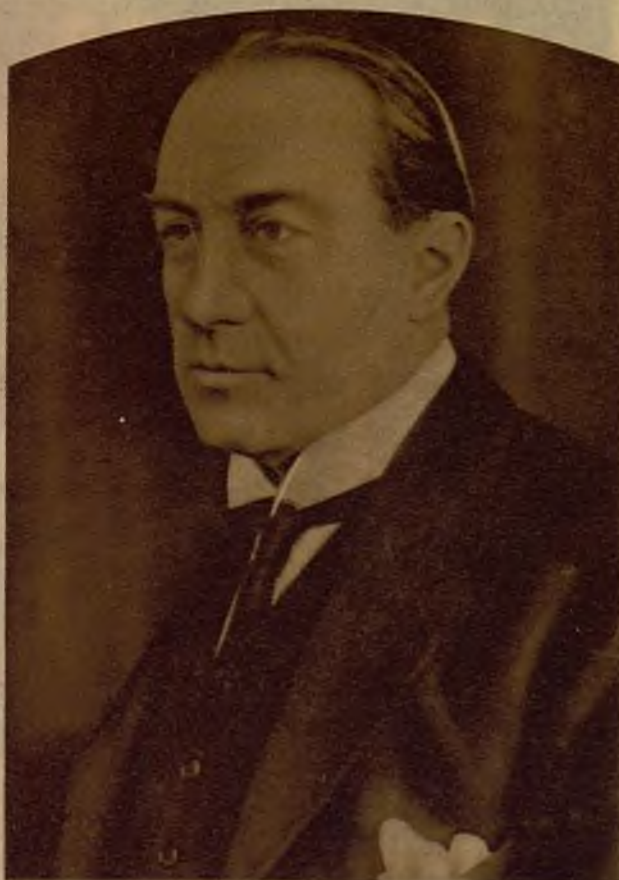
Stanley Baldwin, el jefe de los conservadores, ha llegado a Londres, procedente de Als les Bains. El pueblo londinense le ha tributado un grandioso recibimiento, que ante la actual situación es altamente significativo