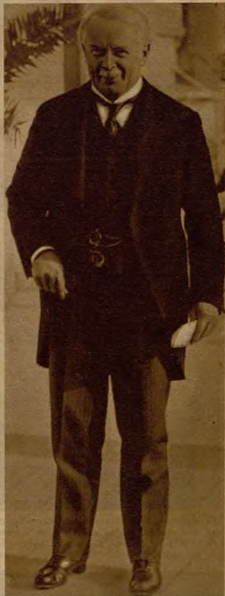
El jefe del partido liberal, Lloyd George, puede ser otra de las soluciones, si las fuerzas políticas llegan a una concordancia. Su personalidad y su situación en la Cámara le hacen figurar entre los candidatos