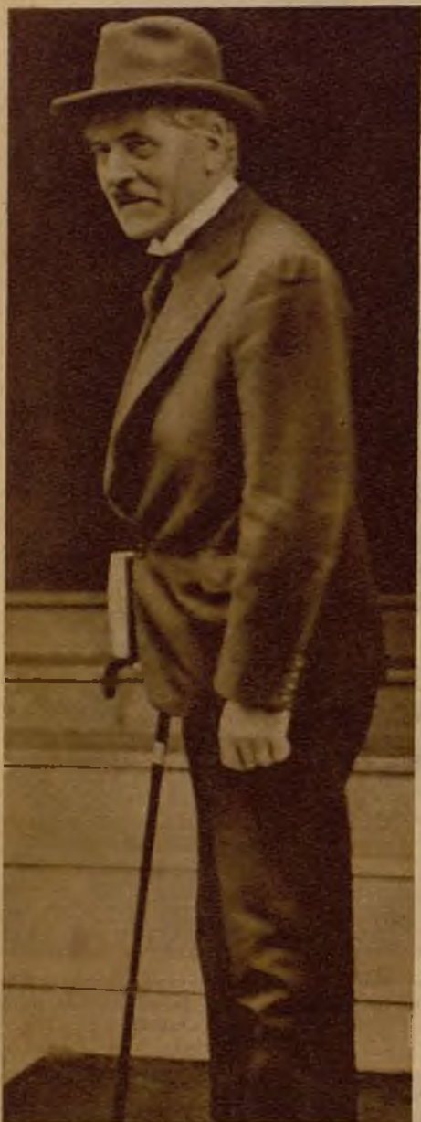
Mr. Mac Donald, el jefe laborista, que ha presentado al rey Jorge su dimisión y la de los ministros de su Gobierno. El ilustre político ha declinado los poderes ante la gravísima crisis económica en que se encuentra el país