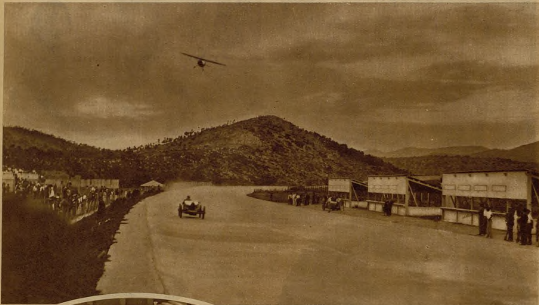
En el autódromo de Terramar, en Sitges, se ha celebrado un concurso original: la competencia de un automóvil y un avión, que en el momento de la foto salen a dirimir su desafío