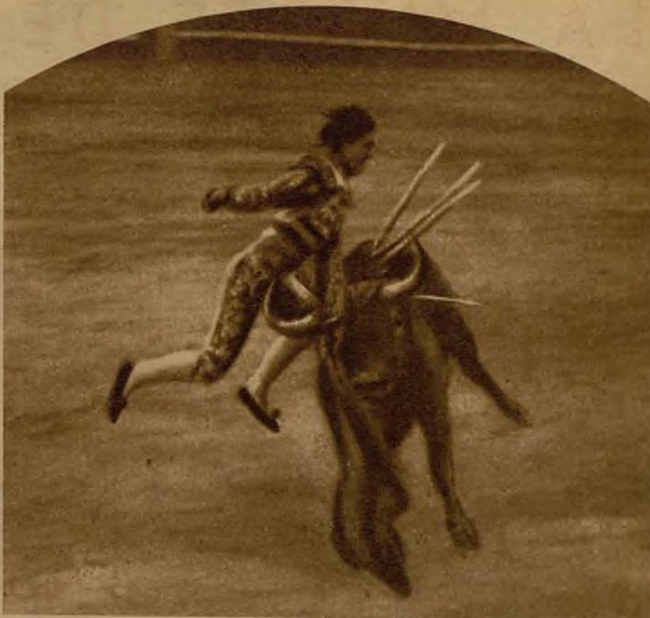
El quinto toro, llamado "Cartelero", lo cogió por el pecho, lo campaneó y lanzó al espacio en una brusca sacudida. He aquí el momento emocionante de ser cogido y muerto el pobre Alcalareño

Llegan chicos de los largos corredores vecinales. Se agrupan a la puerta,