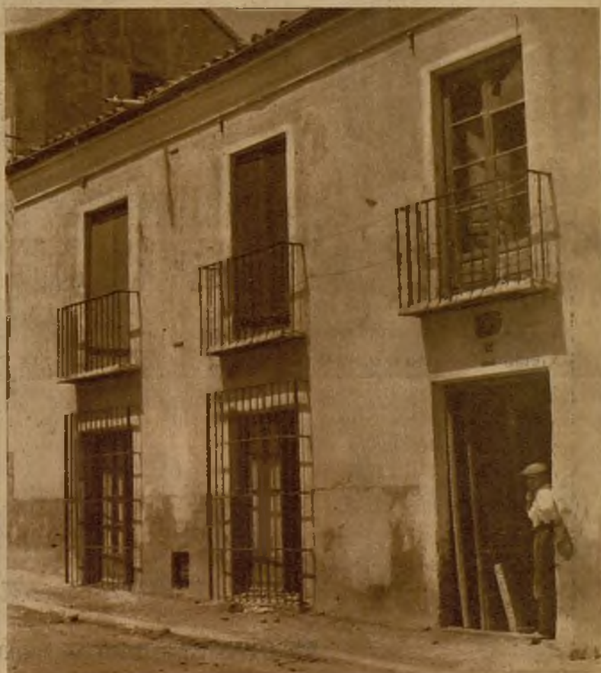
Fachada del Circulo Radical de Ciempozuelos, que fué asaltado por los revoltosos. Los amotinados romplieron los cristales de ventanas y balcones y arrancaron las puertas de entrada