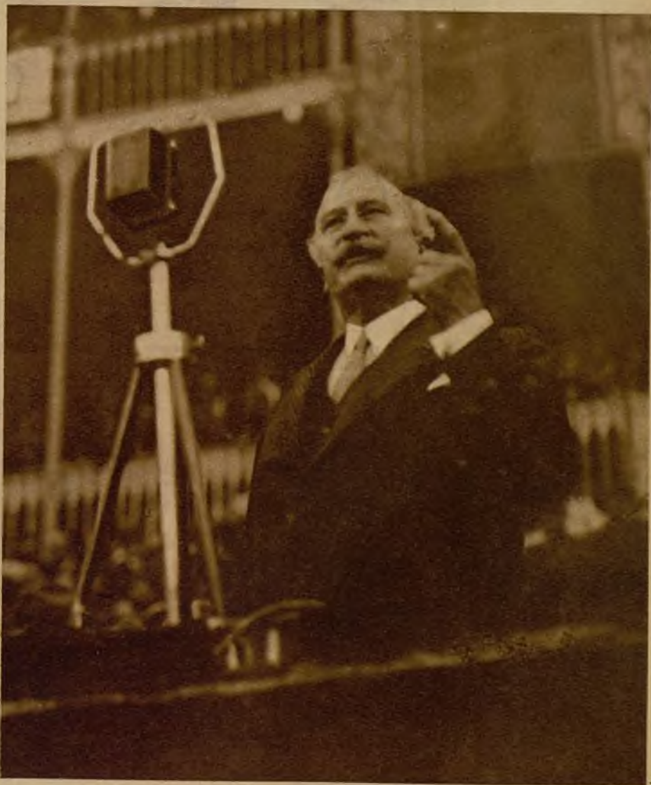
Una actitud tribuneira de don Alejandro Lerroix durante el elocuente discurso que pronunció en Valladolid, en el mitin del partido republicano radical