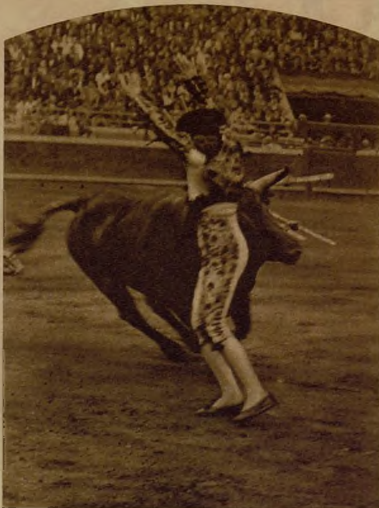
El espada mejicano Jesús Solórzano al salir de un par de banderillas en la última corrida de la feria de Bilbao