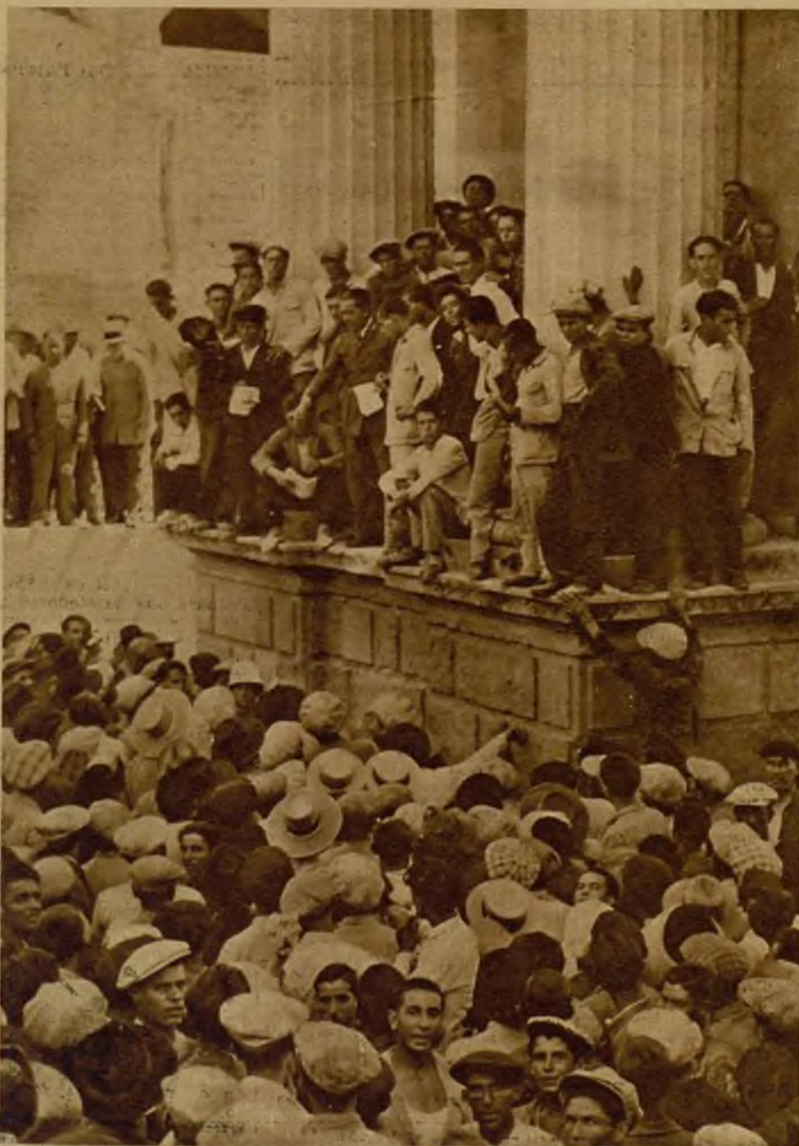
El jefe de la Guardia municipal de Córdoba distribuyendo los volantes de trabajo que otorga el Ayuntamiento a los numerosos obreros parados. Córdoba es una de las ciudades de Andalucía más trágicamente afectadas por la crisis obrera