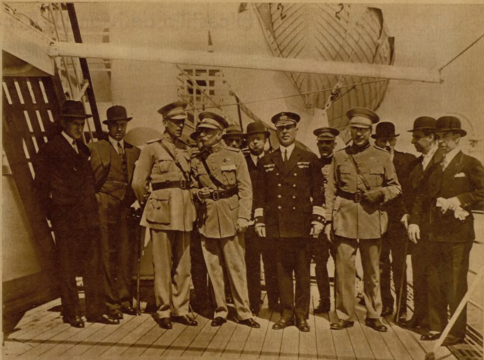
Una fotografía del presidente Carmona, tomada al regreso de Madera de las tropas que sofocaron aquella revuelta. El movimiento revolucionario, que tuvo entonces una marcada gravedad, se reproduce ahora, aunque, según noticias oficiales, ha sido abortado por las rápidas medidas adoptadas por el Gobierno