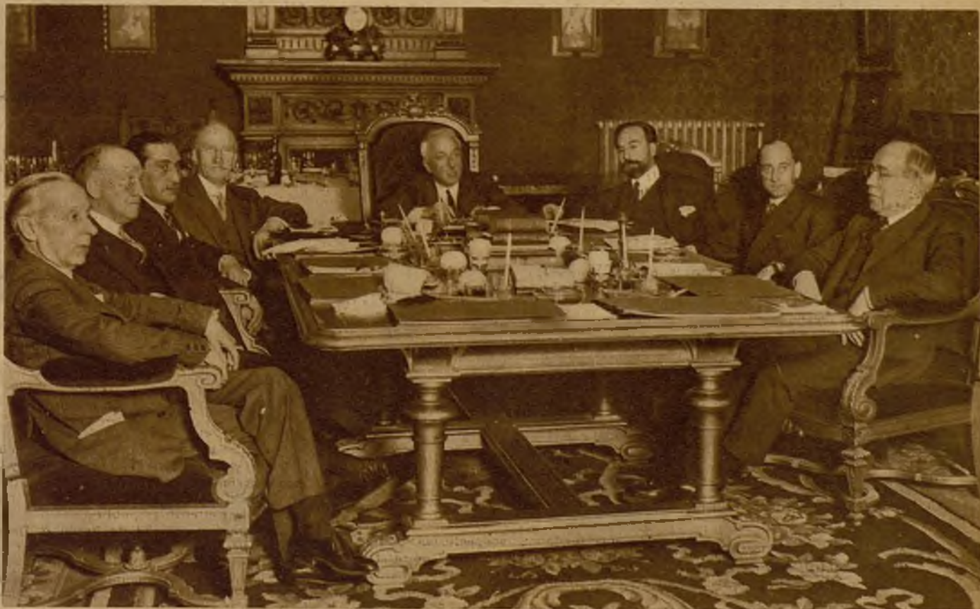
La primera reunión de los conspiradores, ya ministros de la República. Las prisiones, los azorosos días de inquietud, tuvieron un victorioso final