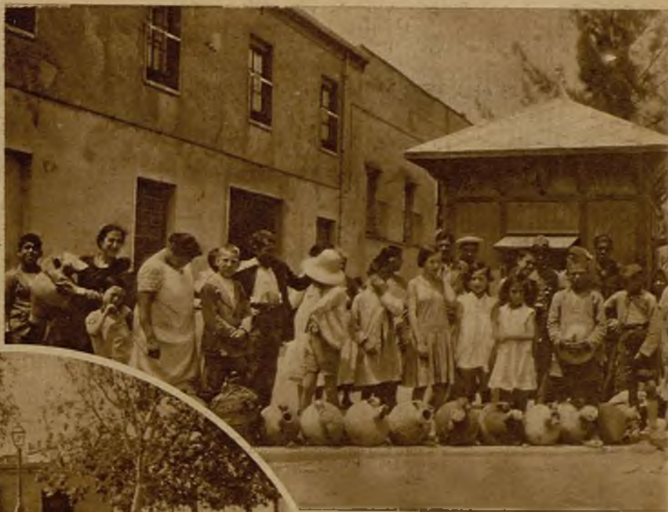
horas del día formando en colas interminables para llenar un miserable cántaro. En el semicírculo central se ve la interminable fila de vasijas, colocadas en turno por los vecinos, que en el centro de la plaza aguardan pacientemente a que les llegue su momento