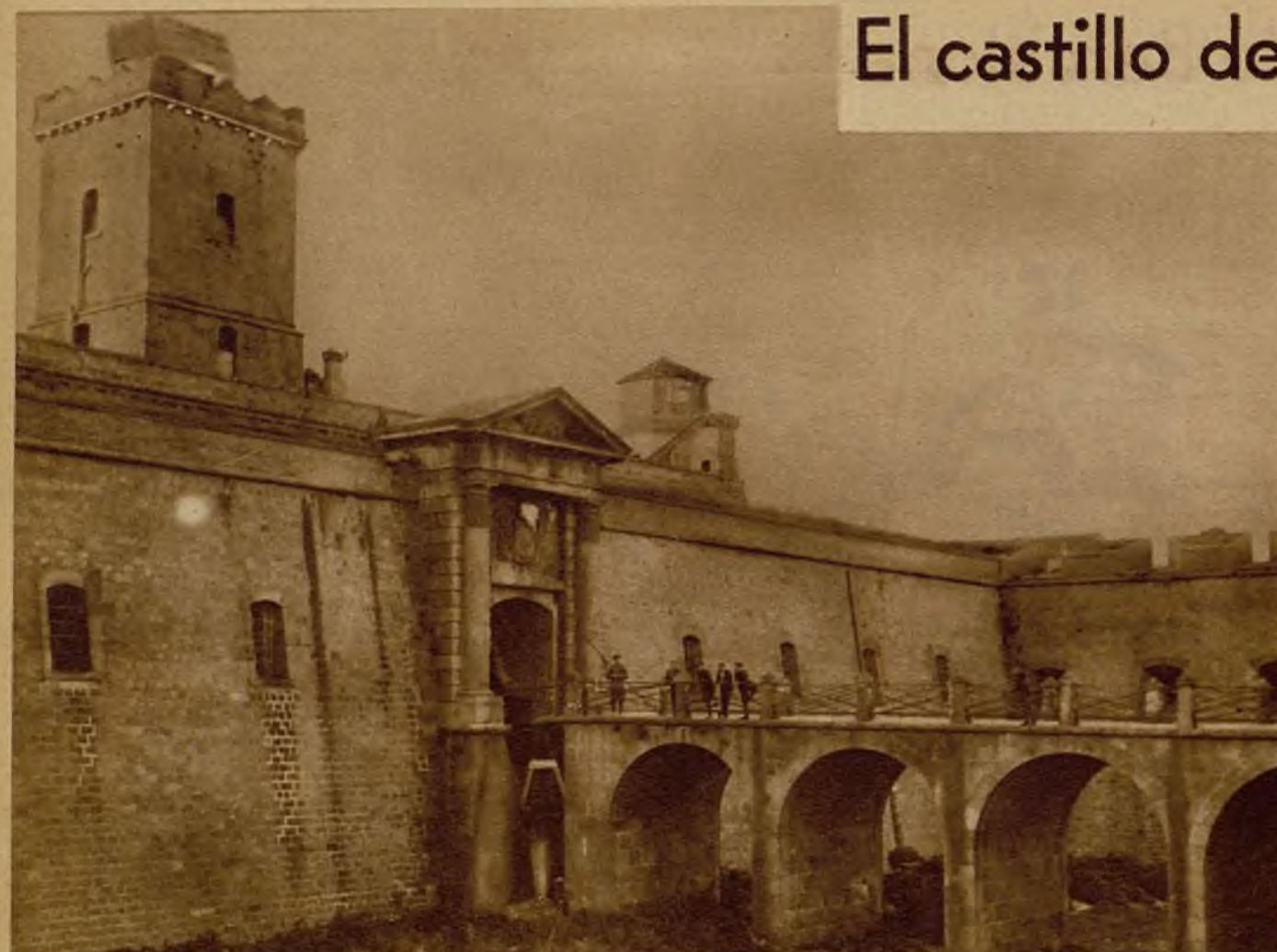
Puente de entrada al histórico castillo de Montjuich, que ha sido cedido a la ciudad de Barcelona por el Gobierno de la República