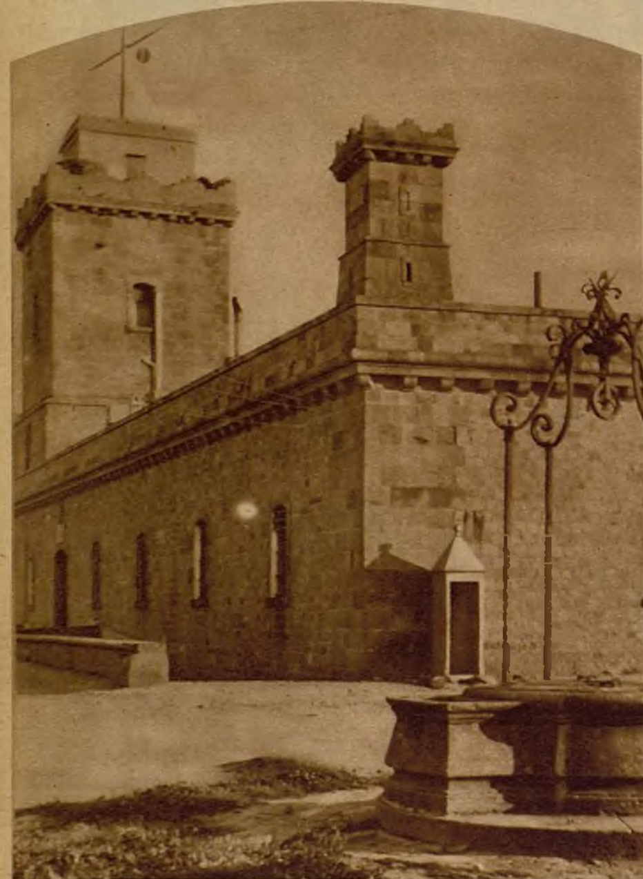
He aquí la torre de señales para los buques que cruzan el puerto de Barcelona. Las ventanas que se ven en la foto corresponden a los calabozos en que estuvieron presos Fermín Galán y sus compañeros de sublevación de la noche de San Juan