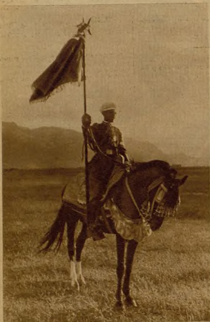
El abanderado de la mehala de Gomara, número 6, durante la formación de los tabores que desfilaron ante el general Cabanellas