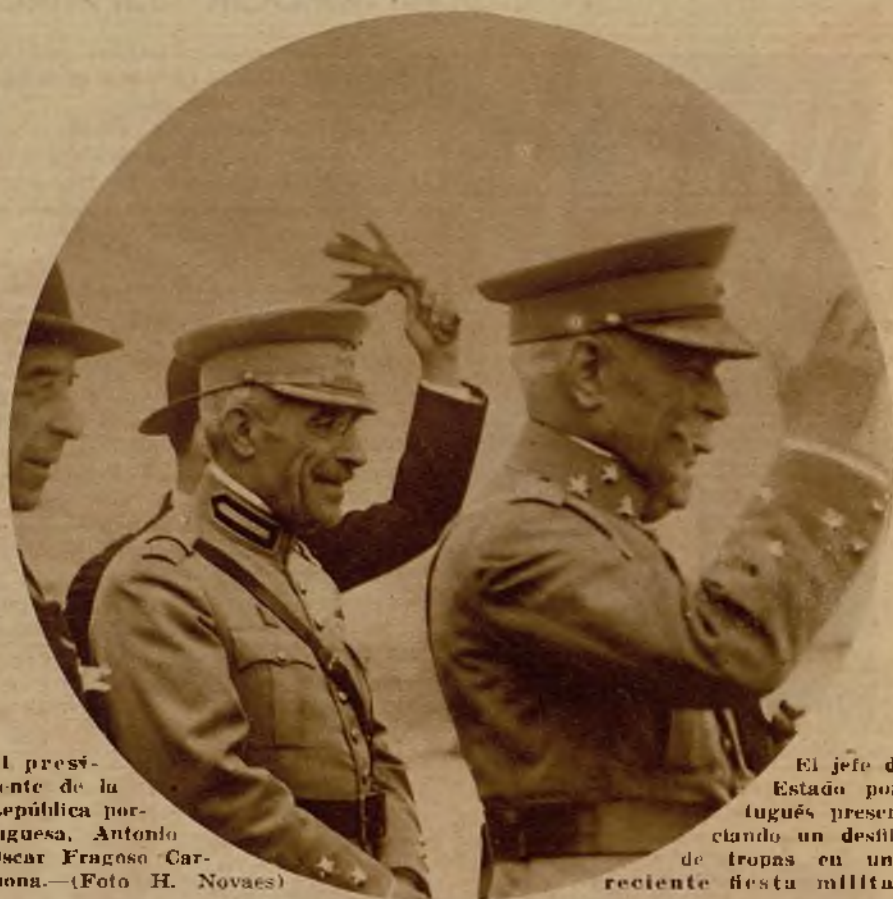
El jefe de Estado portugués presenciando un desfile de tropas en una reciente fiesta militar