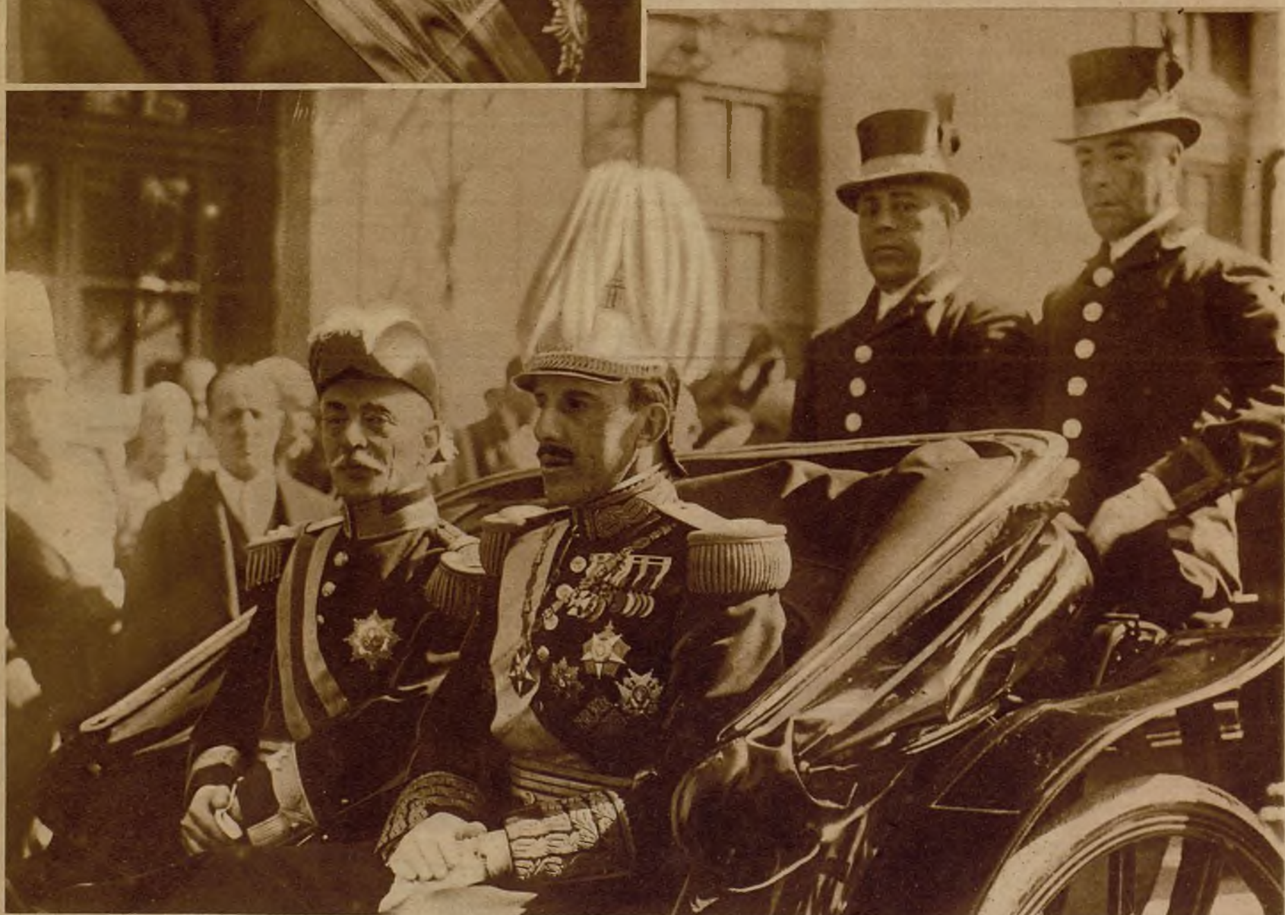
En fecha no lejana— aunque los acontecimientos la hayan colocado muy distante— el presidente Carmona estuvo en Madrid. En la foto aparece acompañado del ex monarca español, a su llegada a la estación del Norte