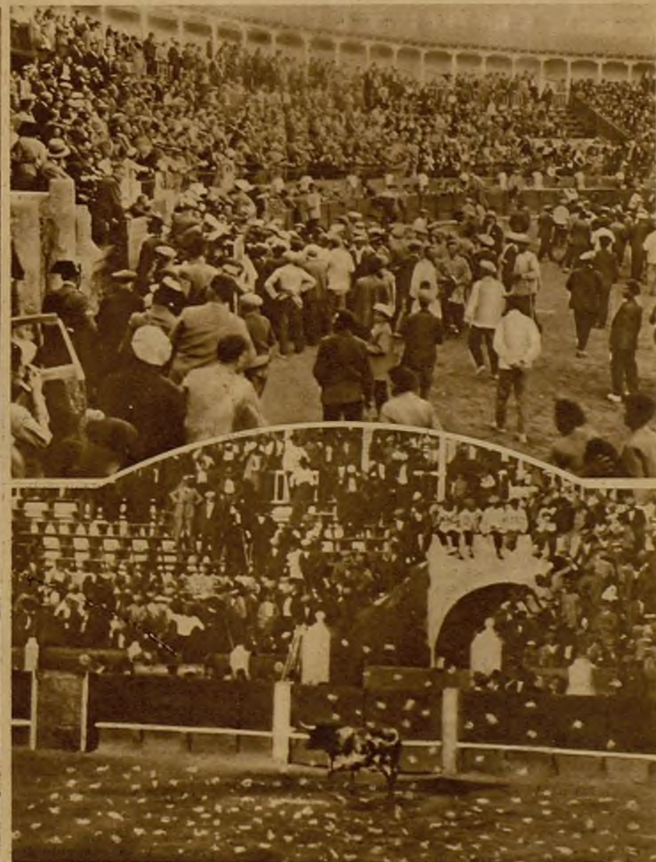
En la Plaza de Toros de Almagro (Ciudad Real), a causa de la mansedumbre del ganado en la corrida celebrada anteayer, el público promovió un verdadero motín. El ruedo aparece cubierto de ladrillos, que los espectadores arrancaron de los tepidos. Arriba, el público, dueño del ruedo, en el momento culminante del escándalo