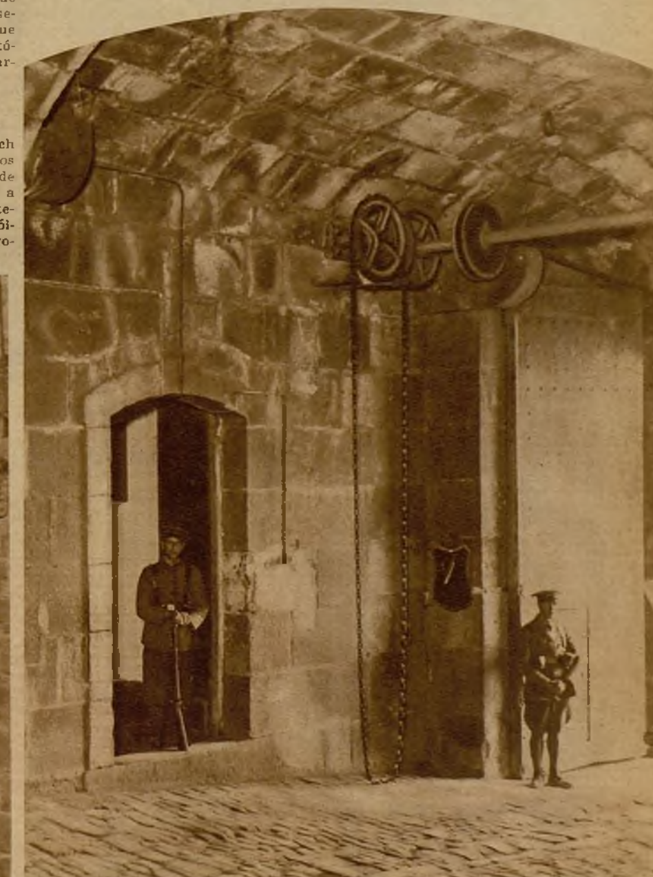
La entrada al castillo de Montjuich, pasadas las murallas. En el ángulo se ven las cadenas con que se levanta el puente levadizo que da acceso al fuerte

Las obras del castillo de Montjuich (monte judaico) empezaron a principios del siglo XVIII, después de la guerra de sucesión, que dió el trono de España a Felipe V. Encierra en su recinto cuarteles, hospital, prisiones, depósitos de pólvora, y numerosos pabellones para el gobernador del fuerte y la oficialidad.