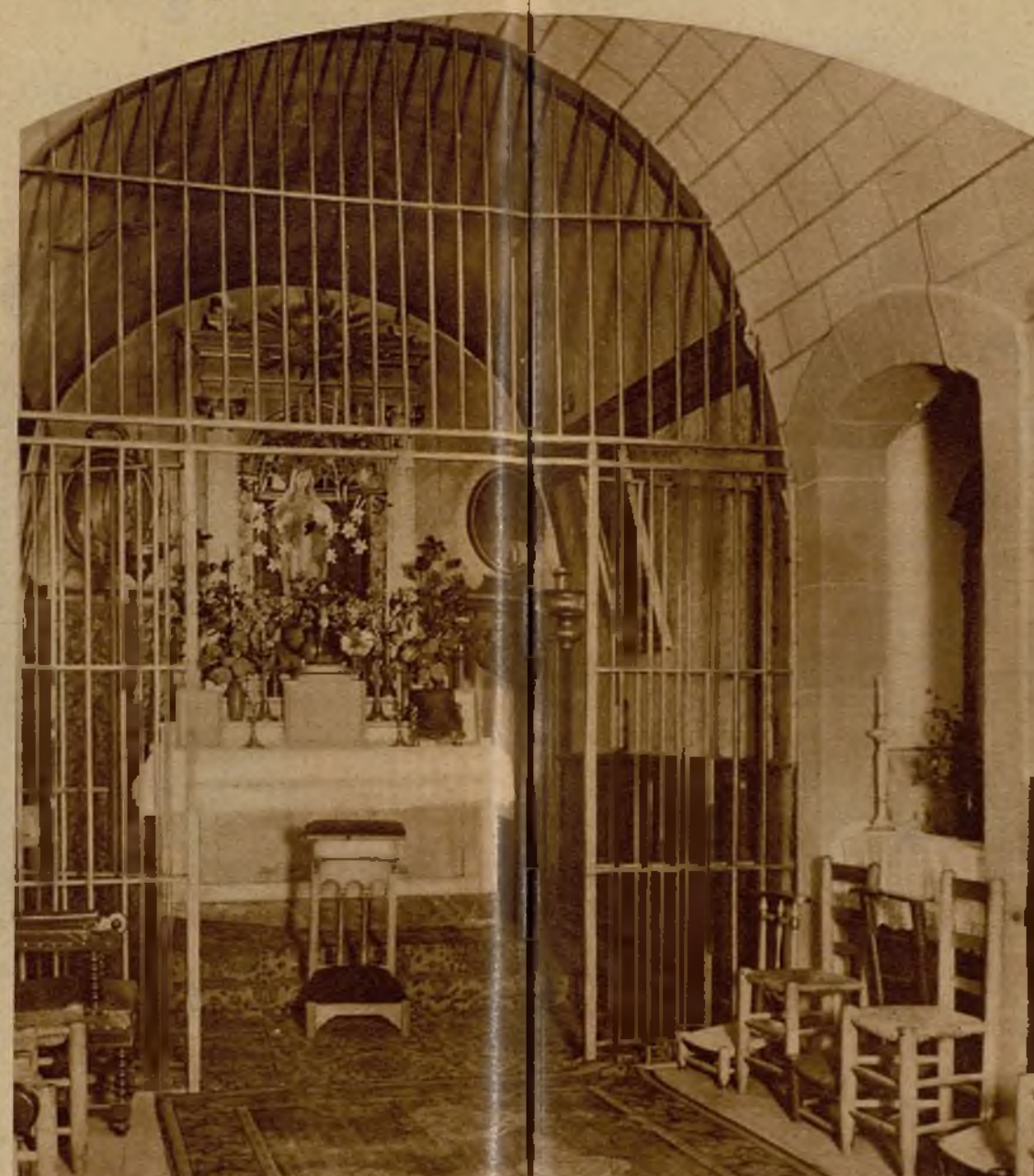
La capilla del castillo, donde pasaban su última noche los condenados a muerte