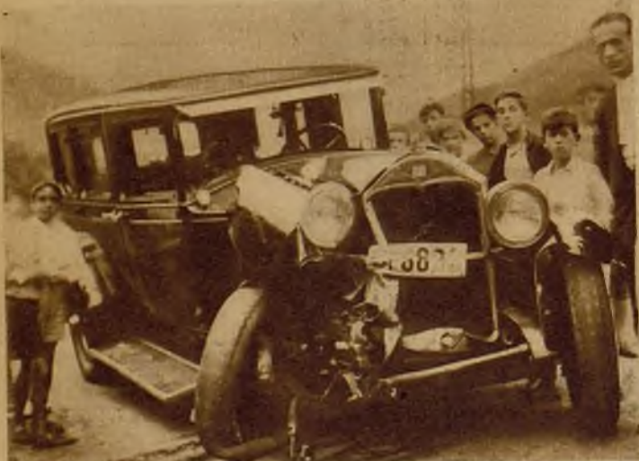
En Deva (Guipúzcoa) chocaron dos automóviles, uno de los cuales, que aparece en la foto, sufrió grandes destrozos. Resultaron cinco personas heridas de los ocupantes de ambos coches