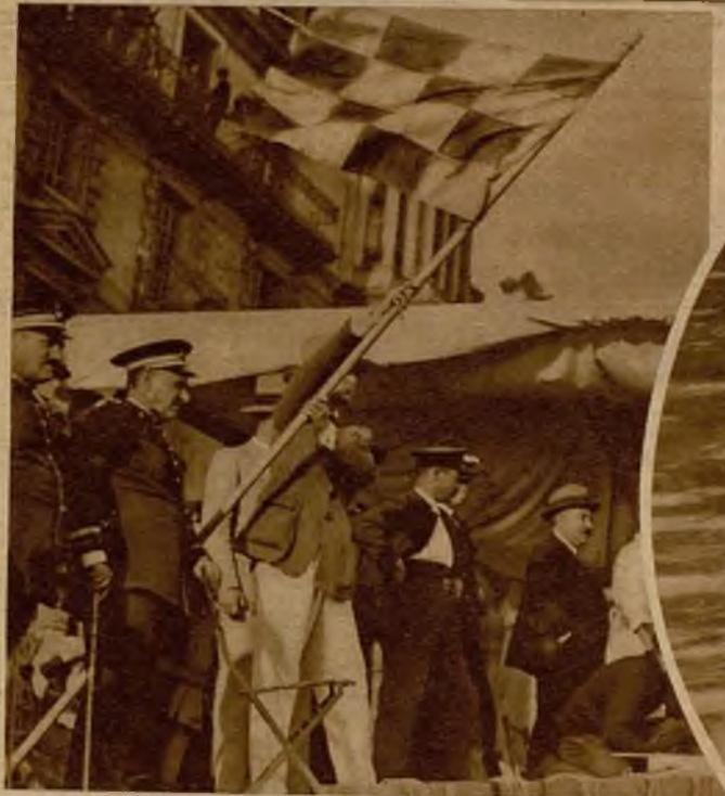
En Bilbao se ha celebrado, con gran brillantez, la segunda y última jornada del concurso de "out-boards". He aquí el momento de señalar la entrada del vencedor