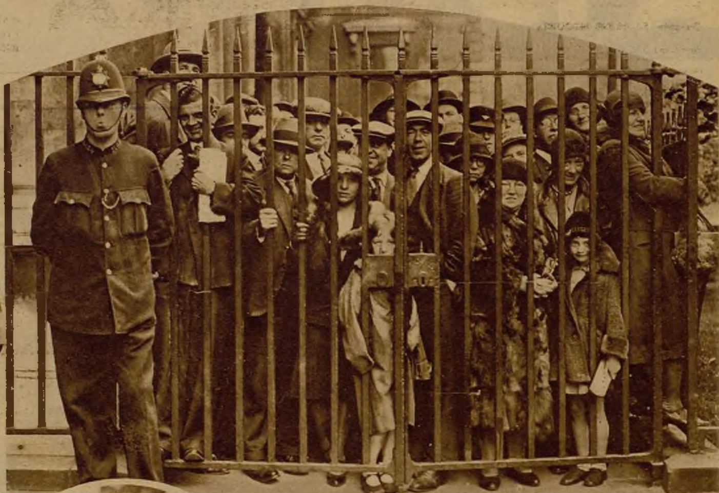
El público londinense vibra a tono con los acontecimientos políticos de estos días. Pegados a las rejas de las puertas del palacio presidencial, esperan ciudadanos y ciudadanas el resultado de las conferencias entre los jefes políticos