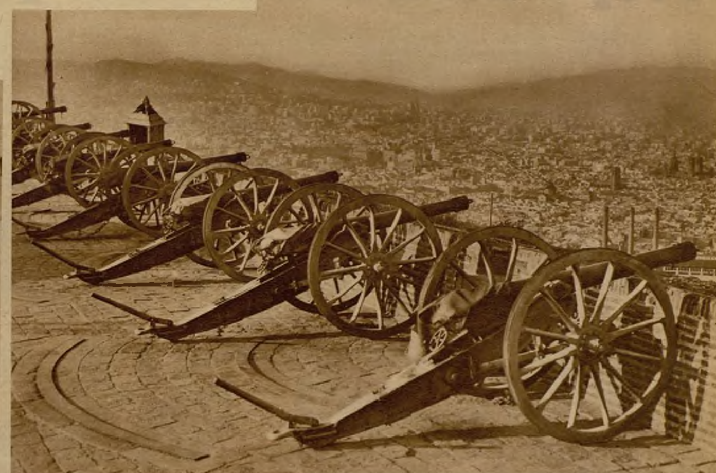
Las baterías emplazadas en Montjuich abarcan en su radio de acción toda la capital de Cataluña