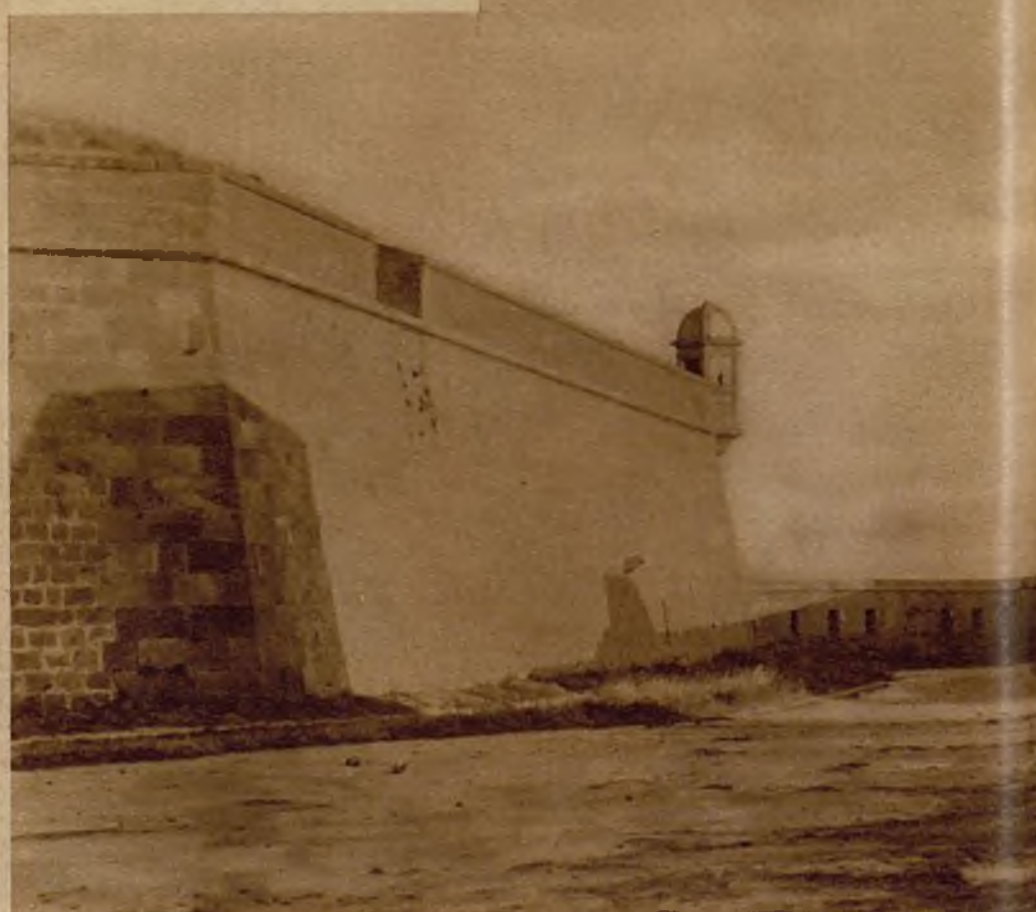
El recinto amurallado del castillo de Montjuich. Este es el lugar donde se realizaban los fusilamientos, que durante muchos años han entenebrecido la historia del histórico fuerte