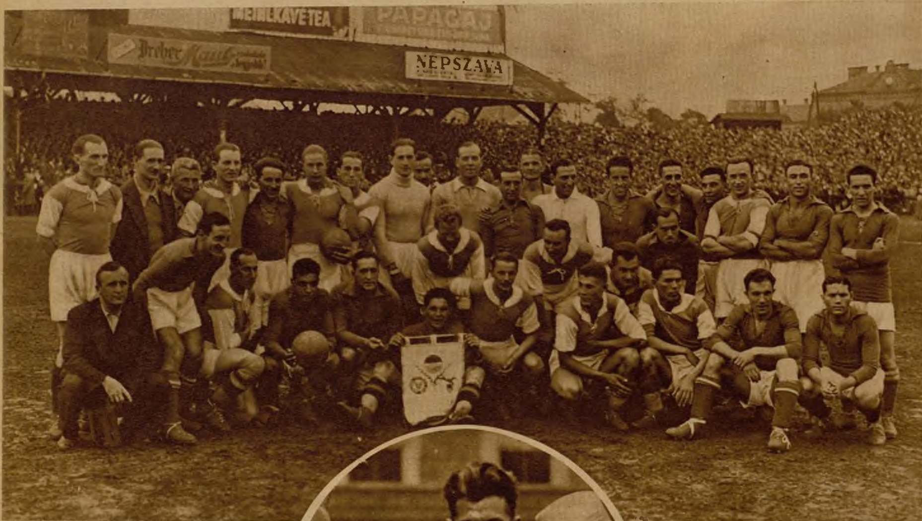
El equipo del Madrid F. C. y del Budapest, sobre el terreno, minutos antes de empezar el partido