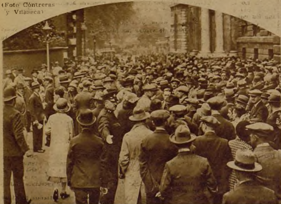
Conocido ya el acuerdo de los políticos para la formación del Gobierno nacional, la multitud espera conocer la lista del nuevo Gobierno