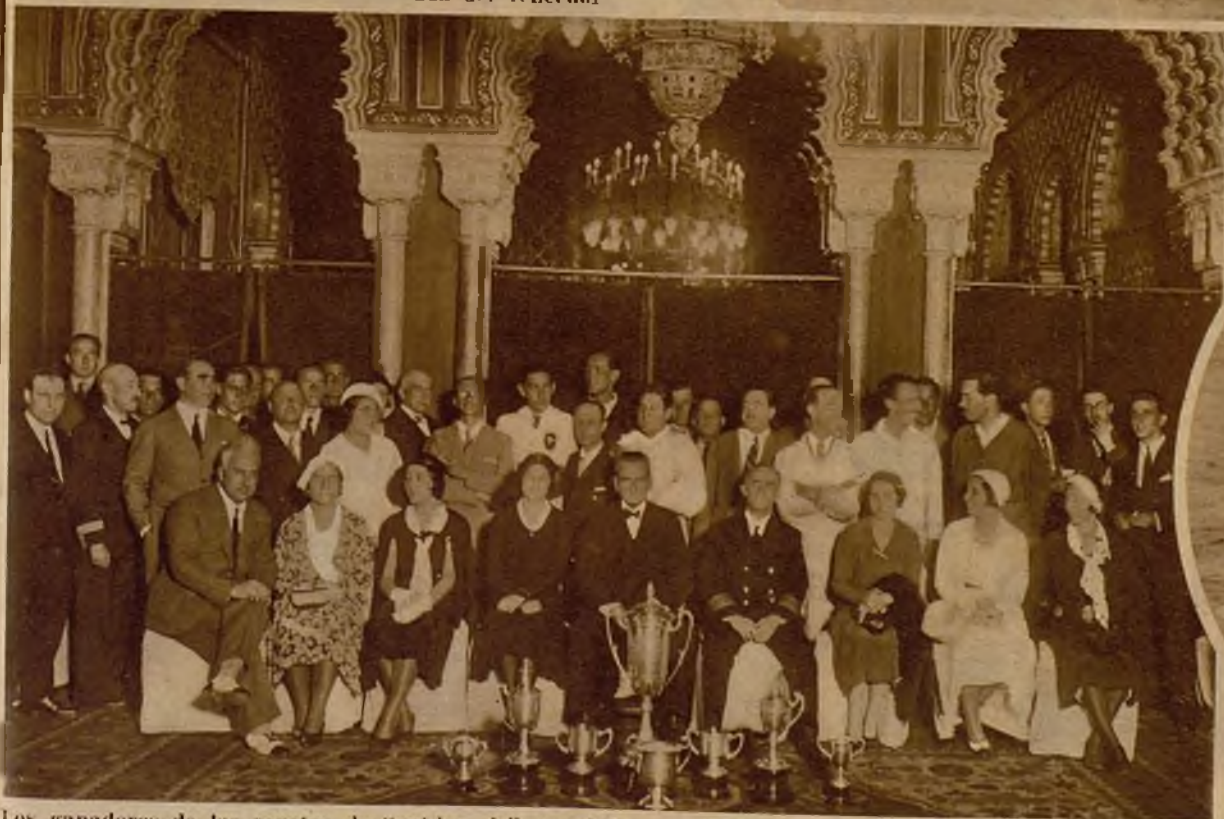
Los ganadores de las regatas de "out-boards", en el Ayuntamiento, acompañados de las autoridades bilbaínas, que les hicieron entrega de las copas que aparecen en primer término