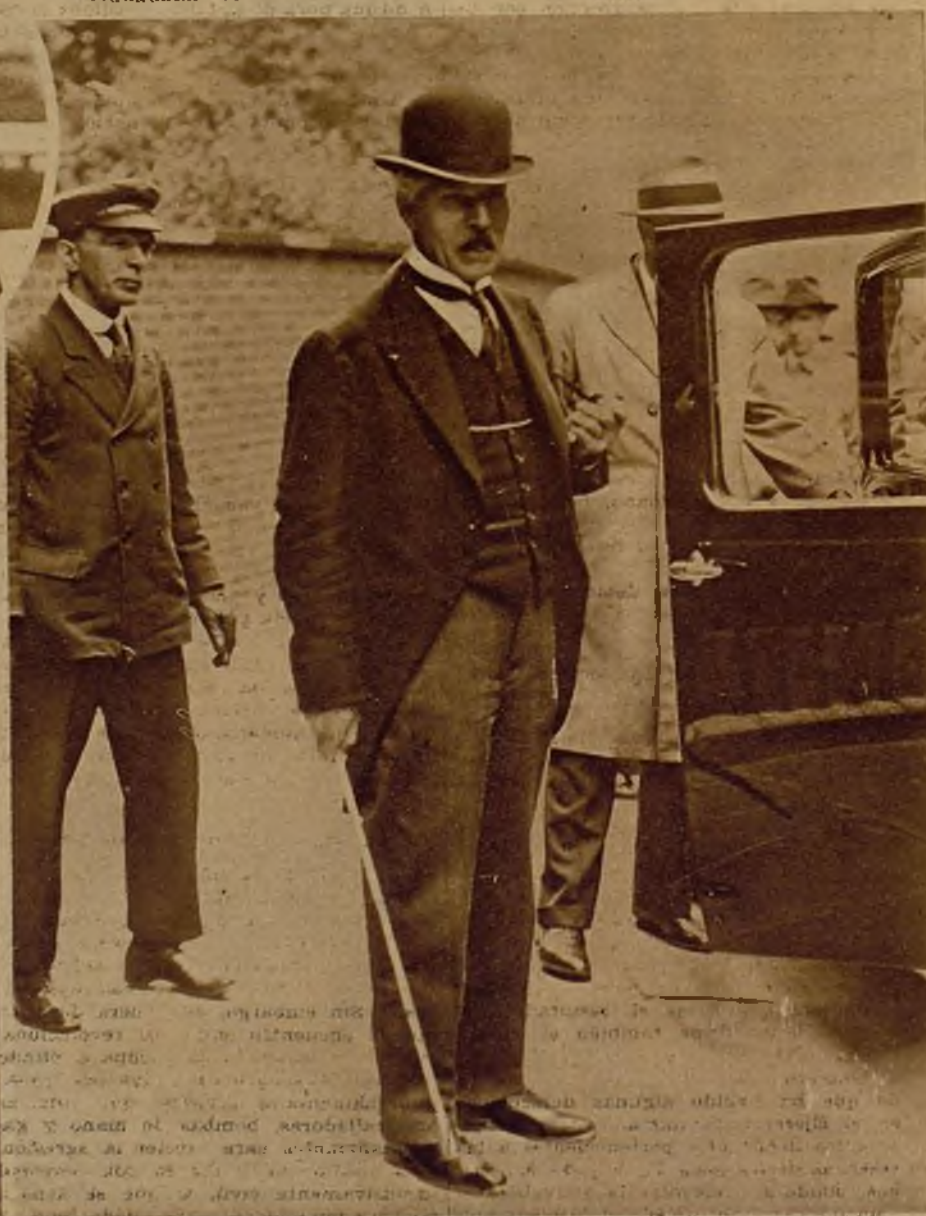
Mr. Ramsay MacDonald, primer ministro del Gabinete nacional británico, al tomar el automóvil, después de haber recibido la aprobación del rey a la lista del Gobierno