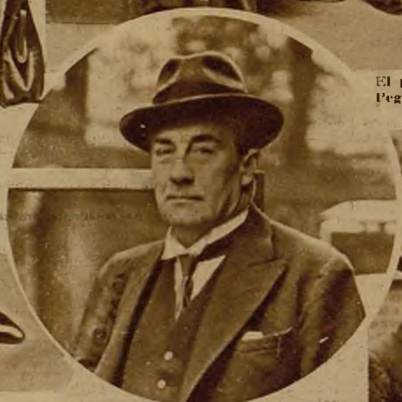
Mr. Stanley Baldwin, que forma parte del Gobierno nacional británico, con la valiosa aportación del partido conservador