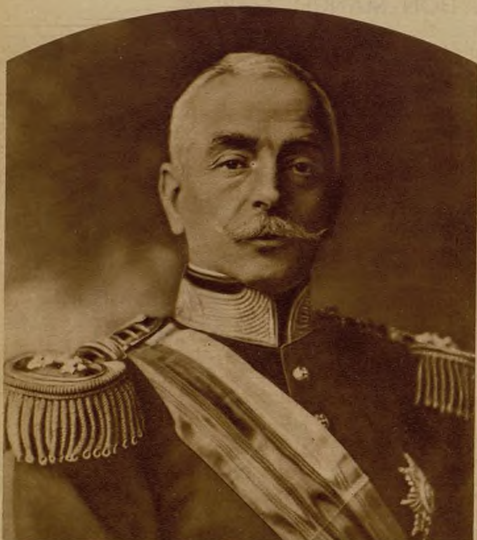
El presidente de la República portuguesa, Antonio Oscar Fraga Carmona.