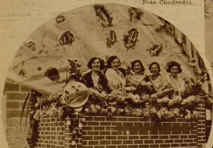
En Luarca (Oviedo) se ha celebrado una lucida batalla de flores. Entre las carrozas adornadas que figuraron en la fiesta, este riente "Patio andaluz" obtuvo el primer premio