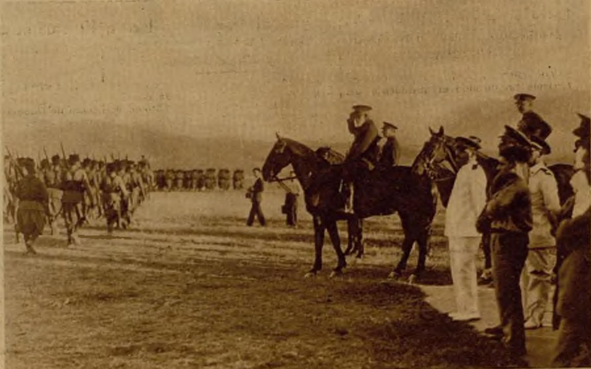
Después de estar largo tiempo separados los siete tabores de la mehala de Gomara, se han reunido en Tetuán, para ser revistados por el general Cabanellas. El jefe de las fuerzas militares de Marruecos con el coronel Capaz, durante la formación