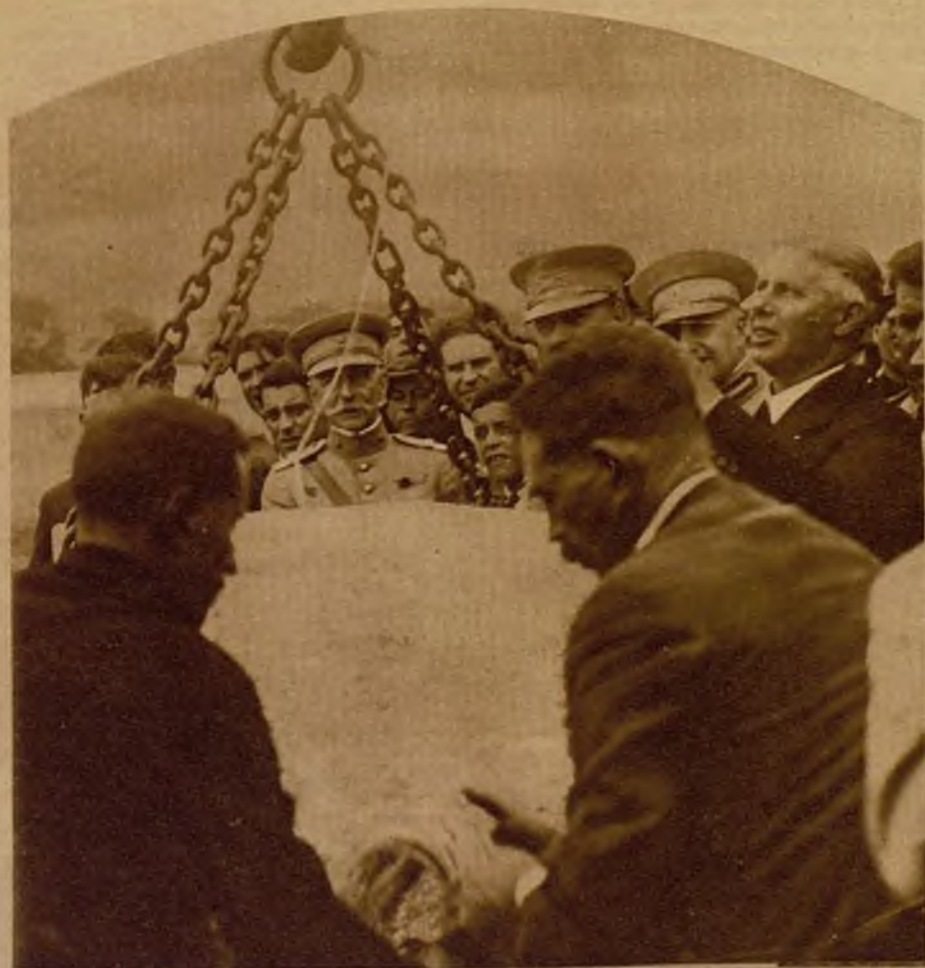
El presidente de la República, en la colocación de la primera piedra de las obras del puerto de Vianna, lugar donde se ha promovido la sublevación