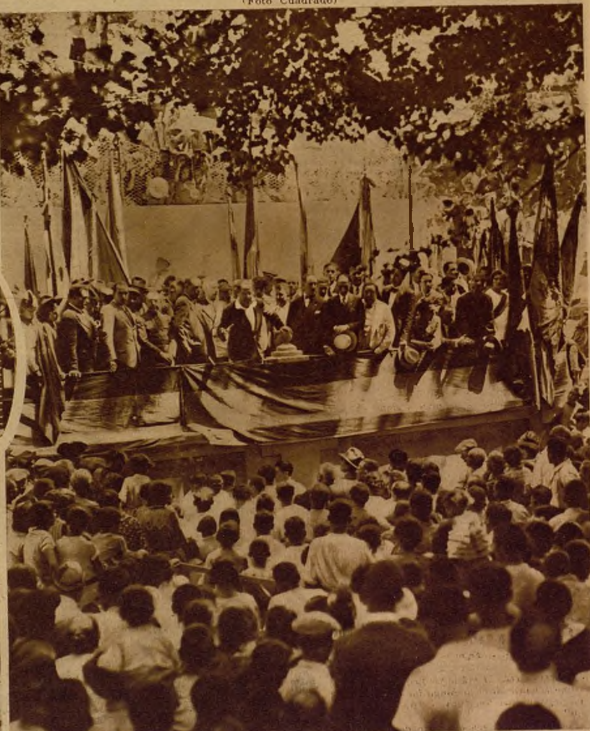
En Buñol (Valencia) se ha celebrado un importante acto político con motivo del descubrimiento de los rótulos de las nuevas calles Blasco Ibáñez, Azzati y República. He aquí a los oradores que tomaron parte en el mismo, en la tribuna presidencial