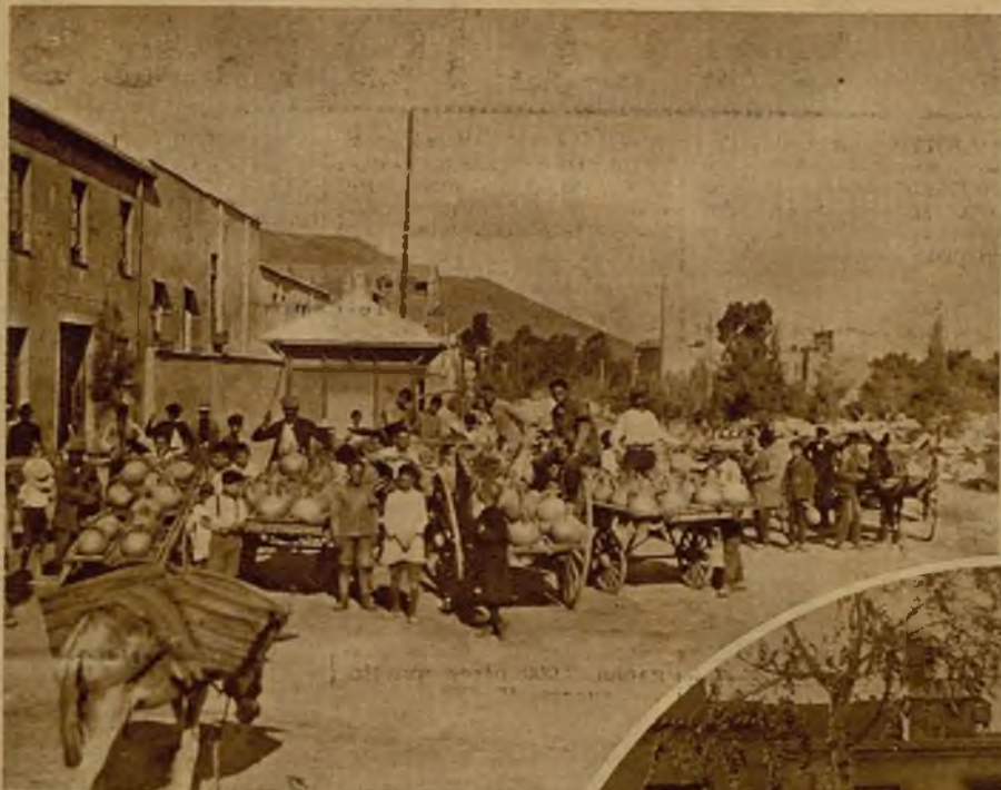
El pueblo de Cartagena atraviesa una situación trágica. Materialmente se muere de sed. El escaso caudal de las fuentes no alcanza a cubrir el mínimo de necesidades, y aun así, el vecindario, como puede observarse en estas tres fotografías, tiene que consumir casi todas las