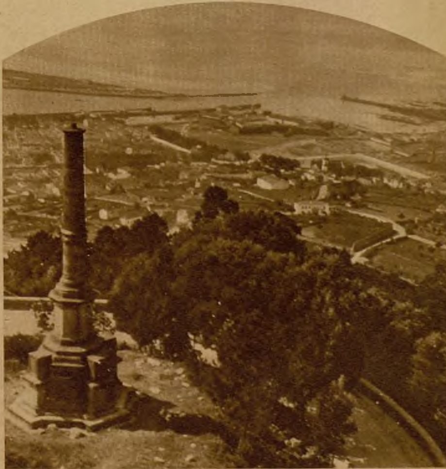
El puerto de Vianna do Castelo, a la desembocadura del río Lima. Esta ciudad parece ser el punto central del movimiento revolucionario