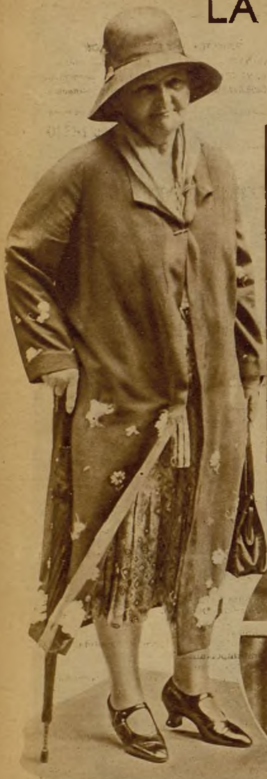
Miss Margaret Bondfield, ex ministro de Trabajo, al llegar al palacio de la Presidencia, en Downing Street, donde se celebraban las conferencias acerca de la crisis