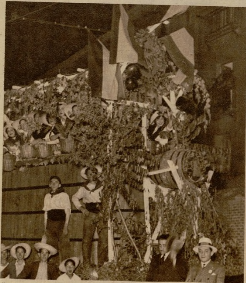
Carroza que el gremio de vinateros presentó en la cabalgata que anoche recorrió las calles madrileñas