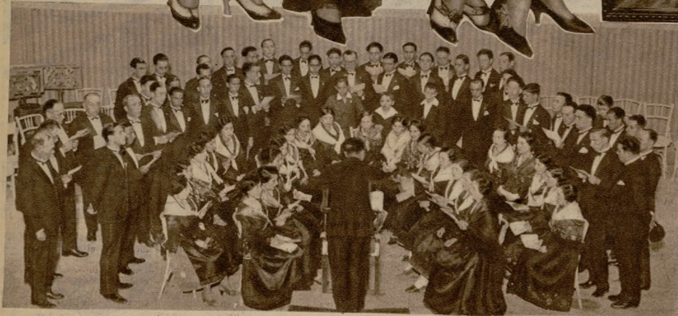
El Orfeón de Cáceres ha dado un magnífico concierto en el Círculo de Bellas Artes, obteniendo un justo y merecido éxito.