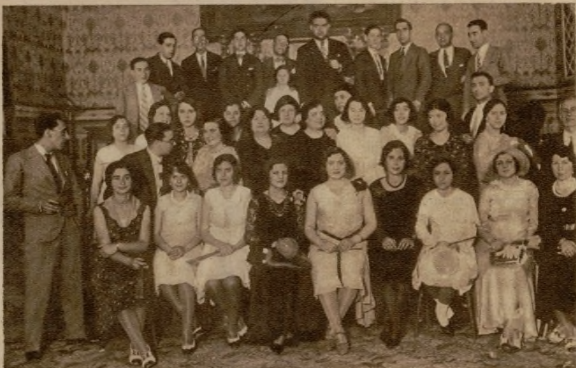
CORDOBA.—En el Conservatorio Oficial de Música se ha celebrado, con motivo de la festividad de San Juan, un concierto, en el que tomaron parte las señoritas que aparecen en la fotografía