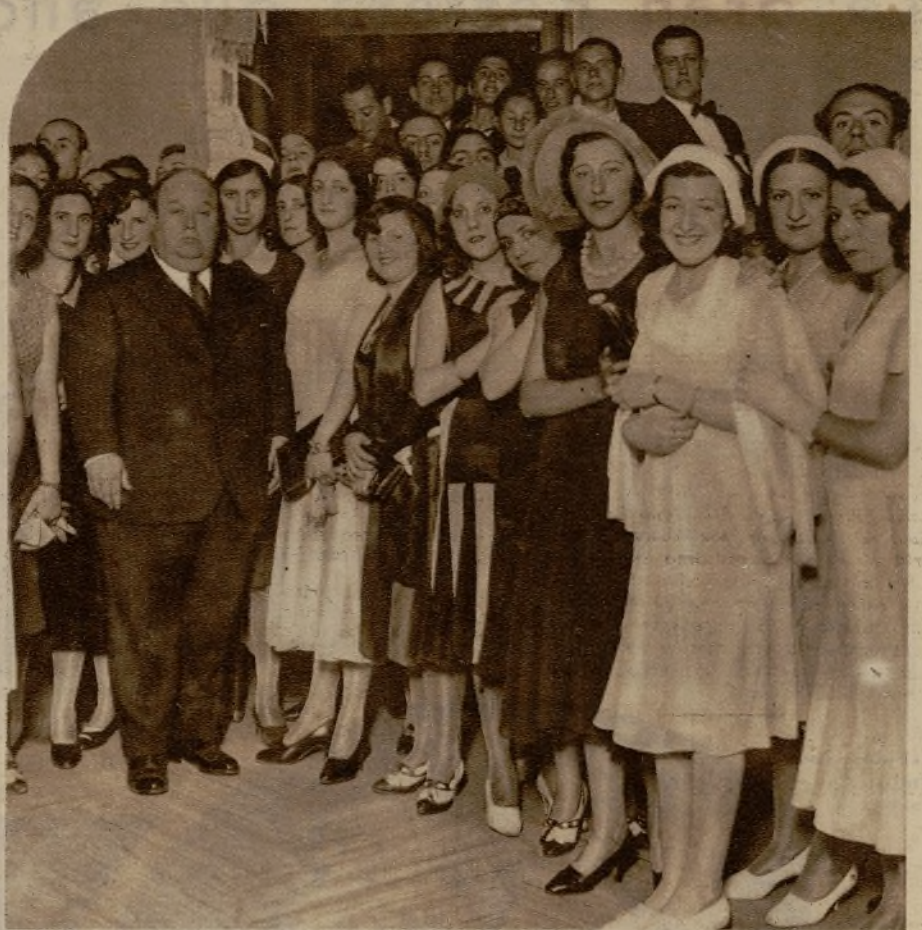
El alcalde de Madrid con los artistas que integran la Coral Zamorana, después del concierto que en la tarde de ayer ha dado esta notable agrupación en el Ayuntamiento