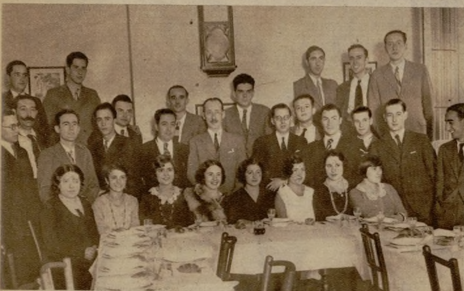
Los nuevos doctores de la Facultad de Farmacia han tenido la buena idea de celebrar su doctorado con un banquete, en el que reinó la alegría y se derrochó el ingenio