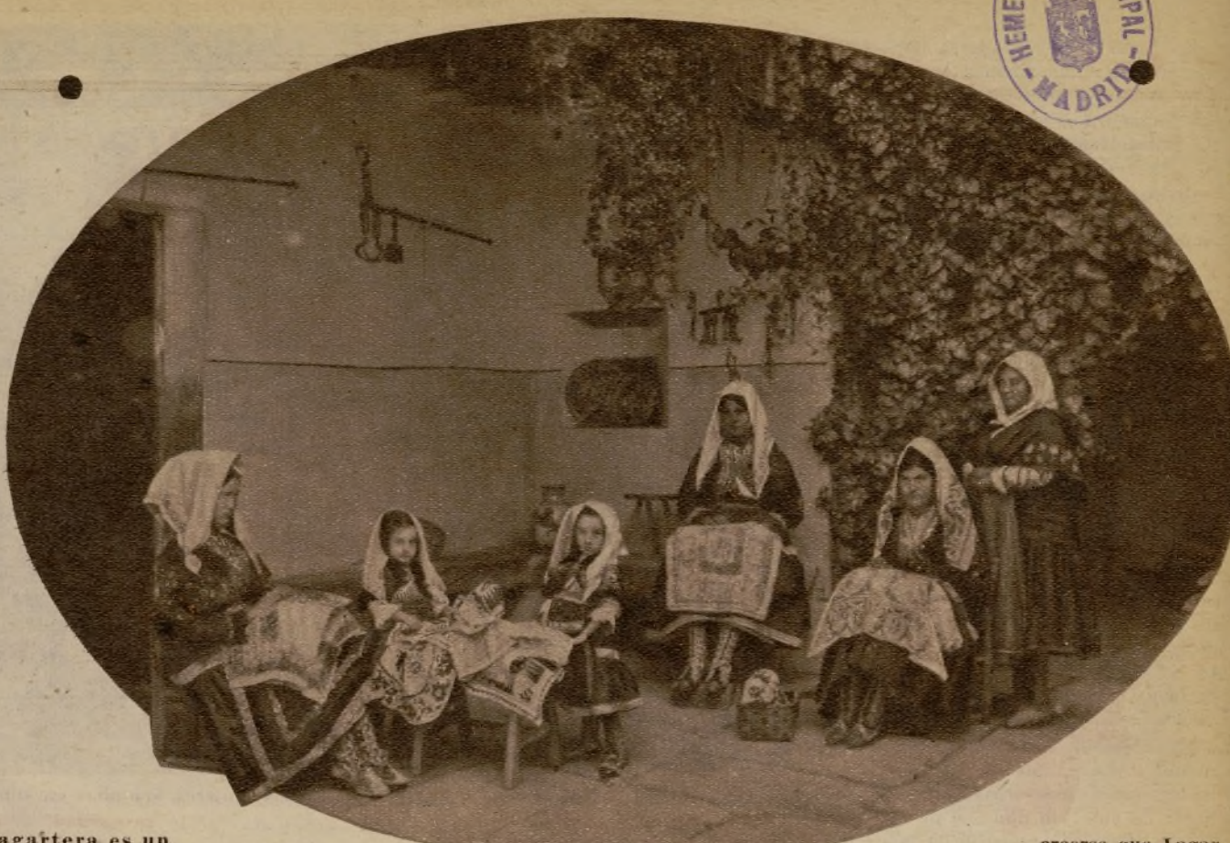
Lagartera es un vasto taller femenino; casi podría

lo", su "guardapiés" y su "estupendo moño de picaporte