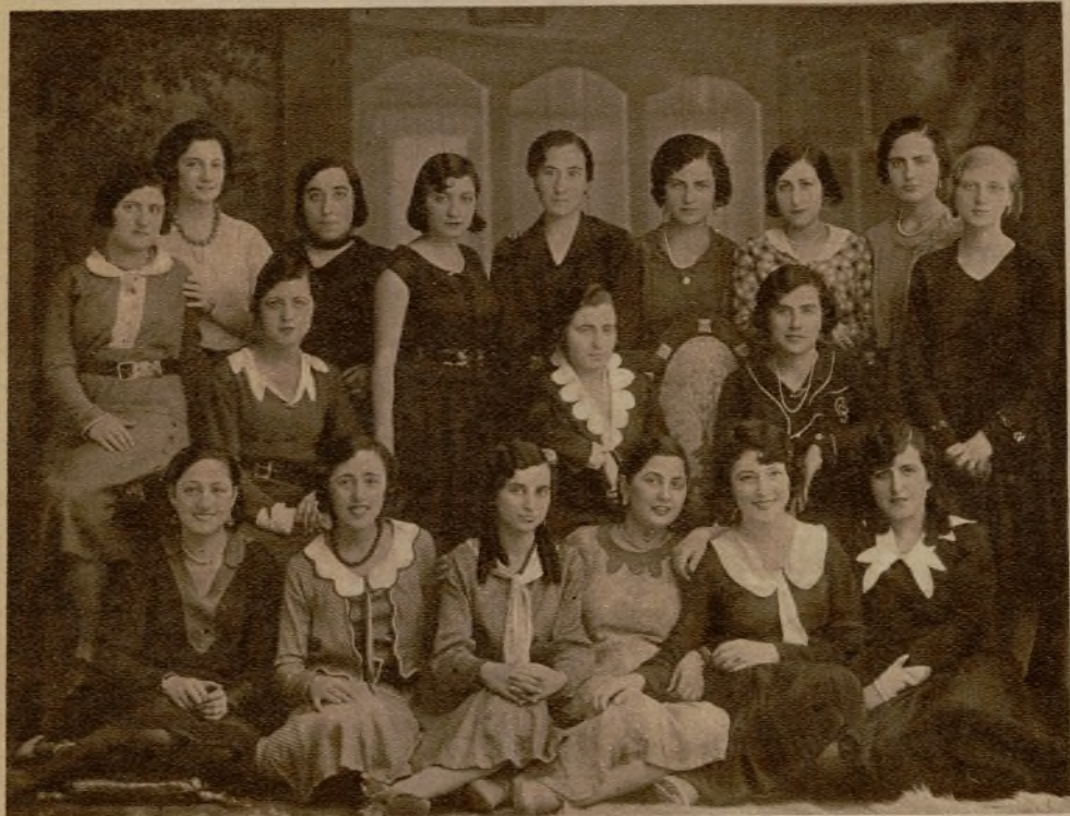
MURCIA.—Las jóvenes maestras que han terminado su carrera en la Escuela Normal de esta ciudad, se reunieron para celebrar su triunfo en alegre y fraternal banquete