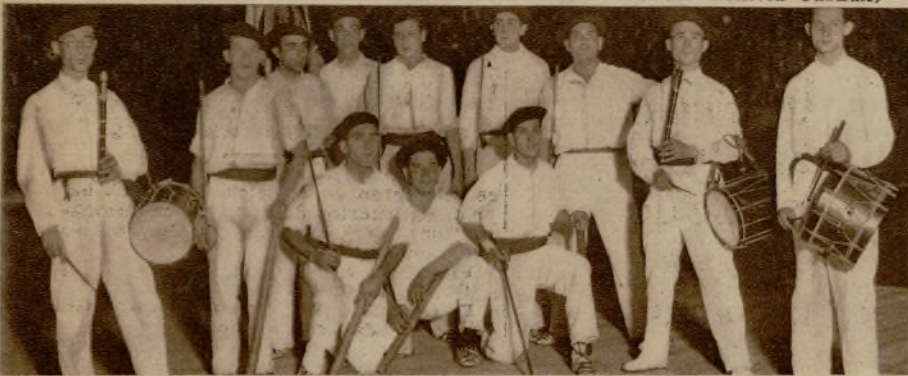
Chistularis y Epatadantzaris de Bilbao que tomaron parte en el festival celebrado en la Plaza de Toros