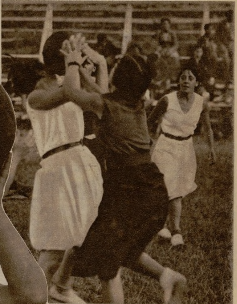
El equipo blanco aprisiona el balón frente al valiente ataque del equipo rojo, que se lanza lleno de ímpetu con el impulso de los grandes momentos por que atraviesa el partido. Bello instante de movimiento y audacia, que termina con el triunfo blanco