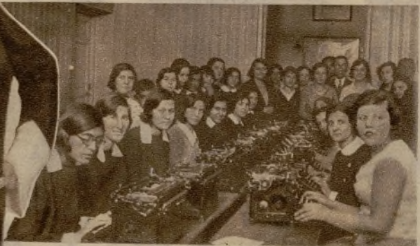
En la Sociedad Amigos del País se ha celebrado un interesante campeonato de mecanografía para disputarse la copa cedida por el citado Centro