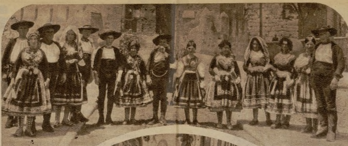
Los lagarteranos que recorren el mundo no tienen que

En el pintoresco pueblo visten así, "de corto", con su "sayue-