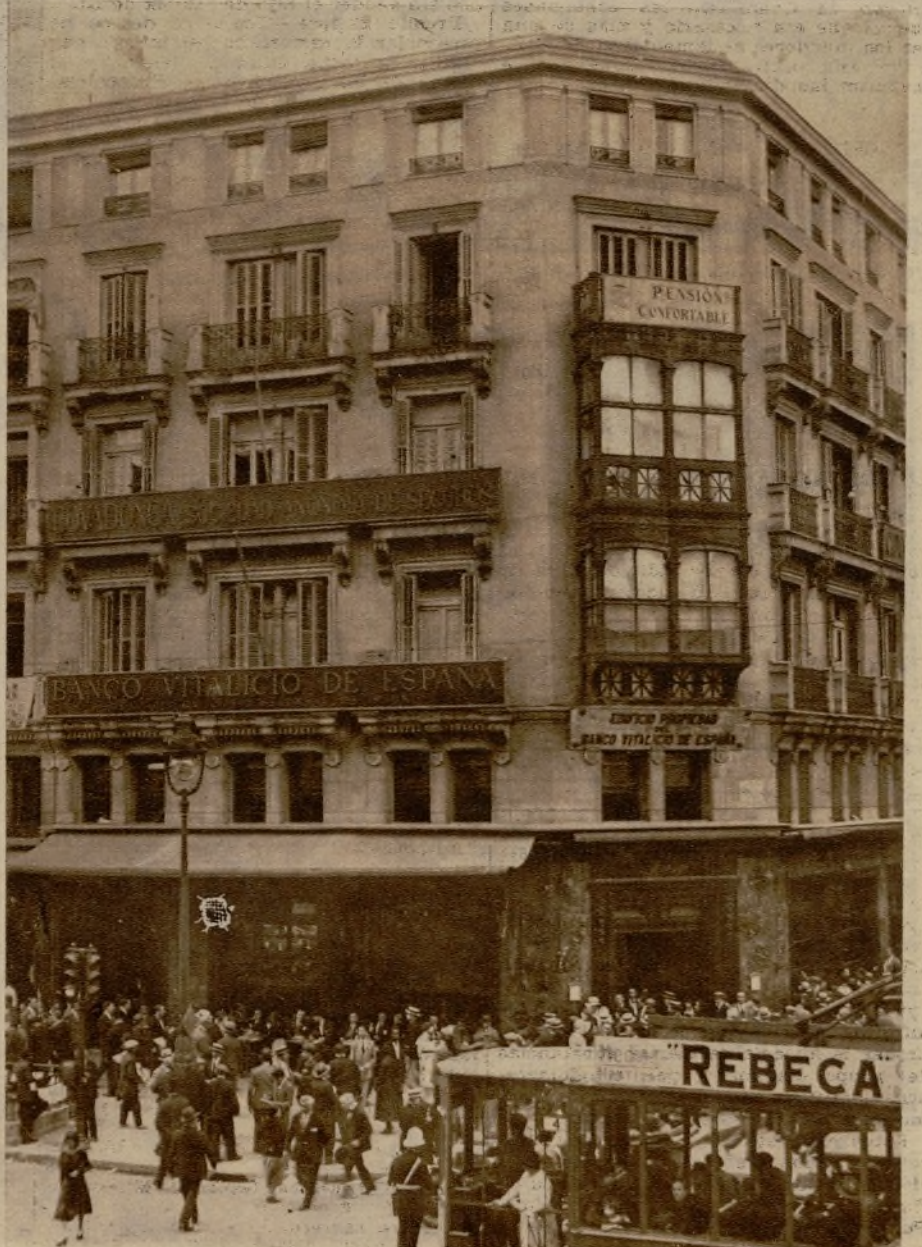
El café Riesgo, antes Fornos, que, como las Calatravas, se asegura que desaparecerá en breve plazo, por haber adquirido su local una casa aseguradora