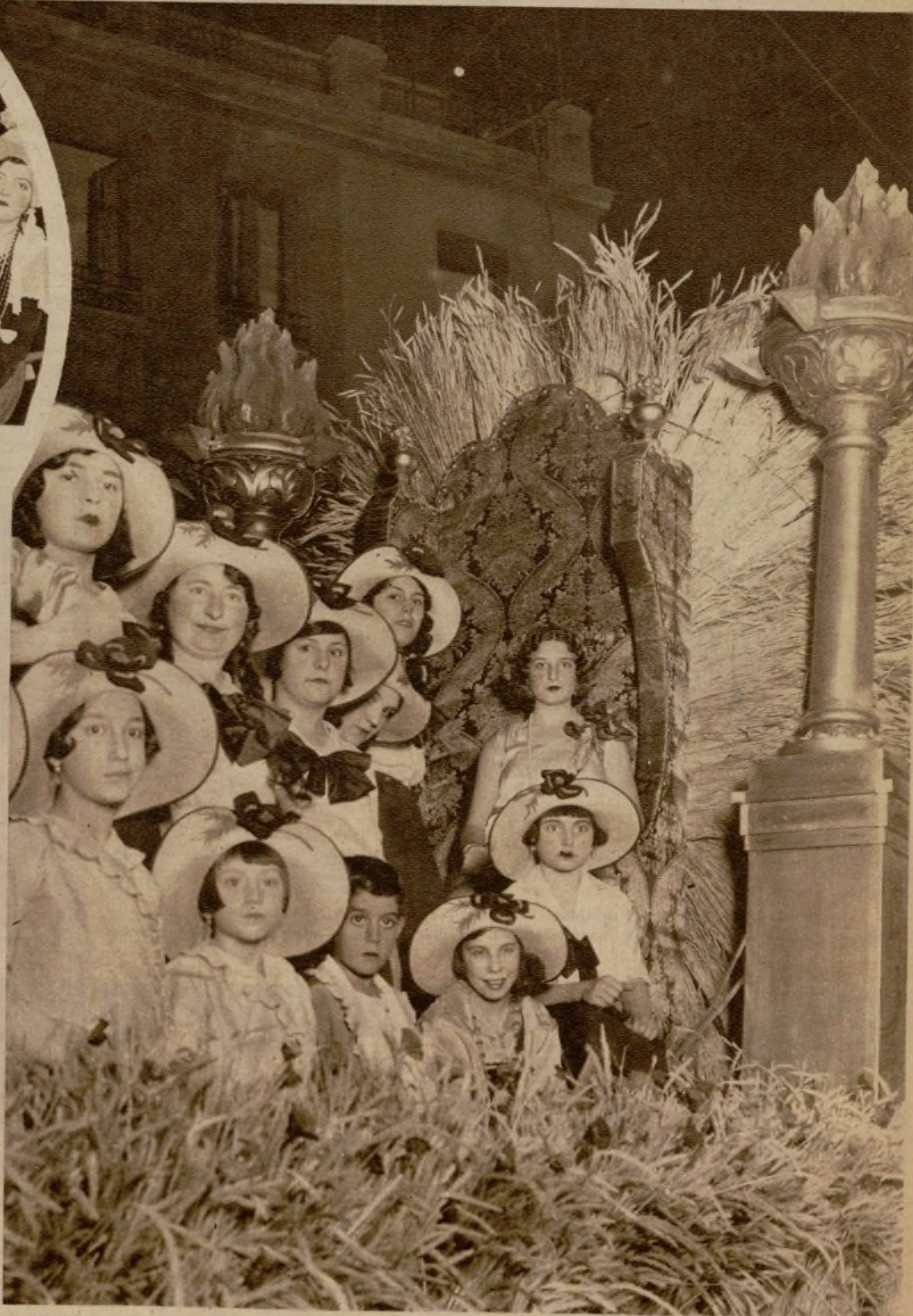
Artística carroza presentada por "La Panera" en la Retreta que se celebró anoche