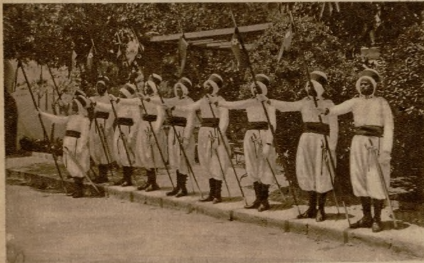
TETUAN.—Lanceros alifanios que actualmente prestan servicio de guardia en la Alta Comisaría, saludando con sus armas