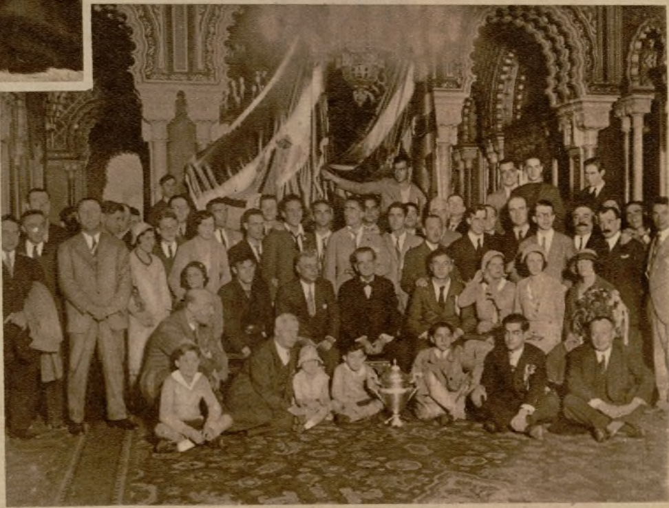
En el Ayuntamiento de Bilbao, el alcalde de la villa ha entregado al equipo del Athlético la copa del Campeonato de España, ganada en Madrid