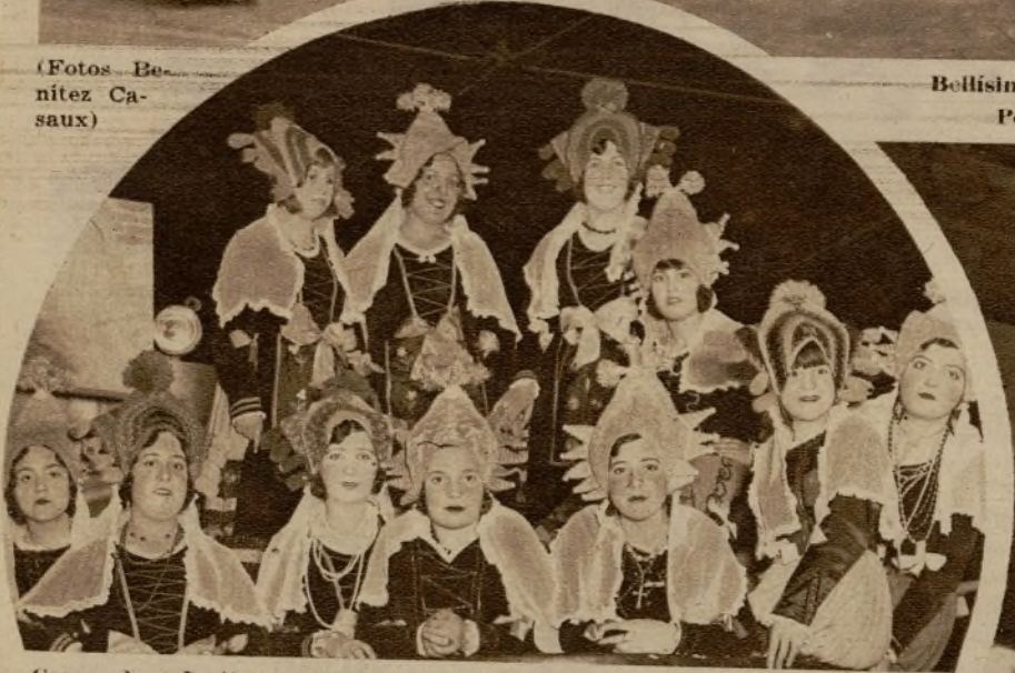
Grupo de señoritas que ocuparon la carroza presentada por los panaderos en la fiesta celebrada anoche.