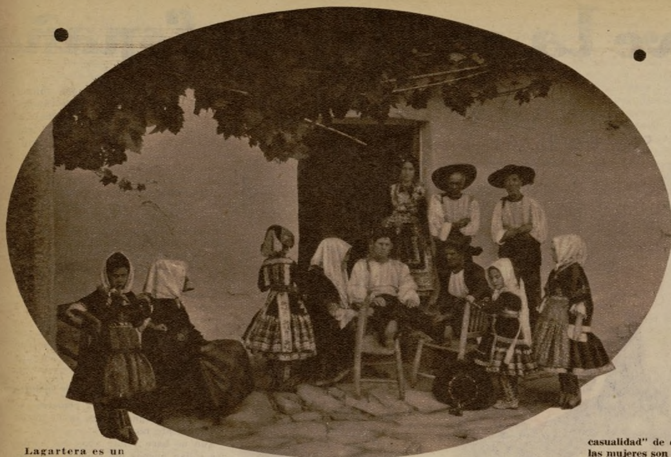
Lagartera es un pueblito castellano donde "da la

gracias a ellas—y también, sin duda, a las necesidades económicas—empezaron a industrializar su arte.