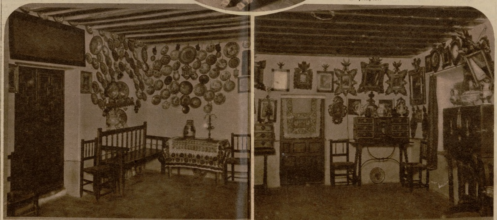
Dos interiores de viviendas lagarteranas; dos pequeños museos de arte pueblerino

Y apareció el personaje de la dibujanta.