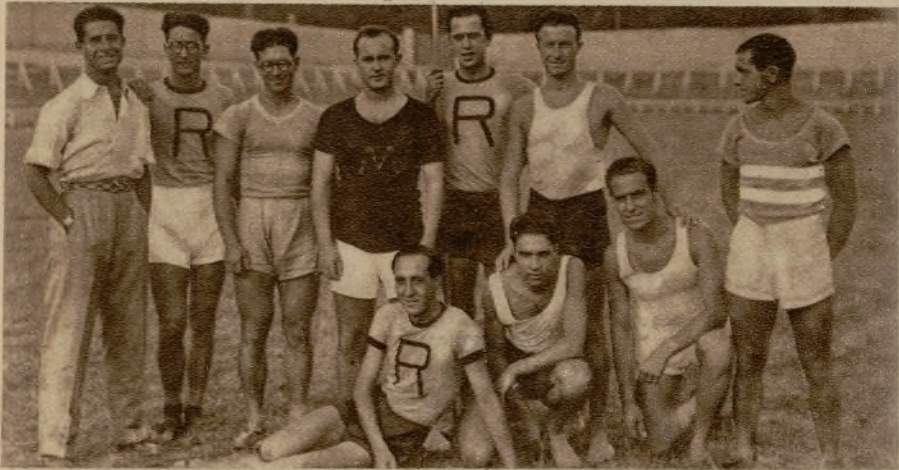
En el campo del Nacional se ha verificado una fiesta atlética de las correspondientes a la celebración del advenimiento de la República. En la fotografía, los deportistas que realizaron ejercicios