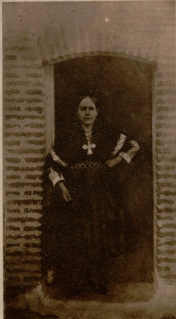
La señora alcaldesa de Lagartera con su pañoleta de días de fiesta

Las facilidades de comunicación han contribuido al mismo tiempo a matar el "color local" en muchos sitios, y a fomentarlo en algunos; gracias a ellas, las lagarteranas empezaron a "salir";