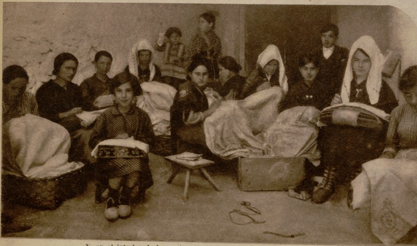
Y, en el interior de los patios, lo mismo que en la calle, cosen también