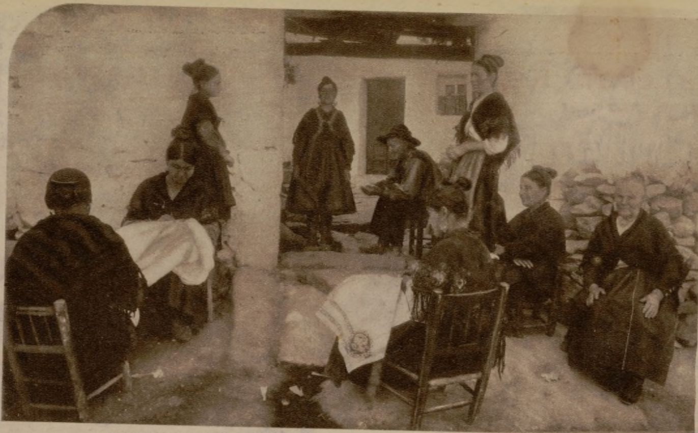
Ante las puertas de las casas, las mujeres, sentadas en sillas bajas, cosen, cosen...

Con su buen sentido—que es también buen gusto innato—, las dibujantas lagarteranas se limitan, en su reproducción del natural, a elementos invariables, como es, principalmente, el traje.