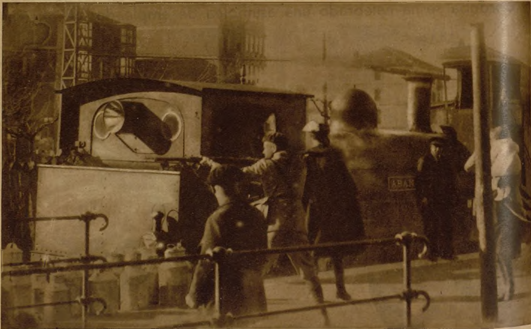
A la llegada a Baracaldo de un tren de la línea de Triano fué tiroteada la fuerza que lo custodiaba, resultando herido un guardia civil. En la fotografía, el momento en que un foral, al ver al guardia herido, trata de detener a los huelguistas