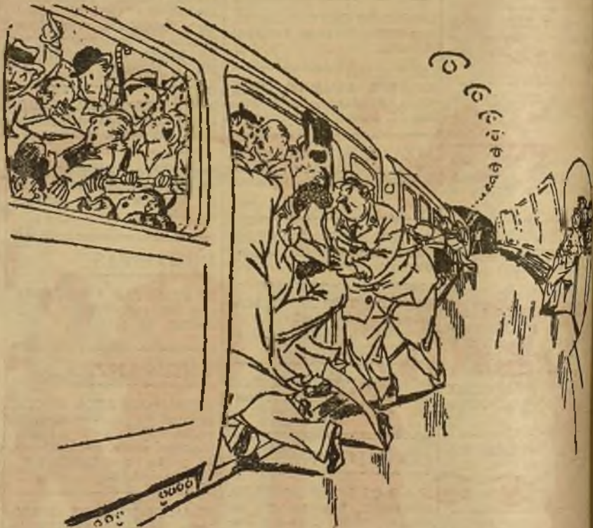
EL EMPLEADO DEL "METRO"

Unas gotas de granadina Media copita de crema de cacao Media copita de coñac Agítese muy bien y sírvase en copa de cocktail, añadiendo una cereza en almíbar P. CHICOTE