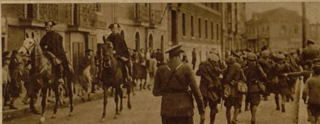
Fuerzas del Ejército y de la Guardia civil patrullando por las calles de Sestao durante la huelga última