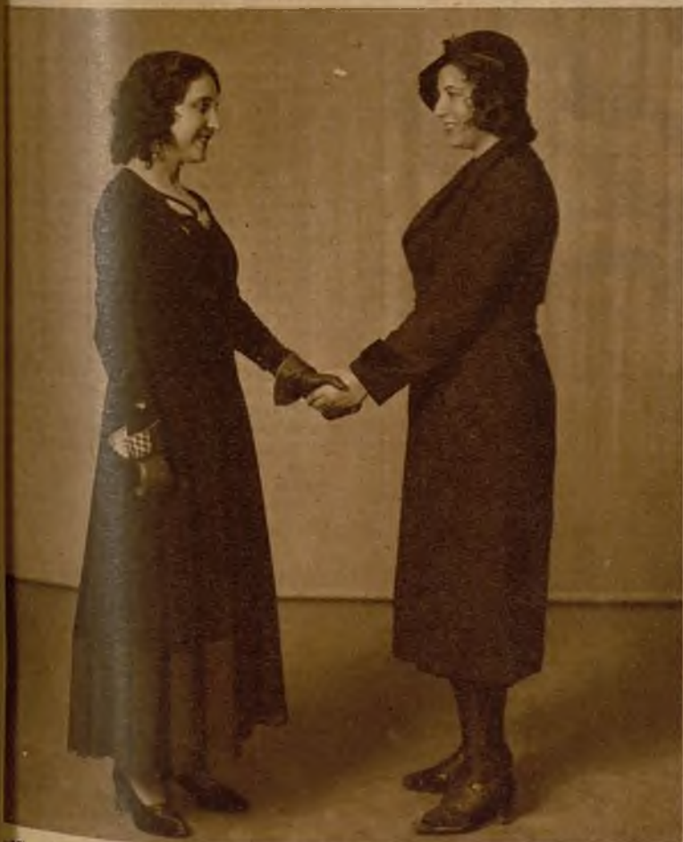
"Miss República" felicitando a "Miss Madrid" por el éxito de su nombramiento