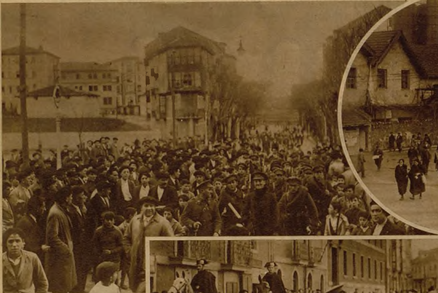
El regimiento de Montaña al llegar a la plaza de los Fueros de Sestao para mantener el orden, con motivo de la huelga declarada el lunes. Afortunadamente, el movimiento no encontró ambiente, y la huelga se ha resuelto sin más incidentes