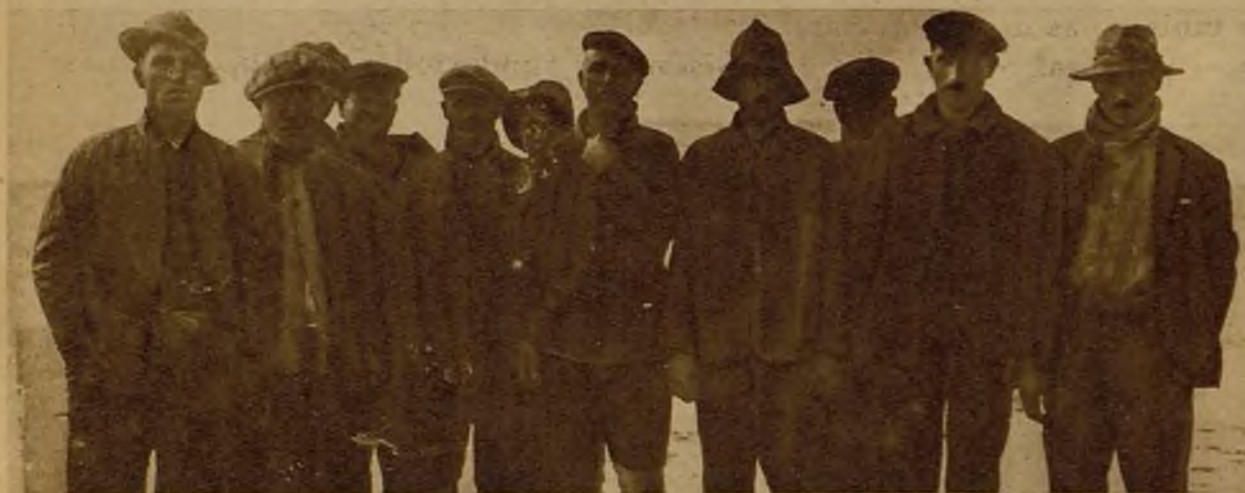
Tripulantes del pesquero "San José", que gracias a su gran pericia y valor lograron escapar de una muerte cierta, luchando denodadamente contra el furioso temporal y la angustiosa situación del vapor