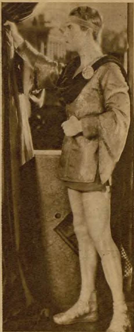
"Ben-Hur" fue la sinfonia de sombras más maravillosa que se vió en la panta- lla. Hoy esta sinfonia tendrá, además, el ritmo y la melodía de una adaptación sonora