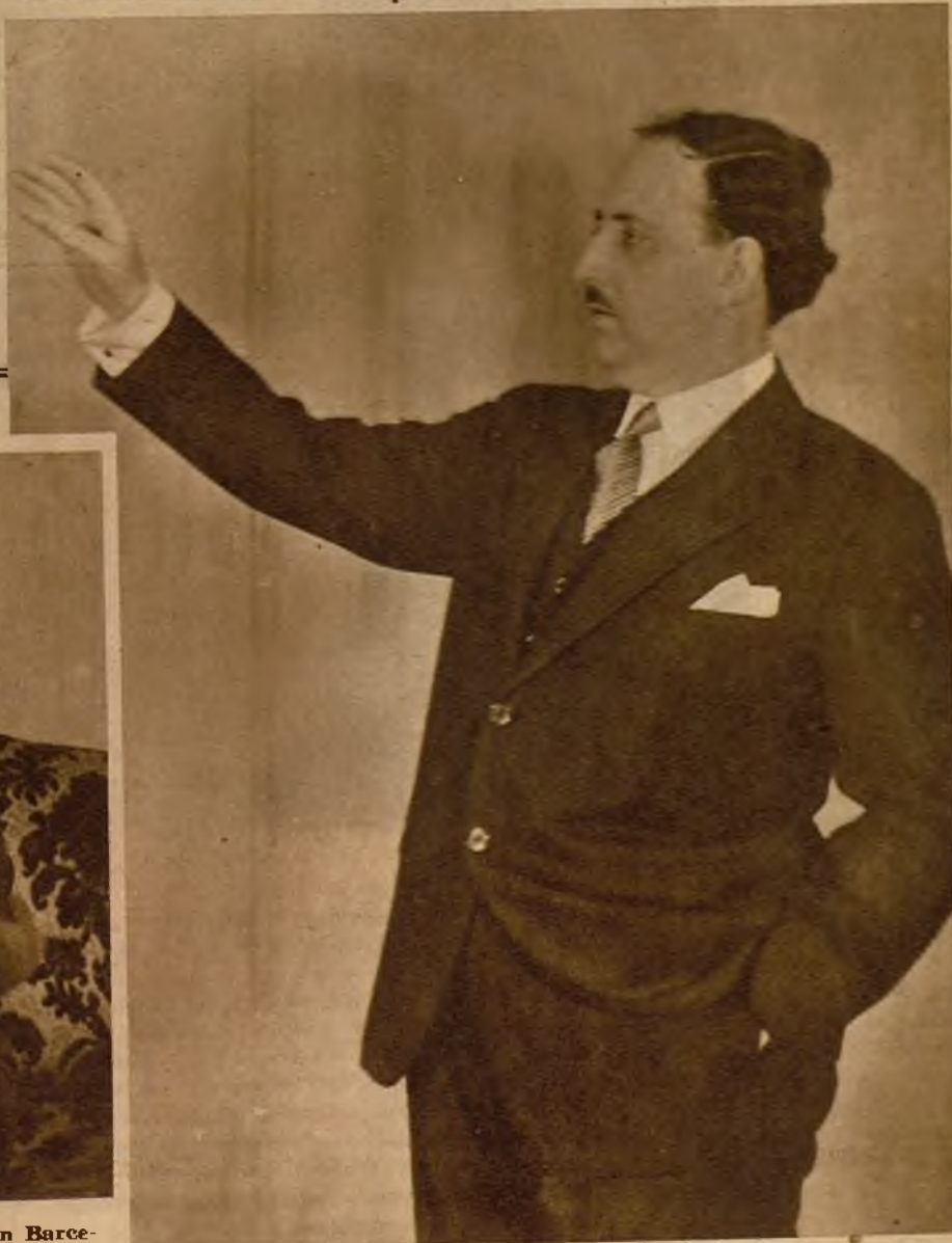
El ilustre escritor Hernández Catá pronunciando su conferencia sobre "Deberes y derechos de la juventud en el momento actual"