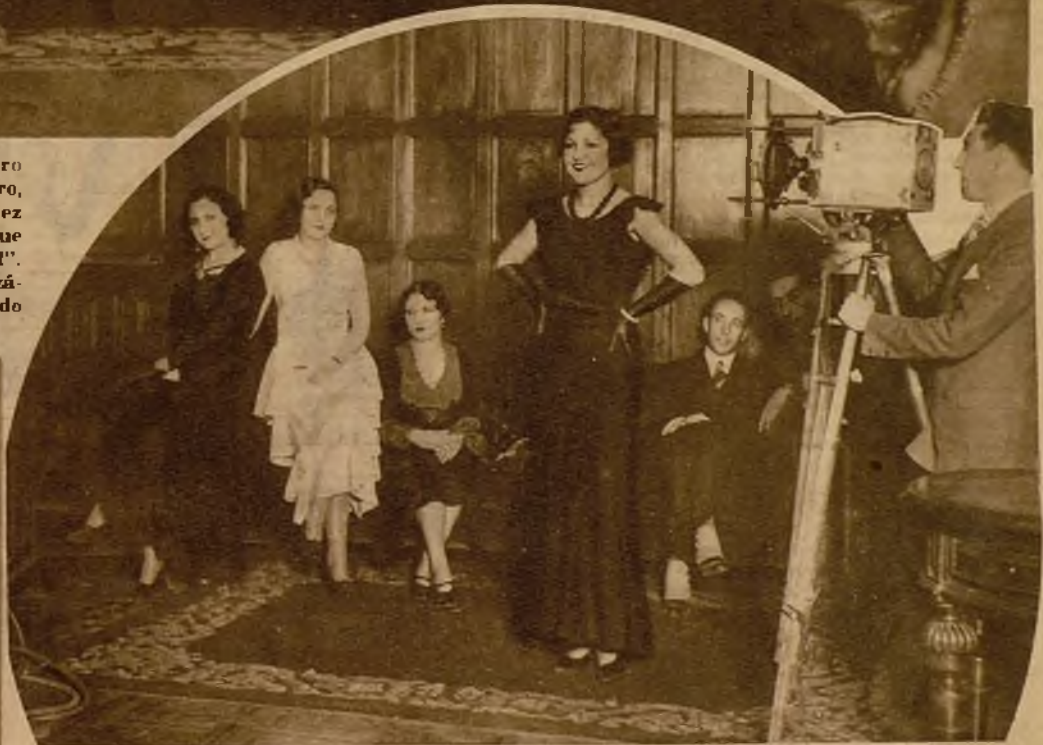
Un momento de la elección de "Miss Madrid"