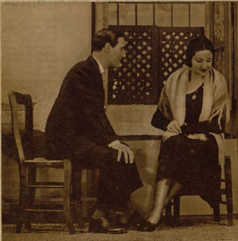
Una escena de la comedia "Solera", estrenada anoche en el teatro Fontalba