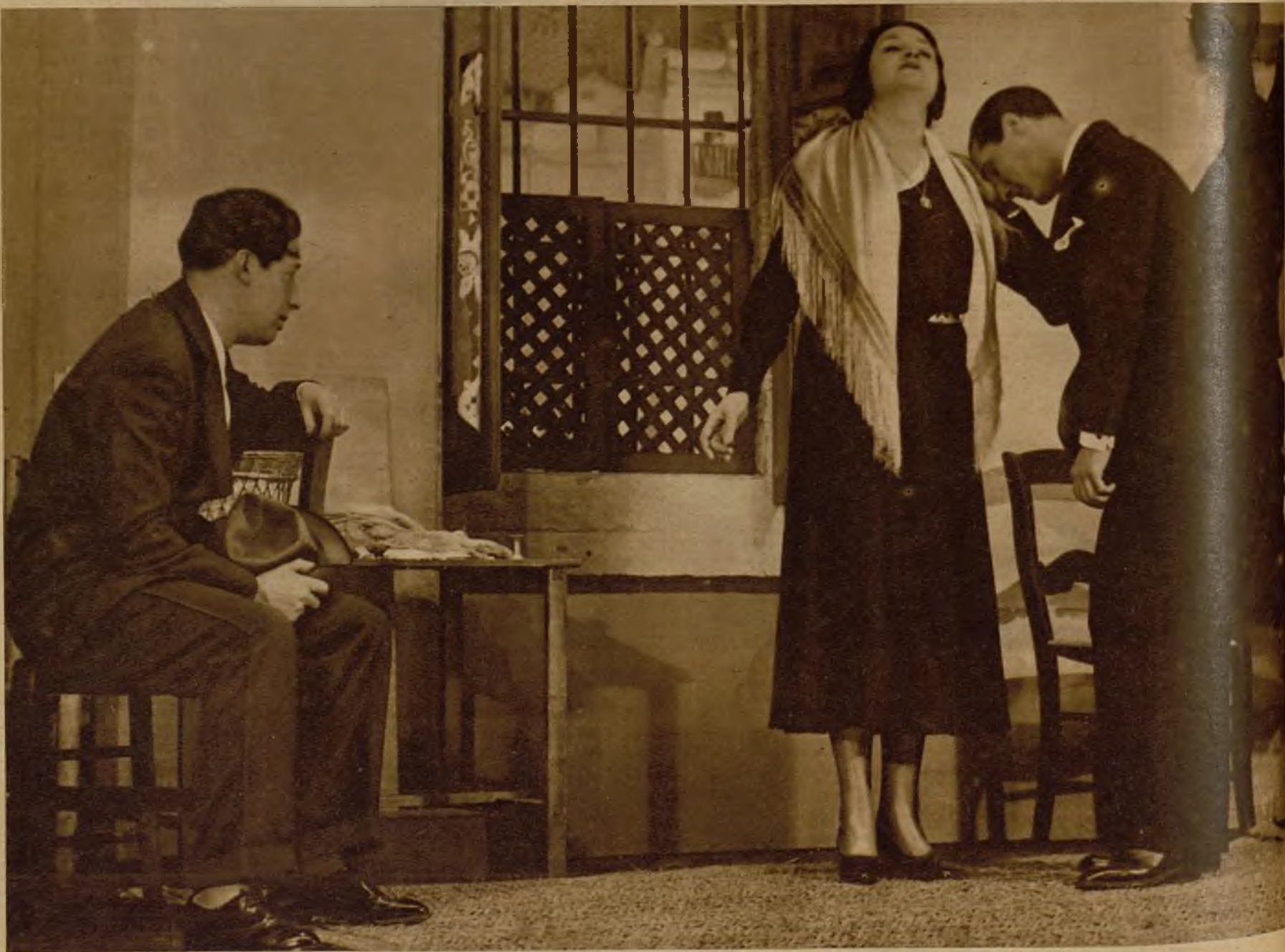
Otro momento de la comedia andaluza, original de los ilustres autores Alvarez Quintero, que se ha estrenado anoche en el teatro Fontalba (Foto Contreras y Vilaseca) Ayuntamiento de Madrid