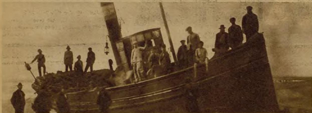
En la isla Cristina (Huelva), el vapor de pesca "San José" se vio sorprendido por un fuerte temporal, que le hizo embestir violentamente contra la costa. Estado en que quedó la embarcación