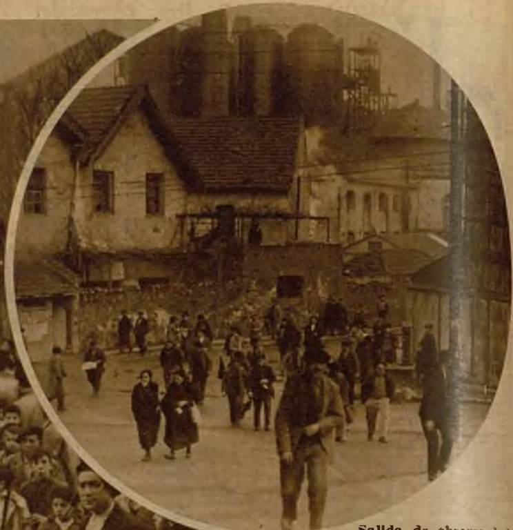
Salida de obreros de los Altos Hornos, custodiados por la Guardia civil