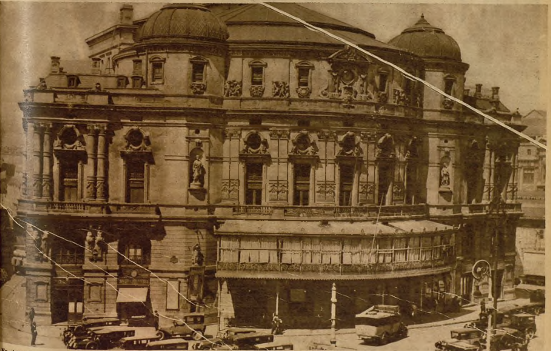
En el teatro Arraga, de Bilbao, al representarse anoche el juguete cómico de Muñoz Seca "La Oca", se alborotó el gallinero estrepitosamente, cantándose "La Internacional" y "La Marsellesa". Los guardias desalojaron el paraíso a sablazos. Los nuevos Adanes protestaron y hubo que devolverles el importe de la entrada