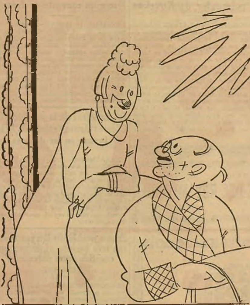
QUIEN TUVO Y RETUVO..., por K-HITO

—Pues te advierto que algo tendrá el agua cuando la bendicen: ayer me preguntó uno en la calle si era yo Miss Castilla la Vieja. —Lo de Castilla no es verdad.