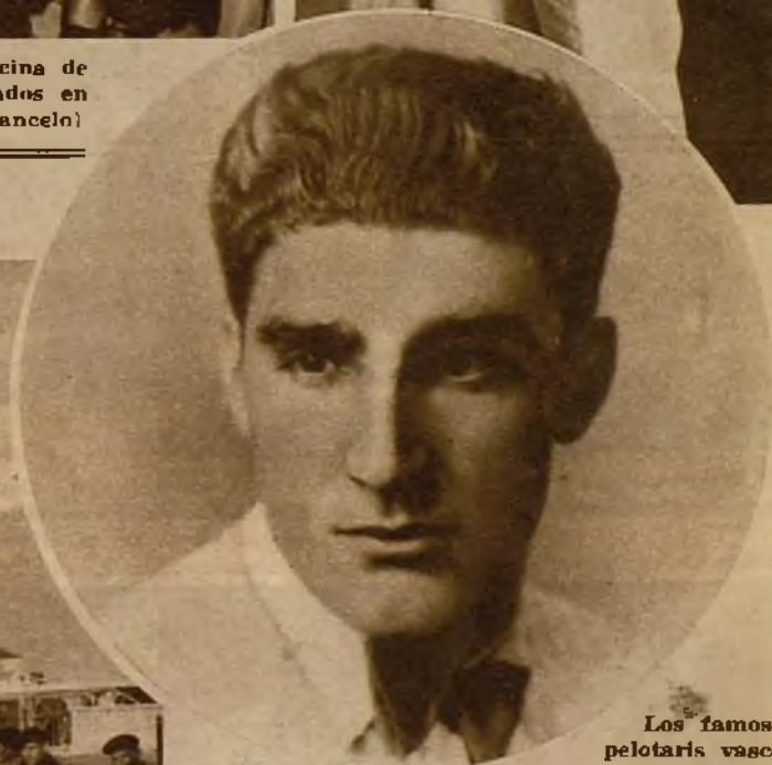
Los famosos pelotaris vascos Félix Alberdi y Pedro Acha, que han sido contratados ventajosamente para actuar en Shangay