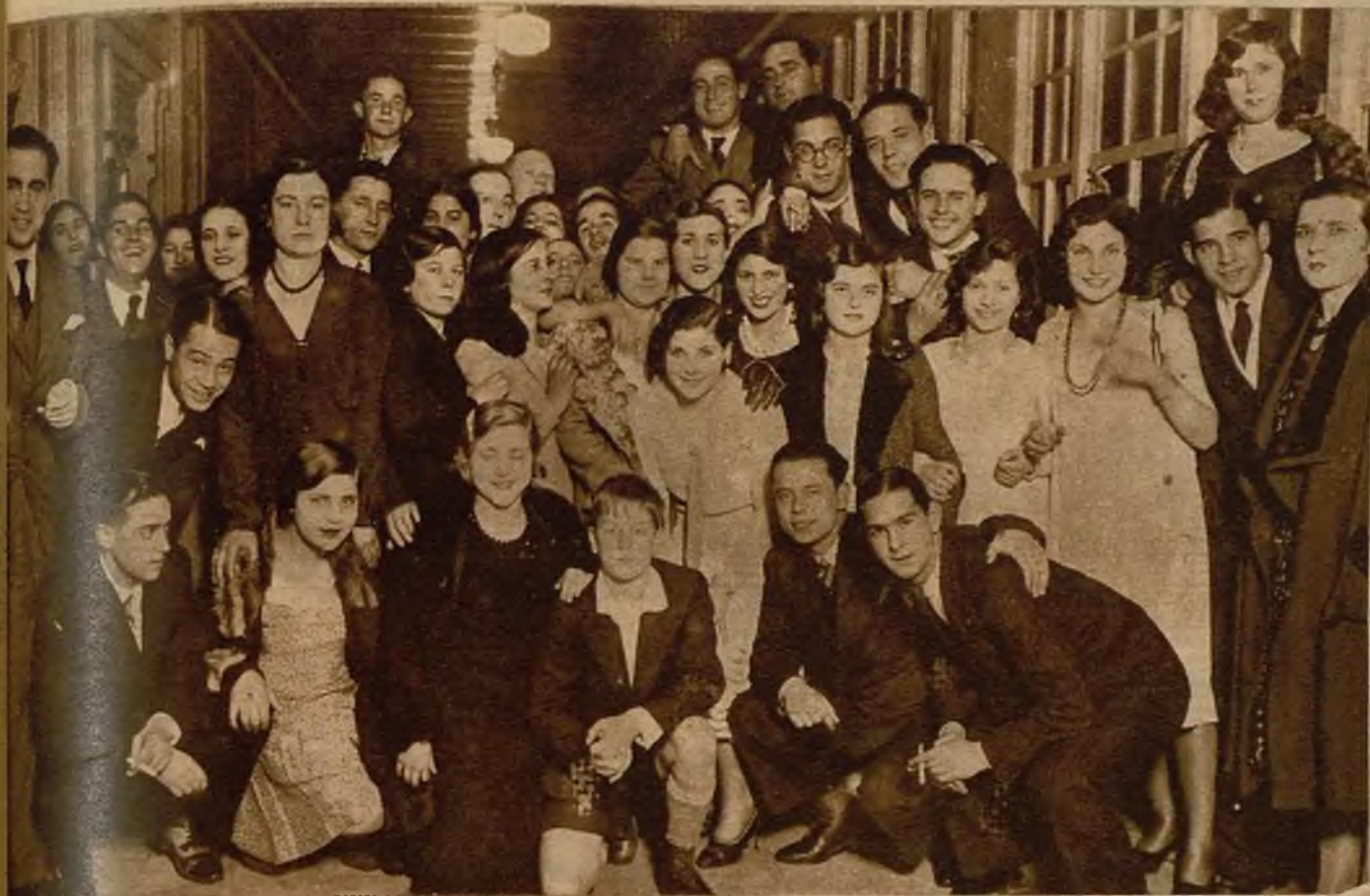
CORUSA.—Concurrentes al baile organizado por los estudiantes coruñeses en honor de los de Medicina de Santiago, con motivo de haber obtenido los títulos de inspectores de Sanidad en los cursillos celebrados en La Coruña