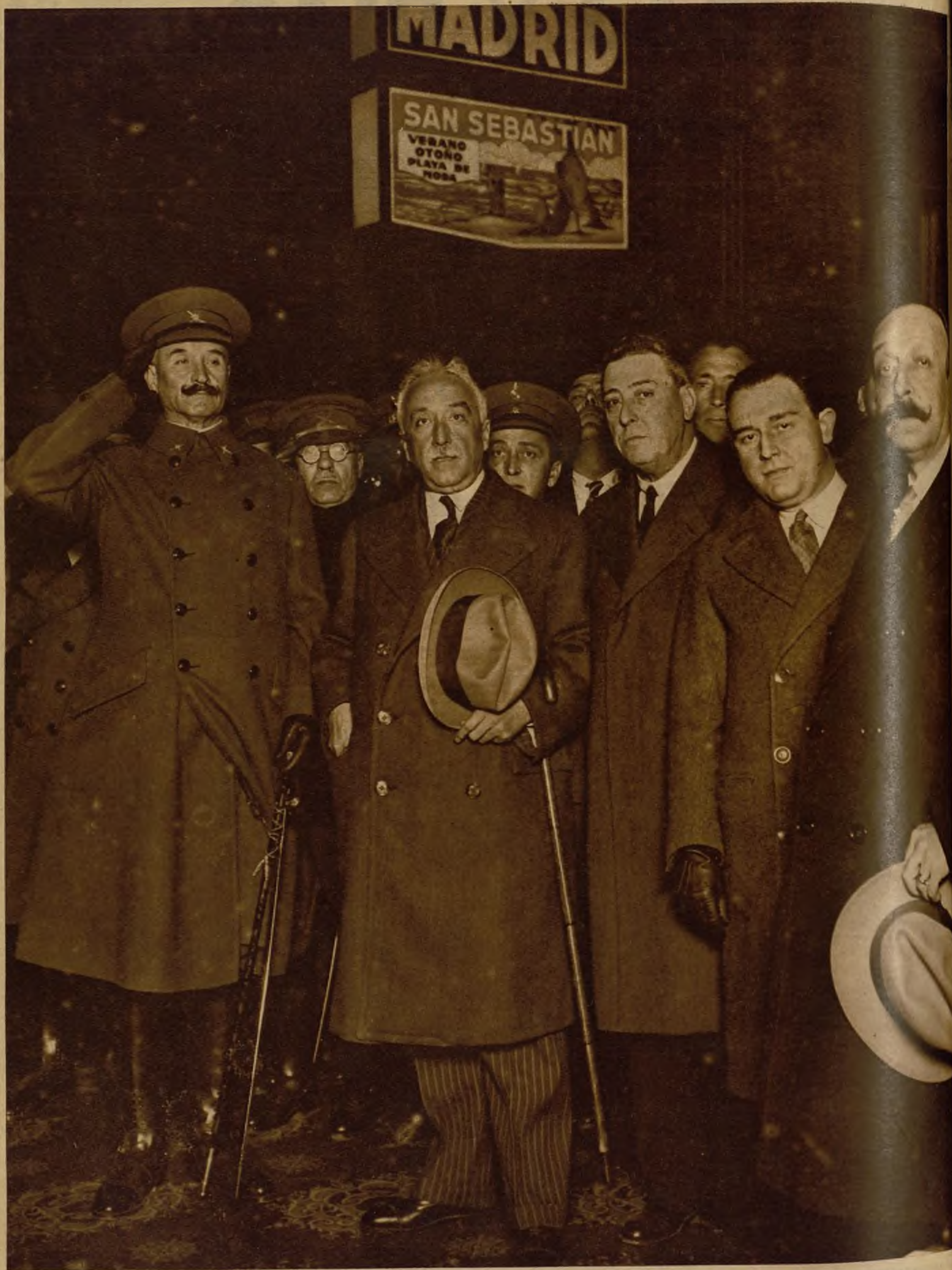
S. E. el Presidente de la República con su séquito en la estación de Atocha, al salir anoche para Alicante