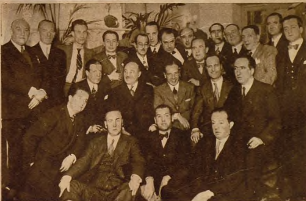
Concurrentes al banquete organizado en honor del cineasta Kuindón por sus numerosos admiradores de Madrid