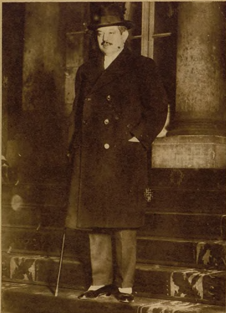
El presidente del Gobierno francés, M. Laval, saliendo del palacio del Eliseo después de plantearse la crisis. La negativa de los radicales socialistas a formar parte del Gobierno ha sido la causa de la crisis