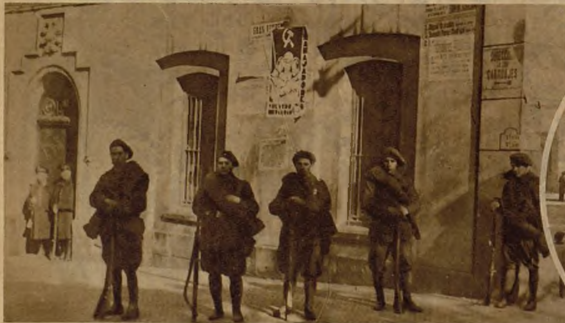
Fuerzas del Ejército que prestaron servicio en las calles a raíz de los sangrientos sucesos