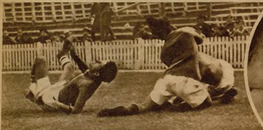
En esta violentísima carambola futbolística, los jugadores han perdido el balón... y la respiración