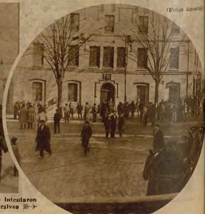
El convento de las Reparadoras, al que intentaron prender fuego algunos elementos subversivos