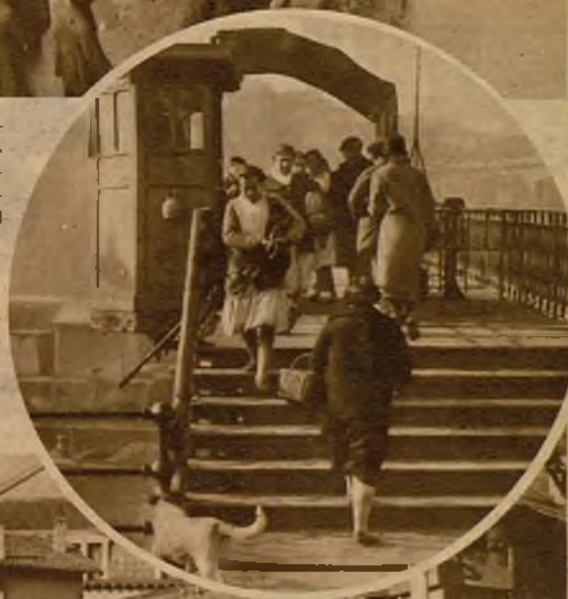
La huelga alcanzó a los cobradores del puente giratorio, y el público por primera vez pudo pasar sin pagar los cinco céntimos del puente