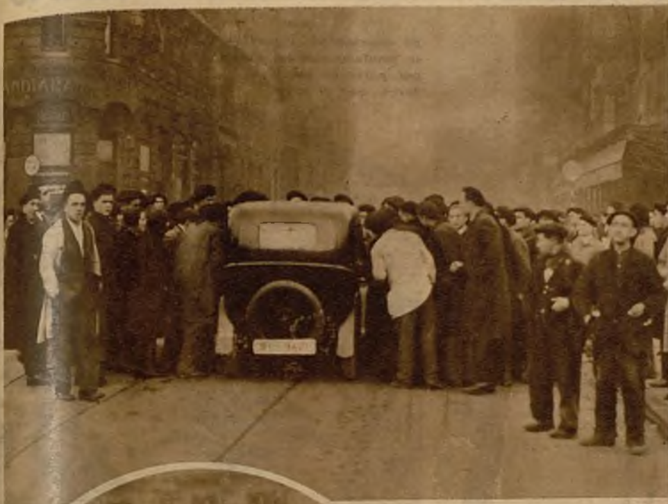
Momento en que los huelguistas hacen detenerse a un automóvil para pedirle que se retire de la circulación