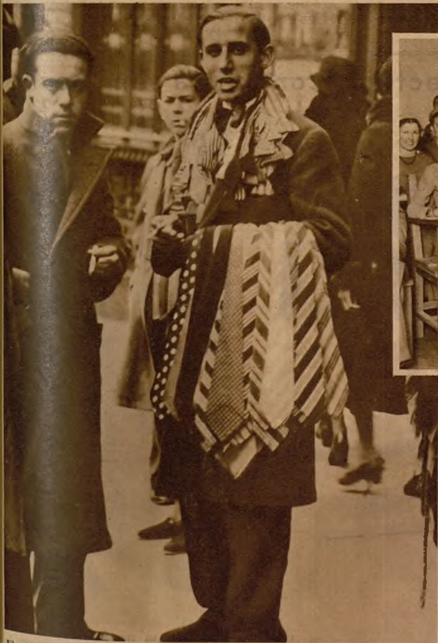
El ministro de Hacienda ha autorizado a los dependientes de comercio parados para la venta de corbatas en la vía pública. Vendedores de corbatas, en la Puerta del Sol, ofreciendo sus mercancías