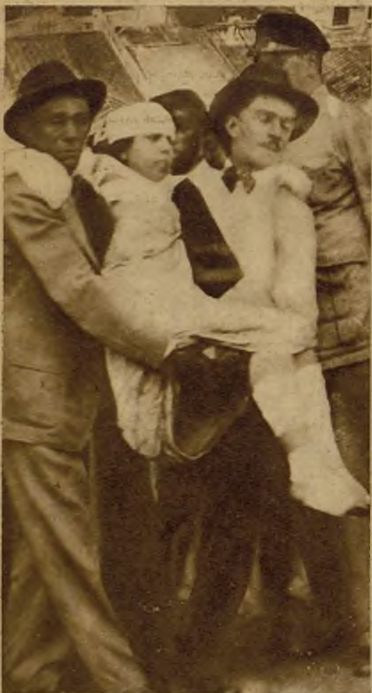
En un almacén de Río de Janeiro, en las recientes fiestas de Navidad se incendió un Arbol de Noel, y las llamas destruyeron el edificio. He aquí a una de las víctimas del siniestro