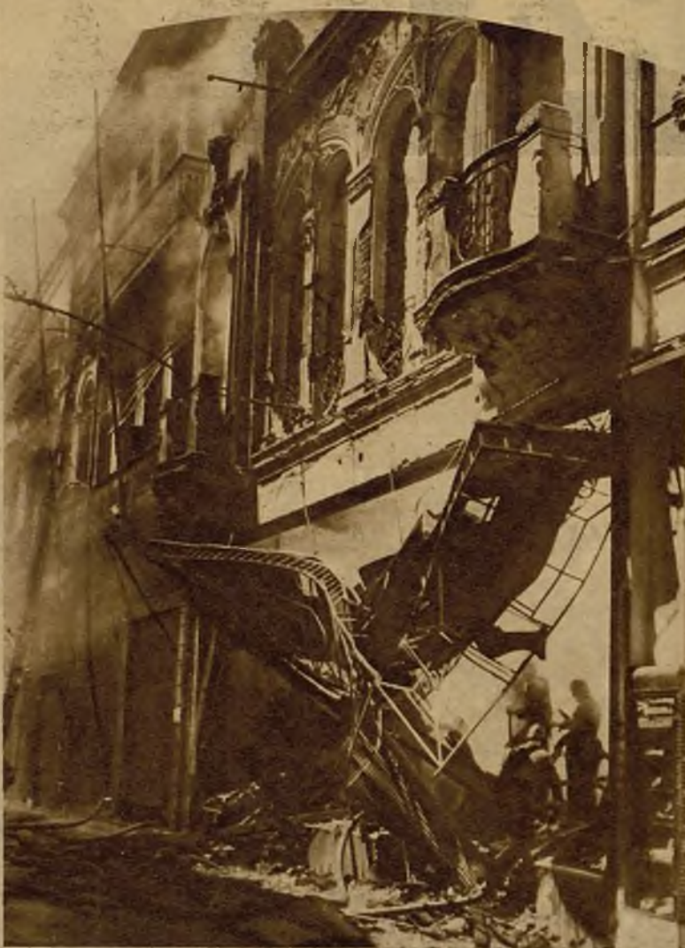
Fachada del almacén de Río de Janeiro donde se produjo el incendio que ocasionó la destrucción del edificio y varias víctimas