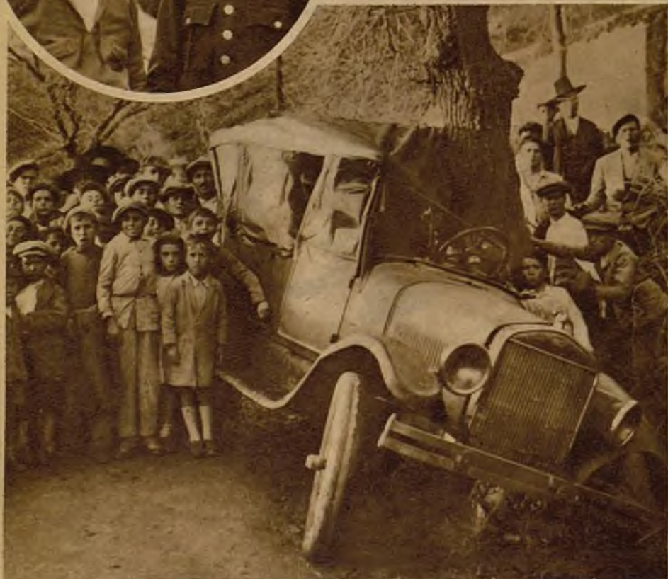
ARCOS DE LA FRONTERA (CADIZ).—Estado en que quedó el coche de servicio público al empotrarse contra un árbol de la carretera. A consecuencia del accidente hubo tres heridos, uno de los cuales está grave