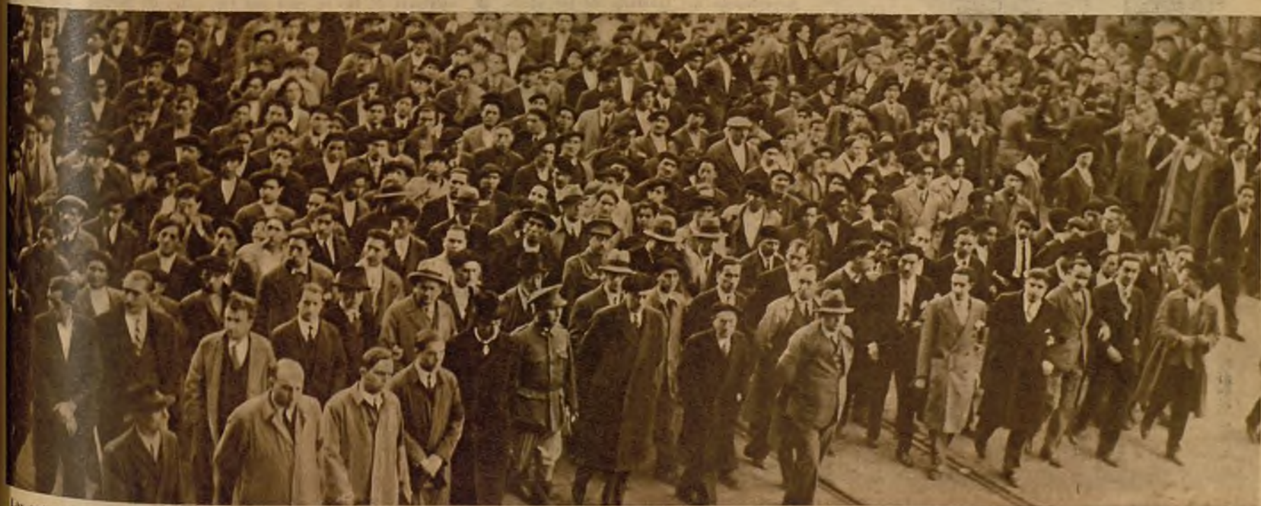
Las autoridades en la presidencia de la comitiva que acompañó a los cadáveres hasta el cementerio. Al triste acto concurrieron muchos miles de personas y constituyó una imponente manifestación de duelo.