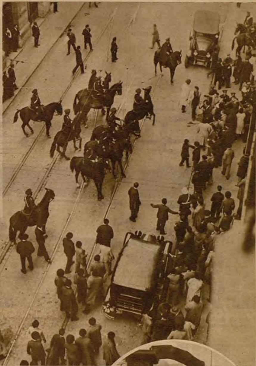
Grupos de huelguistas tratando de detener a los automóviles que circulaban. La guardia de Seguridad interviniendo en el incidente