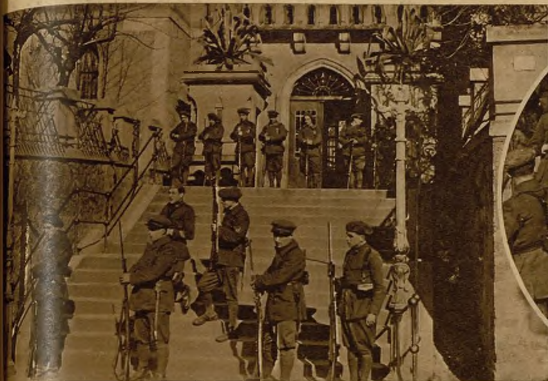
La guardia de la cárcel de Larrinaga, reforzada con motivo de la manifestación tumultuaria que pedía la libertad de los dos detenidos con motivo de los sucesos.