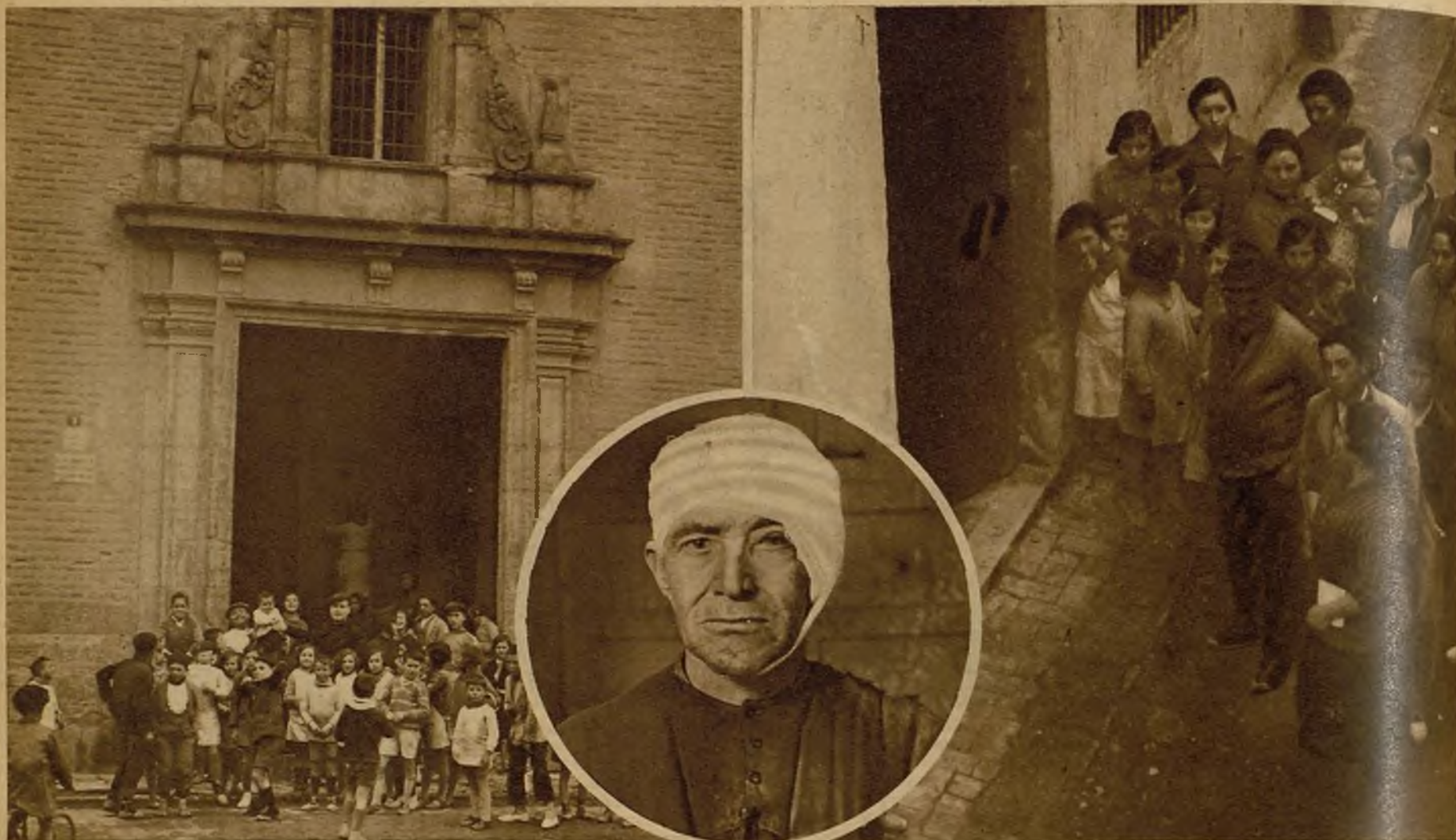
La iglesia de Alfara del Patriarca (Valencia), a cuyas puertas prendieron fuego los tumultuarios. Por fortuna, se pudo evitar que el incendio adquiriera mayores proporciones