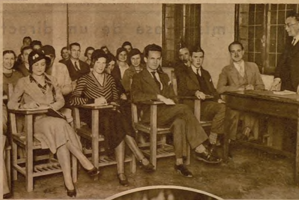
Una clase de los alumnos que asisten al curso de