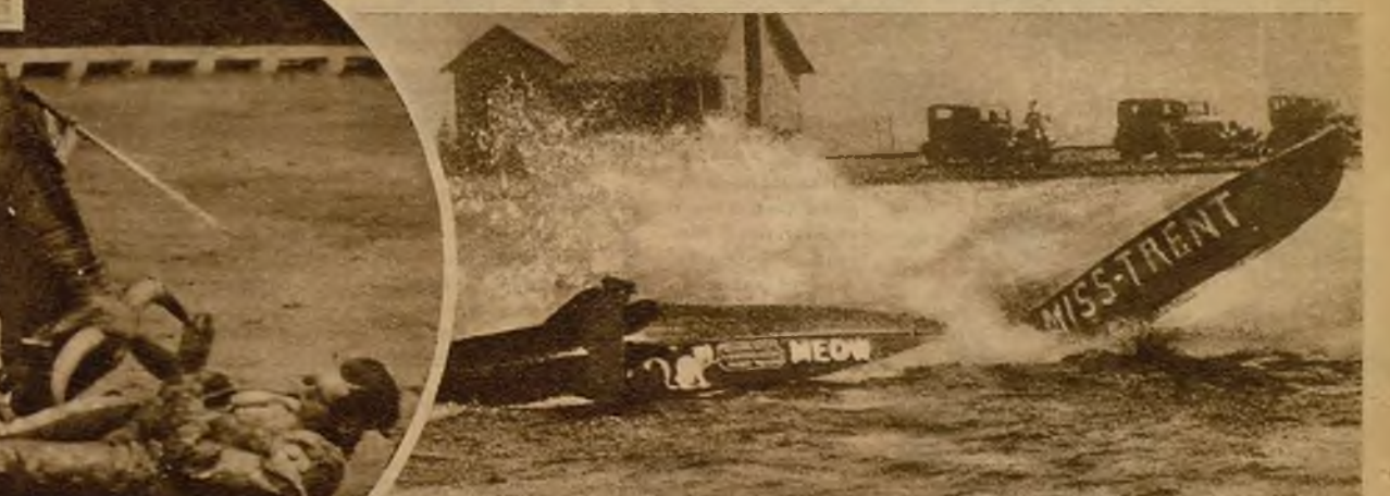
El deporte náutico registra estos graves accidentes, inevitables en la fiebre de la carrera