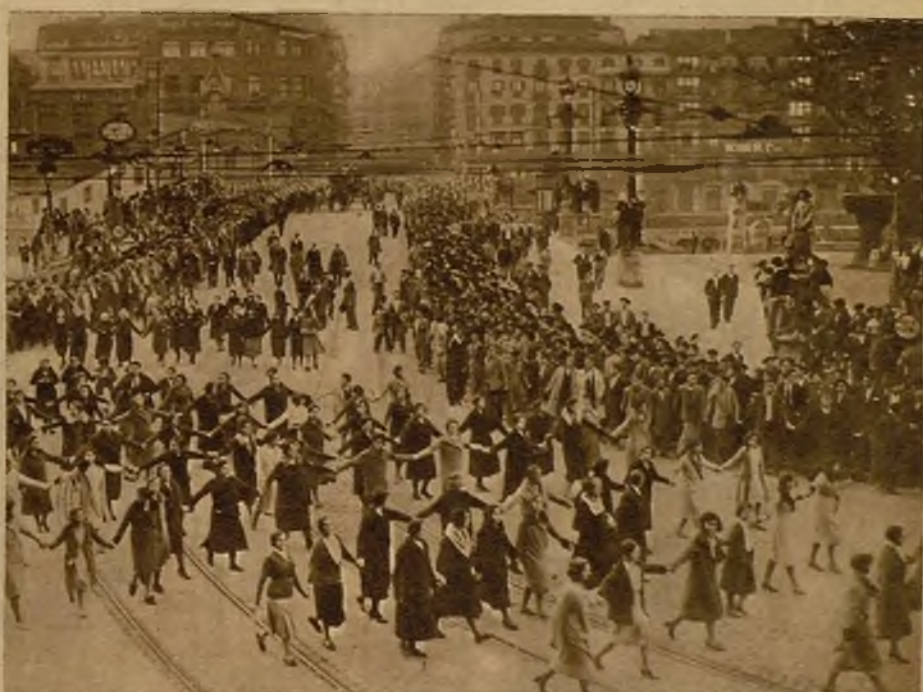
Mujeres que asistieron al entierro de las víctimas de los sucesos del domingo, durante la marcha de la fúnebre comitiva.