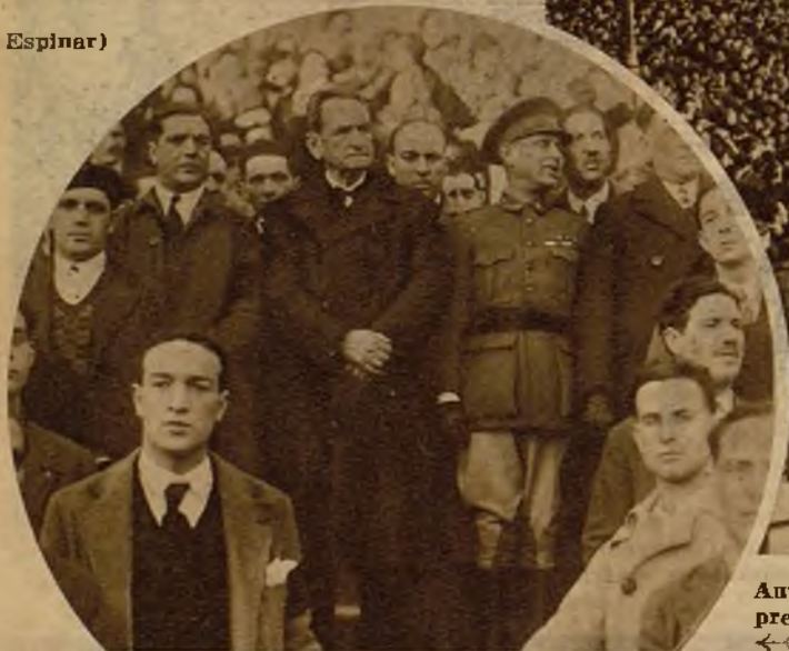
Antoridades y directivos obreros en la presidencia del traslado de las víctimas de los sucesos