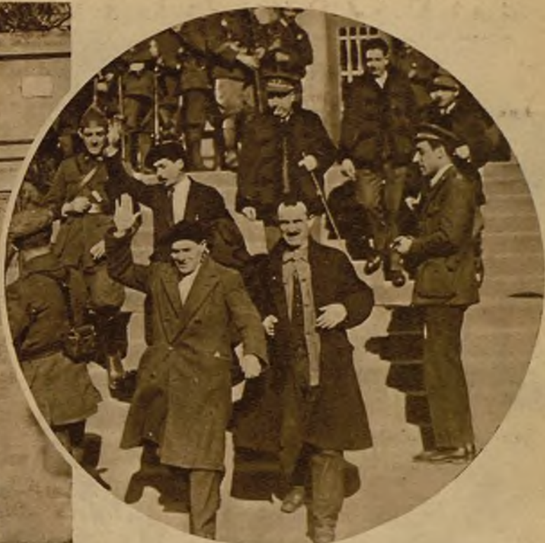
Los dos detenidos en la cárcel de Larrinaga, en el momento de salir a la calle, recibidos por los compañeros que pidieron en manifestación su libertad.