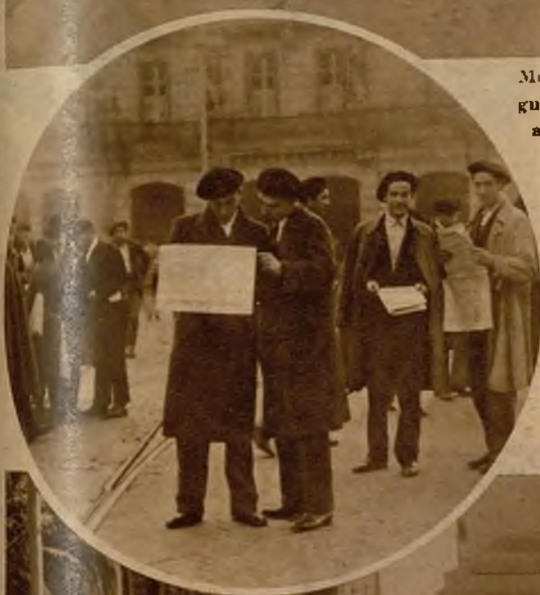
La ansiedad por conocer el desarrollo de los sucesos era tan grande, que el público agotó en poco tiempo los números de la "Hoja Oficial" de Bilbao