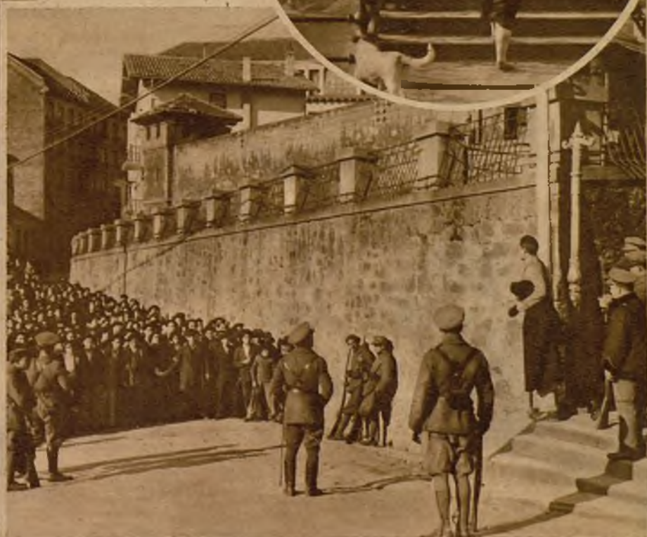
La manifestación que llegó hasta la cárcel para pedir la libertad de los detenidos, contenida por fuerzas del Ejército