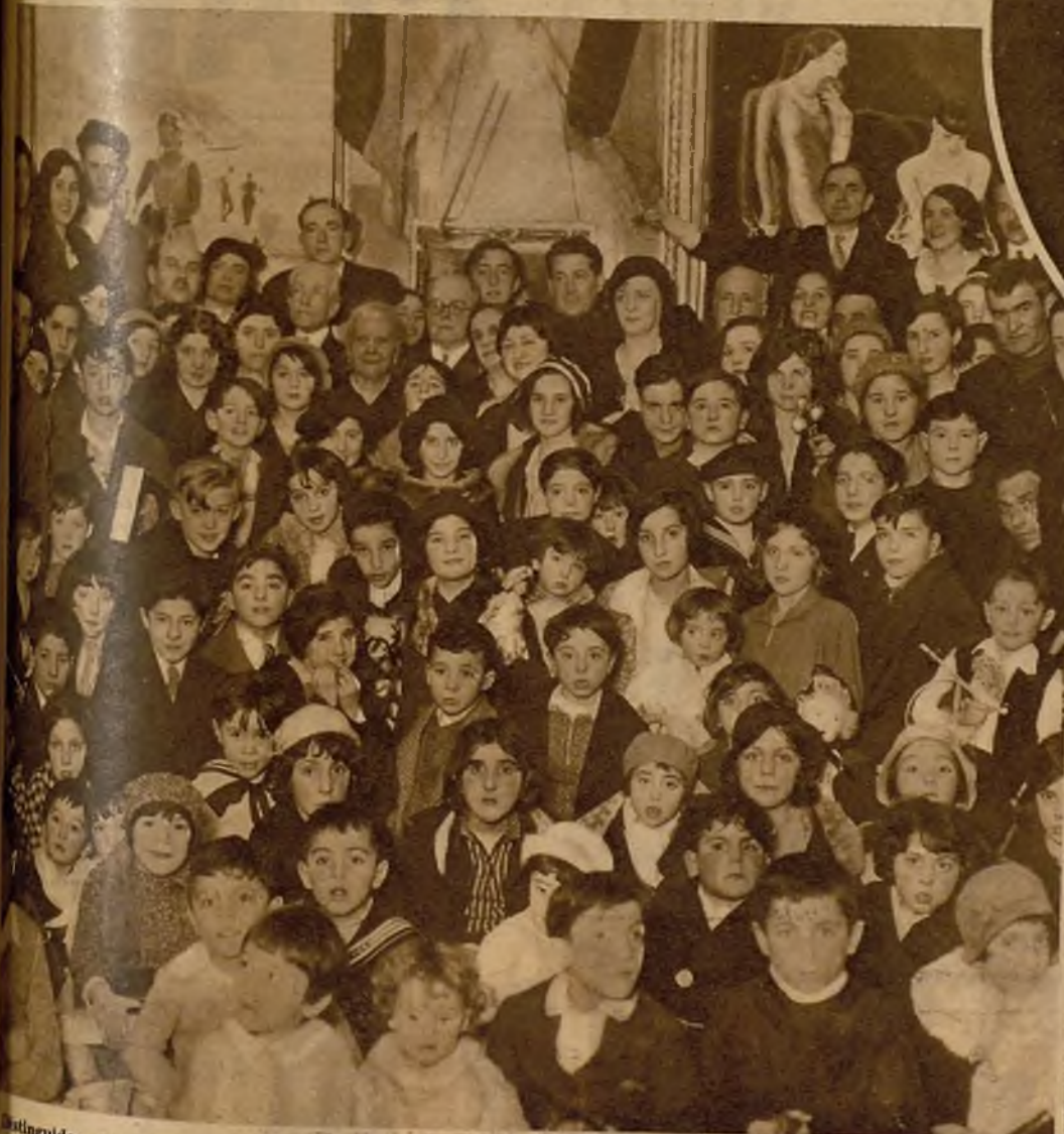
Distinguidos concurrentes a una elegante fiesta organizada por la Sociedad Nueva Española, de París, con motivo de las fiestas de Reyes

La Comisión designada por el Gobierno inglés para promover una encuesta sobre los intereses fundamentales de la India, al salir de Londres