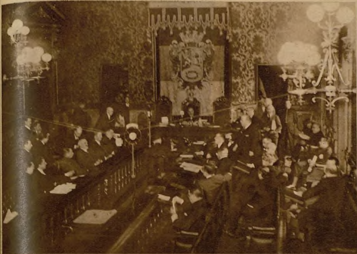
Sesión extraordinaria celebrada en el Ayuntamiento para tratar de unión de Municipios del extrarradio al de Madrid, con lo que nuestra capital alcanzará un número de habitantes de gran capital europea