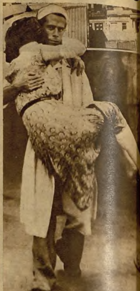
Otra de las víctimas del trágico incendio de un Arbol de Noel, en un almacén de Río de Janeiro. Por fortuna, pudieron salvarse del terrible accidente numerosas personas