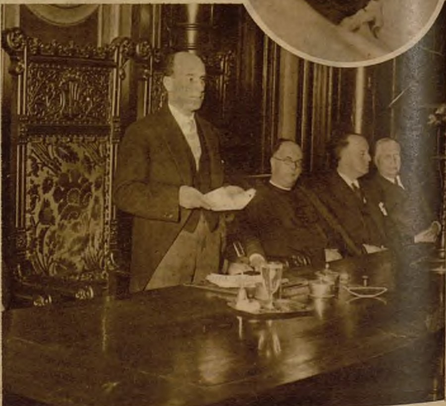
Don Ramón Coll y Rodés durante su discurso sobre "La restauración del Derecho catalán", pronunciado en la inauguración del curso de la Academia de Legislación y Jurisprudencia de Barcelona