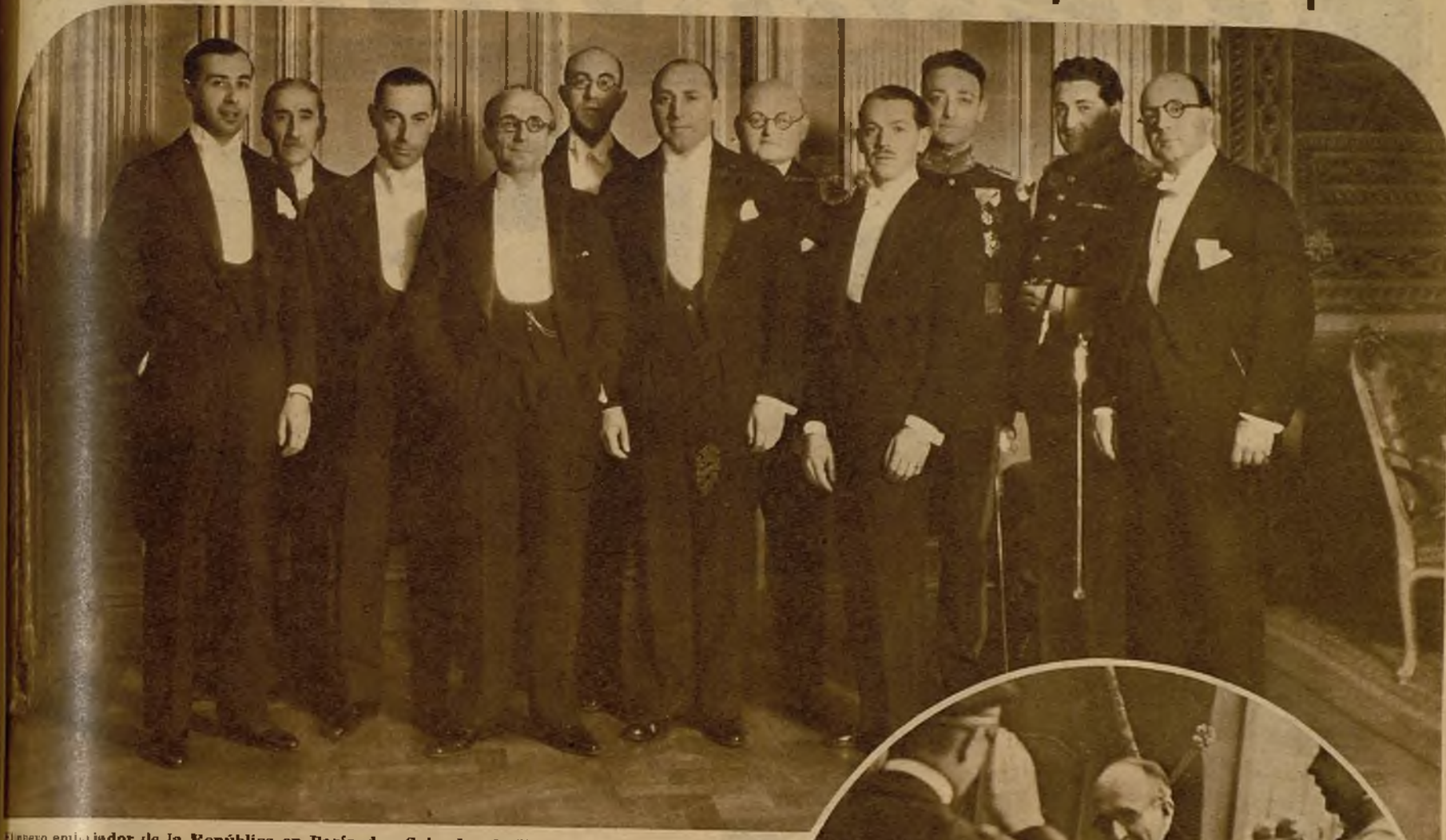
El nuevo embajador de la República en París, don Salvador de Madariaga, con el alto personal de la Embajada