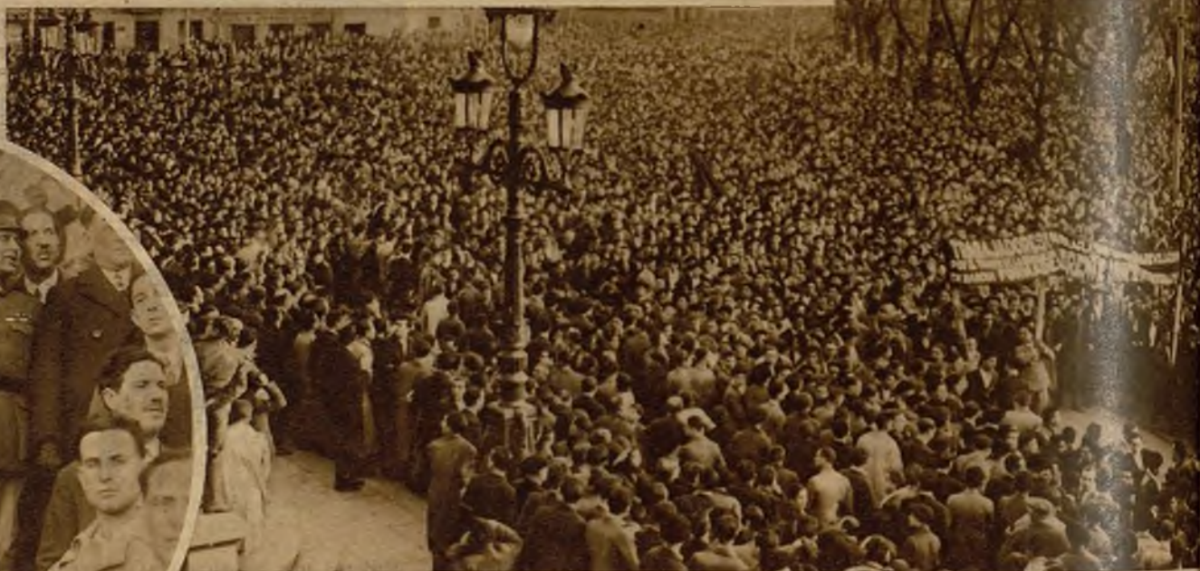
La gran masa de público que acompañó a los cadáveres de las víctimas de los sucesos por las calles de Bilbao. A la derecha destacan los carteles de los grupos extremistas