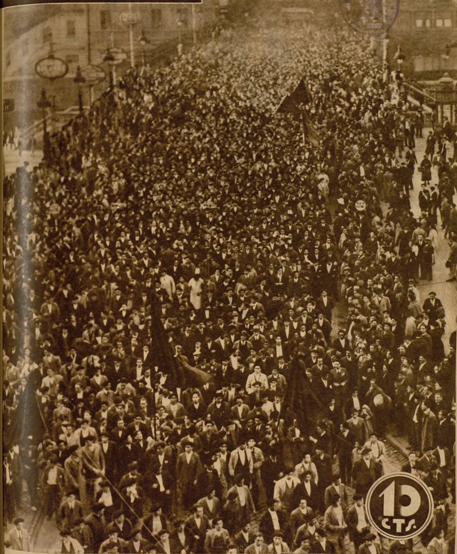
EL ENTIERRO DE LAS VICTIMAS DEL DOMINGO EN BILBAO. —El pueblo bilbaíno testimonió su dolor por los desgraciados sucesos formando una imponente manifestación que, presidida por las autoridades, acompañó los féretros de las víctimas en un silencio emocionante y solemne