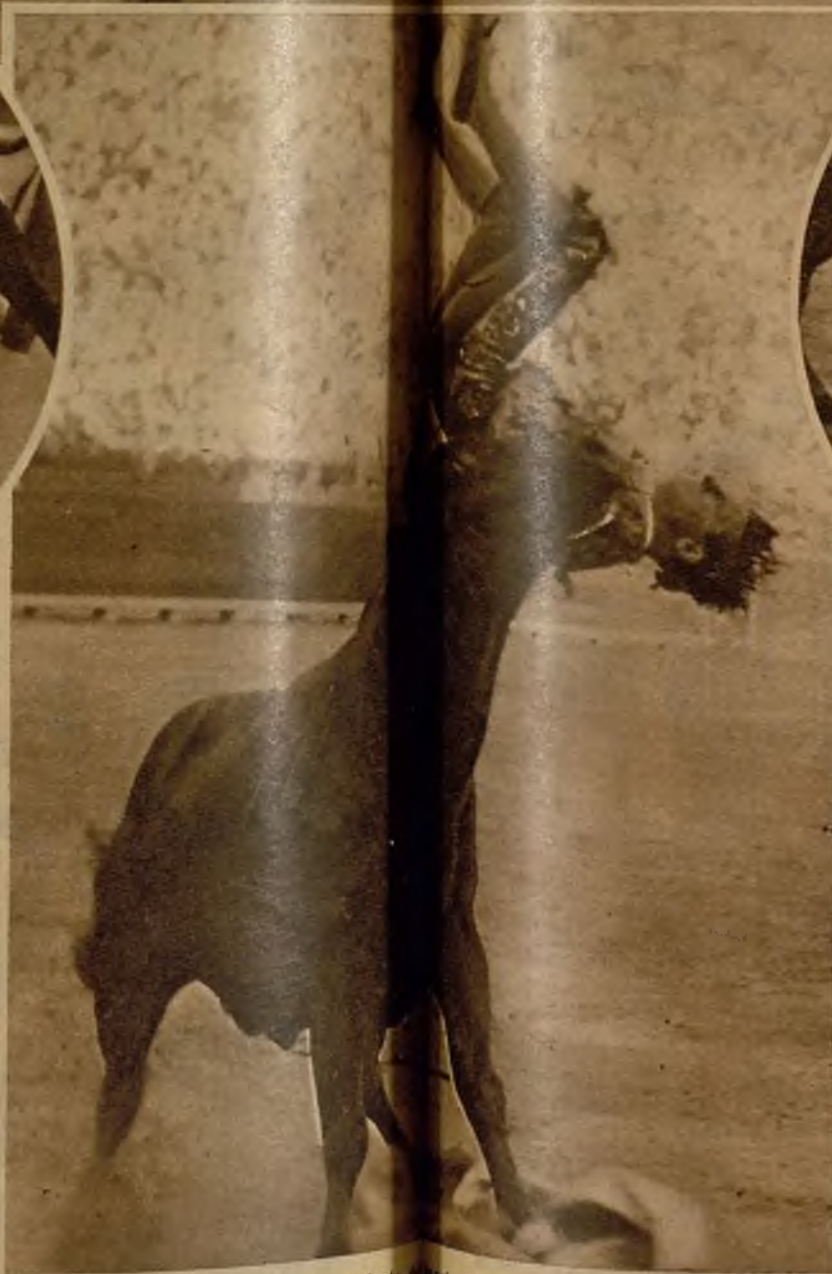
La res no ha obedecido al llamamiento del torero, y éste, alcanzado de lleno, queda a merced de la fiera