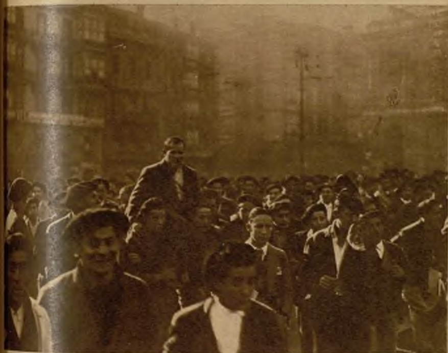
Tras la liberación de los detenidos, los manifestantes expresaron su entusiasmo llevándolos en hombros largo trecho.