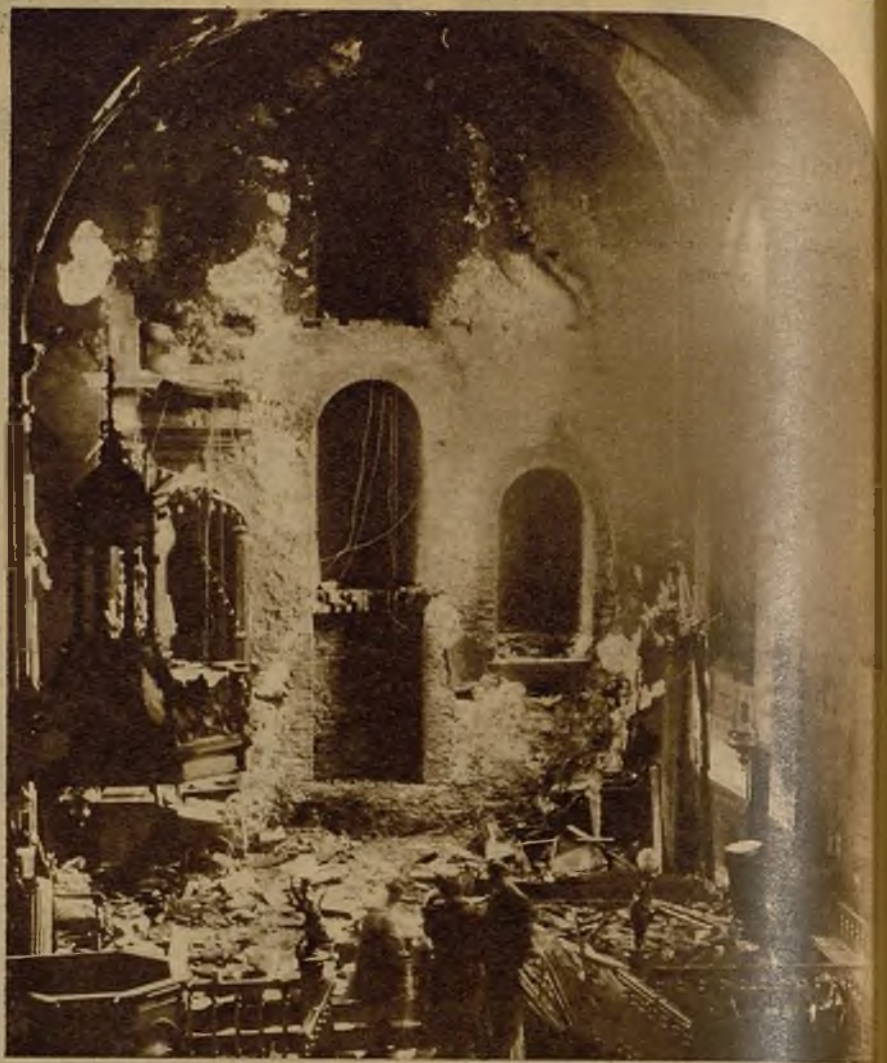
Estado en que quedó el altar mayor después de dominado el incendio. Los daños ocasionados por las llamas se aprecian claramente en la foto