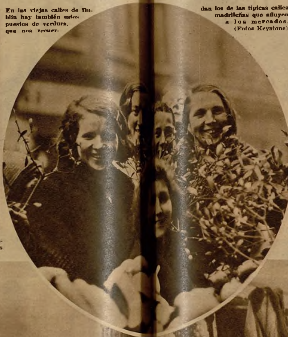
dan los de las típicas calles madrileñas que afluyen a los mercados.