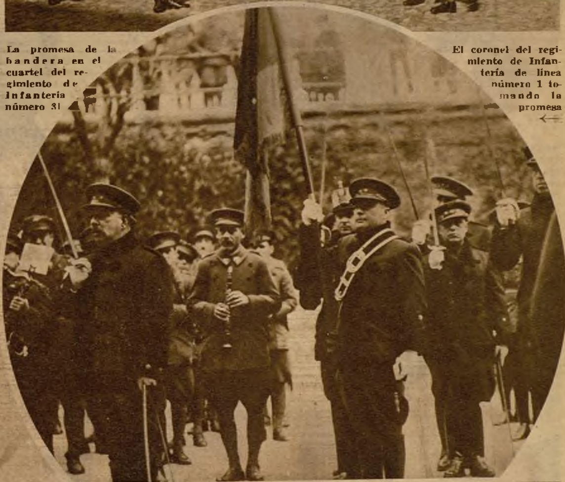
Una vez realizado el solemne acto de la promesa a la bandera de la República, el coronel del regimiento dirige una vibrante alocución a los nuevos reclutas