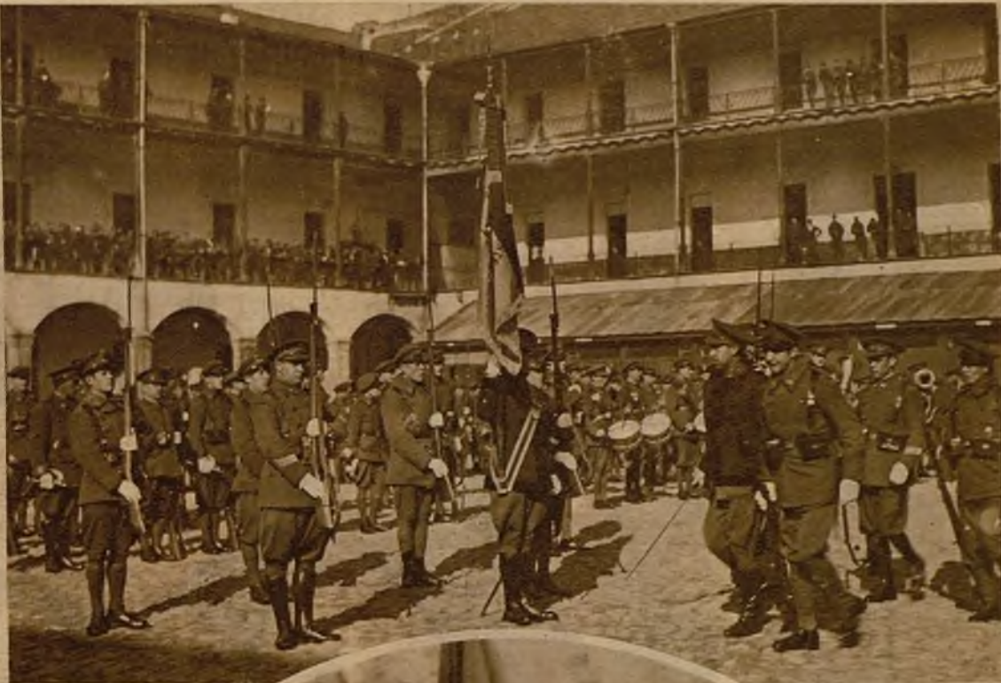
La promesa de la bandera en el cuartel del regimiento de infantería número 31