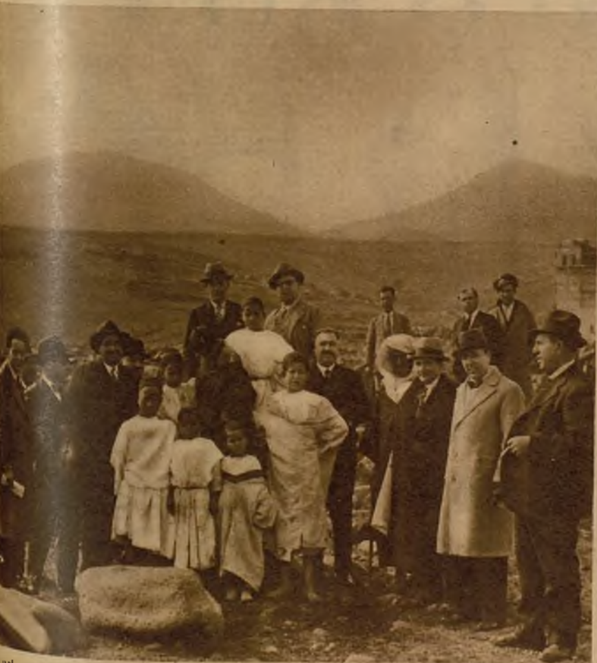
Parlamentarios españoles sobre las tierras en que se desarrollaron los combates sangrientos de 1909