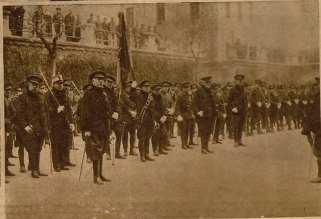
Grupo de soldados durante los ejercicios, después de haber hecho los nuevos reclutas la promesa a la bandera, según las nuevas ordenanzas