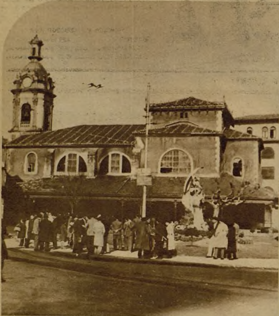
La iglesia de Santurce (Bilbao), que fué asaltada por los amotinados y a la que prendieron fuego. El edificio ha sufrido tales daños, que será preciso derruirlo