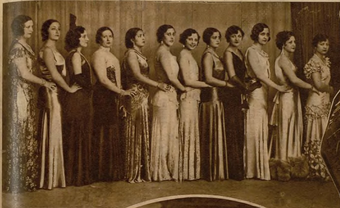
Las bellísimas aspirantes a la representación de España en el concurso mundial de belleza, sometidas, en sugestiva mostración de perfecciones, ante el Jurado que presidió don Alejandro Lerroux