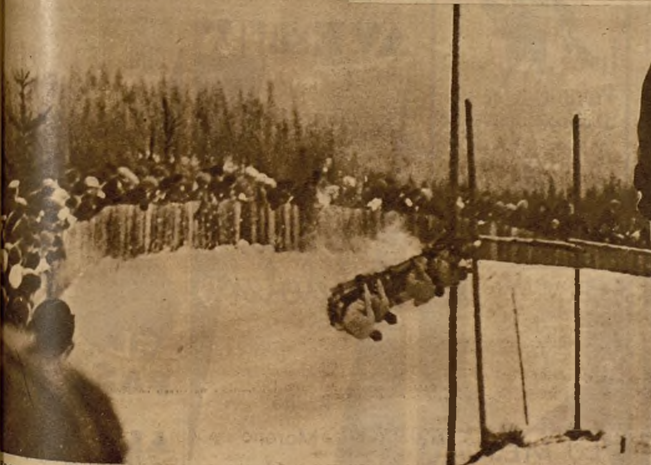
En un concurso sobre nieve, en Berlín, ocurrió este terrible accidente, que costó la vida a varios notables deportistas, entre ellos al conductor del vehículo, peritísimo en estas pruebas