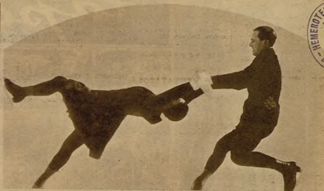
Sobre la nieve los expertos bailarines de patin ejecutan limpiamente la que se dice—por los deportistas, claro está—“pirueta de la muerte”