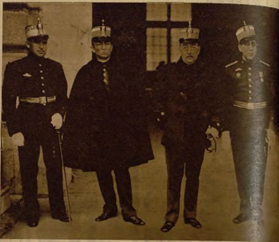
Comisión militar, presidida por el teniente coronel del primer regimiento de carros de asalto, al salir de visitar al Presidente de la República para invitarle a la entrega de la bandera que regala al citado regimiento el Ayuntamiento de Madrid