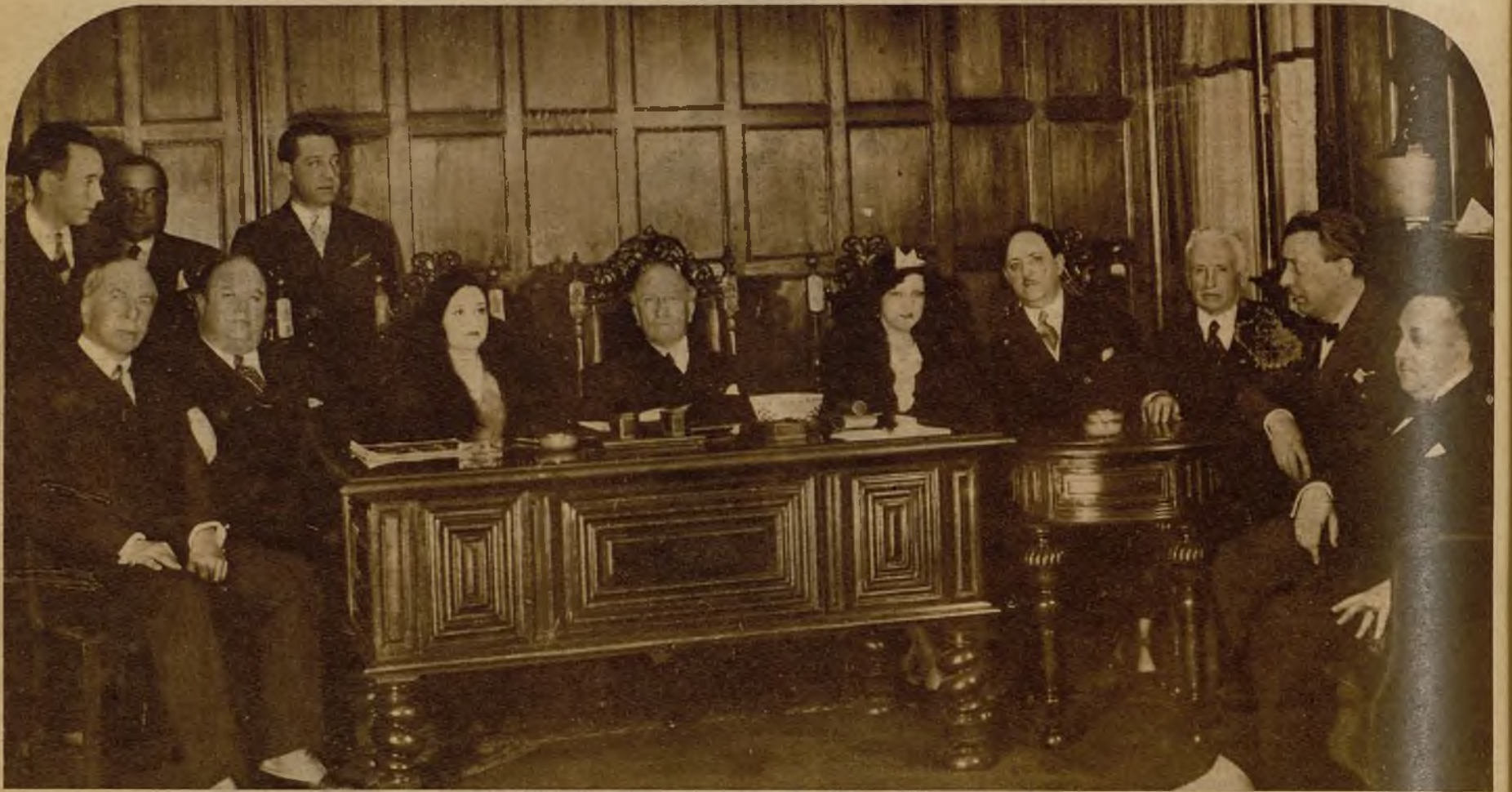
El Jurado que ha otorgado el título de "Miss España" entre las hermosísimas aspirantes a la representación nacional. Al frente del mismo figuró el presidente de la Asociación de la Prensa, don Alejandro Lerroux