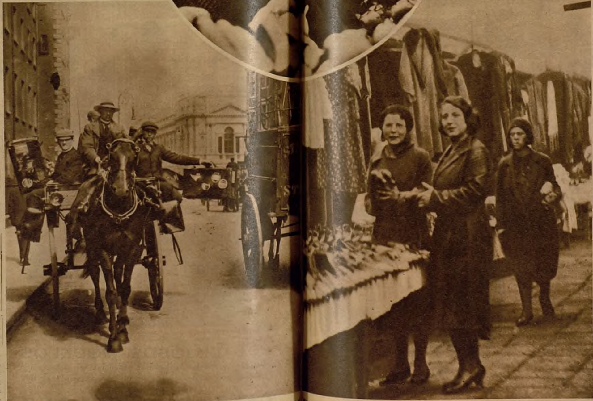
Unos cajones invertidos, con una agarradera, dos ruedas debajo y... arre caballo, por la parte alguna del mundo he visto yo más pares de botas y zapatos de segundo pie que en estas covachas del rastro de Dublín. Y es que de Inglaterra, Escocia y de Gales llegan cargamentos enteros

provisación y la idea de que los trenes tienen que pitar varias veces de mentirijillas. A la salida de la estación, y ya en Dublín, todavía existen los carricoches de dos ruedas y sin protección alguna contra la intemperie, que datan de tiempos del rey irlandés, que, sin duda alguna, debió rabiar por haber ido en uno de ellos. Son éstos "jaunty cars" unas máquinas de sacudir huesos, para prueba de agilidad y de sangre fría. Unos cajones invertidos con una agarradera, dos ruedas debajo y ¡arre caballo! por el empedrado, llueva o no llueva. La cuestión del precio puede discutirse durante el trayecto, y el que sea hábil en gitanos puede hasta rebajar el 75 por 100.