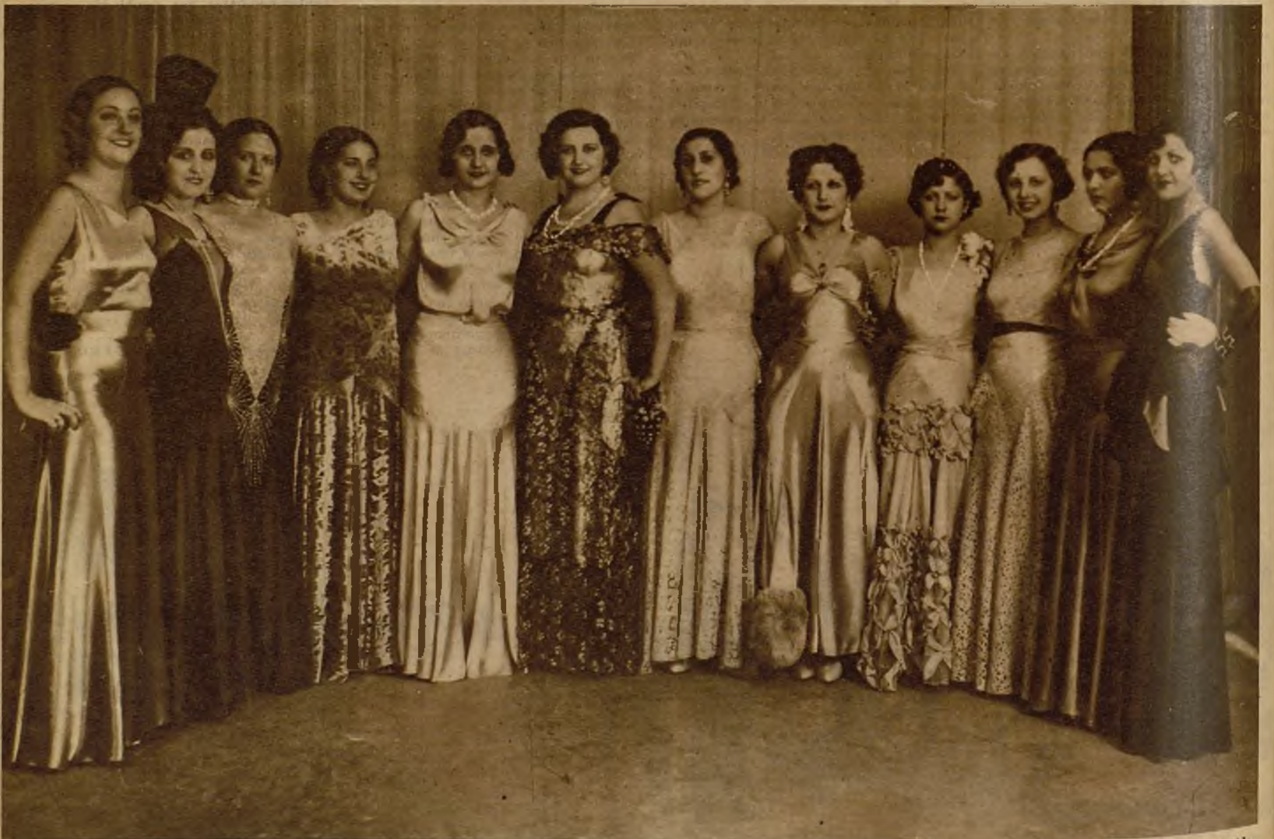
Entre estas soberbias bellezas ha tenido que elegir el Jurado del concurso a "Miss España". Labor ardua, sin duda, y ante cuyas dificultades los juzgadores habrán tenido que compulsar escrupulosamente su concepto estético