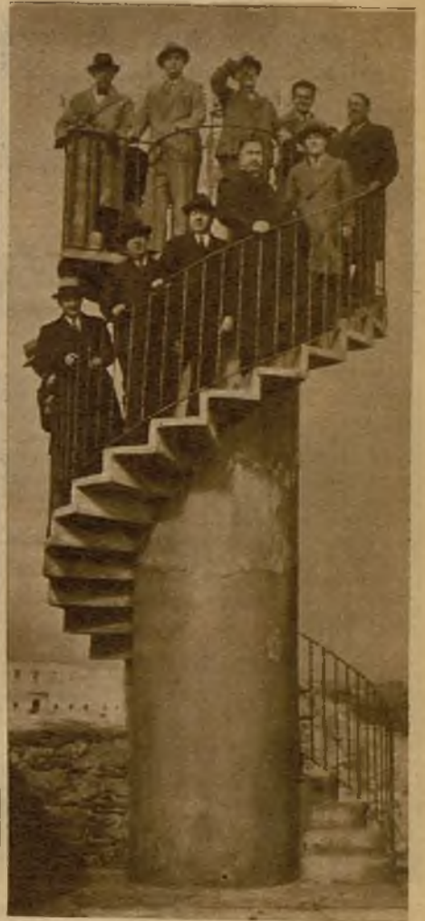
Desde el antiguo faro de la ciudad vieja también se ven los campos testigos de tantos combates, hoy cambiados en lugares de paz

Pulsaron el régimen político que se debe vivir en estas ciudades de soberanía