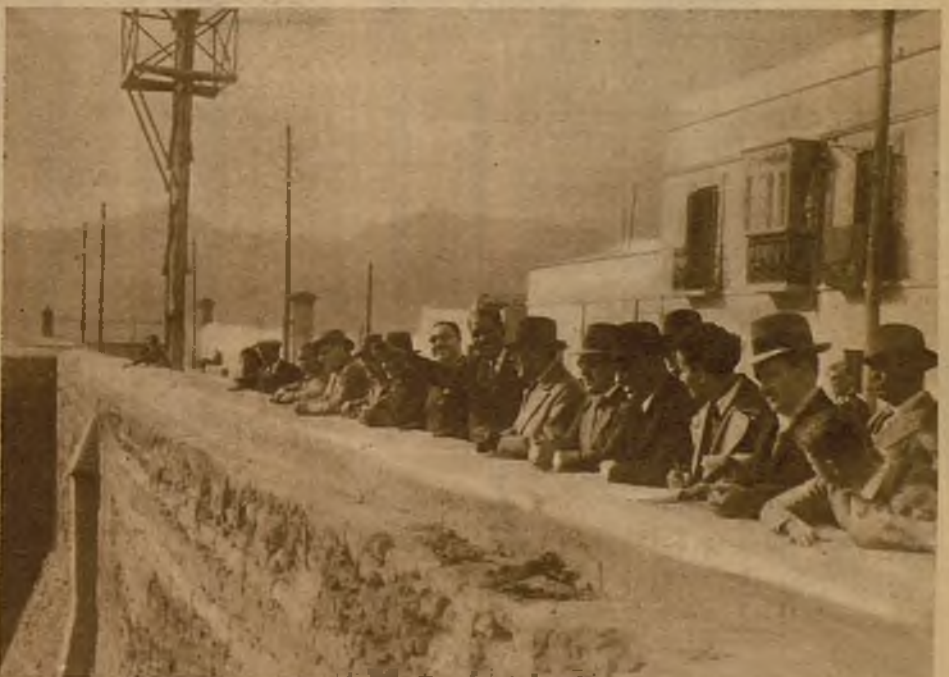
Grupo de diputados y periodistas contemplando el paisaje africano desde las murallas viejas de la ciudad