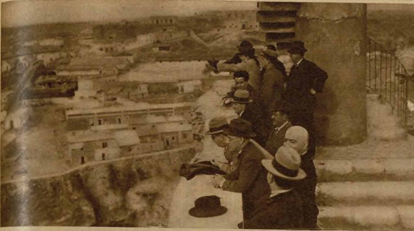
Desde las altas murallas viejas, los parlamentarios que han visitado Melilla contemplan el panorama de la ciudad y los montes lejanos y bravíos

Marruecos parece, al fin, que comienza a preocupar a la opinión española.