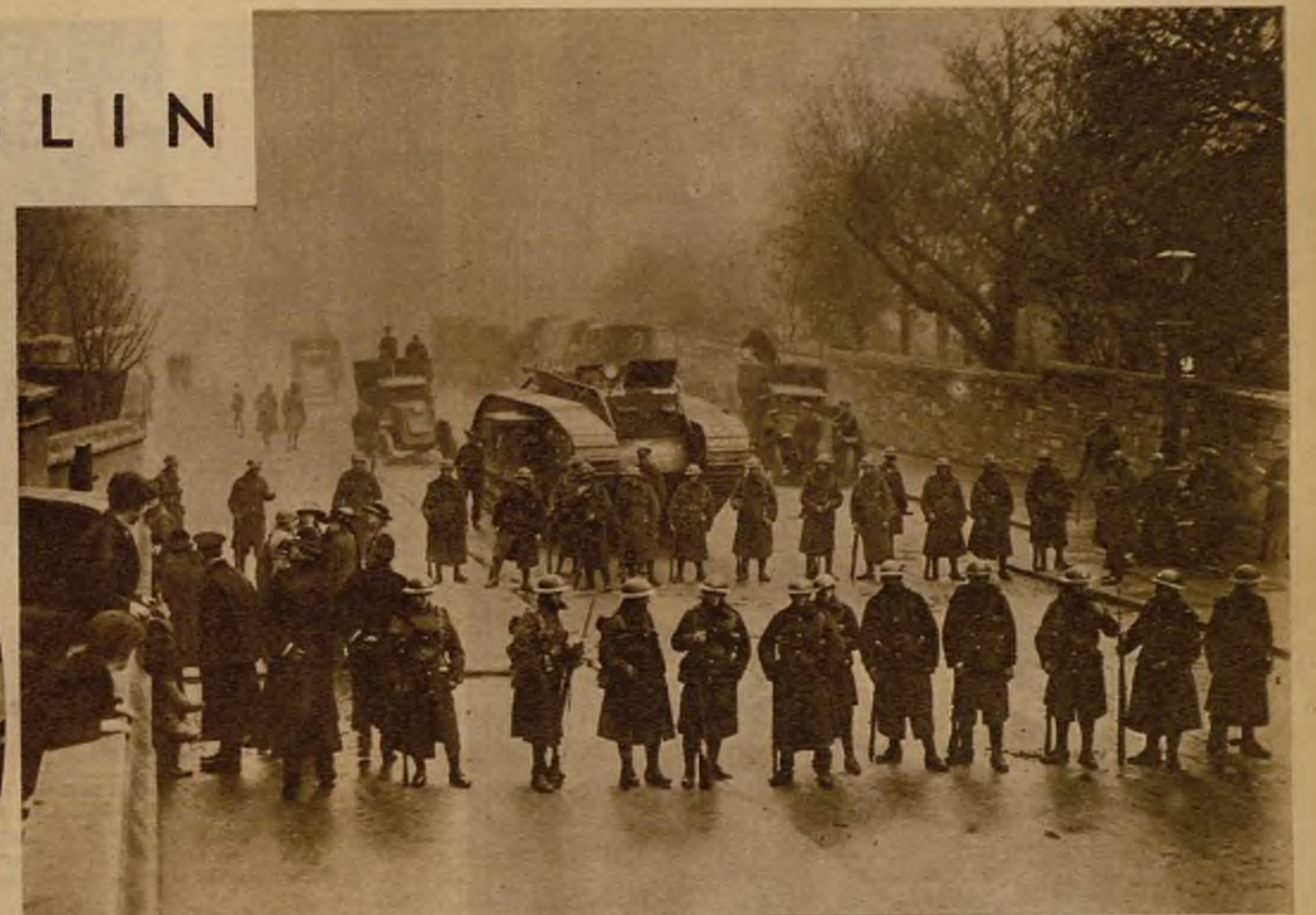
Así encontré yo las calles de Dublín en mi anterior visita. Era el momento de la Guerra