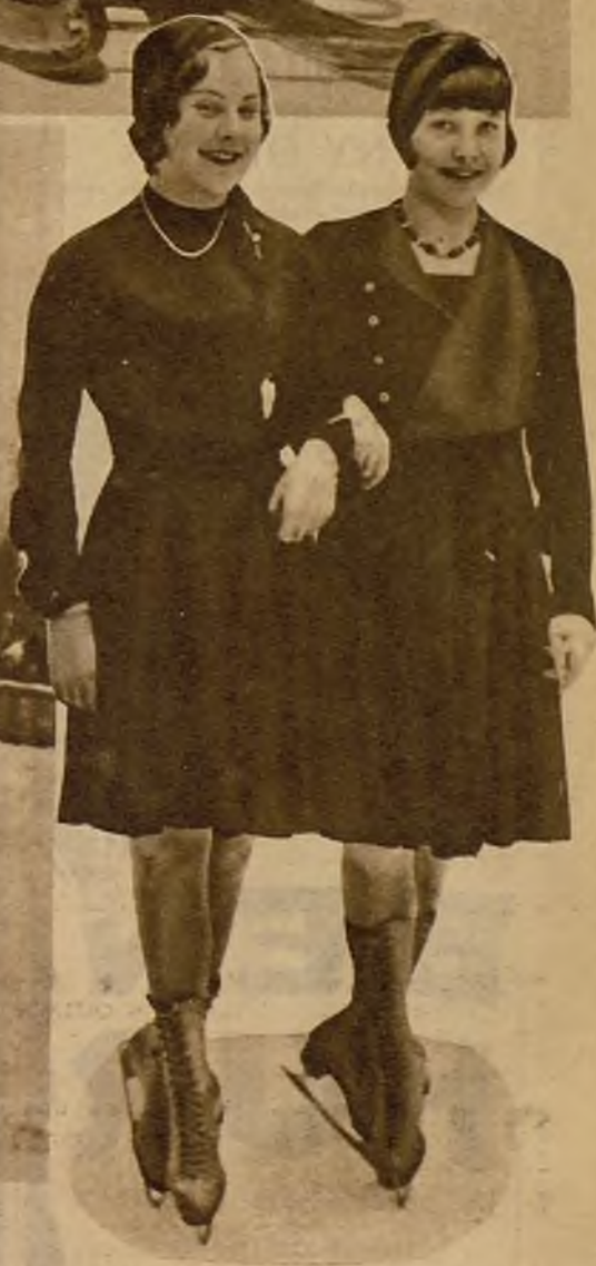
Dos jóvenes y bellas participantes en el campeonato femenino de patin, que se celebra en el Palacio de los Deportes de París