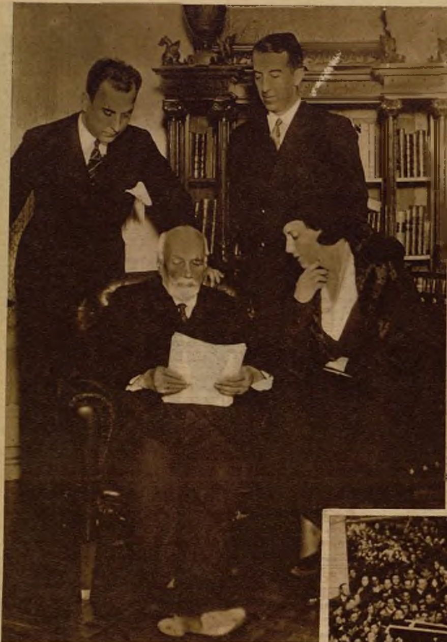
El ilustre don Armando Palacio Valdés leyendo a Camila Quiroga la adaptación teatral de su obra "El cuarto poder", con los autores de la interpretación, Barón de Mora y Salas Merlé