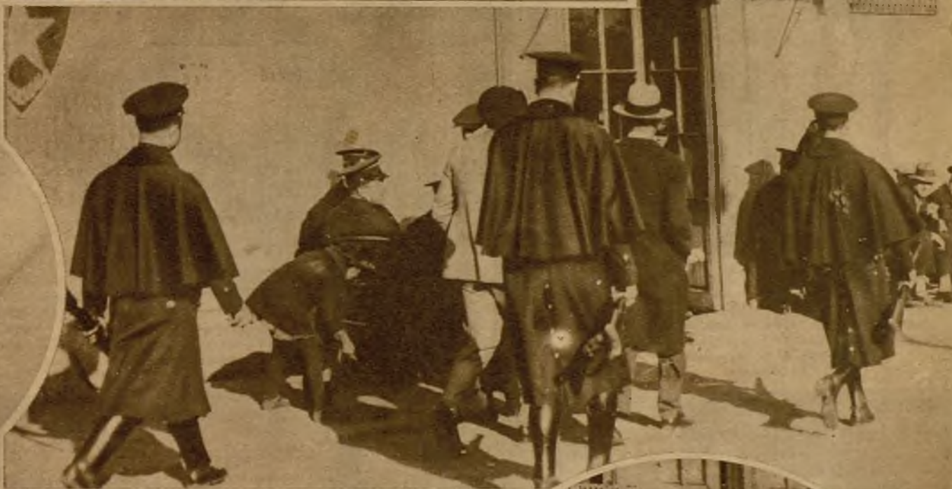
Momento de llegar a la Comisaría dos de los individuos que fueron sorprendidos durante la junta del Comité revolucionario y que lucharon con la Policía, matando a un guardia de asalto