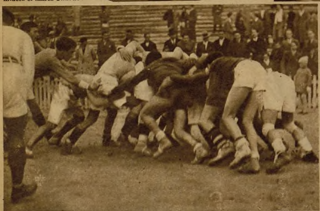
En el campo del Castilla, y como preparación para los próximos campeonatos universitarios, se celebró un partido de "rugby" entre los equipos de la Escuela de Ingenieros Industriales y de la Facultad de Derecho. Un episodio de la contienda fué esta emocionante "mêlée"