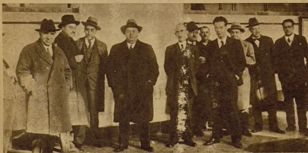
CORDOBA.—El ministro de Obras Públicas, con los directores generales de los Pantanos e Ingenieros durante la visita a la Central de salto de aguas de El Carpio