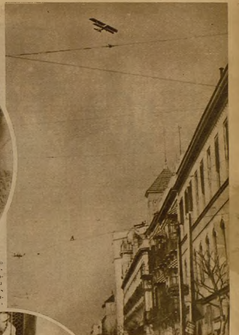
En Sevilla se adoptaron grandes precauciones en previsión de disturbios, que, por fortuna, no se produjeron. Varios aviones, provistos de ametralladoras, volaron sobre el casco de la ciudad