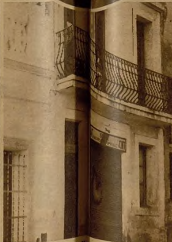
El local del Sindicato de Barcelonés, donde fueron detenidos varios individuos después del asalto en el que resultó muerto el guardia de asalto Bonet