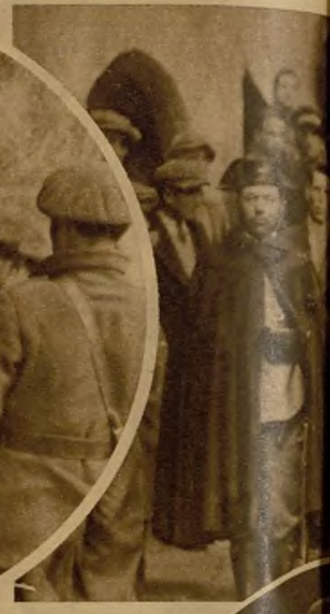
Un grupo de perturbadores en Berga, instantes después de haberse rendido a la Guardia civil, que los custodia para conducirlos a la cárcel del pueblo.