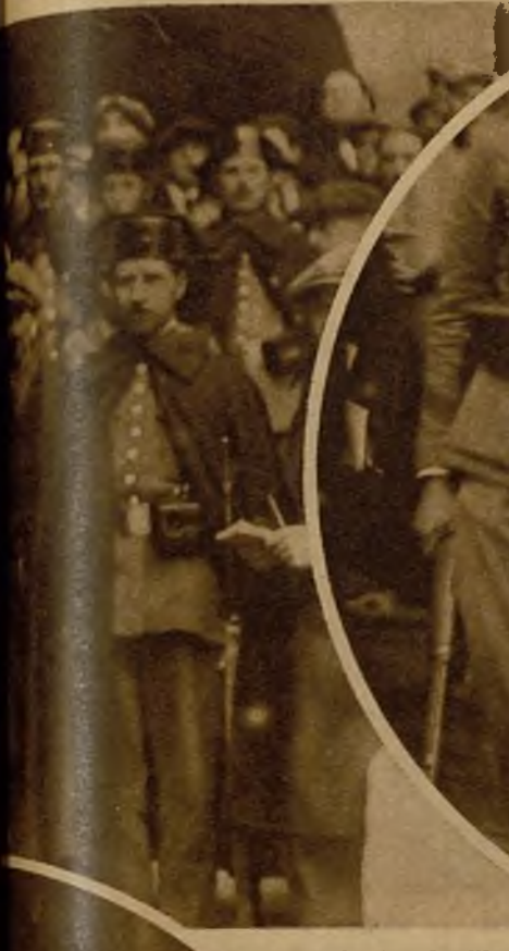
He aquí al cabecilla de los grupos revolucionarios de Berga, que, visto el fracaso total del movimiento, se presentó a las fuerzas de la Guardia civil.