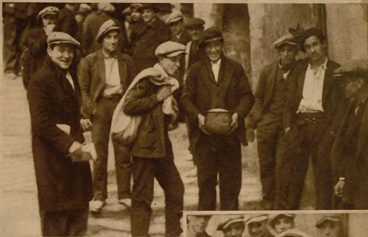
Foto obtenida en Berga durante el período álgido de los sucesos. Los revoltosos tienen en su poder bombas y metralla → (Foto Casals)

Como medida de precaución ante la huelga, que, efectivamente, se produjo, en las afueras de Sevilla eran ocultos los transeúntes