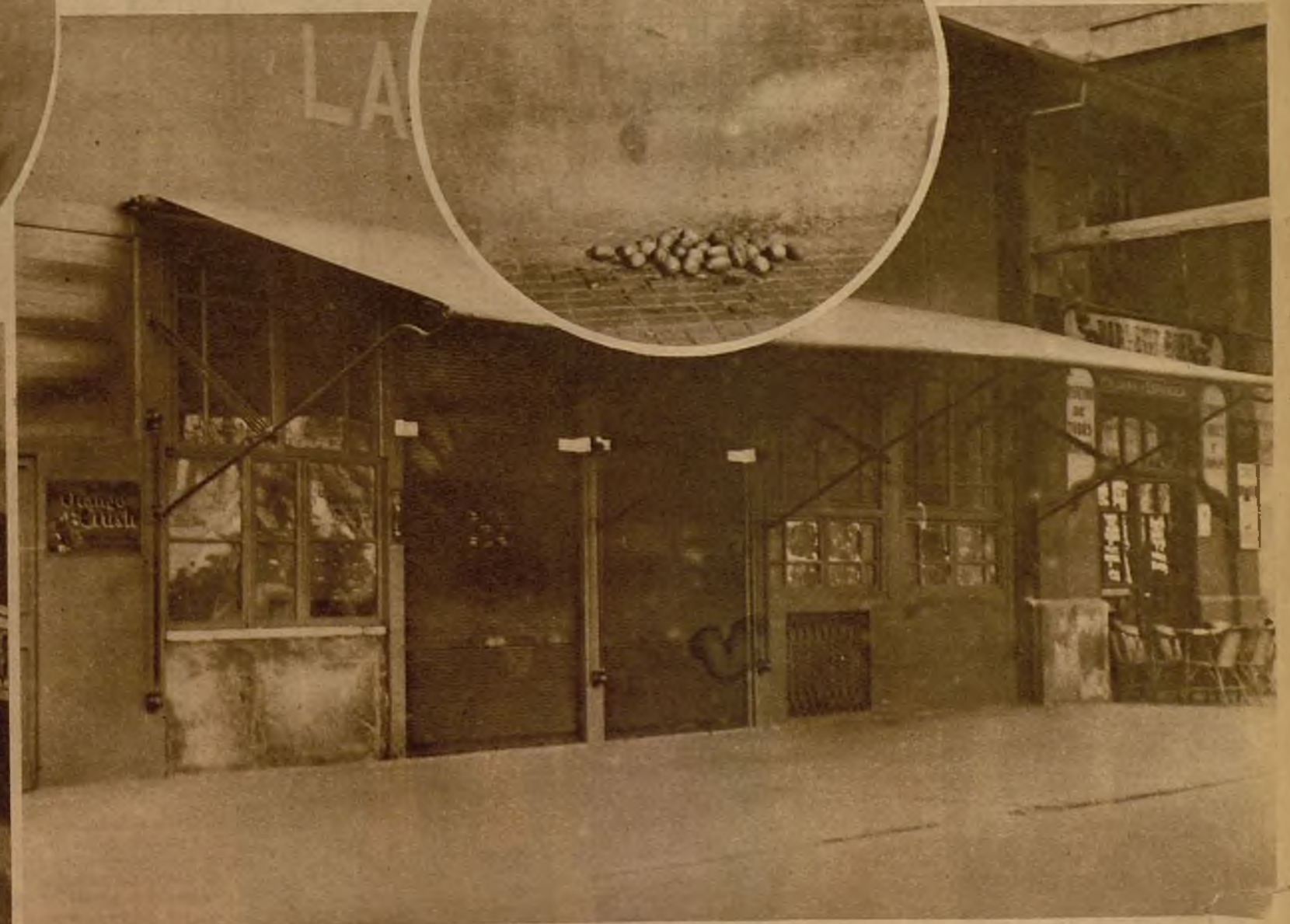
El bar "La Tranquilidad", situado en el Paral·lel, de Barcelona, que ha sido clausurado por la autoridad gubernativa, por haber sido sorprendida en el local una reunión clandestina.