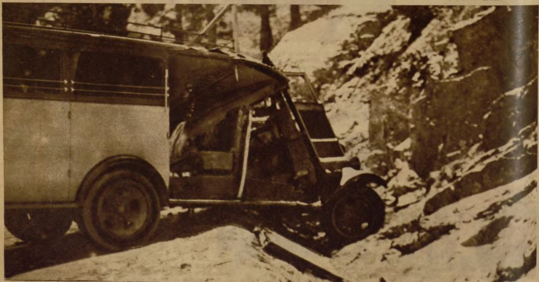
El autobús que volcó en las cercanías de Cercedilla, repleto de deportistas que volvían de pasar el día en la sierra. Por rotura de los frenos del vehículo, le fué imposible al conductor detenerle, y a consecuencia del accidente resultaron cuatro muertos y muchos heridos