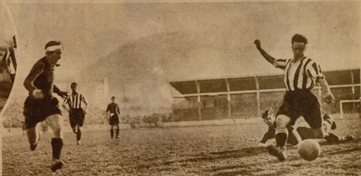
El Atlético bilbaíno domina al Arenas. "Chirri" ha burbado a Cilaurren y chuta con fantástica energía; Gerardo le contempla atónito