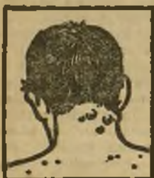
Granos - Forunculos

Tengo tambien de los consumidores de España frecuentes testimonios de curaciones maravillosas obtenidas con el uso de mi Depurativo. No los publico sin embargo por sujetarme al deseo expresado por los mismos de no dar a conocer sus nombres respetando así su natural reserva. Pida Vd hoy mismo un folleto gratuito al Laboratorio Richelet, San Sebastian, 22, San Bartolome.