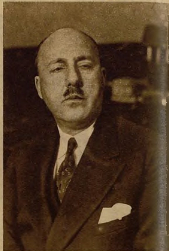
El subsecretario de Estado, señor Agramonte, que ha sido nombrado ministro de España en Praga