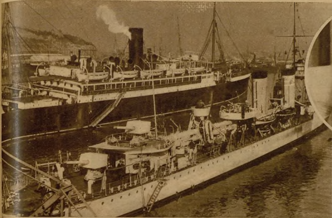
El destructor "José Luis Díez", recién llegado a Barcelona, atracado junto al "Buenos Aires", donde han sido recluidos los detenidos por los últimos sucesos