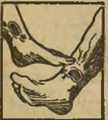
Males en las piernas