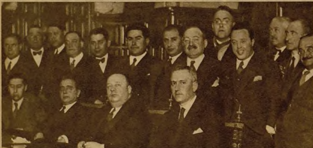
SEVILLA.—El ministro de Obras Públicas a su llegada a esta capital, con el gobernador civil, al alcalde y otras autoridades, que le cumplimentaron en el Ayuntamiento