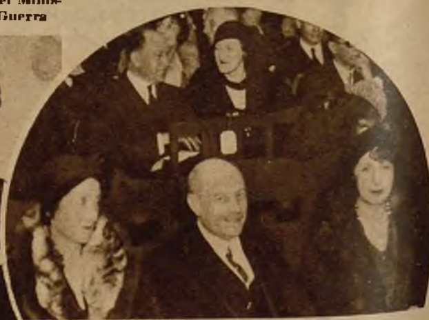
Notables artistas que han tomado parte en un concierto celebrado en el Instituto Francés a beneficio de los obreros madrileños víctimas del paro