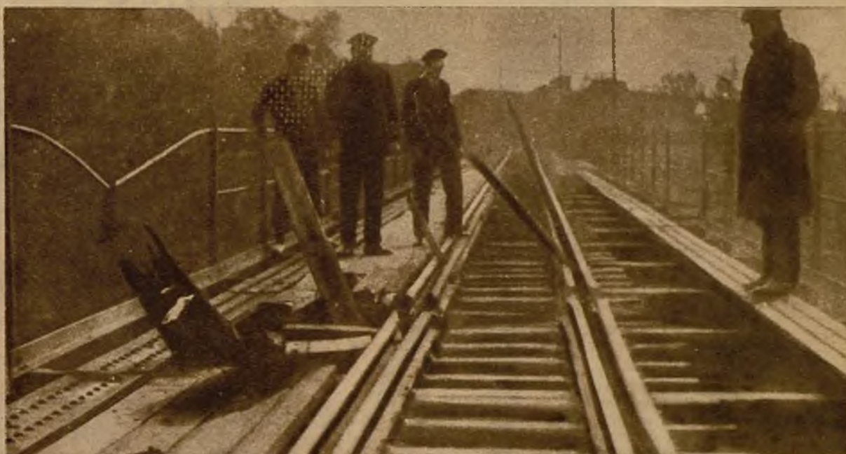
He aquí un detalle de los desperfectos ocasionados por los revolucionarios durante los pasados sucesos en el puente del ferrocarril Manresa-Soria

Como medida de precaución ante la huelga, que, efectivamente, se produjo, en las afueras de Sevilla eran ocultos los transeúntes