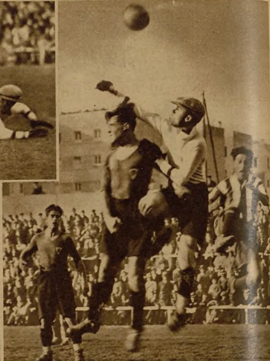
El segundo tanto atlético fué logrado por una jugada desafortunada de la defensa murcilana, que metió el balón en su propia meta