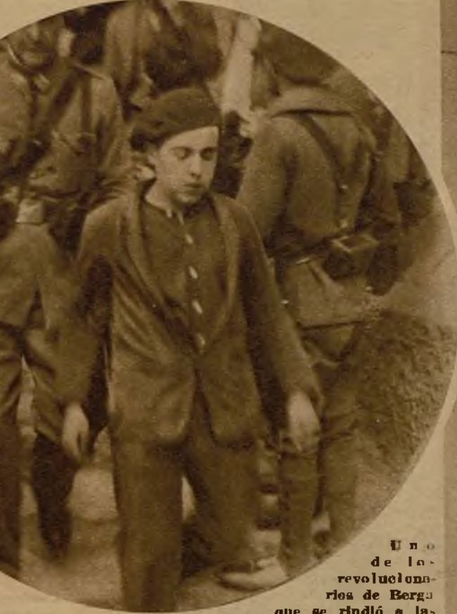
Uno de los revolucionarios de Berga que se rindió a las fuerzas del Ejército, durante su conducción a la cárcel.