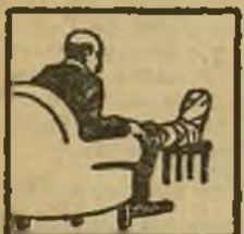
Gota - Dolores