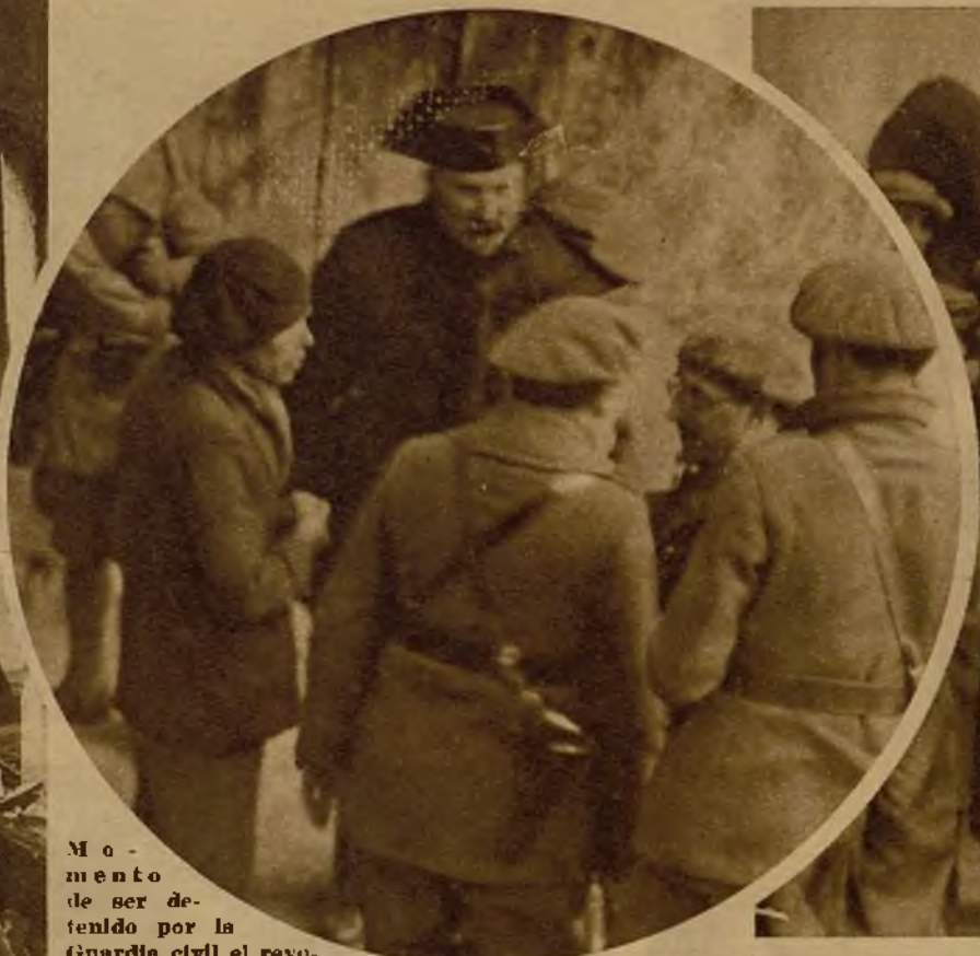
Momento de ser detenido por la Guardia civil el revolucionario que arrojó bombas sobre la fuerza en el pueblo de Berga.