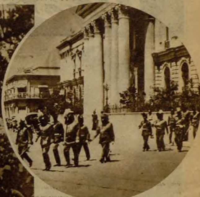
Una vista del palacio presidencial de San Salvador