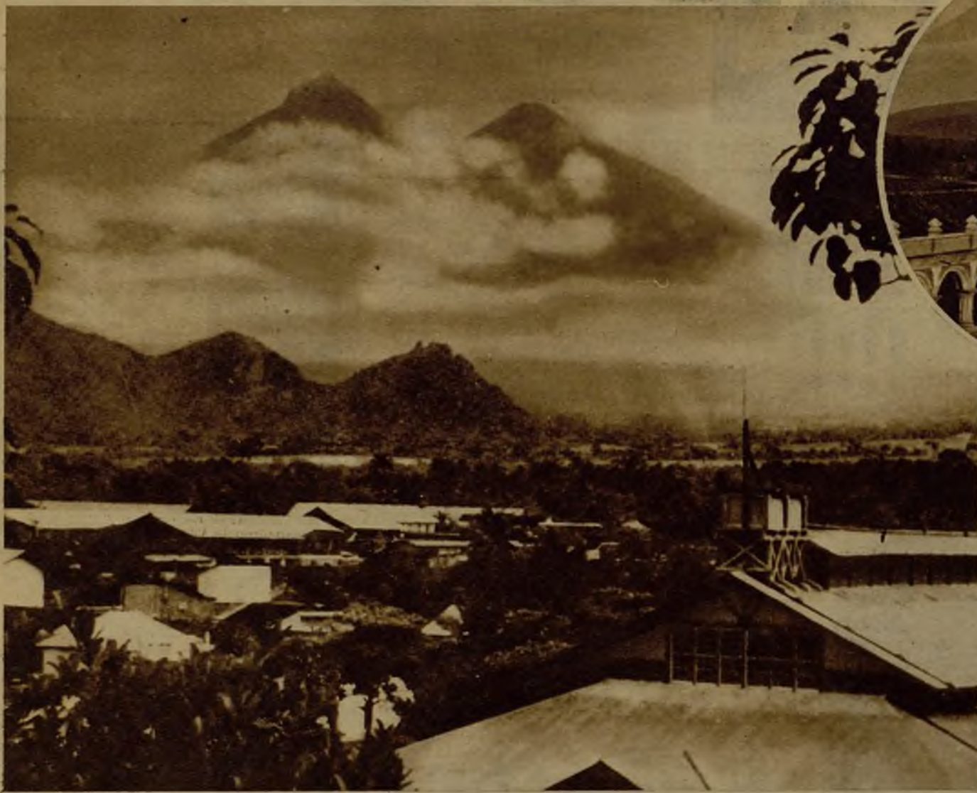
Palacio de los capitanes generales de Guatemala antigua, una de las más bellas y sólidas construcciones de los reinos en América

La antigua Guatemala, ciudad azotada por terremotos durante el siglo XVIII, fué abandonada casi totalmente por sus moradores, habiéndose fundado la nueva Guatemala en el lugar en que hoy se encuentra, ciudad ya de ciento cincuenta mil habitantes, 36 kilómetros al Norte de la anterior. El valle donde se levantó la antigua es uno de los más bellos del mundo; un verdadero paraíso, si no fuera por los temibles volcanes. Catorce años tenía de fundada la primera ciudad cuando este mismo volcán del Fuego tuvo una formidable erupción, acompañada de terremotos. De uno de los flancos del tercer volcán vecino, el del Agua, se desprendió un terrible torrente, que arrasó la inocente ciudad. Las erupciones de los volcanes del Fuego y Acatenango, actualmente activísimas, son siempre hacia el lado del mar. Los temblores que acompañan a las erupciones destruyen sobre la costa los cultivos y causan grandes daños en los terrenos cultivados.