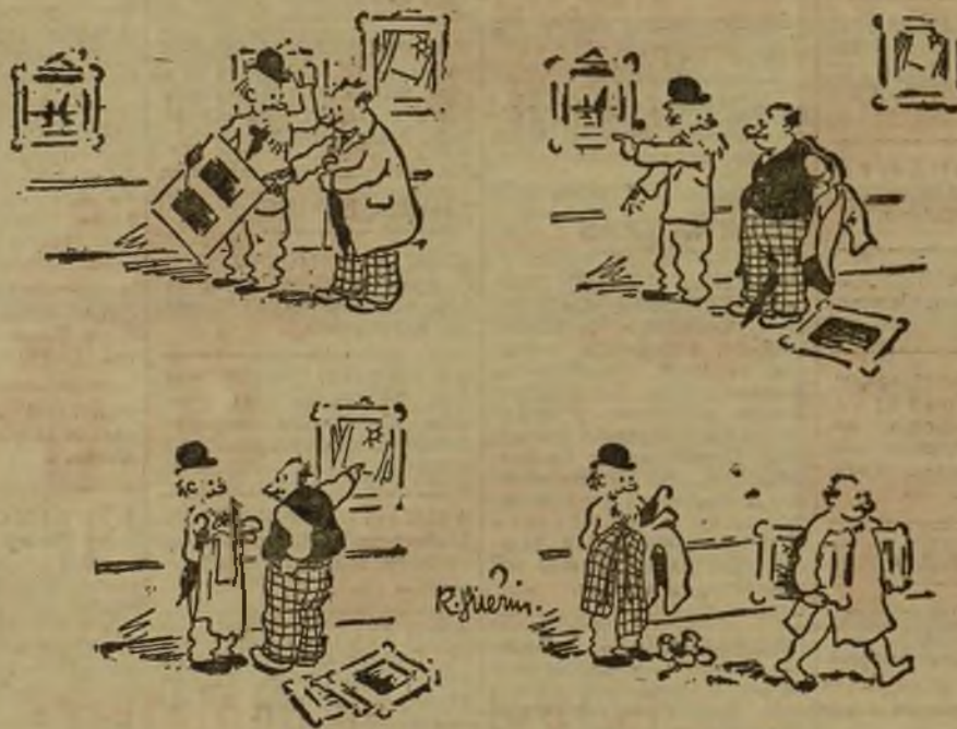
CUADROS POR ROPA VIEJA Y OTRAS ESPECIES

—¡Iré desnudo, pero el arte no puede perecer!