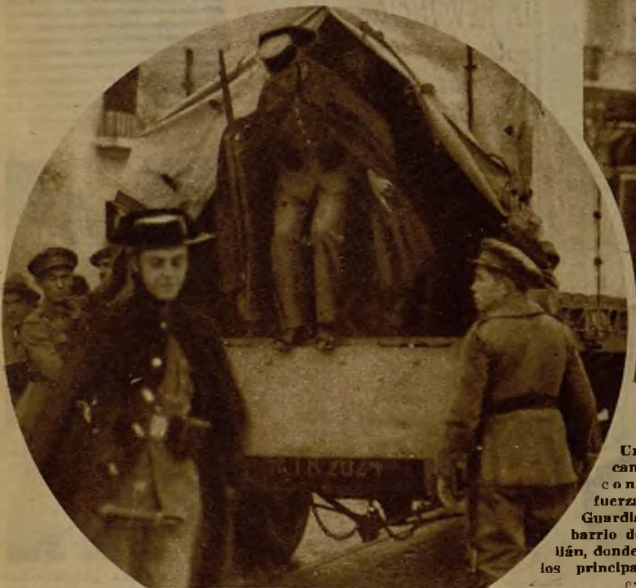
Uno de los camiones que condujeron fuerzas de la Guardia civil al barrio de San Julián, donde se hallan los principales focos extremistas