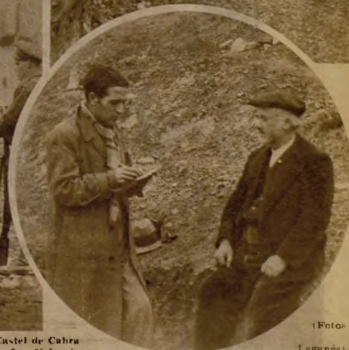
El secretario del Ayuntamiento de Castel de Cabra relata a nuestro enviado especial, señor Valencia Royo, episodios del movimiento