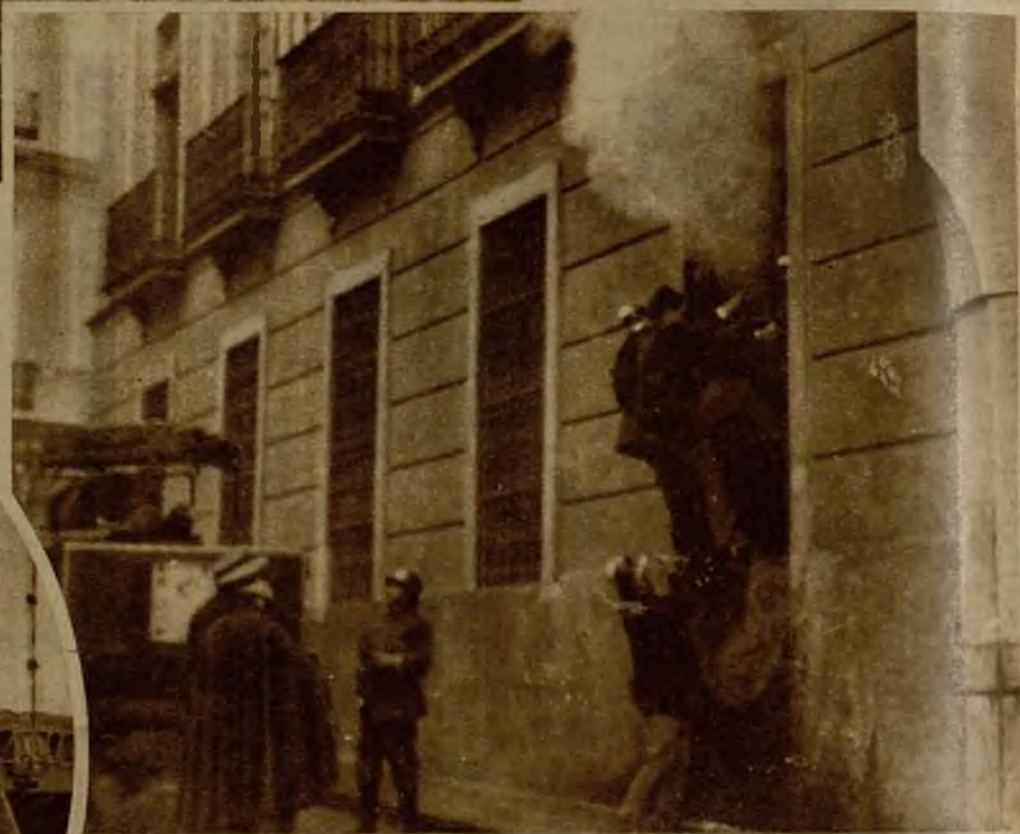
En el edificio de la Audiencia se ha producido un fuego, que, gracias a la inmediata intervención de los bomberos, no ha destruido el edificio. Un momento del siniestro