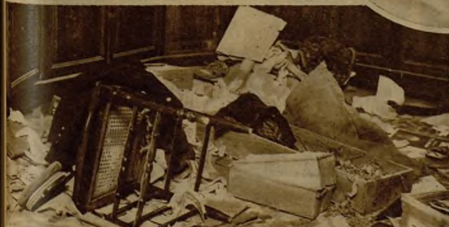
Estado de destrozo en que dejaron los revolucionarios el local del archivo del Juzgado municipal. En círculo, el comunista Alejandro Senón, gravemente herido durante los sucesos