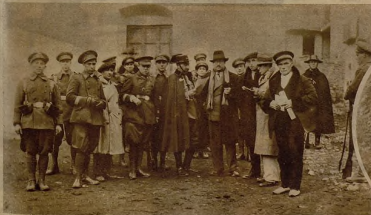
El jefe de la Guardia civil dando cuenta al juez instructor del sumario instruido con motivo de los sucesos, de las diligencias realizadas y de la filiación de los treinta y cinco detenidos