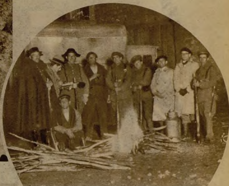
Patrullas de la Guardia civil se situaron a la entrada de Castel de Cabra, donde exigían a quienes circulaban el salvoconducto expedido por el gobernador civil