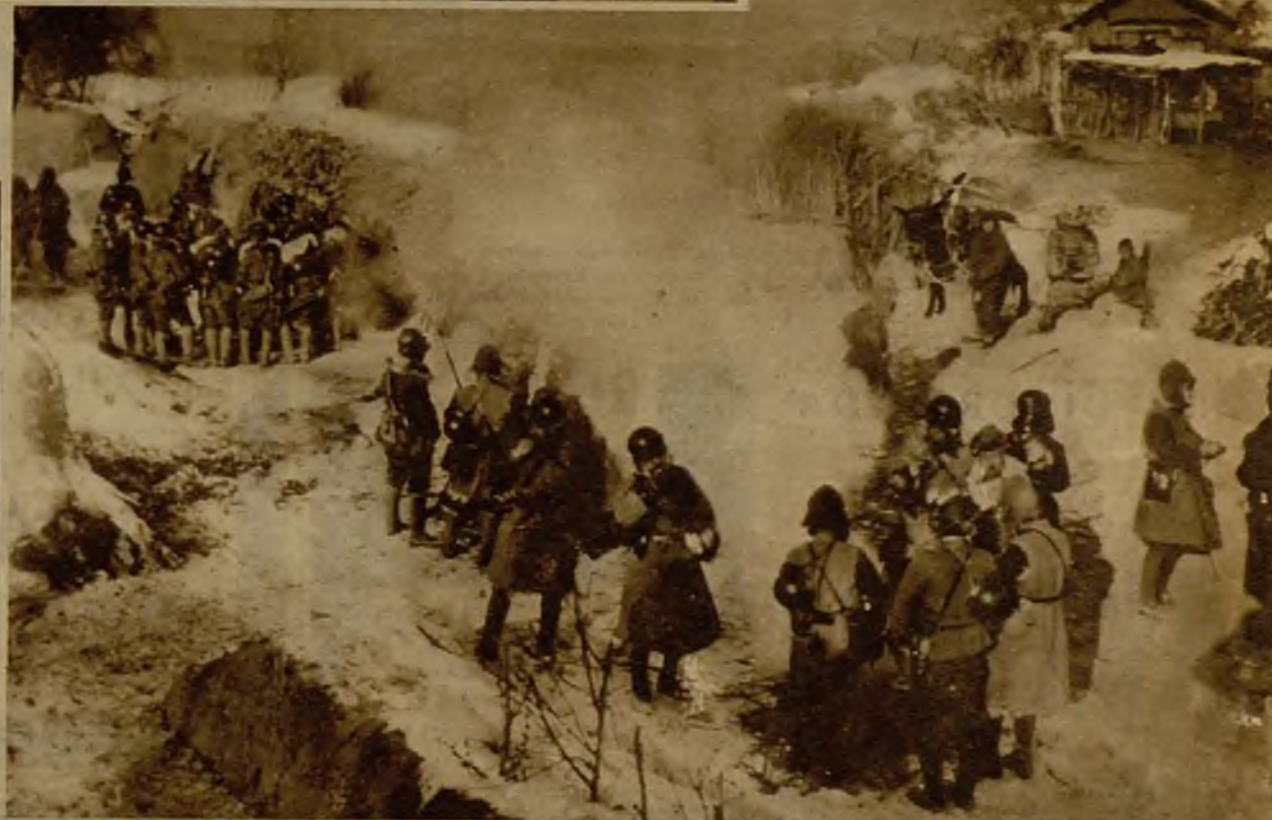
Tropas japonesas descansando después de un sangriento combate con los guerrilleros chinos, cerca de Holmmin