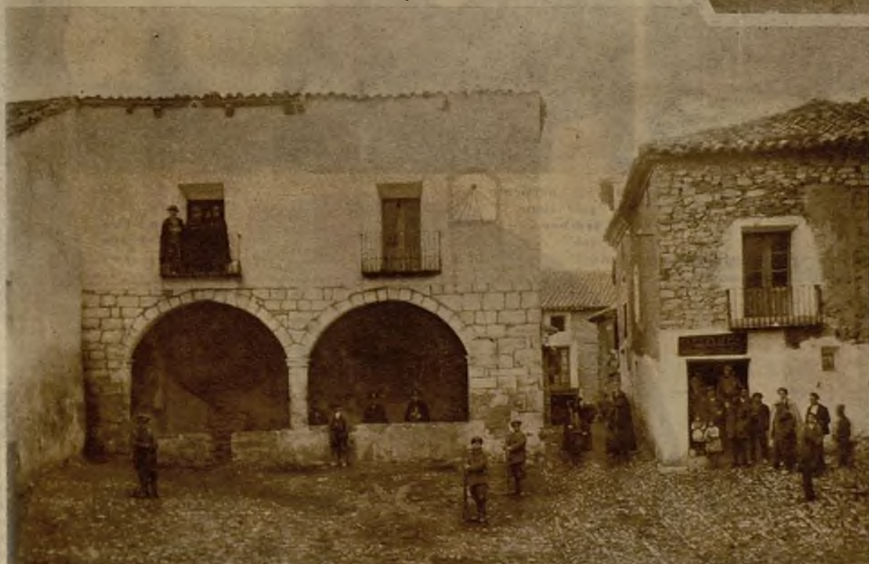
La Casa-Ayuntamiento de Castel de Cabra, que fué tomada por los revolucionarios, y a cuya puerta quemaron los documentos del archivo y la bandera nacional