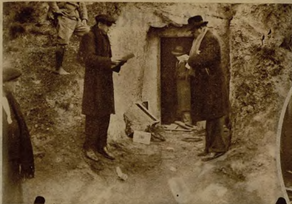
Polvorín de la Compañía de un ferrocarril en construcción en Castel de Cabra, del que los revoltosos se llevaron gran cantidad de dinamita. En la foto aparece el juez instructor durante una inspección ocular