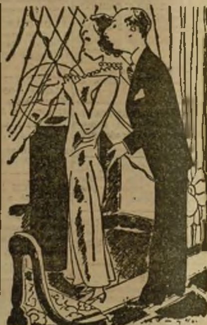
DESPUES DE LA BODA

—¡Iré desnudo, pero el arte no puede perecer!