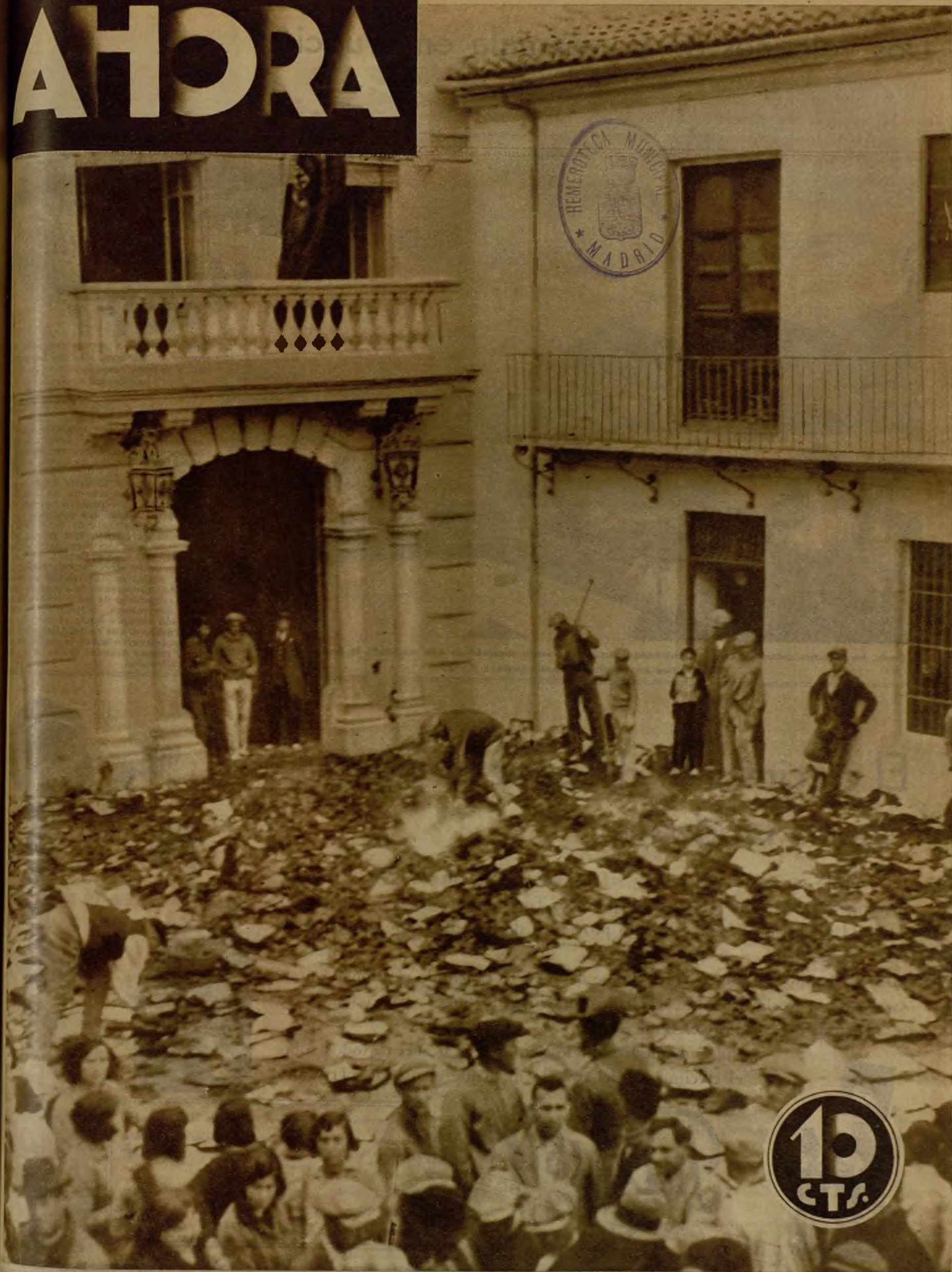
LOS DESORDENES REVOLUCIONARIOS DE SOLLANA (VALENCIA).—Uno de los pueblos en que los elementos extremistas sorprendieron al vecindario pacífico, dando por proclamada la revolución social, fué Sollana. Las turbas asaltaron el Ayuntamiento, donde también se halla instalado el Juzgado Municipal, y quemaron los documentos del Archivo en plena plaza pública, que ofrecía, tras la revuelta, el aspecto que refleja la foto