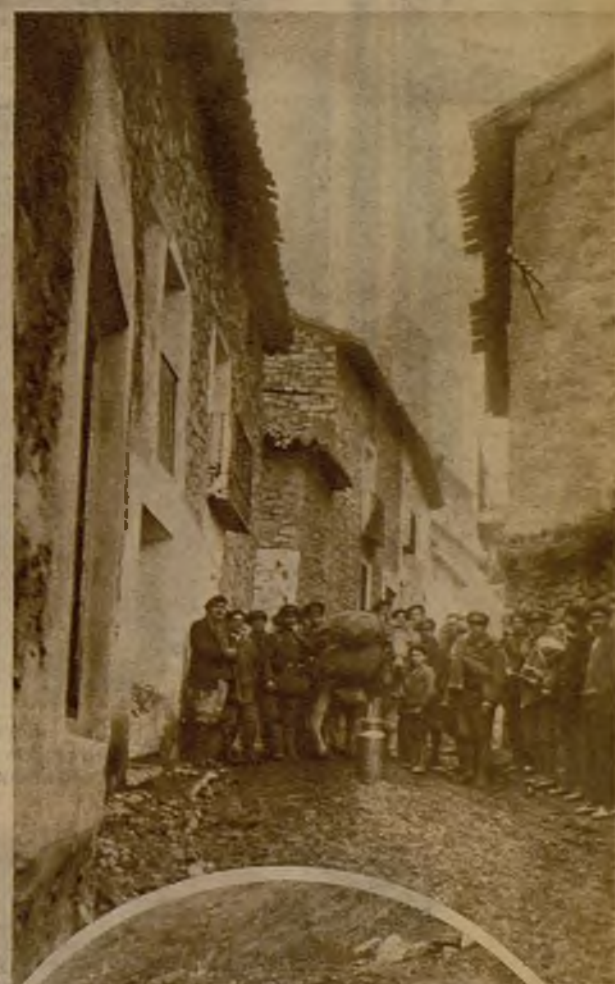
Grupos de soldados en servicio de vigilancia en las calles de Castel de Cabra, poco después de su llegada a la población