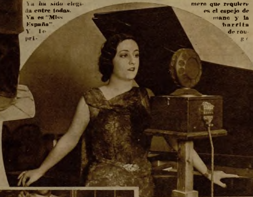
merno que requiere es el espejo de mano y la barrita de rou-