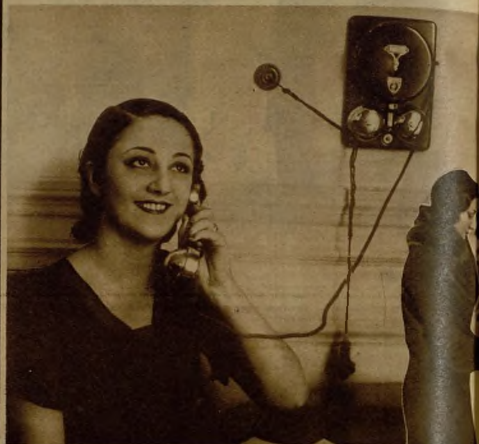
Ni un momento de paz tiene el timbre del teléfono. Y a