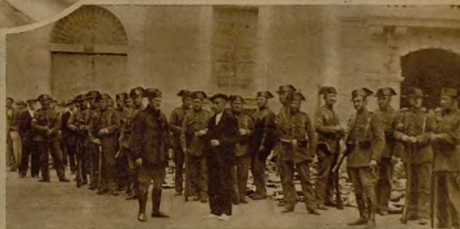
Las fuerzas de la Guardia civil que llegaron apresuradamente desde Valencia y que a su llegada a Sollana redujeron a los revoltosos y restablecieron la paz pública