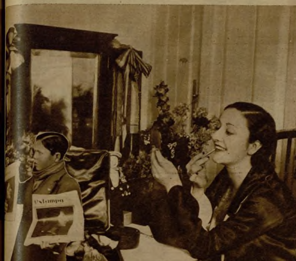
Ya ha sido elegida entre todas. Ya es "Miss España". Y lo pri-