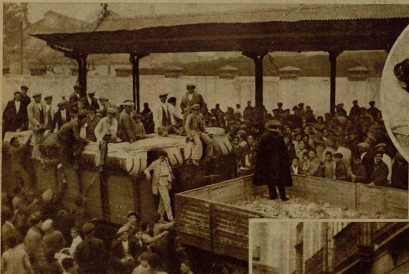
Momento de llegar a Sevilla uno de los trenes de Alcalá de Guadaira conduciendo pan, del que tanto se escasea con motivo de la huelga. El público espera ansiosamente la llegada de los panaderos