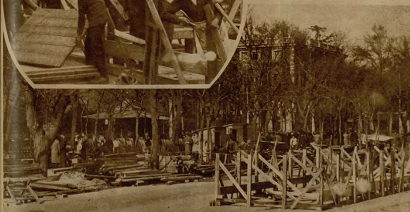
En el paseo de la Castellana se efectúan los preparativos, en cumplimiento de acuerdo municipal, para la celebración de los carnavales. He aquí dos fotos, que representan la instalación de las tribunas en la bella avenida