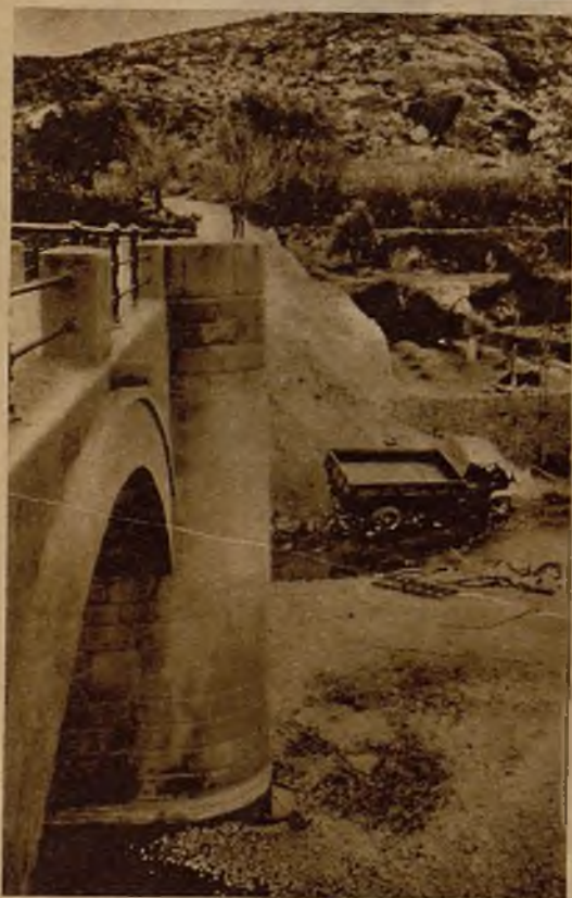
Estado en que quedó un camión militar que conducía tropas a Torre del Compte (Ternel) y volcó por un puente. Resultaron dos oficiales y doce soldados heridos