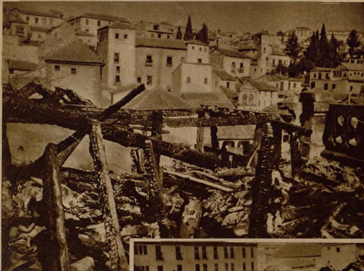
Vista de los destrozos ocasionados por un incendio en el viejo palacio de la Chancillería, en Granada