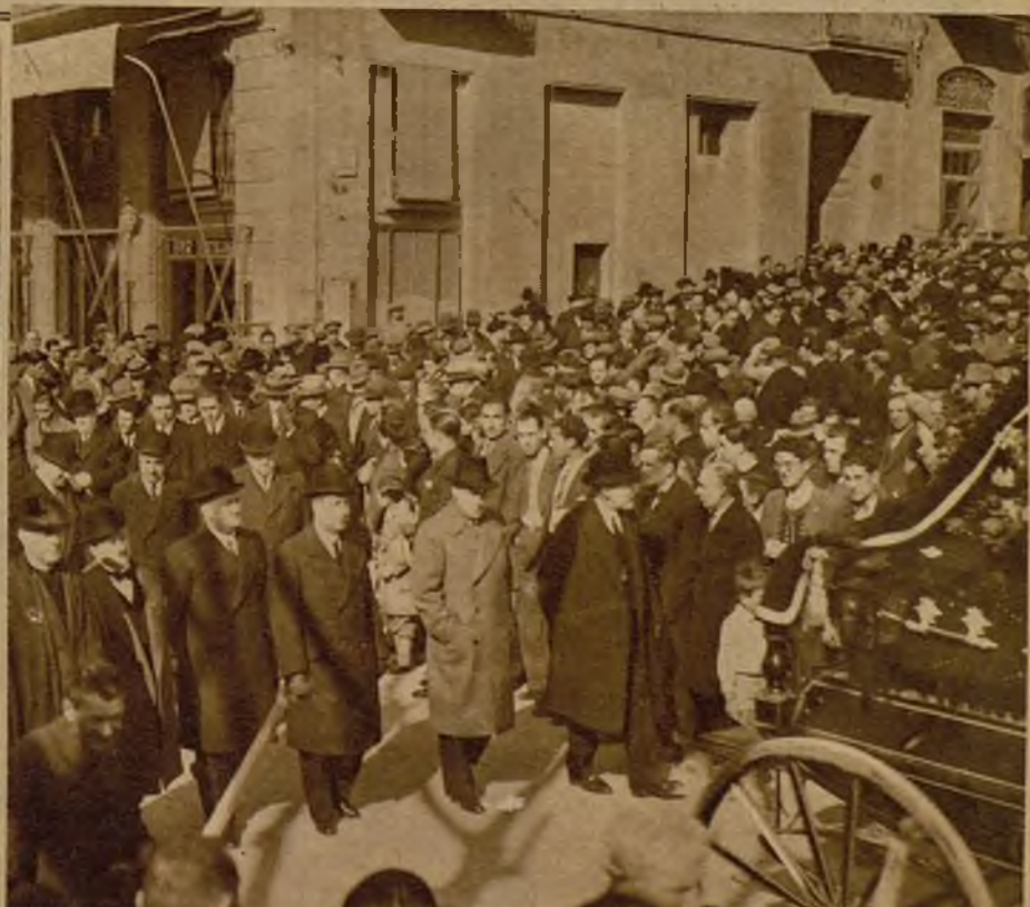
Presidencia del duelo en el traslado al cementerio del cadáver del señor Guasch. La muerte del destacado político ha producido penosísima impresión en la provincia, cuya dirección llevó el fallecido gran número de años