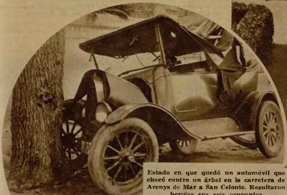
Estado en que quedó un automóvil que chocó contra un árbol en la carretera de Arenys de Mar a San Celoni. Resultaron heridos sus seis ocupantes