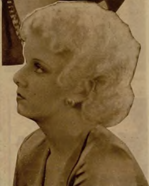
Loreta Young, triunfadora eterna en la pantalla