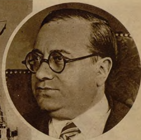
El ilustre escritor don Luis Araquistain, que ha sido nombrado por el Gobierno embajador de la República en Berlín

El vapor "Buenos Aires", que ha zarpado del puerto de Barcelona, con rumbo a Bala, donde dejará, deportados, a los acusados con motivo de los sucesos revolucionarios de la cuenca del Llobregat. La medida ha dado lugar en el Congreso a un acalorado debate