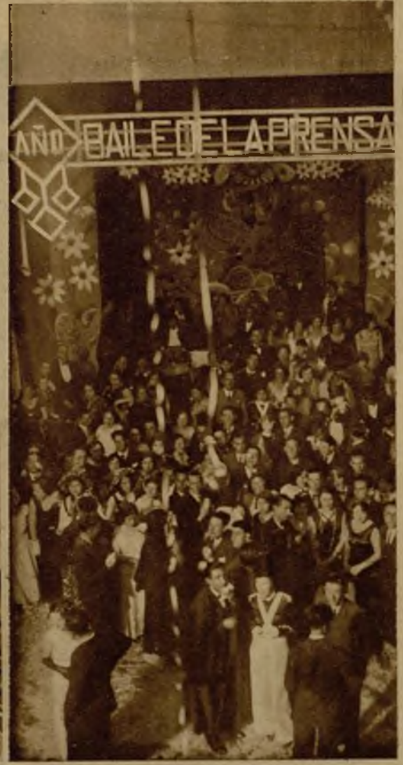
Una vista parcial del salón durante el baile celebrado a beneficio de la Asociación de la Prensa de Melilla