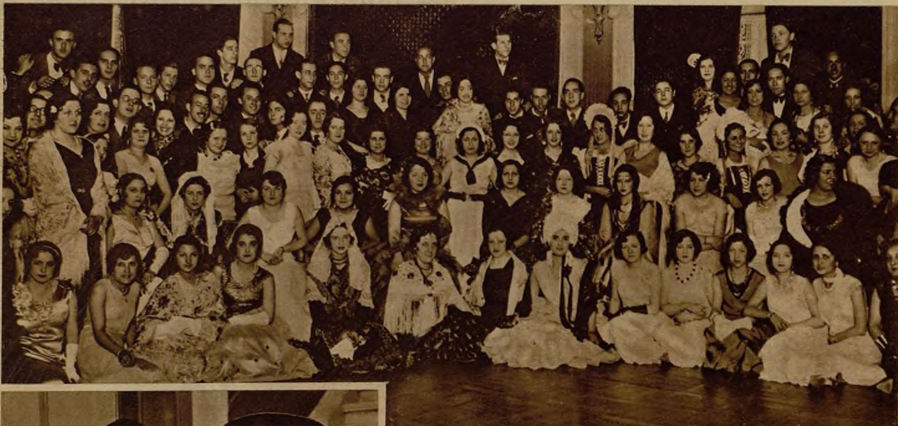
Grupo de bellísimas señoritas luciendo elegantes y caprichosos disfraces, que animaron con su presencia el baile de Carnaval organizado por los estudiantes de Medicina