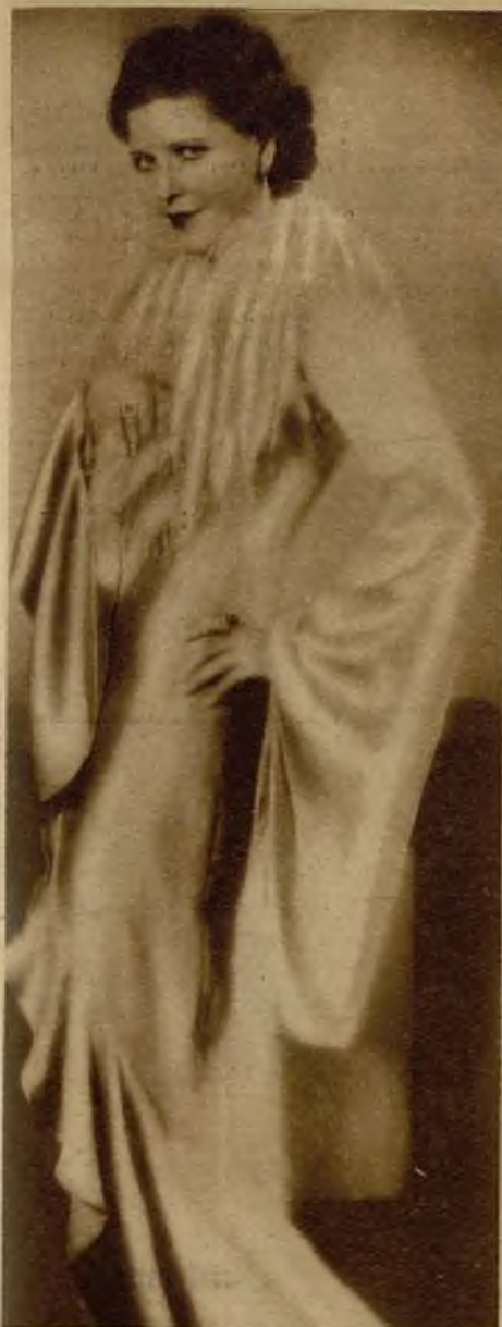
Liane Haid en "El secretario de madame"