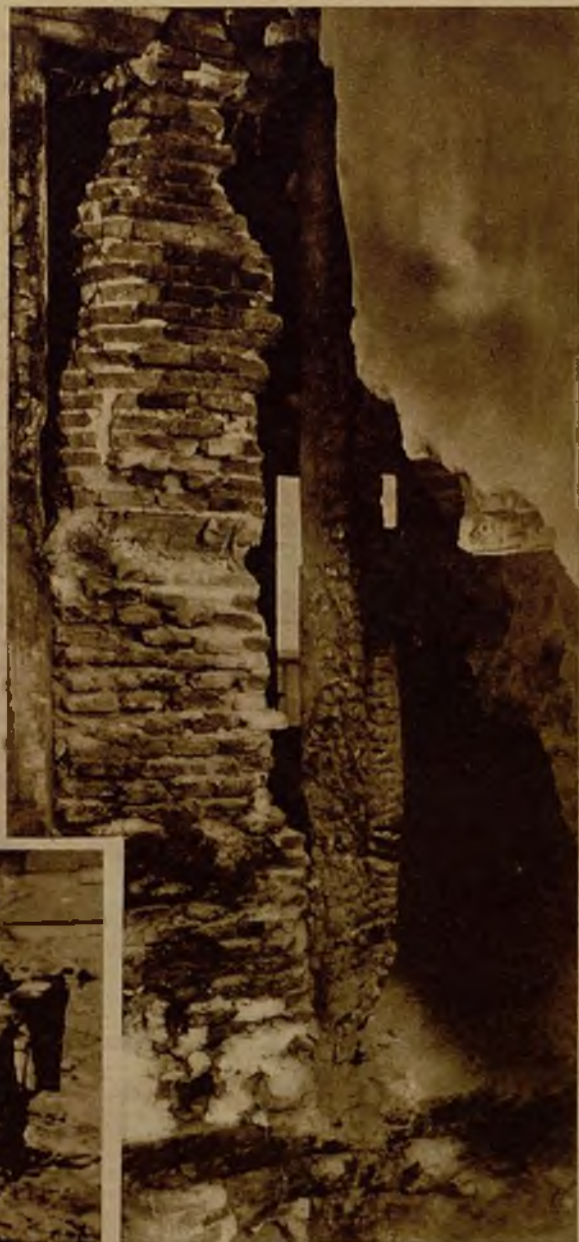
Un aspecto parcial de las ruinas producidas por el fuego en el palacio de la Chancillería, de Granada, obra de Juan de Herrera