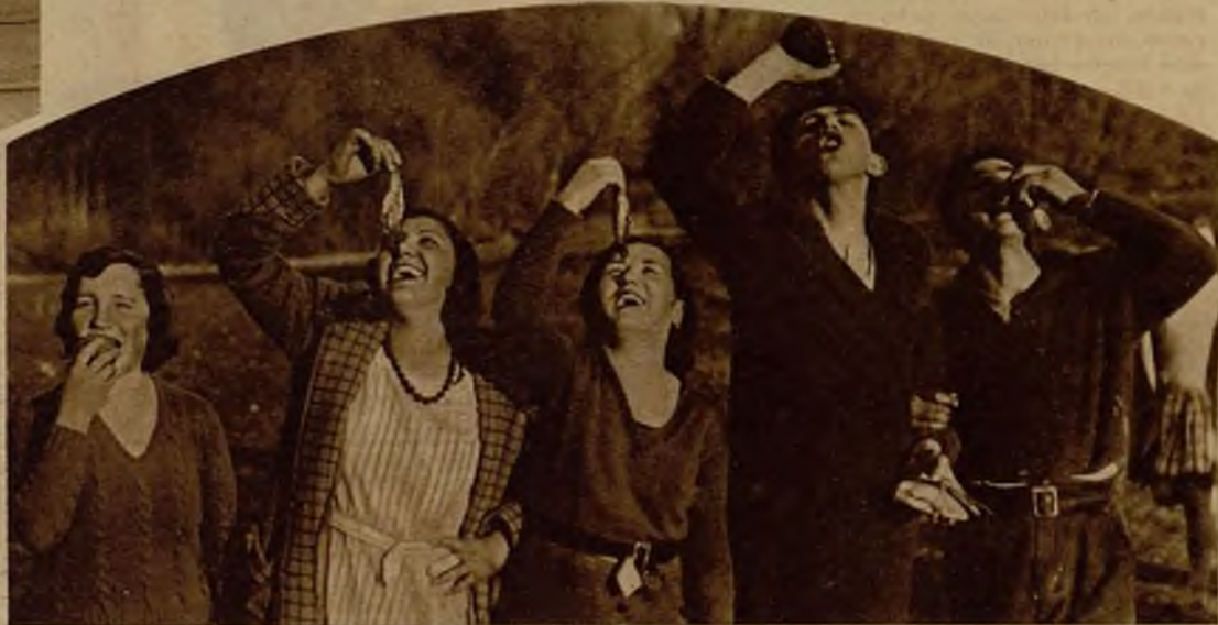
Unos "castizos" que no han olvidado la fiesta típica del "entierro de la sardina". Un agradable rato, una buena merienda, unos tragos del tinto de la tierra... y se ha cumplido, además, con la tradición