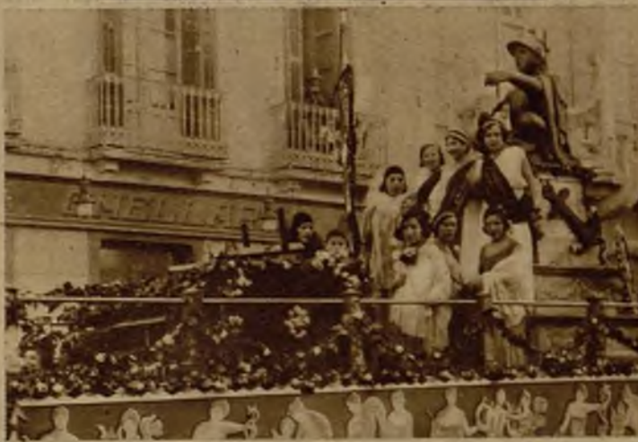
Carroza presentada por la Unión Gremial, que ganó el primer premio. En el círculo, la magnífica carroza presentada fuera de concurso por el Ayuntamiento, tripulada por "Miss Melilla" y sus compañeras de competición