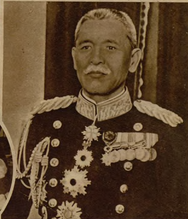
El ex ministro de Hacienda japonés Ynuye, que ha fallecido víctima de un atentado en Tokio. El autor del asesinato ha sido detenido