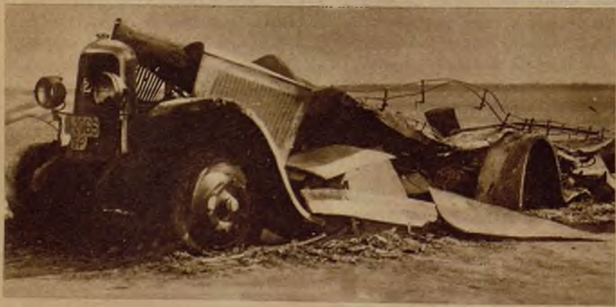
Estado de destrozo en que quedó un camión de viajeros en Cuellar (Valladolid) por explosión del depósito de gasolina. A consecuencia del accidente sufrieron lesiones tres viajeros. Algunos trozos del coche fueron despedidos a más de quince metros