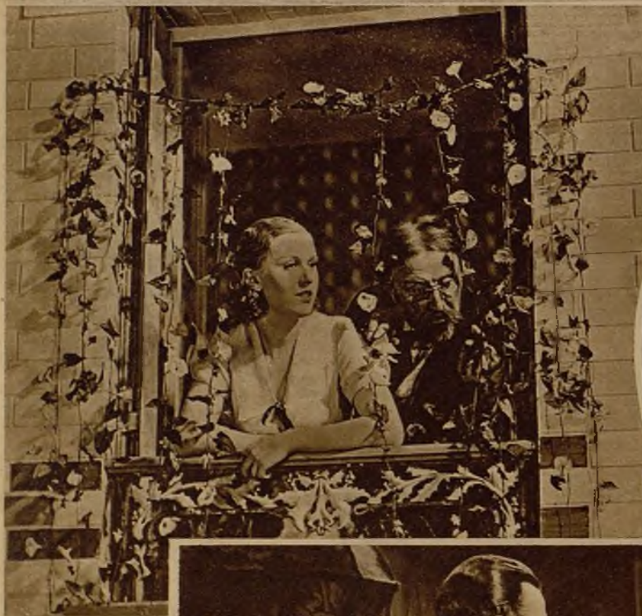
René Clair, el director vanguardista, ha trazado este momento para "Viva la libertad!", su más acabado rasgo de humorismo