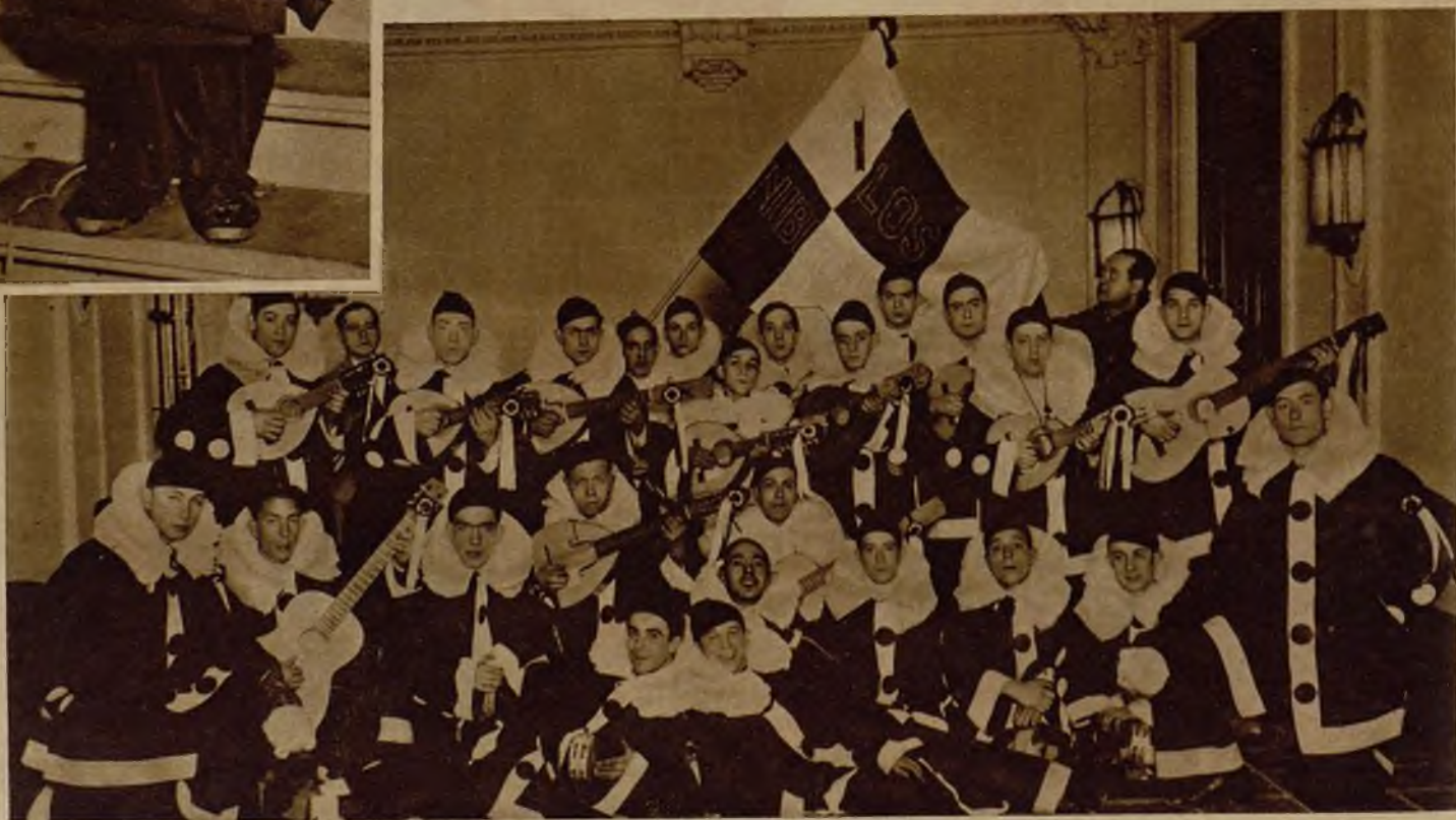
La notable estudiantina de la Sociedad cultural "Los Nibelungos", que visitaron la casa de AHORA y nos agasajaron con un brillante concierto. Esta formación ha sido una de las más destacadas entre las que figuraron en el Carnaval madrileño