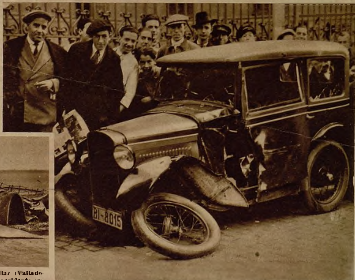
Un automóvil que en la calle del Barquillo fue atropellado por un camión que bajaba lanzado por la calle de San Marcos